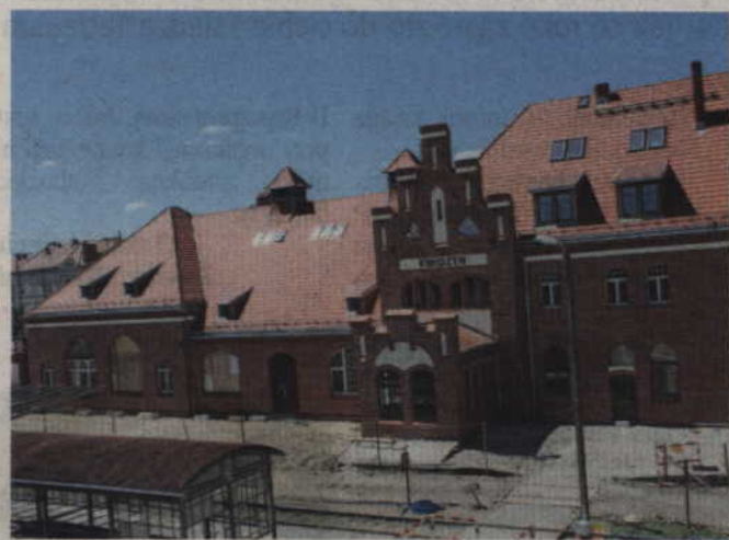
Trwa modernizacja budynku dworca PKP.

KWIDZYN. Trwa modernizacja budynku dworca PKP. Wewnątrz obiektu prowadzone są prace wykończeniowe. Inwestycja, jak zapewnia wiceburmistrz Piotr Halagiera, przebiega zgodnie z planem. Jednocześnie prowadzona jest budowa tzw. węzła integracyjnego, w ramach którego powstają nowe parkingi.