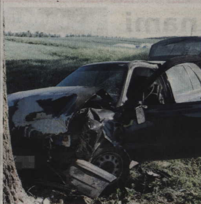
Kierowca stracił panowanie nad autem i uderzył w przydrożne drzewo.

GARDEJA. Kierujący volkswagenem uderzył w przydrożne drzewo na ulicy Iławskiej w Gardei. Siedzący za kierownicą 25-latek, z ogólnymi obrażeniami ciała, trafił do szpitala. Badanie alkomatem wykazało, że podczas wypadku był trzeźwy.