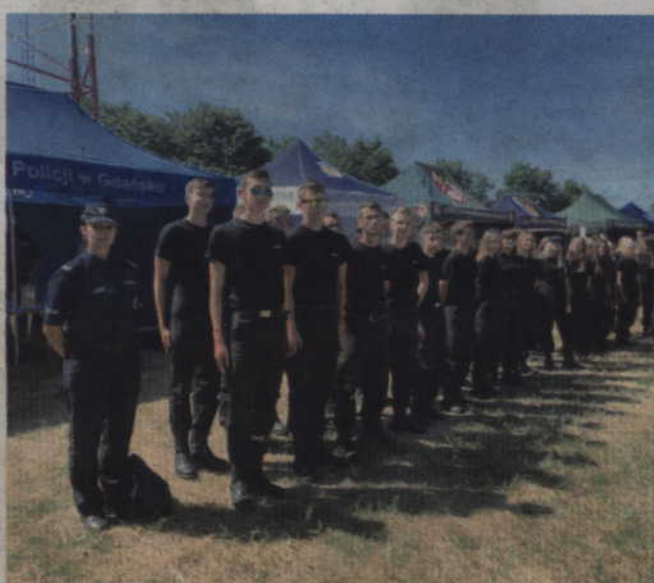
Już po raz kolejny uczniowie ZSO nr 2 w Kwidzynie uczestniczyli w Pomorskim Dniu Otwartym dla klas o profilu policyjnym.

Partnerami wydarzenia byli: 49. Baza Lotnicza z Pruszcza Gdańskiego, Żandarmeria Wojskowa, Wojskowa Komenda Uzupełnień, Straż Graniczna, Państwowa Straż Pożarna, Samodzielny Pododdział Antyterrorystyczny Policji, Oddział Prewencji Policji, Laboratorium Kryminalistyczne KWP w