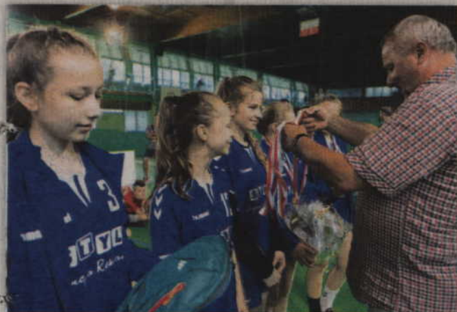
Szczypiornistki z Gardei - brązowe medalistki mistrzostw Polski.