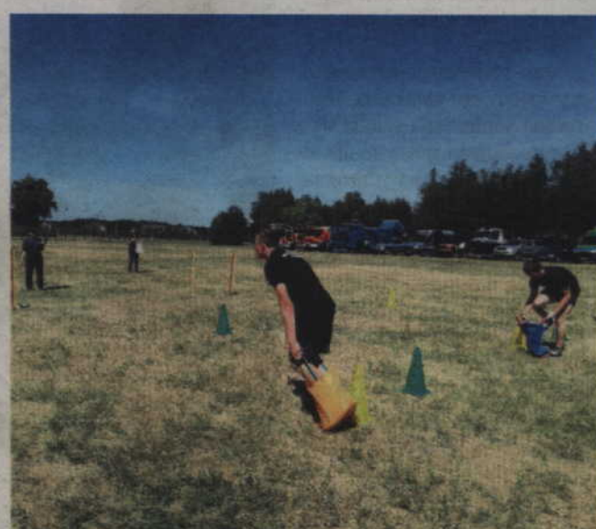
Podczas festynu kwidzyńskiego rywalizowali m.in. w konkurencji sportowej.

Marynarki Wojennej w Gdyni, Wyższa Szkoła Bankowa w Gdańsku, Wyższa Szkoła Administracji i Biznesu, Pomor-