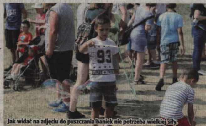
Jak widać na zdjęciu do puszczania baniek nie potrzeba wielkiej siły.