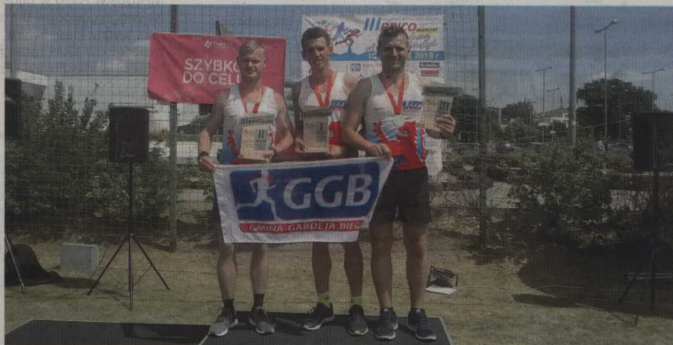
Zawodnicy z zespołu Gmina Gardeja Biega start w Iławie zaliczyli do bardzo udanych.