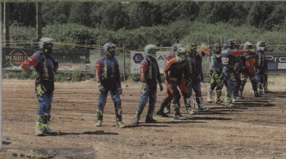
Start klasy Senior 1 w mrągowskich Mistrzostwach Polski.

Start kwidzyńskich zawodników w ostatniej, V i VI rundzie Mistrzostw Polski w rajdach cross-country był bardzo udany, choć tor w Mrągowie okazał się prawdziwym polem bitwy. Podczas startów motocykliści Kwidzyńskiego Klubu Motorowego musieli zmagać się z licznymi zakrętami, a także kilkoma skokami. Ze względu na