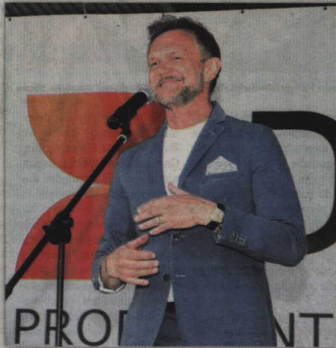
Podczas występu Czarek Pazura nikt się nie nudził.

życia w historii każdego pracownika, który w tej firmie pracuje. To również okres dynamicznego rozwoju fabryki. Nie będę próbował opowiadać co się działo w tej fabryce