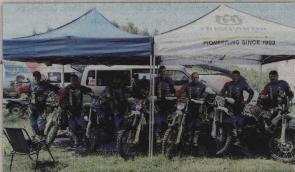
Zawodnicy KKM Kwidzyn wskoczyli na fotel lidera klasyfikacji klubowej mistrzostw Polski.

Start kwidzyńskich zawodników w ostatniej, V i VI rundzie Mistrzostw Polski w rajdach cross-country był bardzo udany, choć tor w Mrągowie okazał się prawdziwym polem bitwy. Podczas startów motocykliści Kwidzyńskiego Klubu Motorowego musieli zmagać się z licznymi zakrętami, a także kilkoma skokami. Ze względu na