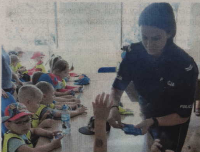
Na pożegnanie dzieci otrzymały od funkcjonariuszki magnesy z numerami alarmowymi.