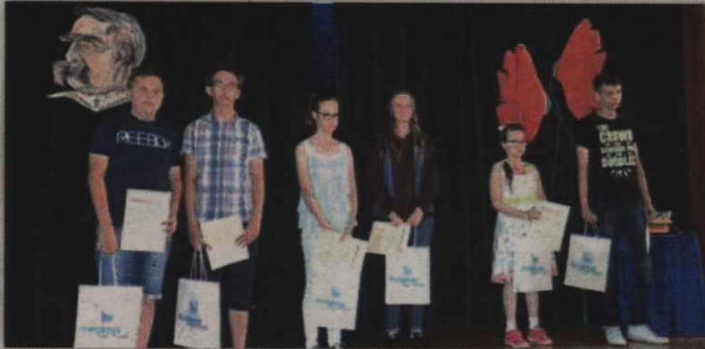
Nagrodzeni w konkursie plastycznym.