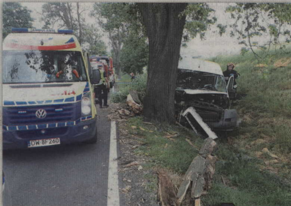
Kierowca stracił panowanie nad autem i uderzył w przydrożne drzewo na trasie Kwidzyn - Gardeja.