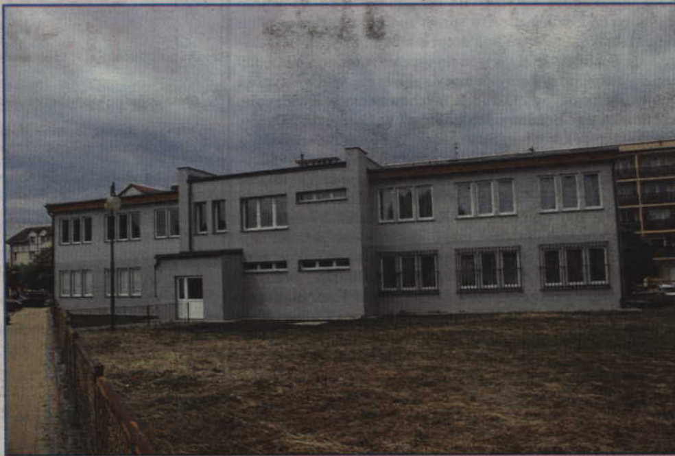
(s) Dobiega końca termomodernizacja budynku przy ul. Odrowskiego 10.

W budynku wymieniona zostanie część grzejników. Obiekt wykorzystywany jest obecnie przez różne organizacje pozarządowe oraz przedszkole niepubliczne. Mimo prowadzenia prac organizacje, które mają swoje siedziby w budynku, działają w nim bez przeszkód.