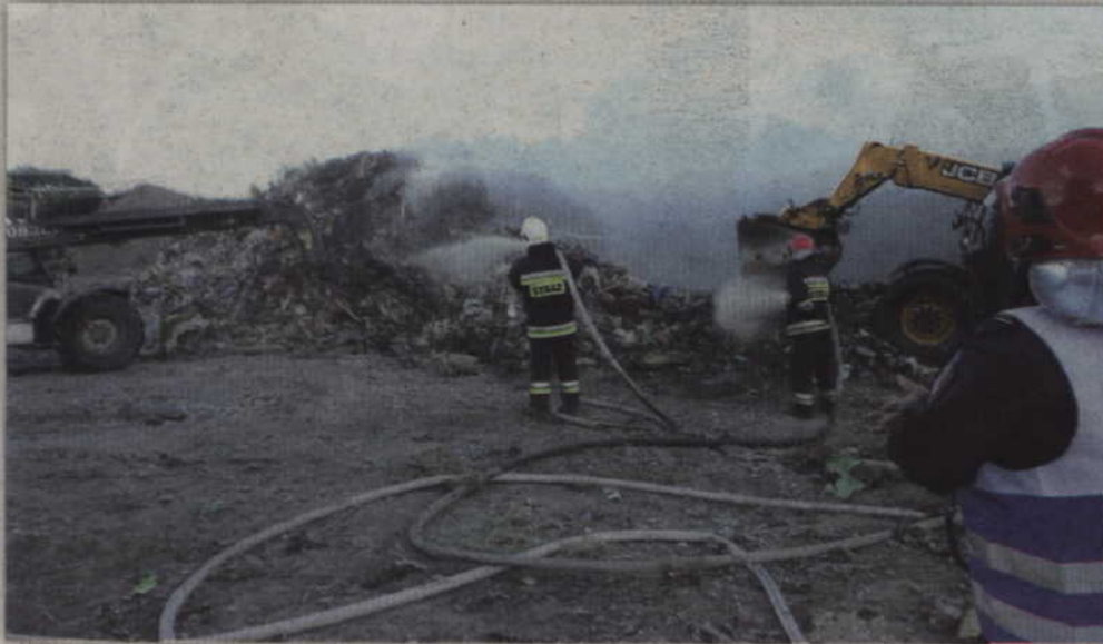
Na terenie Zakładu Utylizacji Odpadów w Gilwie Małej doszło do pożaru odpadów.