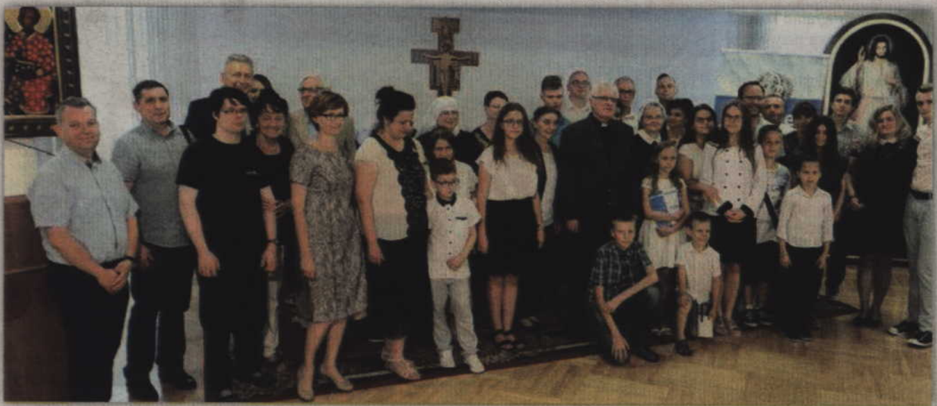
Laureaci, jurorzy oraz organizatorzy konkursu.