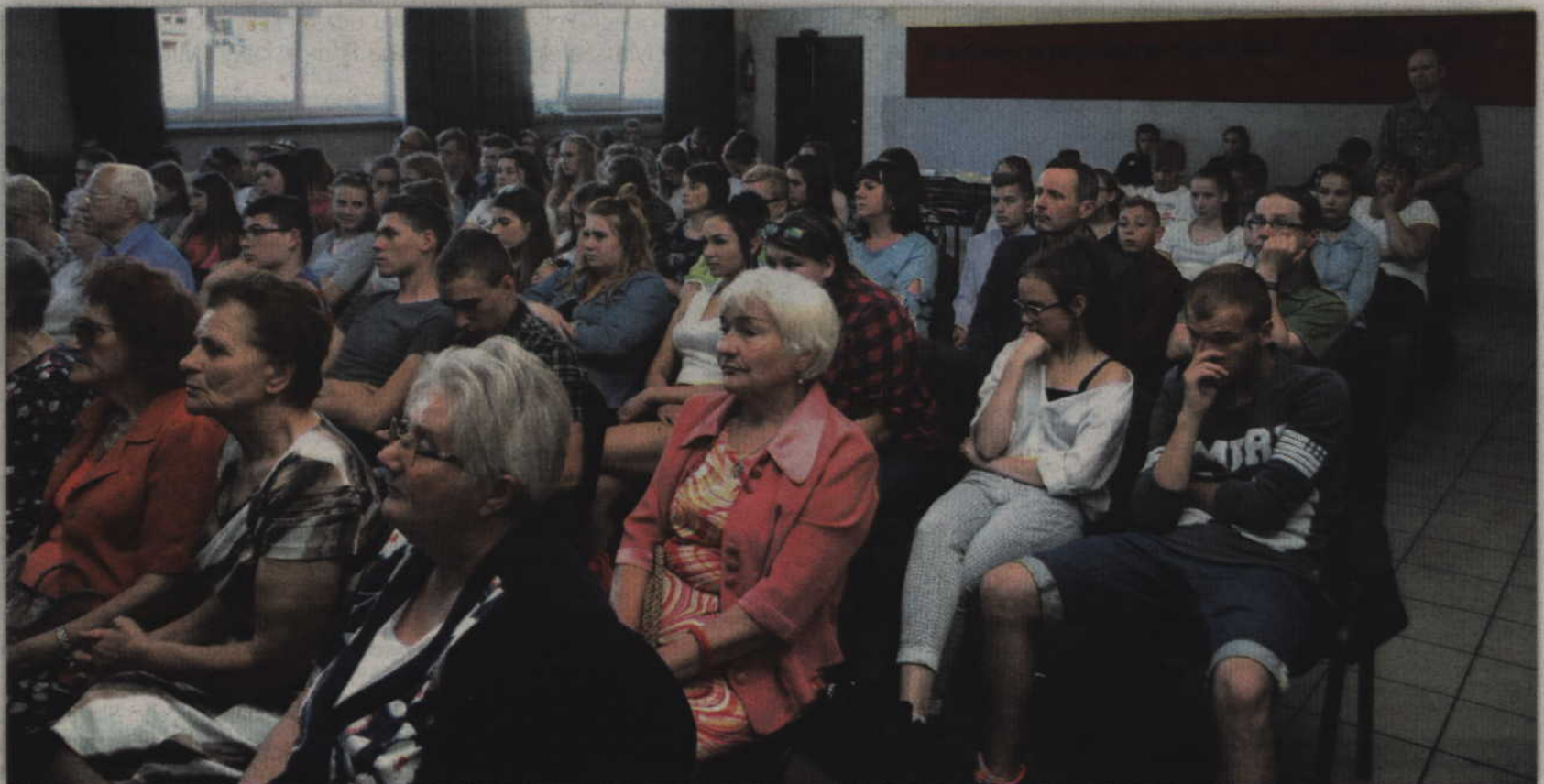
Organizatorzy konferencji nie kryją radości, że w spotkaniach uczestniczy młodzież.