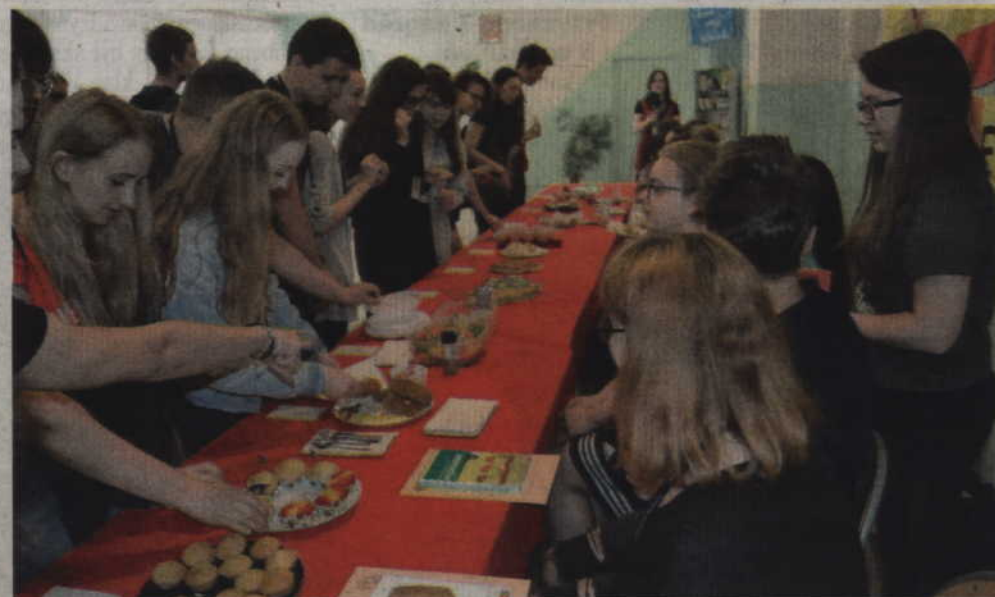
Degustacja potraw hiszpańskich spotkała się z dużym zainteresowaniem społeczności szkolnej.