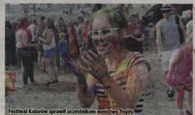
Festiwal Kolorów sprawił uczestnikom mnóstwo frajdy.