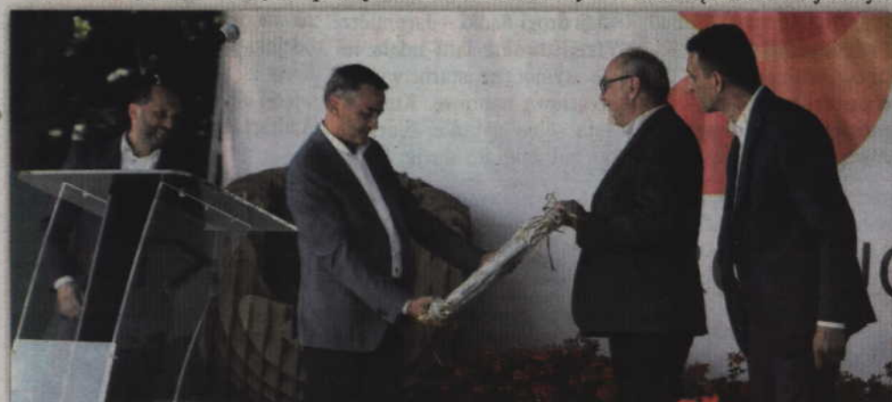
Przedstawiciele władz miasta wręczyli jubilatowi pamiątkowy obraz.