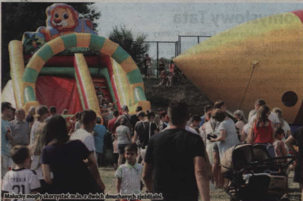
Maluchy mogły skorzystać m.in. z dwóch dmuchanych zjeżdżalni.