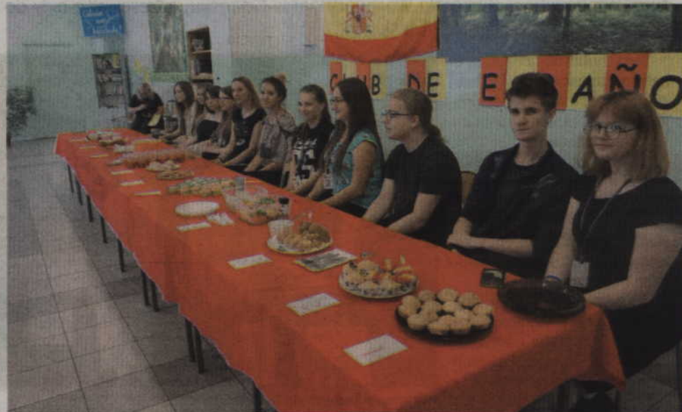
Uczestnicy konkursu kulinarnego przygotowali dziesięć potraw.