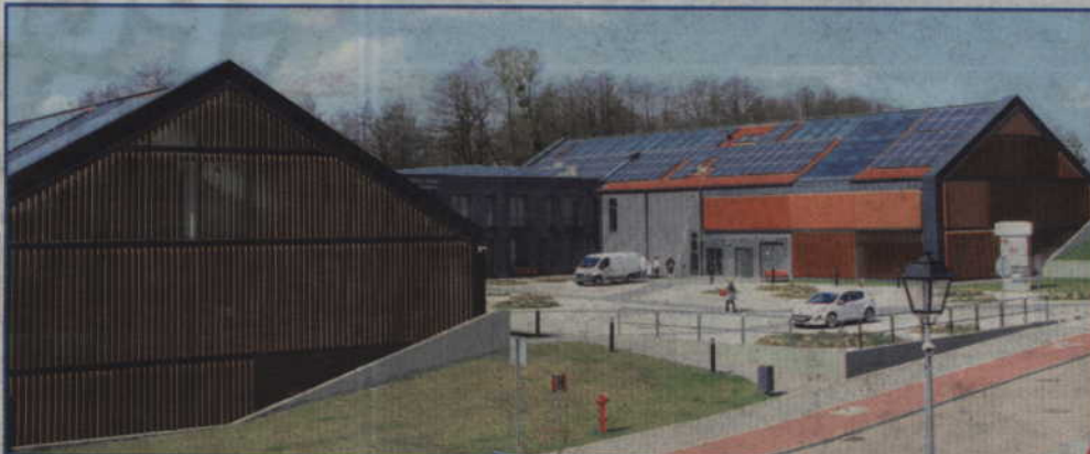
Uroczystość odbędzie się już w najbliższy piątek 15 czerwca o godz. 19.30 w Kwidzyńskim Parku Przemysłowo-Technologicznym w Górkach.

W uroczystości weźmie udział ok. 60 gości z miast partnerskich, w tym z niemieckiego Celle, polskiego Gubina, szwedzkiego Olofström i ukraińskiego Baru.