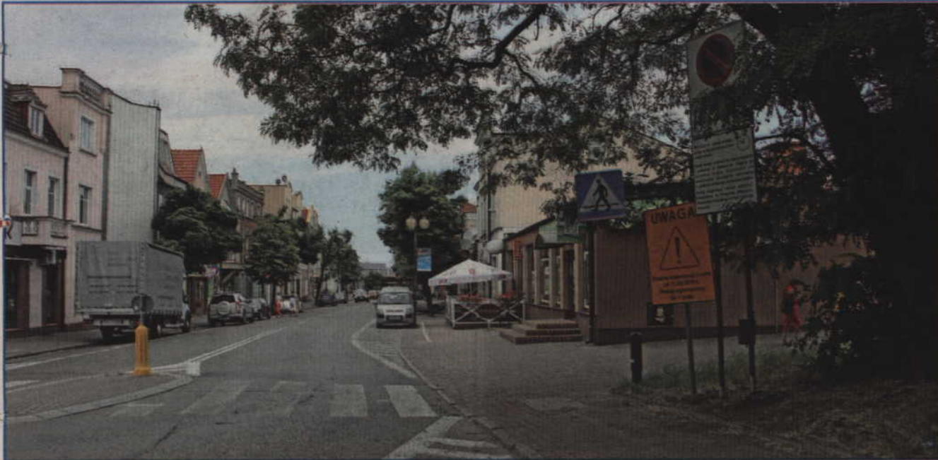
Na odcinku ulicy Targowej od ul. Braterstwa Narodów do budynku nr 26 wprowadzona została strefa ograniczonego postoju.

Na odcinku ulicy Targowej od ul. Braterstwa Narodów do budynku nr 26 wprowadzona została strefa ograniczonego postoju. Ograniczenie w parkowaniu aut obowiązuje od poniedziałku do piątku w godzinach od 10.00 do 17.00. Parkowanie pojazdów wewnątrz strefy jest bezpłatne, jednak ograniczone czasowo do maksymalnie jednej godziny. Ograniczenie nie dotyczy jedynie miejsc postojowych dla osób niepełnosprawnych.