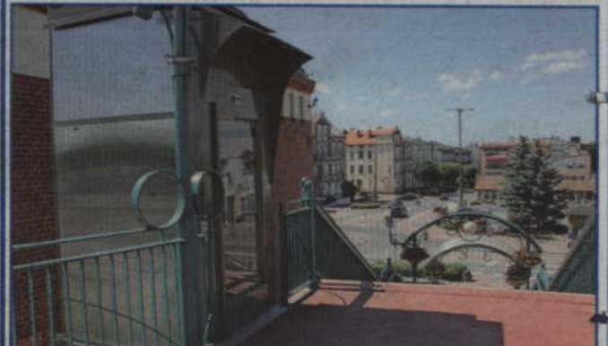
Drgania wywołane przez ciężki sprzęt powodowały awarie wind.

Windy przy kładce dla pieszych nad torami kolejowymi, łączącej ulice Kościuszki i Grunwaldzką, zostały wyłączone. Powodem praca ciężkich maszyn używanych przy wyburzeniu przejścia podziemnego łączącego perony kolejowe.