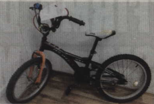
Rower znaleziony został na ul. Toruńskiej.