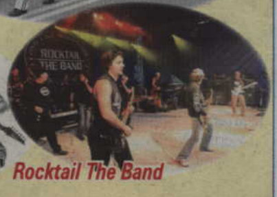
Rocktail The Band