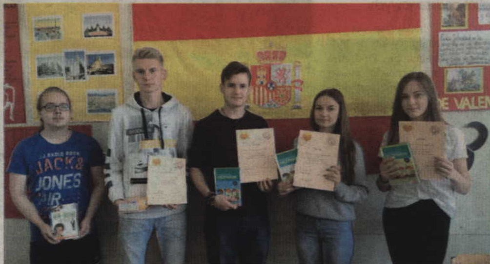
Laureaci konkursowych zmagani z j. hiszpańskim.