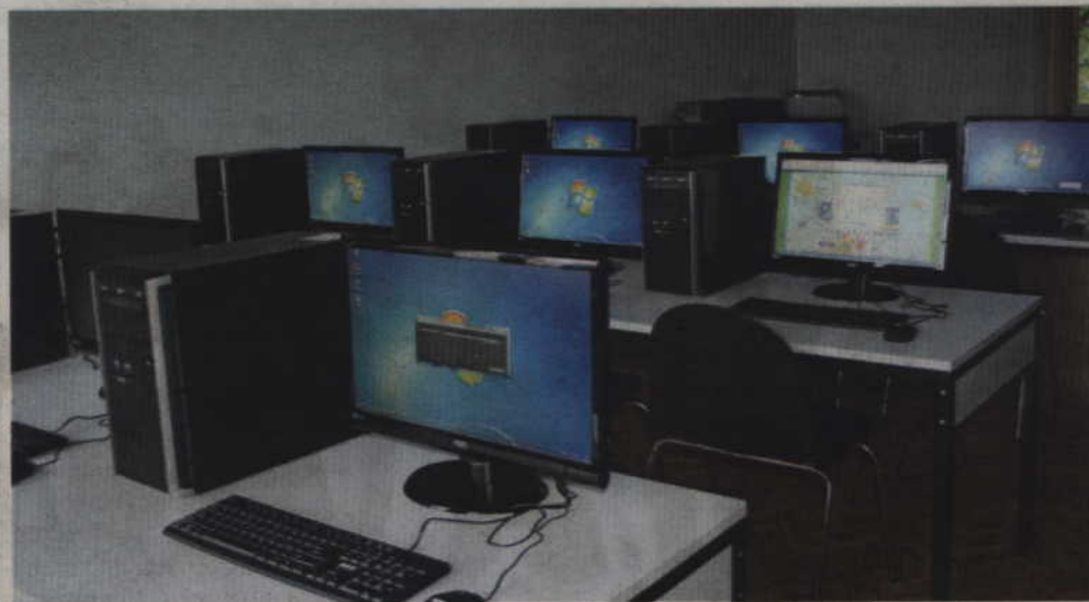
Z końcem marca przyszłego roku zakończy się realizacja programu „Cyfrowy Kwidzyn - przeciwdziałanie wykluczeniu cyfrowemu”.