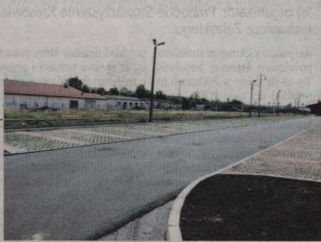
Parking przy dworcu jest już praktycznie zrobiony.

Prace przebiegają zgodnie z harmonogramem. Obecnie prowadzone są prace wykończeniowe wewnątrz budynku dworca. Ich zaawansowanie oceniam na ponad 60 proc. Jednocześnie trwa budowa węzła komunikacyjnego. Parking przy dworcu jest praktycznie