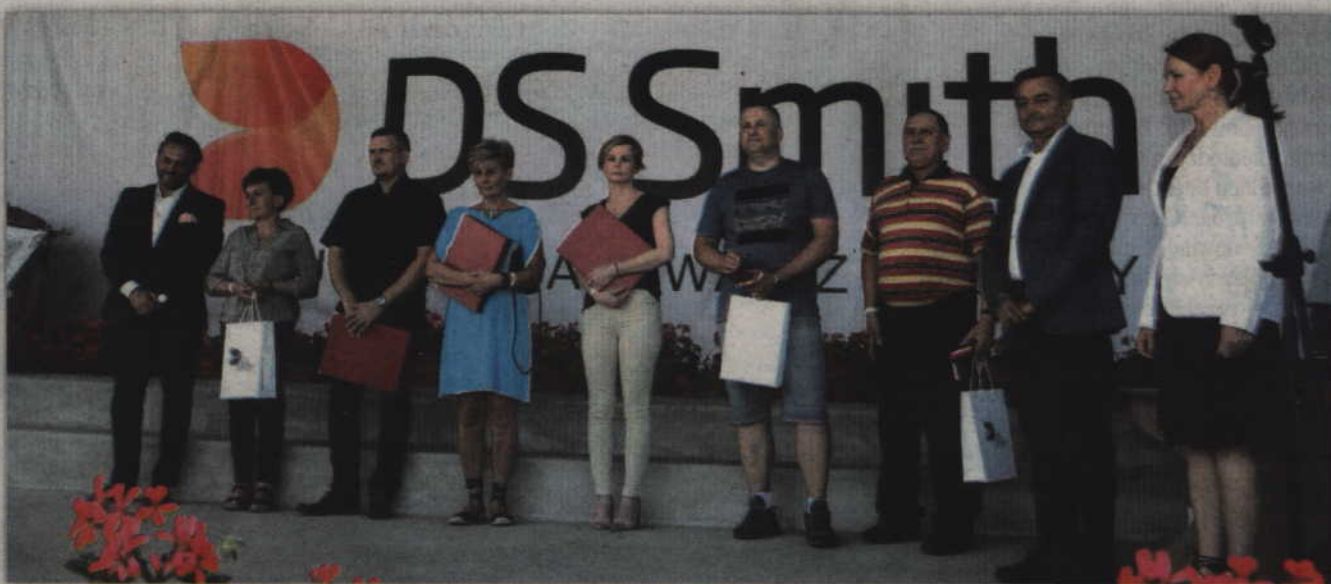
Wyróżnieni pracownicy DS Smith Kwidzyn z najdłuższym stażem pracy.

KWIDZYN. Przed dwiema dekadami w Kwidzynie rozpoczęła działalność firma, która specjalizowała się w produkcji opakowań z tektury falistej. W 2012 została przejęta przez DS Smith i dziś jest wiodącym producentem opakowań dla przemysłu elektronicznego. Aktualnie zatrudnia 60 osób, a swój jubileusz pracownicy tej firmy świętowali na TRW Miłosna.