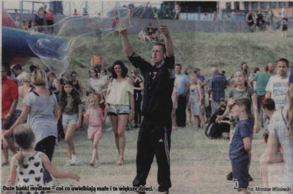
Duże banieki mydlane – coś co uwielbiają małe i te większe dzieci.