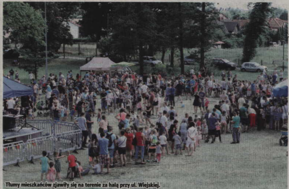
Tłumy mieszkańców zjawili się na terenie za halą przy ul. Wiejskiej.