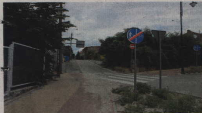
Trwają prace modernizacyjne na ul. Żelaznej. Inwestycję rozpoczęto od prac ziemnych.