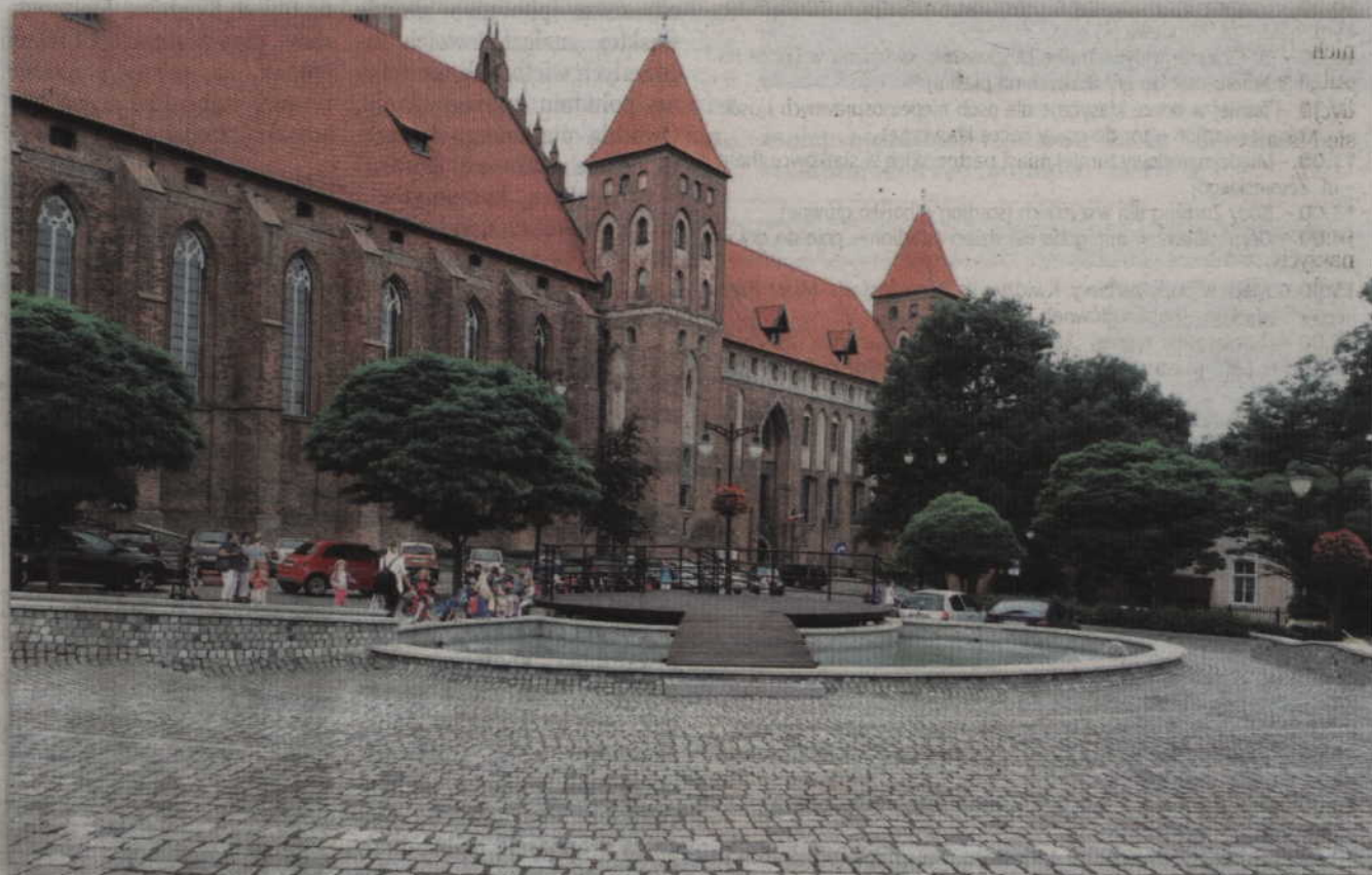
Jednym z projektów jest rozbudowa i zadaszenie sceny oraz montaż ławek dla widzów na Placu Jana Pawła II.