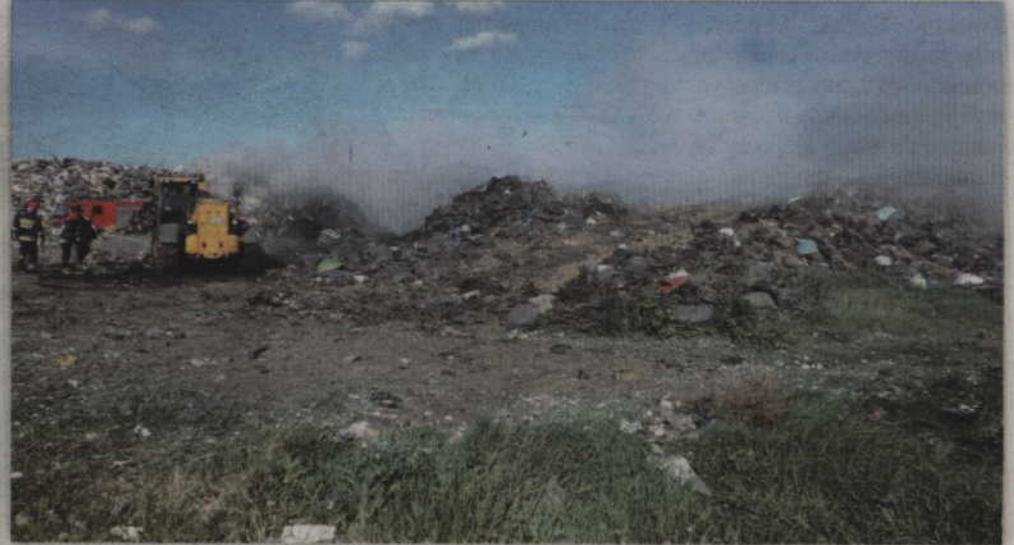
Aby dogasić ogień odpady rozgarniane były przy użyciu trzech ładowarek będących w dyspozycji zakładu.