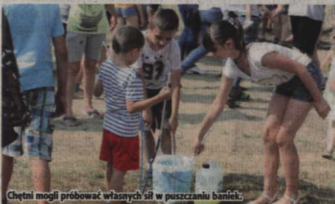
Chętni mogli próbować własnych sił w puszczaniu baniek.