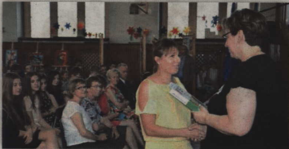
Organizatorzy podziękowali m.in. nauczycielom z konkursu historycznego.