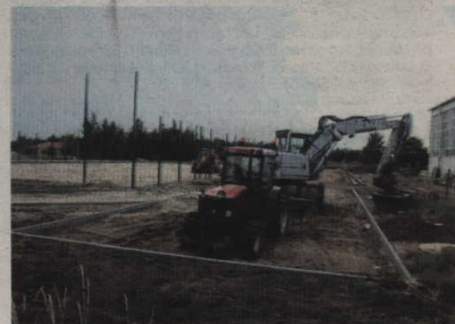
Przy Szkole Podstawowej w Sadlinkach powstaje nowoczesny kompleks sportowy wraz ze sztuczną bieżnią.