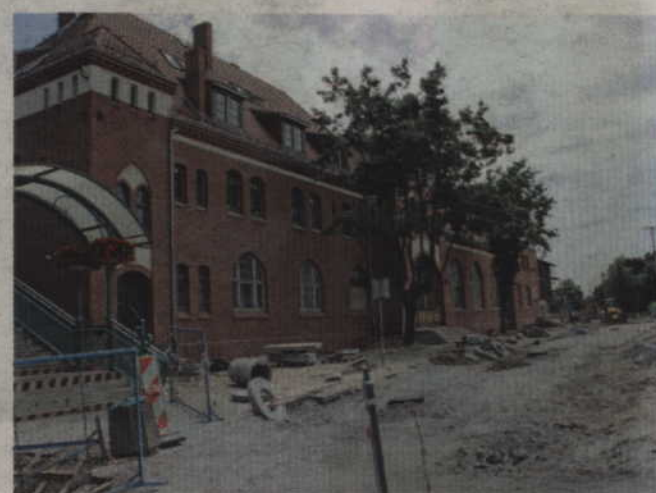
Parking przy dworcu jest już praktycznie zrobiony.

dla osób niepełnosprawnych. Przebudowane zostanie rondo im. gen. Stefana Grota-Roweckiego. Przypomnijmy, że w budynku dworca swoją nową siedzibę będzie miała Biblioteka Miejsko-Powiatowa. Już trwają przygotowania do przewiezienia bardzo dużych zbiorów