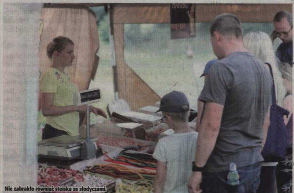
Nie zabrakło również stoiska ze słodyczami.