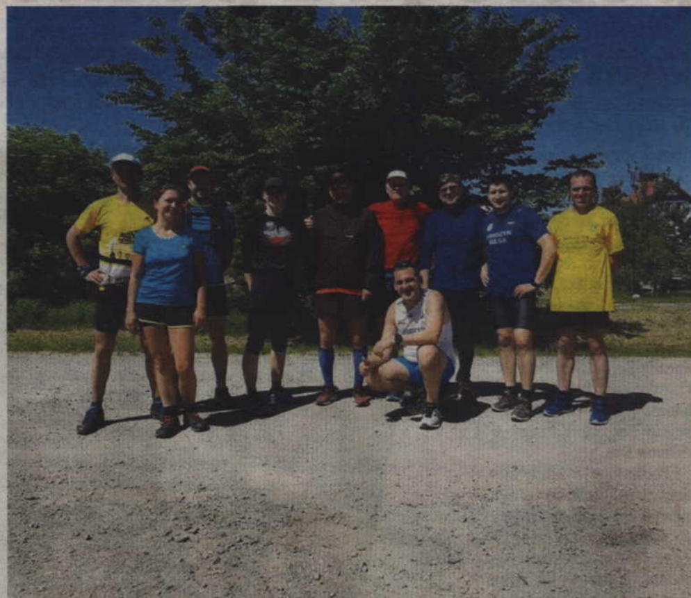
Kilka osób miało już okazję przetestować osobiście trasę kwidzyńskiego maratonu.