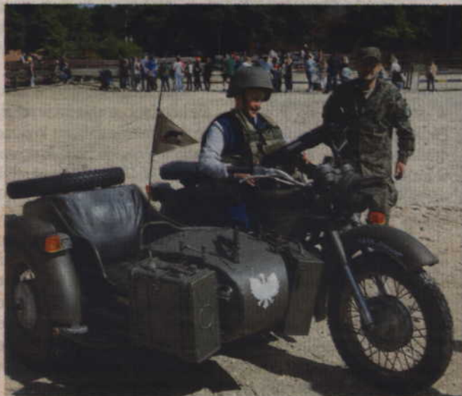
Stowarzyszenie GWARD zaprezentowało zabytkowe pojazdy wojskowe, na zdjęciu historyczny motocykl a za kierownicą mały miłośnik wojskowości.