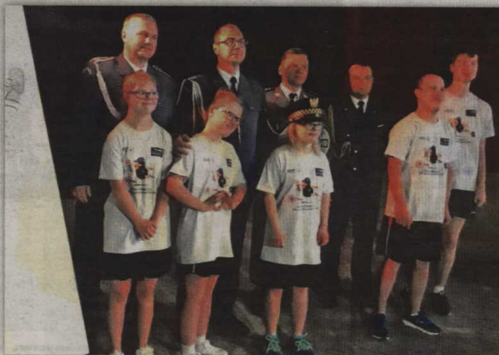
Funkcjonariusze na igrzyskach Olimpiad Specjalnych.

- Pochodnię, z którą biegliśmy, zapaliliśmy na terenie Akademii Wychowania Fizycznego w Katowicach. Głównymi ulicami miasta dotarliśmy do „Spodka”, w którym odbyła się ceremonia otwarcia igrzysk. Z nami biegł jeden z zawodników Olimpiad Specjalnych. To jemu