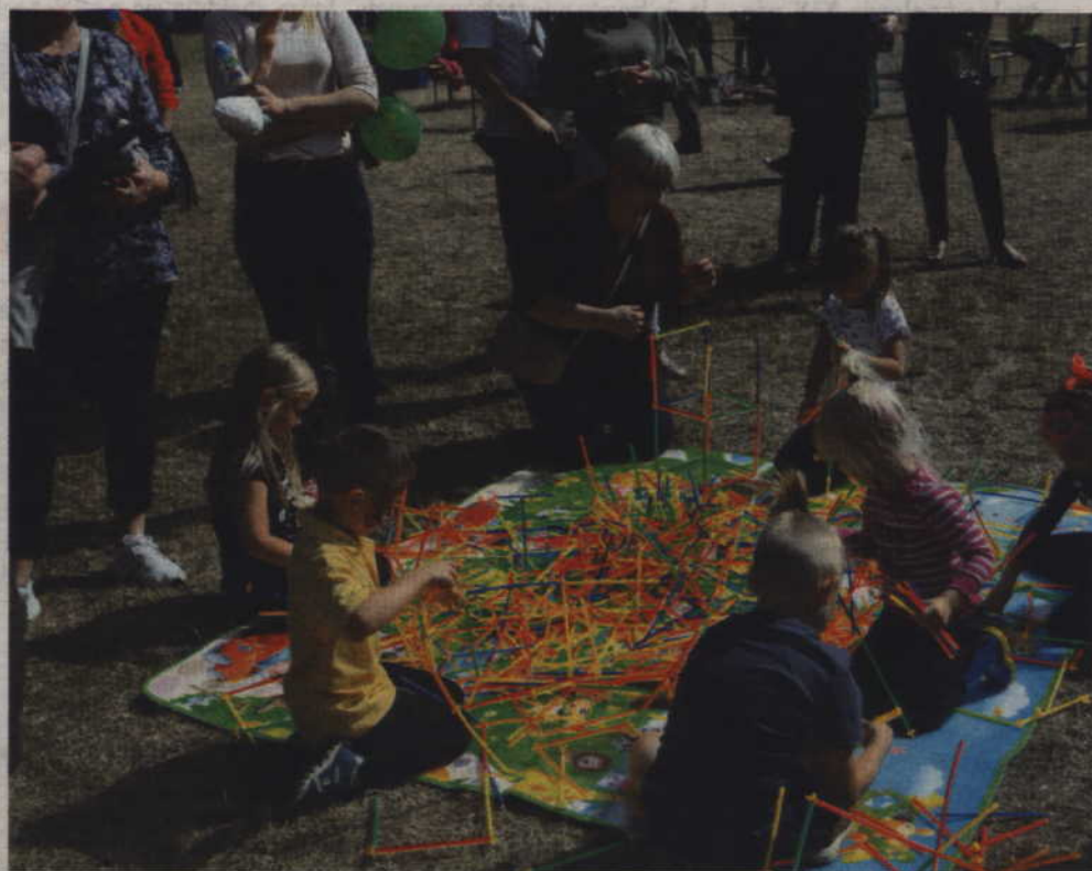
Dzieci wraz z rodzicami wspólnie konstruowali budowle z kolorowych patyczków.