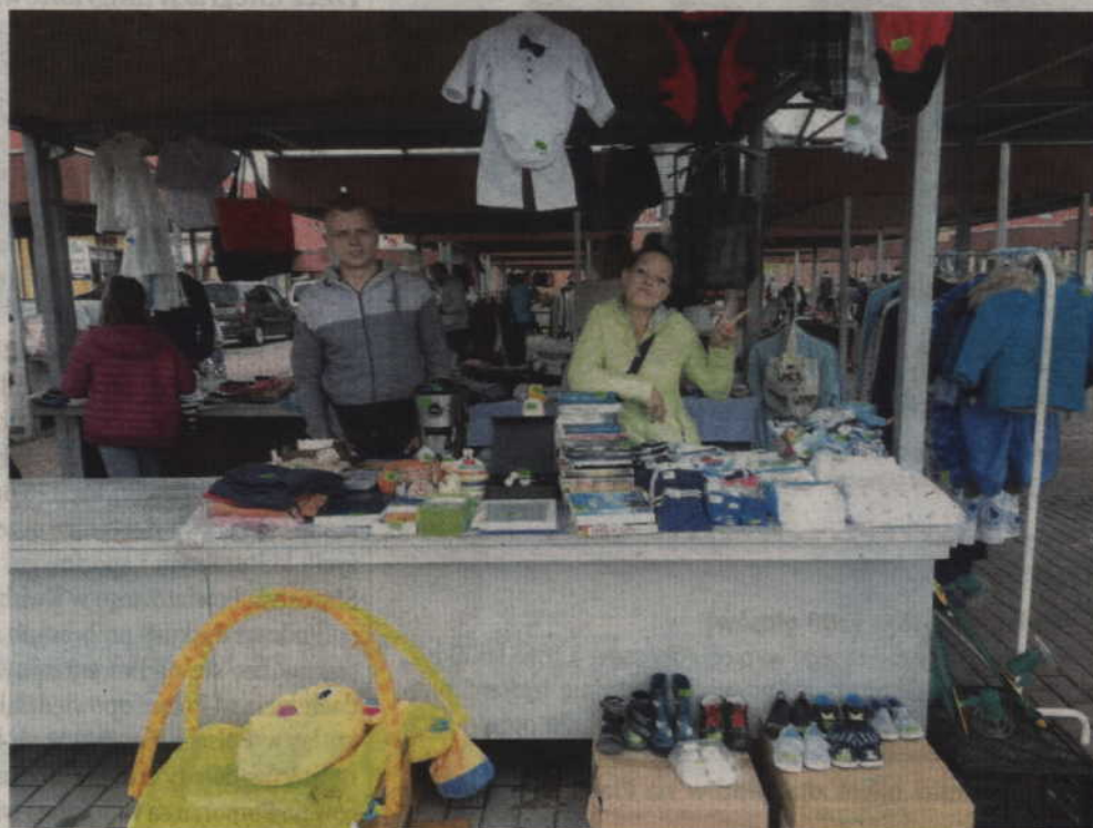
Na stoiskach handlowych dominowały ubrania i artykuły gospodarstwa domowego.

- Bardzo często w naszych domach mamy mnóstwo rzeczy, które są dobre ale my już