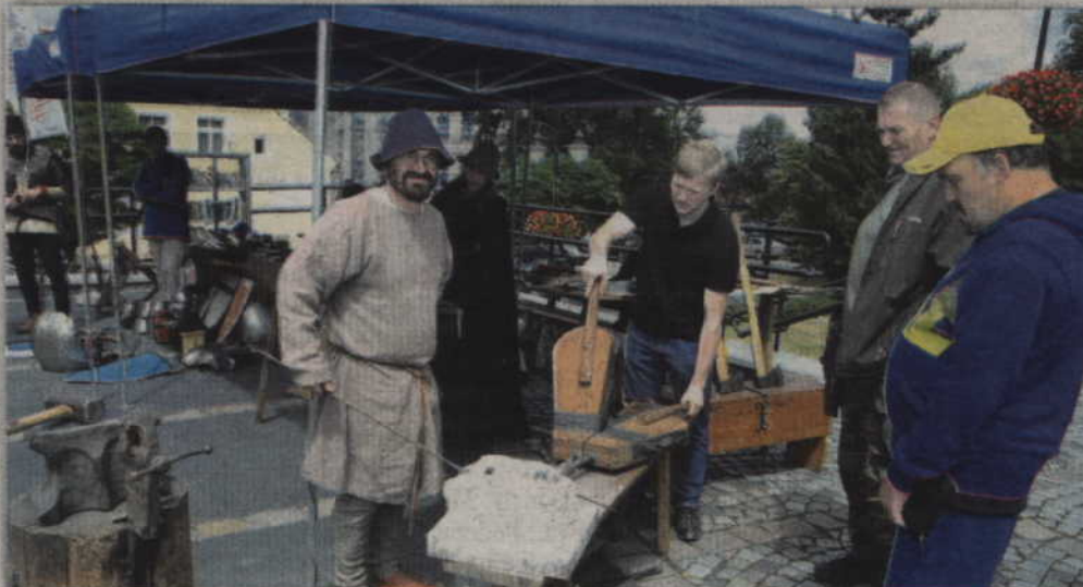
Podtrzymanie ognia w kuźni nie było łatwym zadaniem.