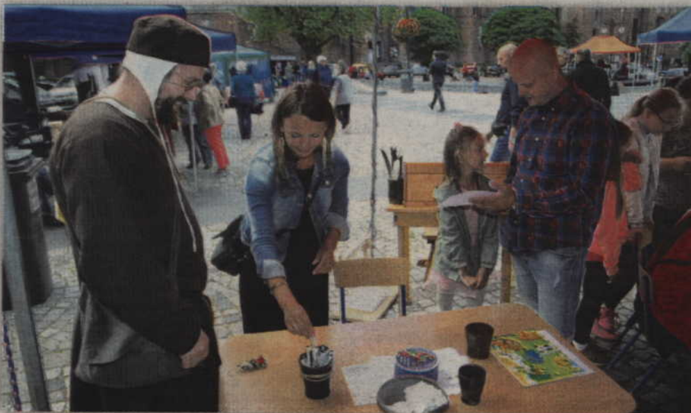
Podczas jarmarku można było nauczyć się sztuki średniowiecznej kaligrafii.