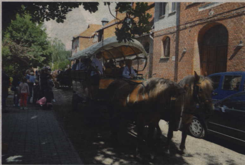
Jeśli ktoś chciał przejechać się bryczką musiał w długiej kolejce poczekać kilkadziesiąt minut.