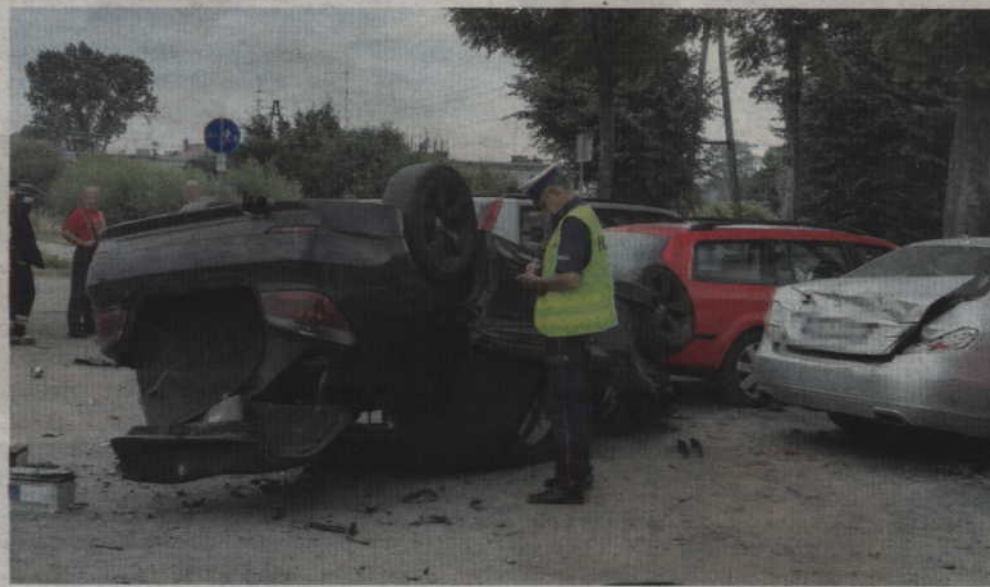
Auto dachowało na parkingu uszkadzając stojące w tym miejscu samochody.