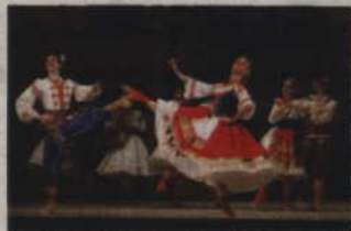
„Coppelia” to pierwszy balet europejski, w którym wykorzystano czardasze.

Sama treść została zaczerpnięta z noweli E.T.A. Hoffmanna, autora także innego pierwowzoru scenariusza baletowego – „Dziadka do orzechów”. W miasteczku pojawia się wynalazca Coppelius ze swoją piękną córką, która nieruchomości przesiaduje w oknie jego domu. Młody Franz zakochuje się w domniemanej Coppelii i nocą zakrada się do mieszkania wynalazcy. Za nim podąża zazdrosna narzeczona, Swanilda. (f)