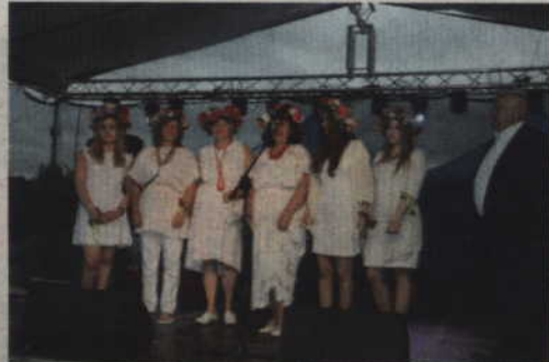
Podczas festynu nie zabraknie podsumowania konkursu wianków świętojańskich.