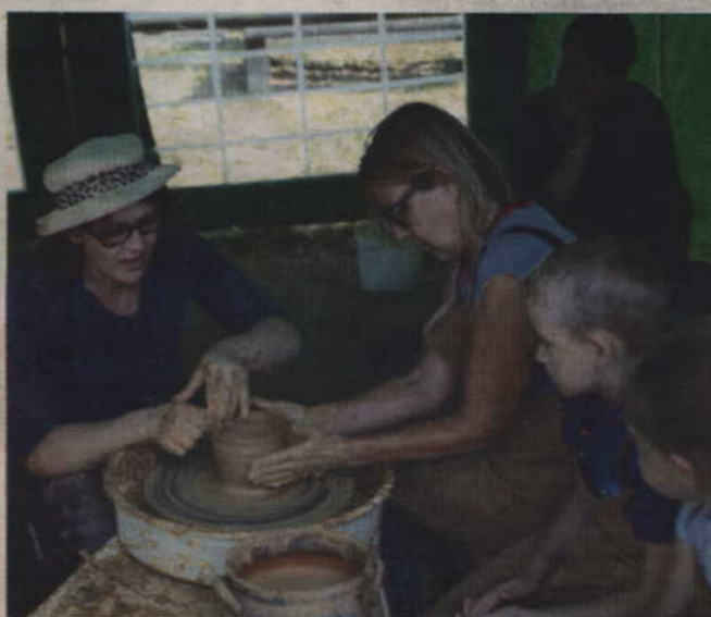
Z pomocą profesjonalnego garncarza można było samodzielnie ulepić gliniany dzbanek.