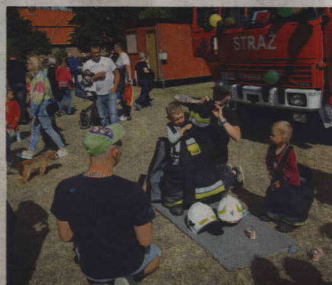
Strażacy z OSP Miłosna nie tylko prezentowali sprzęt ratownictwa p-poż ale również pomagali dzieciom ubierać się w strażackie uniformy.