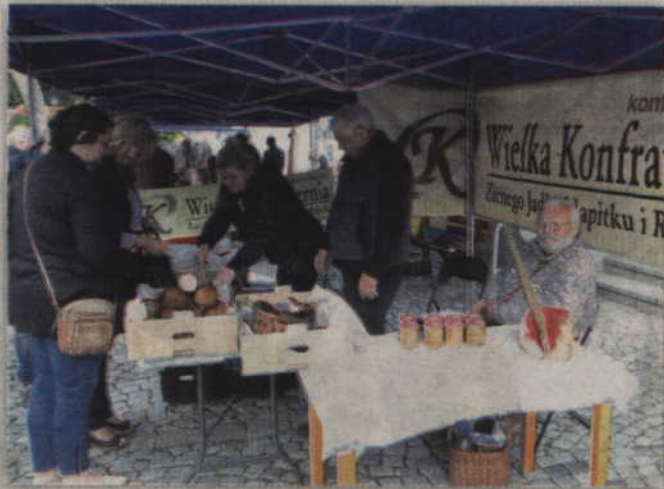
Wielka Konfraternia Zacnego Jada, Napitku i Rękodzieła miała również swoje stoisko.