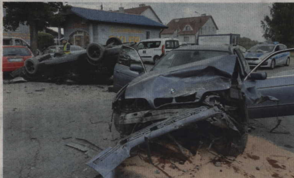
Do wypadku doszło na drodze wojewódzkiej nr 588 w Oborach.

Policjanci przebadali kierujących alkoestem i ustalili, że byli trzeźwi. Teraz śledczy wyjaśniają okoliczności wypadku. Policjanci apelują również o zachowanie należytej ostrożności na drogach, uwagę oraz przestrzeganie obowiązujących przepisów prawa. (fox)