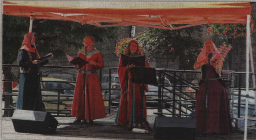
Jarmarkowi Dorotańskiemu towarzyszyła muzyka z epoki średniowiecza.

życia męża odbyła kilka pielgrzymek do miejsc świętych. Po jego śmierci osiedliła się w Kwidzynie, gdzie w maju 1393 roku kazała się zamurować w kwidzyńskiej katedrze. Zmarła po 14 miesiącach pobytu w kościelnej celi. 9 stycznia 1976 roku papież Paweł VI ogłosił Dorotę z Mątów błogosławioną. Jest patronką Pomorza, kobiet, matek, małżeństw w potrzebie i odlewników. Po powstaniu diecezji elbląskiej stała się również jej patronką.