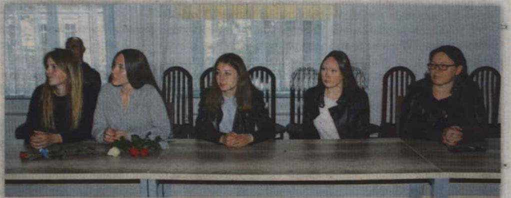
Wyróżnieni absolwenci reprezentowali Gimnazjum w Nowym Dworze.