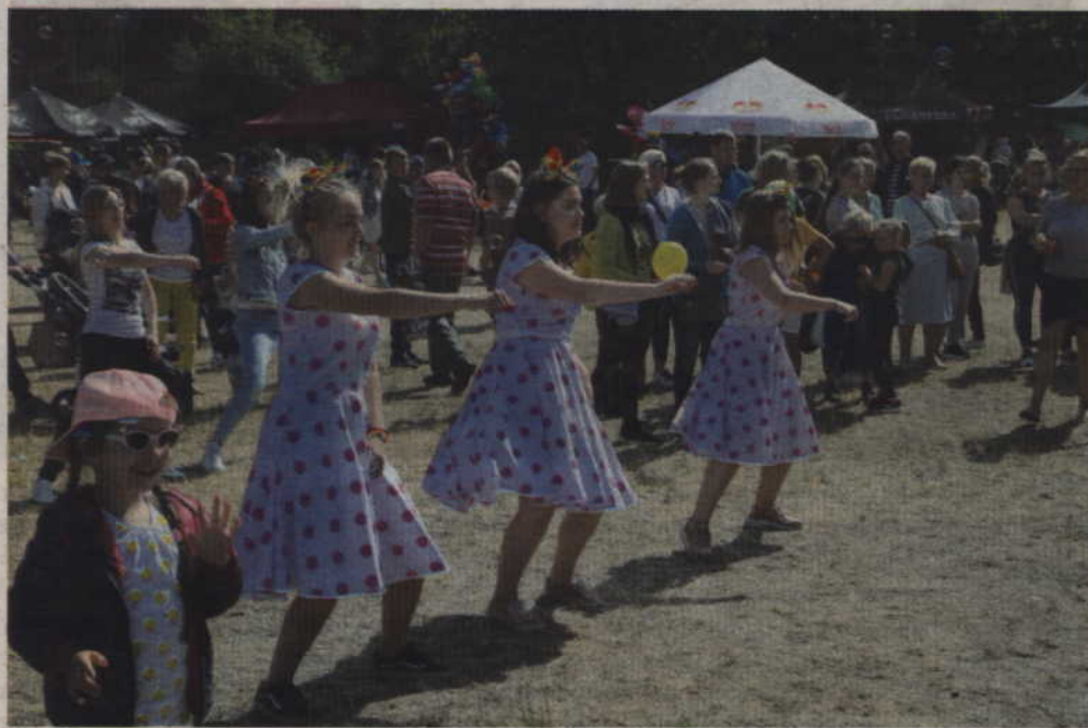
Wspólny taniec zumbi cieszył się dużym zainteresowaniem.