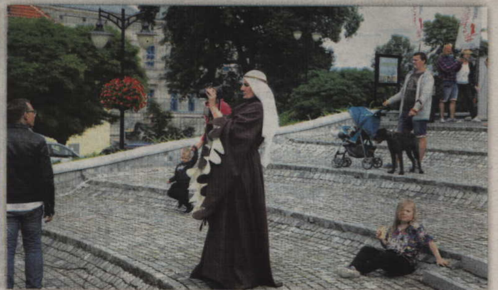
Damy w średniowieczu wyróżniały się strojami tylko ten aparat fotograficzny to już współczesność.