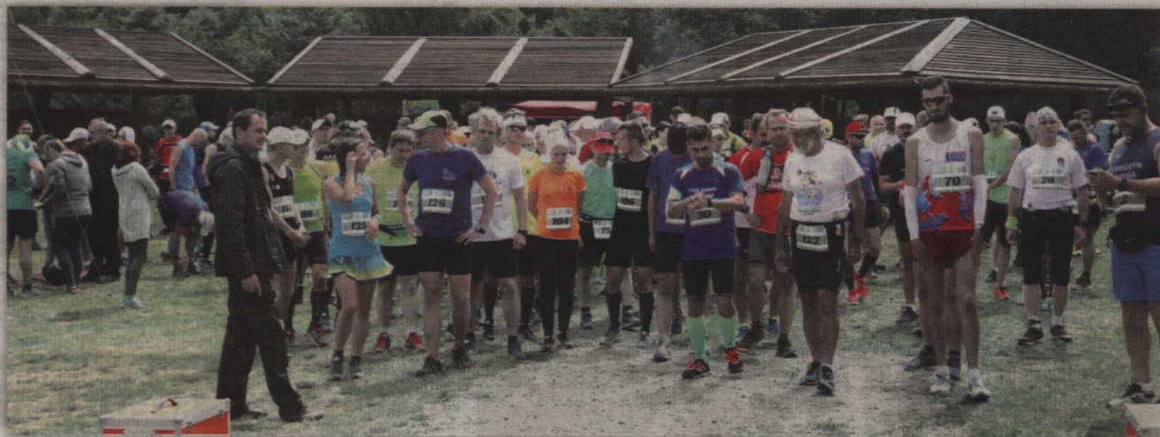
Na starcie I Maratonu Leśnego stanęło 116 biegaczy.