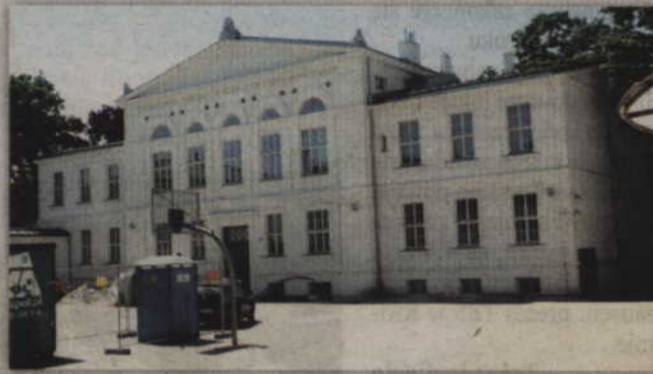
Do 30 października powinna zakończyć się modernizacja gmachu Zespołu Szkół Ponadgimnazjalnych nr 2.

budynku, natomiast gmach ZSP nr 2 zostanie wyremontowany w całości. Koszt prac to ponad 20 mln zł. Inwestycja realizowana jest w ramach projektu „Podniesienie jakości szkolnictwa zawodowego w powiecie kwidzyńskim - większa zatrudnialność uczniów”. Dotyczy on między innymi dofinansowania praktyk zawodowych oraz wielu różnych dodatkowych zajęć dla uczniów.