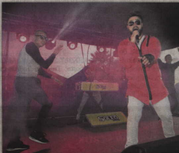
Występ gwiazdy wieczoru Soleo to była gratka dla miłośników muzyki dance.