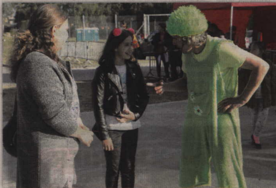
Najmłodszą publiczność na gardejskiej nocy świętojańskiej bawił teatr Qfer.