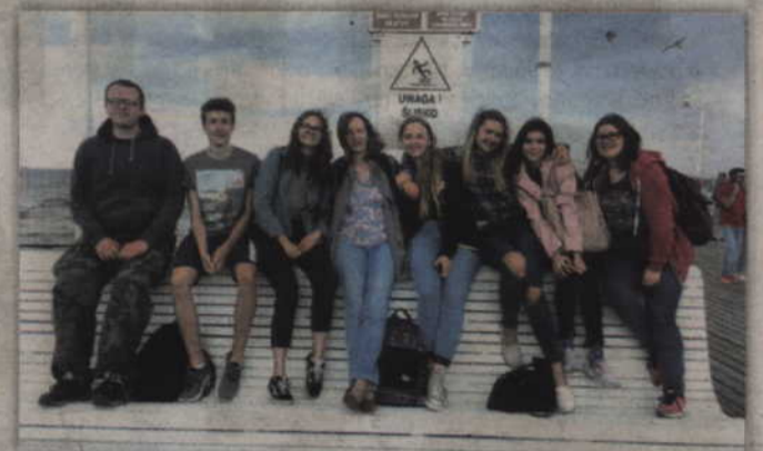
Młodzież z Celle odwiedziła Muzeum Drugiej Wojny Światowej.

im też możliwość szerokiego spojrzenia tamte trudne czasy, genezę i skutki wojny. W czasie trwania projektu nie zabrakło też intensywnej pracy. Uczniowie w polsko-niemieckich grupach tworzyli prezentacje multimedialne na bazie materiałów zebranych w czasie wycieczek. Realizacja projektu możliwa była przede wszystkim dzięki finansowemu wsparciu ze strony