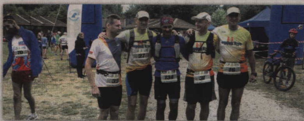
W kwidzyńskim maratonie nie zabrakło silnej ekipy z Tczewa.