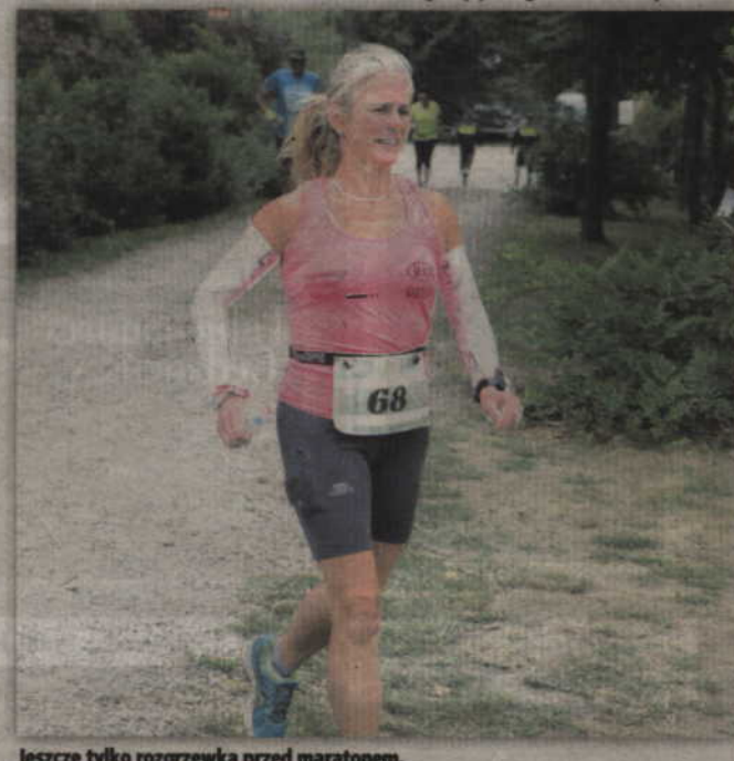
Jeszcze tylko rozgrzewka przed maratonem.