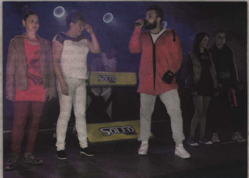
Występ gwiazdy wieczoru Soleo to była gratka dla miłośników muzyki dance.