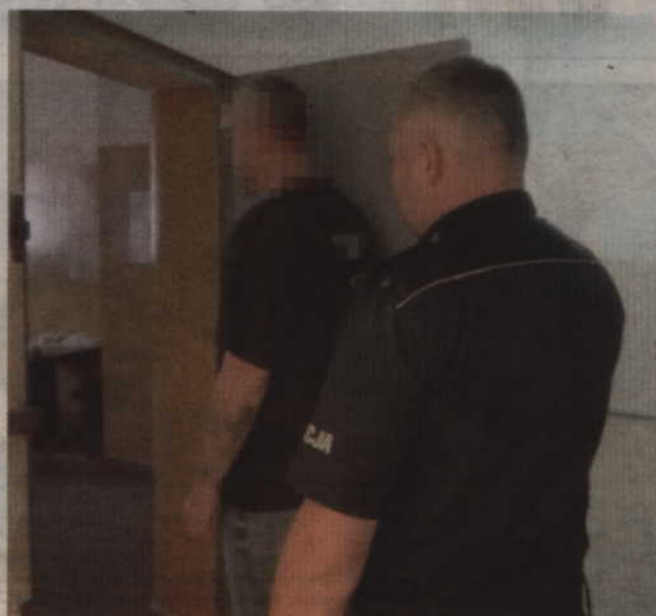
Mieszkaniec Elbląga poszedł do piekarni nie po pieczywo tylko po cudze pieniądze.