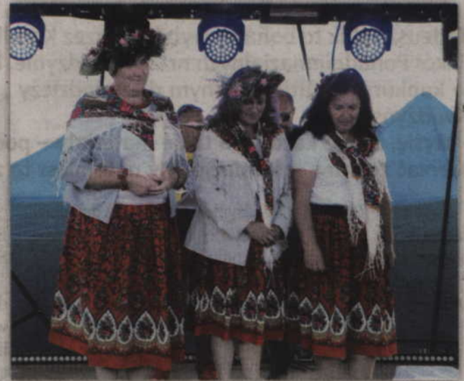
W konkursie wianków świętojańskich zwyciężył wianek wykonany przez panie z Czarnego Dolnego.