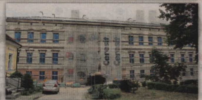
Zakończenie prac wewnątrz budynku Zespołu Szkół Ponadgimnazjalnych nr 1 zaplanowano na koniec sierpnia.

za budynku, natomiast gmach ZSP nr 2 zostanie wyremontowany w całości. Koszt prac to ponad 20 mln zł. Inwestycja realizowana jest w ramach projektu „Podniesienie jakości szkolnictwa zawodowego w powiecie kwidzyńskim - większa zatrudnialność uczniów”. Dotyczy on między innymi dofinansowania praktyk zawodowych oraz wielu różnych dodatkowych zajęć dla uczniów.