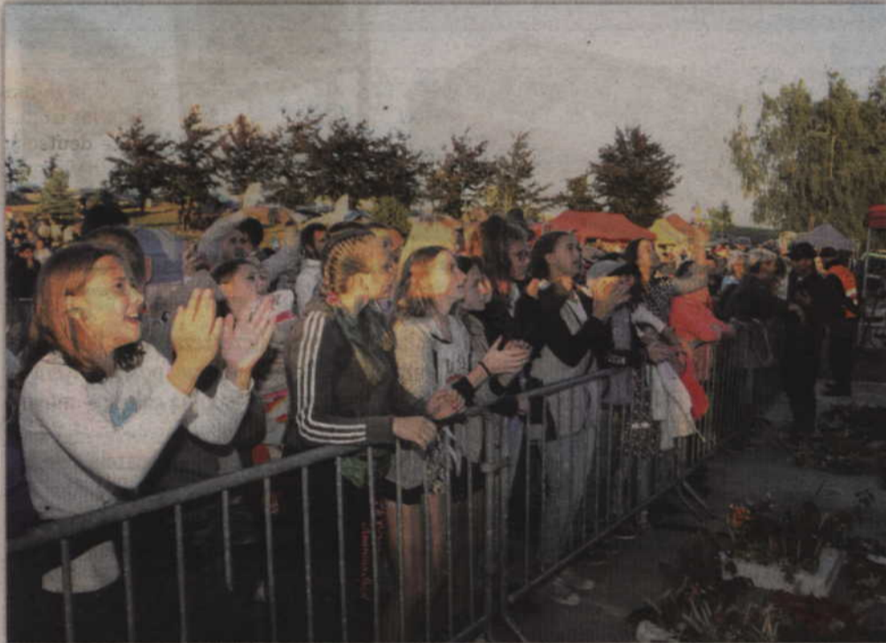
Mimo chłodu bawiono się doskonale.