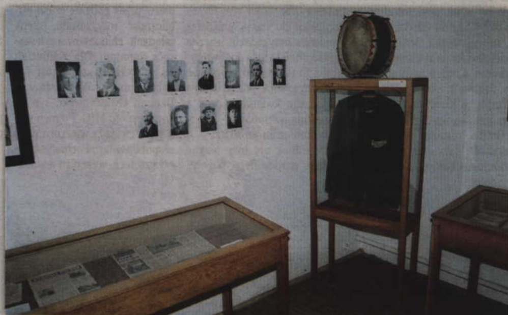
Zbierając materiały do prezentacji konkursowej uczennice ZSP nr 2 odwiedziły m.in. Izbę Pamięci Szkoły Podstawowej w Janowie.

- Na początku zbierałyśmy same informacje. Jeździliśmy