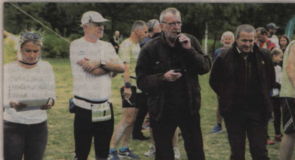
Pomysłodawcy i organizatorzy kwidzyńskiego maratonu.