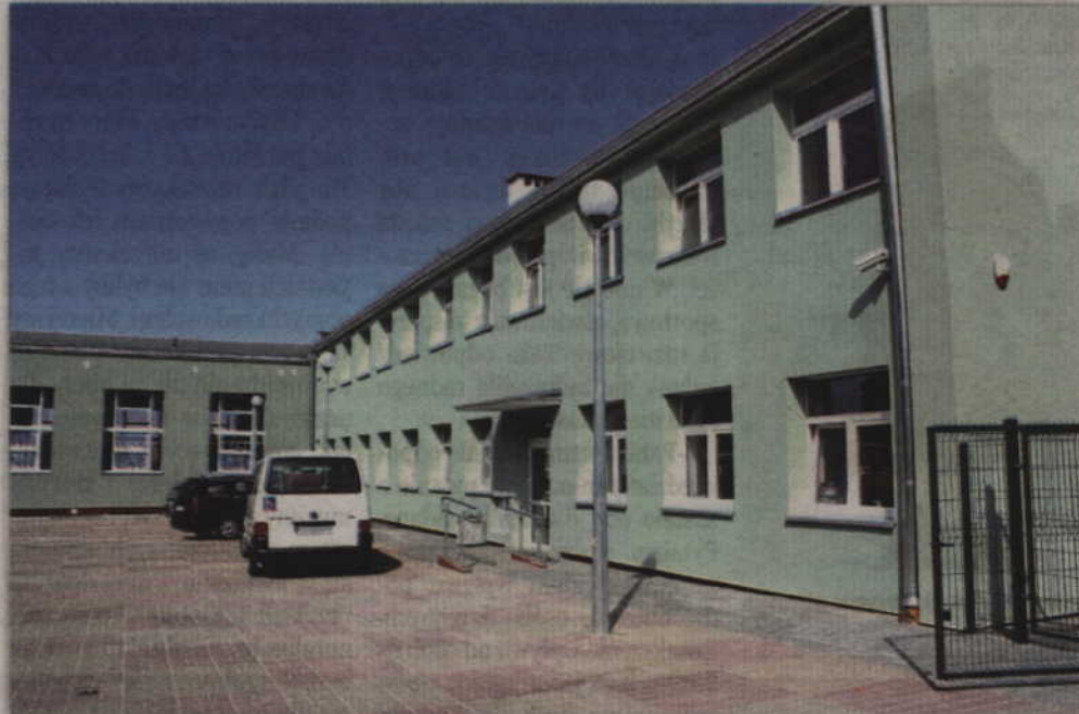
Rada powiatu jednogłośnie przyjęła uchwałę w sprawie Powiatowego Środowiskowego Domu Samopomocy w Kwidzynie. Dom będzie mieścił się przy ul. Ogrodowej 2, w wydzielonej i przystosowanej do potrzeb osób, części Zespołu Szkół Specjalnych w Kwidzynie.

Powiatowy Środowiskowy Dom Samopomocy będzie mieścił się przy ul. Ogrodowej 2, w wydzielonej części Zespołu Szkół Specjalnych w Kwidzynie. W placówce będzie mogło przebywać 15 osób, które z powodu choroby psychicznej lub upośledzenia intelektualnego mają poważne trudności w kontaktach z otoczeniem. Pobyt w ośrodku ma umożliwić uczestnikom rozwój umiejętności niezbędnych do samodzielnego, aktywnego życia. Działalność Powiatowego Środowiskowego Domu Samopomocy w Kwidzynie ma się rozpocząć 1 sierpnia bieżącego roku. Zajęcia mają być prowadzone pięć dni w tygodniu, po 8 godzin dziennie. Będą się one odbywały w formie zajęć świetlicowych. Wnioski o skierowanie do domu, dotyczące dziennej pobytu, będzie można składać w ośrodkach pomocy społecznej.