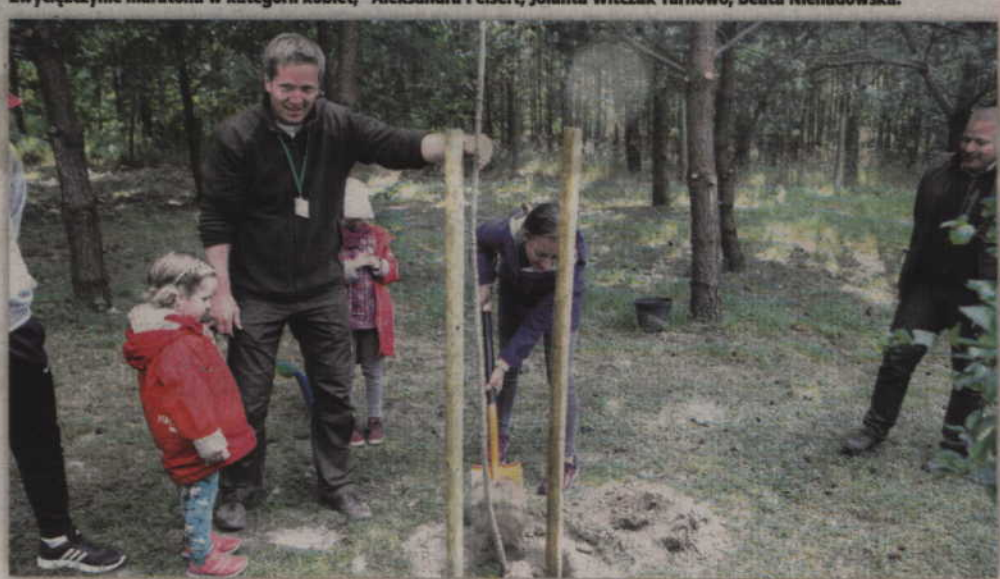
Zwycięzcy I Leśnego Maratonu zasadzili drzewa w alei zwycięzców.