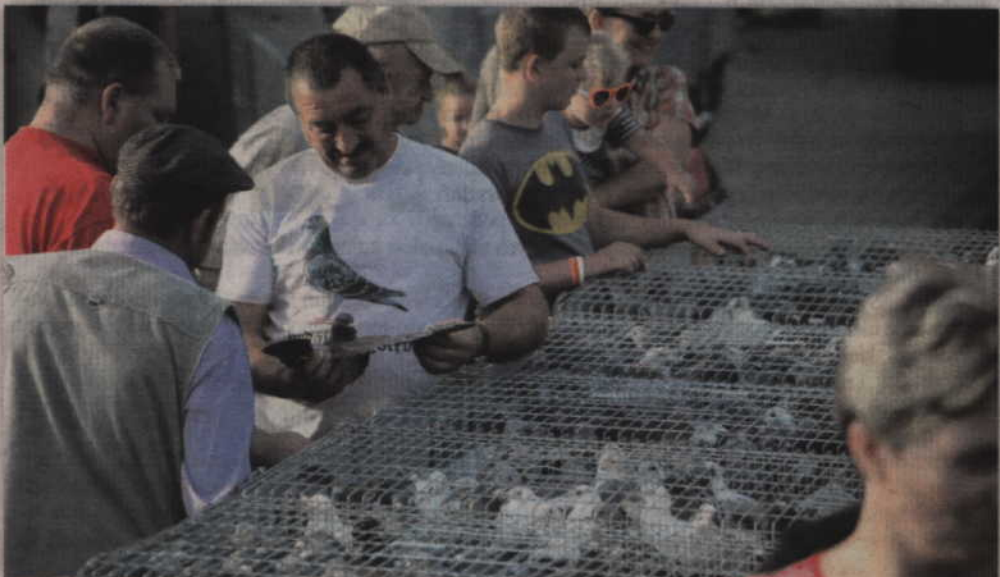
Dużą popularnością cieszyła się wystawa gołębi rasowych i pocztowych.