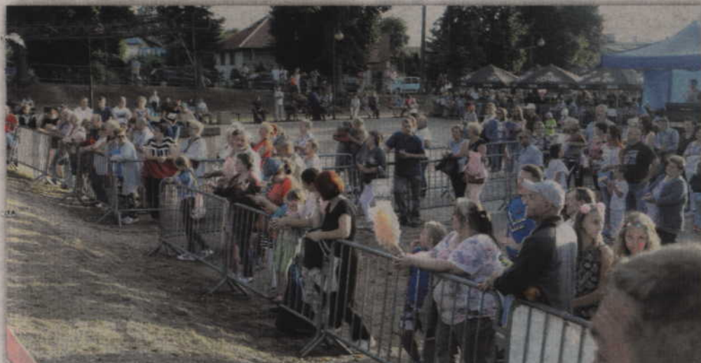
Dni Ryjewa tradycyjnie odbywały się na placu przed ośrodkiem kultury.

RYJEW. Zespoły „Big Cyc” i „Rezerwat” oraz Wojciech Gąssowski byli gwiazdami tegorocznych XX Dni Ryjewa. Dwudniowe święto upłynęło bardzo szybko, a każdy mógł na nim znaleźć coś dla siebie. Wspólna zabawa trwała natomiast do 1-2 w nocy.