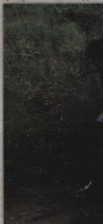
Kierowca zjechał z ulicy i dachował na poboczu drogi. Prowadzący go 61-latek doznał ogólnych potłuczeń ciała.

otrzymał wówczas zgłoszenie mówiące o zdarzeniu drogowym w Mątkach (gm. Ryjewo) na trasie Sztum - Kwidzyn. Na miejsce natychmiast skierowani zostali policjanci. Mundurowi zabezpieczyli miejsce, przeprowadzili oględziny oraz sporządzili dokumentację fotograficzną.