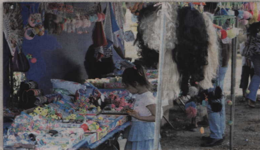
Na stoiskach handlowych każdy mógł znaleźć coś dla siebie.