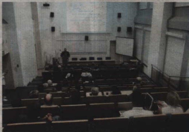
Kolejnym punktem uroczystości była konferencja zorganizowana w sali audiowizualnej KCK.

nieszlachetne i nieuczciwe. Że nie jest to sytuacja którą możemy traktować relatywistycznie. Tutaj mamy sytuacje dosyć jasne, takie zero-jedynkowe i do-