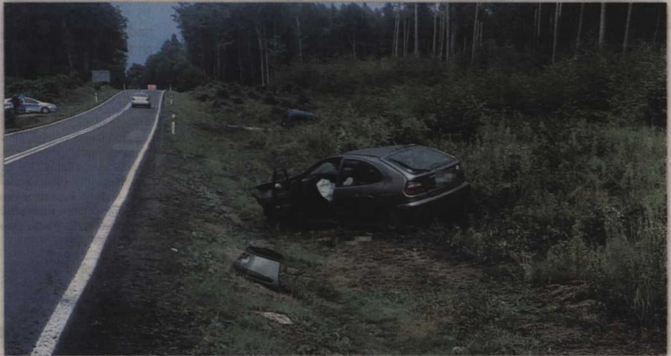
Do wypadku doszło na drodze krajowej nr 55 w Mątkach (gm. Ryjewo).

Pamiętaj, aby wszystkie czynności wykonywać z rozwagą, bez niepotrzebnych emocji i dodatkowych zniszczeń, do czasu aż przybędą specjalistyczne służby ratownicze. Pamiętaj, że Ty również możesz się znaleźć w podobnej sytuacji.