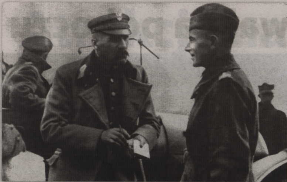
W przeddzień bitwy warszawskiej prawnik publicysta skrytykował sposób dowodzenia wojskami polskimi przez Józefa Piłsudskiego.

JAK ARTYKUŁ PRASOWY DAŁ POCZĄTEK WIELKIEMU WYDARZENIU