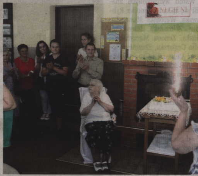
Oczywiście nie obyło się bez tortu i odśpiewania „Dwieście lat!”.