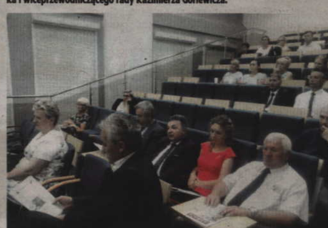
Na widowni zasiedli m.in. przedstawiciele kwidzyńskich samorządów.

postawę, którą reprezentowali w latach 1980-82.