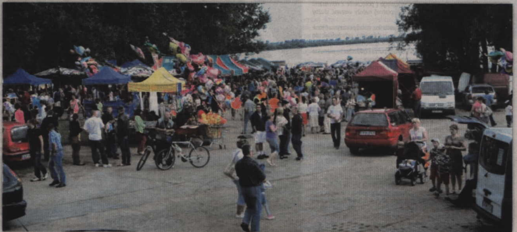
Kwidzińskie uroczystości „Cudu nad Wisłą” od wielu lat organizowane są w Korzeniewie.

12 sierpnia rozpoczęła się kilkunastodniowa bitwa, która przeszła do historii pod znamieną nazwą bitwy warszawskiej. To właśnie tego dnia rozpoczęło się natarcie bolszewików, dowodzonych przez Michaiła Tuchaczewskiego. Zacięte boje toczyły się od 13 do 15 sierpnia w rejonie Radzymina i Ossowa. Równocześnie 14 sierpnia nad Wkrą rozpoczęło