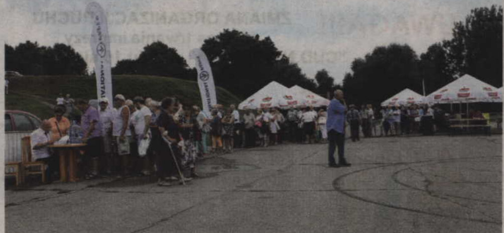
Jeszcze przed oficjalnym rozpoczęciem po odbiór talonów ustawili się długi kolejki.