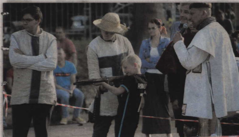
Strzelanie z kuszy nie było wcale takie proste.