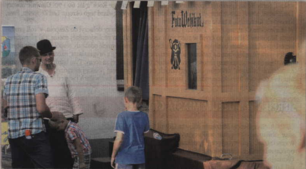
FotoWehikuł budził ciekawość uczestników festynu.