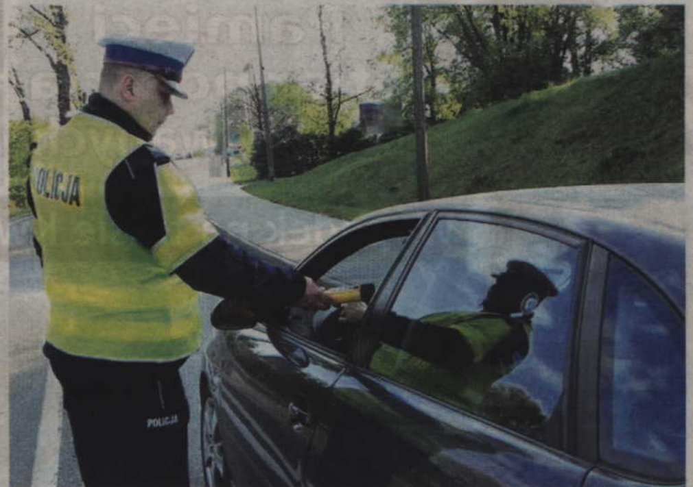
Policjanci zatrzymali kolejnych nietrzeźwych kierowców. Rekordzista miał 2,8 promila.