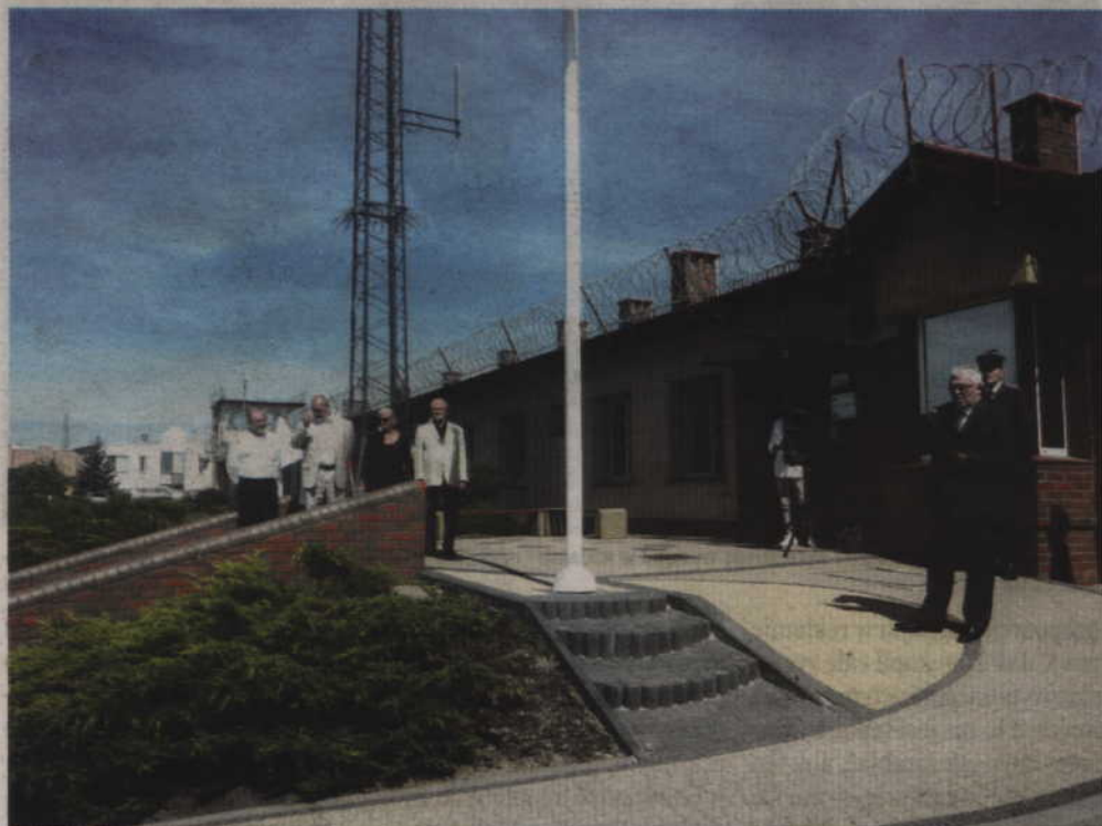
Uczestnicy uroczystości spotkali się pod murami kwidzyńskiego zakładu karnego.

KWIDZYN. Po raz kolejny upamiętniono ofiary pobicia internowanych w kwidzyńskim zakładzie karnym. W XXXVI rocznicę tych wydarzeń, kwiaty pod tablicą pamiątkową znajdującą się na budynku Zakładu Karnego złożyli samorządowcy, politycy oraz byli internowani. Spotkanie zorganizowane przez MKK NSZZ „Solidarność” w Kwidzynie zakończyła konferencja zorganizowana w sali audiowizualnej KCK.