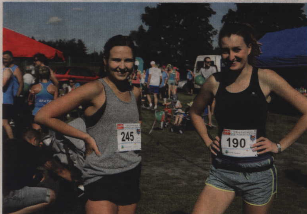
Sadliński bieg przelajowy na trwałe wpisał się w sportowy kalendarz imprez masowych w naszym powiecie.

BIEGI. Już w najbliższą sobotę, 18 sierpnia, odbędzie się III Otwarty Bieg Przelajowy o Puchar Wójta Gminy Sadlinki. Organizatorem jest urząd gminy i Traktor Team Gmina Kwidzyn. Organizatorzy zaplanowali udział 300 zawodników. Nowością jest natomiast możliwość startu w Nording Walking.