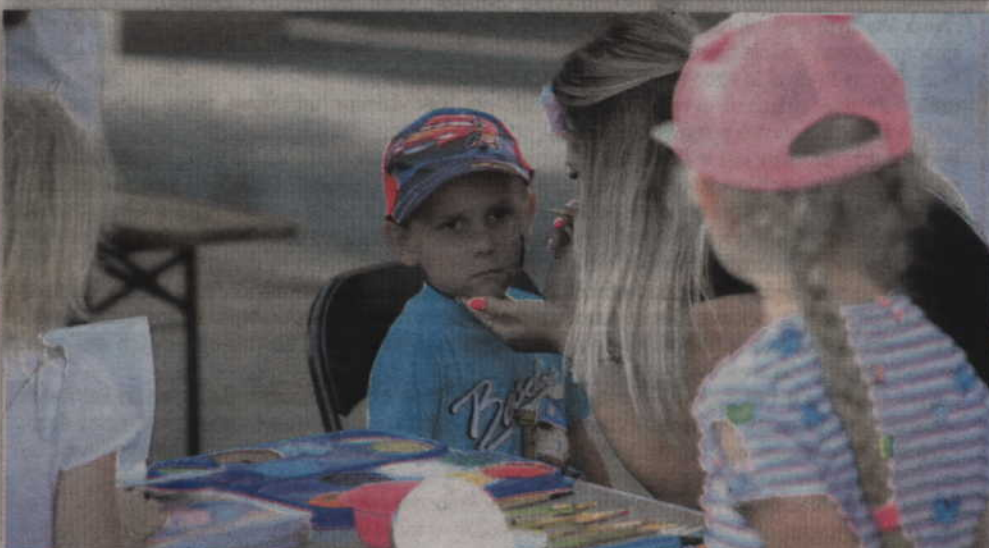
Nie zabrakło również malowania twarzy.