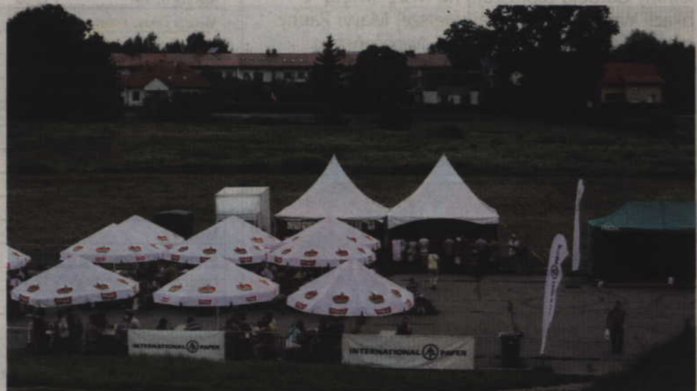
Spotkanie byłych pracowników IP Kwidzyn po raz pierwszy odbyło się na boisku pod Gdaniskiem.