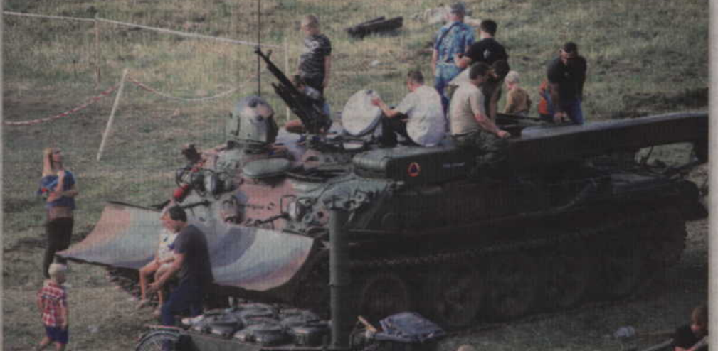
Dzieci zaglądały do wnętrza wszystkich wojskowych pojazdów.