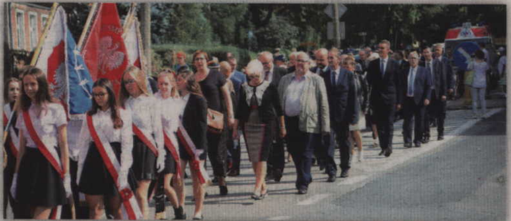
Uroczystości rozpoczęły się na Skwerze Kombatantów skąd zebrani przeszli ulicami miasta do kwidzyńskiej Katedry.