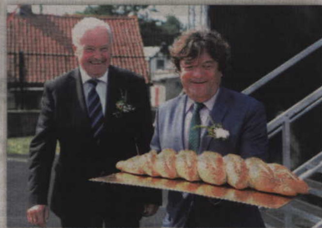
Dożynkowy chleb przypominał kłos zboża.

- Święto plonów to najpiękniejsze święto nas, rolników. Jest to uroczystość, w której nie brakuje wdzięczności i radości,