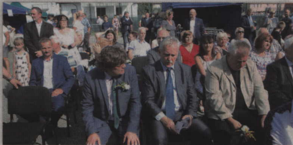
W uroczystościach dożynkowych wziął udział również senator Leszek Czarnobaj.