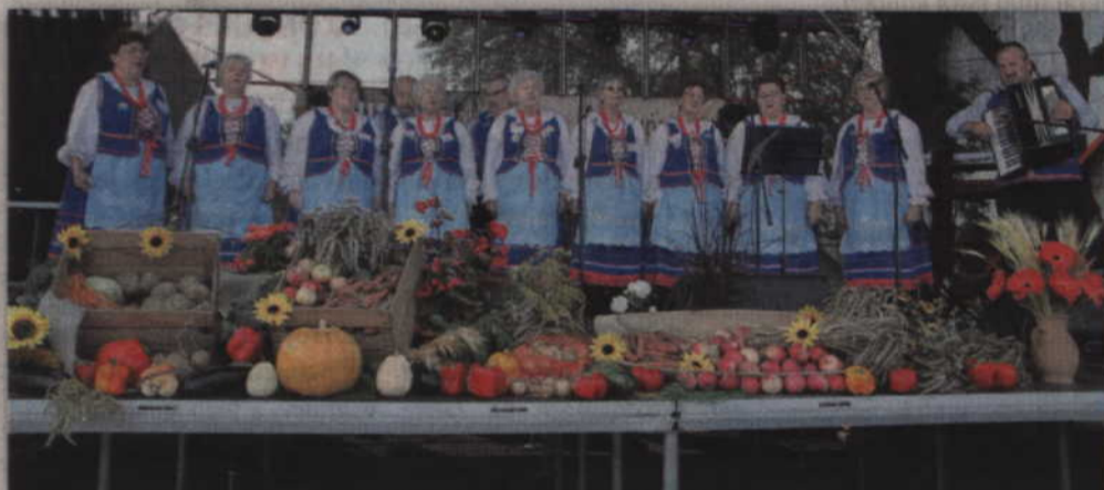
Występ Marezianek zapoczątkował muzyczną część dożynek powiatowych.