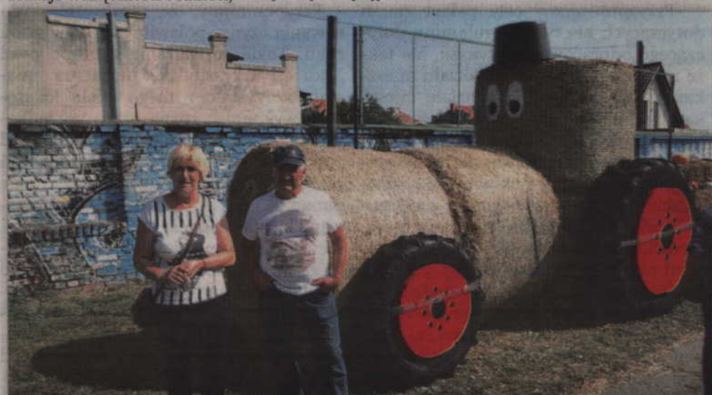
Słomiany ciągnik cieszył się dużym zainteresowaniem.