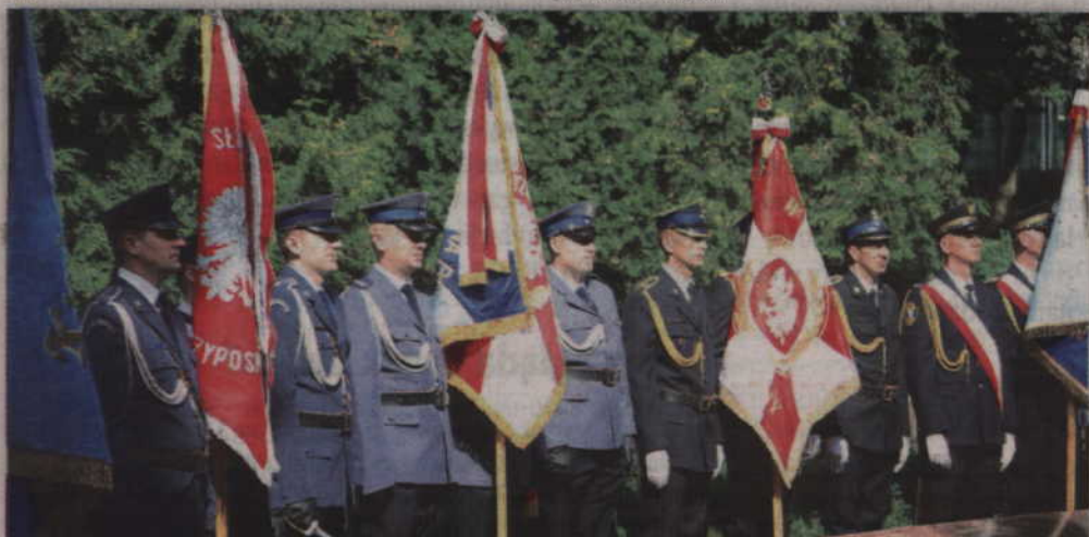
Na Skwerze Kombatantów nie zabrakło pocztów sztandarowych kwidzyńskich szkół, instytucji oraz stowarzyszeń.