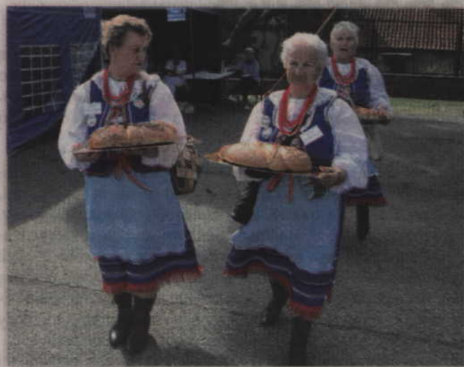
W dzieleniu się chlebem pomagały panie z Marezianek.