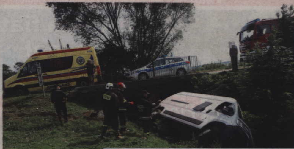
Kierujący fiatem stracił panowanie nad autem i wjechał do przydrożnego rowu.

Po sprawdzeniu w policyjnych systemach okazało się jednak, że mężczyzna ma zatrzymane uprawnienia do kierowania za popełnione wykroczenia drogowe. Teraz policjanci wyjaśniają szczegółowe okolicz-