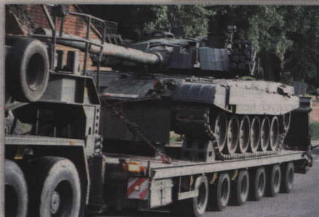
Atrakcją pikniku był czołg PT 91 Twardy.