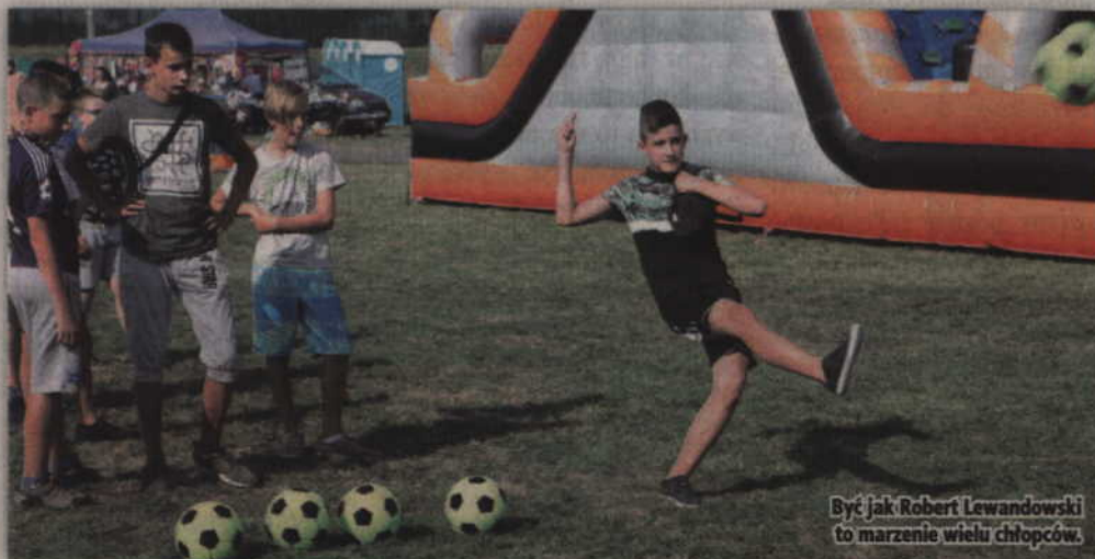
Być jak Robert Lewandowski to marzenie wielu chłopców.