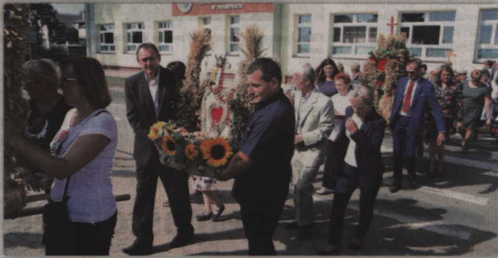
Po Mszy świętej, dożynkowy korowód przeszedł na plac rekreacyjny przy ulicy Polnej.

lizowało 7 wieńców. Komisja konkursowa miała bardzo trudny wybór, bowiem każdy z nich był swego rodzaju prawdziwym dziełem sztuki. Ostatecznie, komisja konkursowa uznała, że najładniejszy wieniec wykonało sołectwo Tychnowy (gm. Kwidzyn). Specjalną nagrodę ufundowało także Biuro Powiatowe ARiMR w Kwidzynie. W imieniu ARiMR nagrodę Kolu Gospodyń Wiejskich w Obrzy-