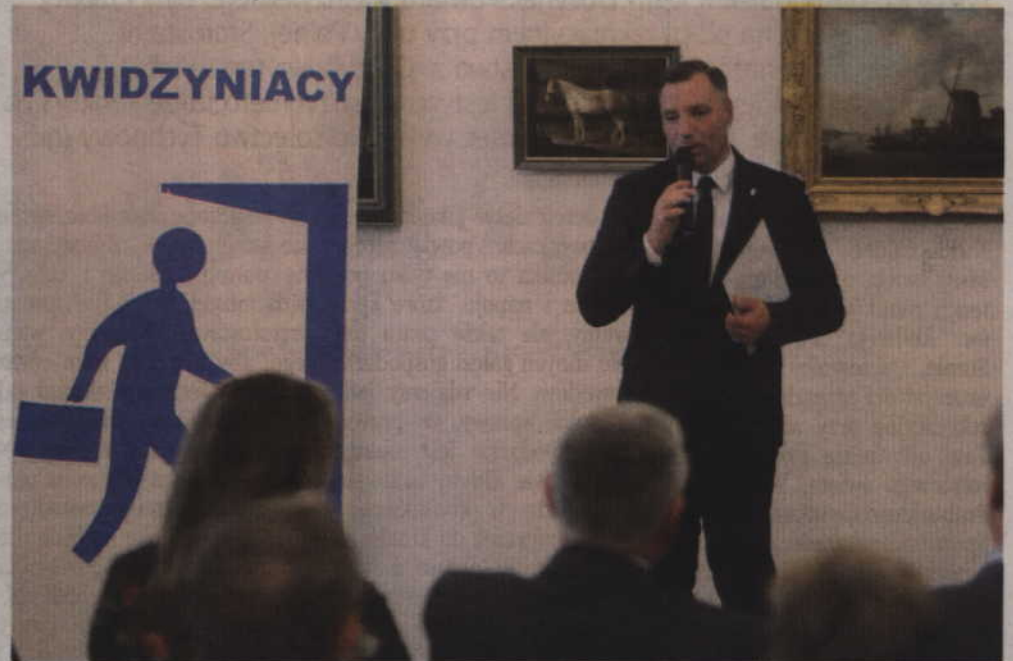
KWW „Kwidzyniacy” przedstawili swojego kandydata na burmistrza podczas spotkania zorganizowanego w kwidzyńskim zamku.

Warto jednak dodać, że jest to pierwszy oficjalnie przedsta-