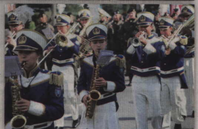
Nie zabrakło także Orkiestry Dętej „Helikon”.