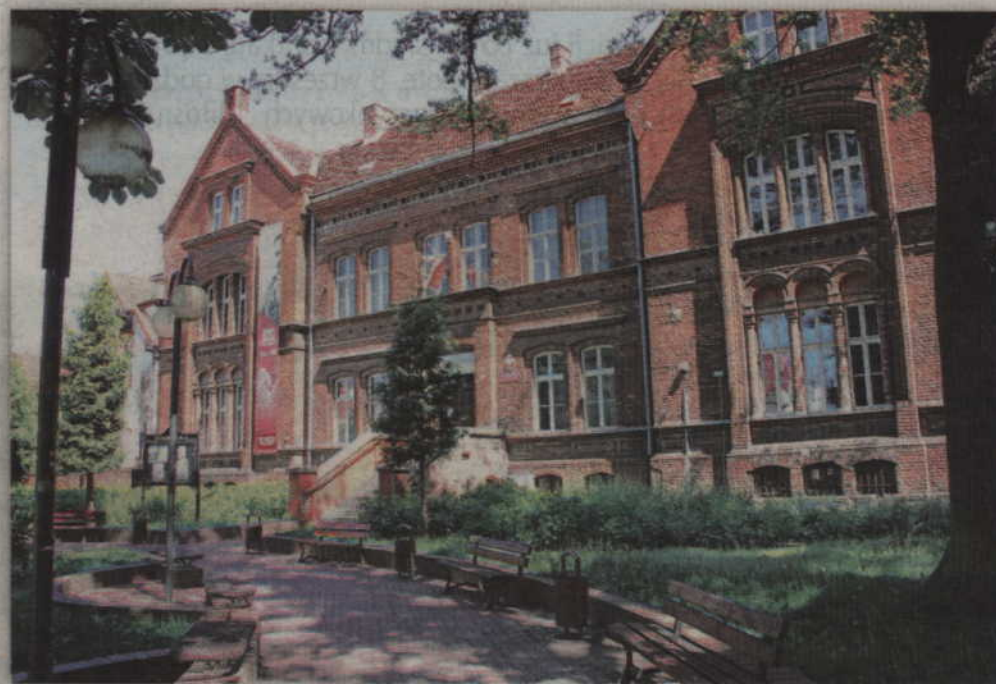
Po przeprowadzce Biblioteki Miejsko-Powiatowej do modernizowanego budynku dworca PKP, do wykorzystania zostaną dwa budynki przy ul. Piłsudskiego.