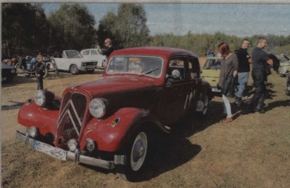
Miłośnicy motoryzacji już po raz siódmy spotkają się na kwidzińskim zlocie pojazdów zabytkowych, ciekawych oraz mających swój rodowód w PRL-u.