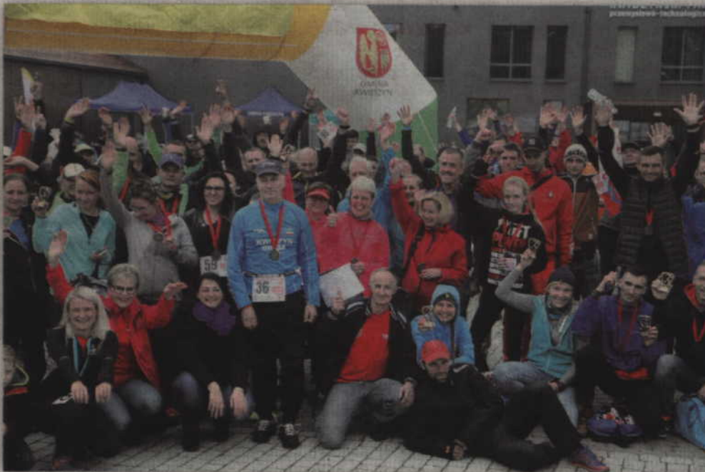
Ubiegłoroczny bieg „Traktora” okazał się frekwencyjnym sukcesem.

Bieg dla dzieci i młodzieży odbędzie się ok. 11 godz. w kategoriach wiekowych: 0-6 lat, 7-10 lat, 11+lat. Dla każdego dziecka organizatorzy przewidziano pamiątkowy medal, soczek i słodycze. Warto przy tym dodać, że dorośli rywalizować będą w kategoriach wiekowych: K 16-19, K 20-29, K 30-39, K 40-49, K 50+, M 16-19, M 20-29, M 30-39, M 40-49 oraz M 50+.