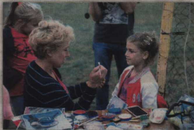
Malowanie twarzy na festynach to już tradycja.

towali mnóstwo konkursów dla dzieci, na których dominowały oczywiście ziemniaki. Ze specjalnego worka pełnego piłeczek z zamkniętymi oczami wybierano właśnie ziemniaki. Najmłodszy uczestnik festynu nie mieli jednak najmniejszych trudności z szybkim odnalezieniem ukrytych bylin. W nagrodę każde dziecko otrzymywało