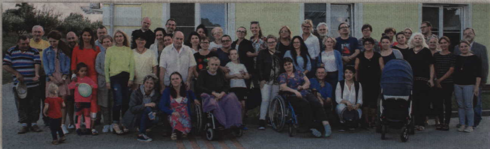
Pracownicy, chorzy oraz wolontariusze spotkali się na pikniku podczas którego poświęcono nowe auto dla domowego hospicjum.

- Starania o rozbudowę hospicjum, ze względu na zwiększające się zapotrzebowanie ze strony mieszkańców, zaczę-