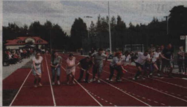
Po uroczystym otwarciu boiska odbyły się również biegi rodzinne, w tym rodzinna sztafeta.