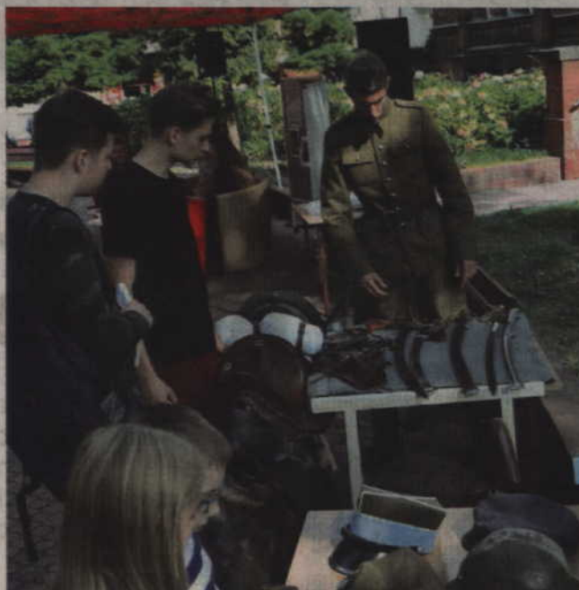
Podczas spotkania podziwiać można było również ekwipunek ulanów.

Narodowemu Czytaniu „Przedwiośnia” towarzyszyły również gry i zabawy adresowane do najmłodszych: statki oraz patriotyczne warcaby. Podczas spotkania prezentowany był również ekwi-