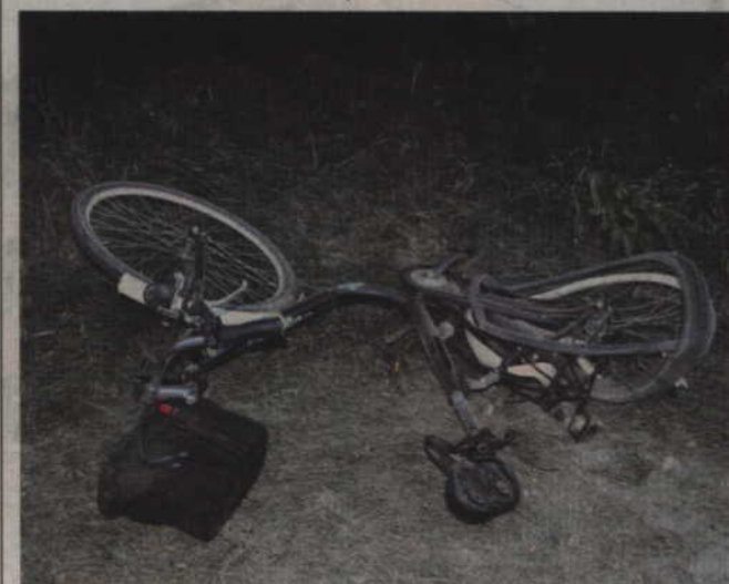
Prawidłowo jadąca rowerzystka przewieziona została do szpitala w Sztumie.