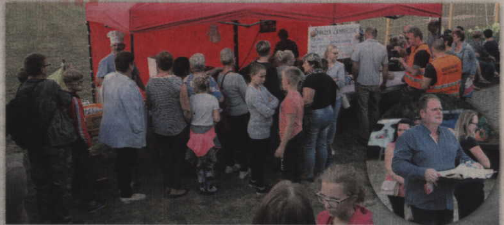
Do stoiska „Ziemniaczany Smaczek” ustawiała się długa kolejka.