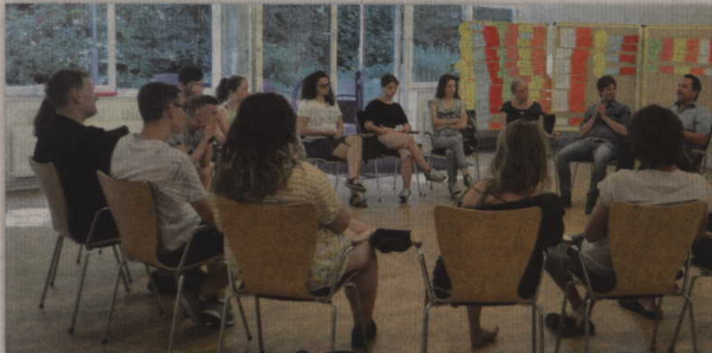
„Team Up!” to projekt dla młodzieży z Ukrainy, Niemiec i Polski, którzy w przyszłości chcą być liderami międzynarodowych projektów.

POWIAT. „Team Up!” to projekt dla młodzieży z Ukrainy, Niemiec i Polski, którzy w przyszłości chcą być liderami międzynarodowych projektów. W projekcie, który odbył się po raz drugi, wzięli udział także młodzi ludzie z powiatu kwidzińskiego. Wszyscy spotkali się w szkoleniowym Bildungsstätte Bredbeck, w powiecie Osterholz.