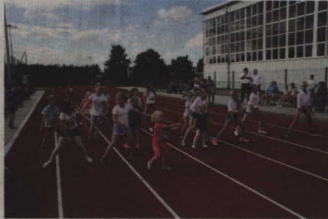
Był czas na otwarcie boiska, pierwszy wspólny bieg i na zatańczenie zumbę.