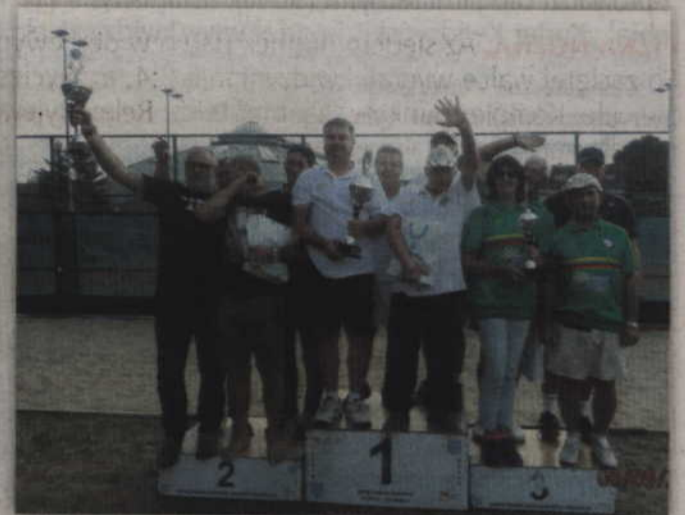
Najlepsze drużyny rywalizujące w turnieju zespołów przyjezdnych.

W efekcie do półfinału trafiły już wyłącznie kwidzyńskie zespoły. „Team 229” Kwidzyn