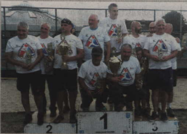
Podium Drużynowych Mistrzostw Kwidzyna w całości zajęli gospodarze. Wygrali gracze „Team 229” Kwidzyn, którzy wyprzedzili TKKF „Celulozę” Kwidzyn oraz drugi zespół „Renawy”.

Jednocześnie przepraszamy za możliwe utrudnienia w ruchu drogowym w obrębie ulic: Chopina, 15 Sierpnia, Warszawskiej, Braterstwa Narodów i Katedralnej.