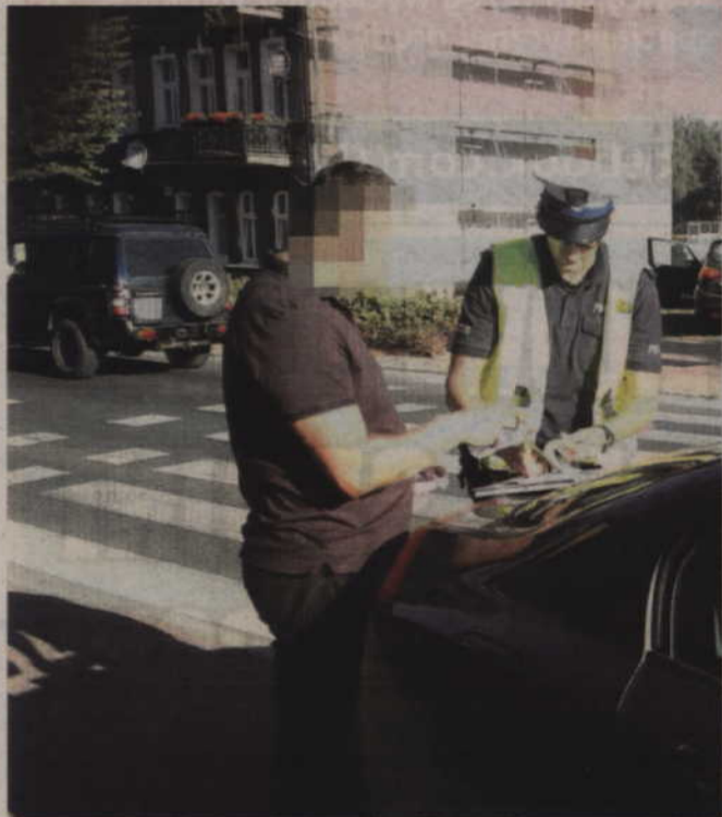
Przeprowadzone badanie potwierdziło, że kierujący renault mieszkaniec Pszczółek był trzeźwy.