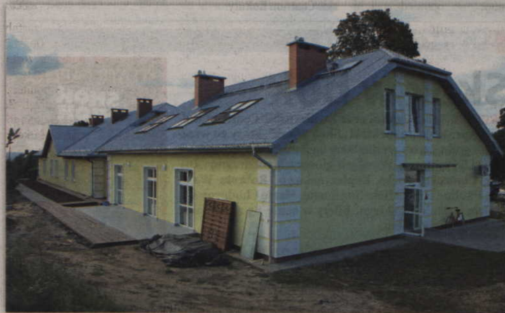
Hospicjum św. Wojciecha w Kwidzynie może już przyjąć 19 pacjentów, to o 8 więcej niż do tej pory. Dodatkowa część została wybudowana ze środków budżetu powiatu kwidzyńskiego.