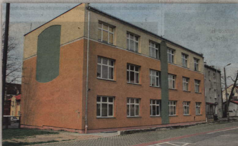
Łaźnia dla bezdomnych mieszkańców miasta powstanie w budynku przy ul. Hallera, który dawniej był siedzibą szkół społecznych.