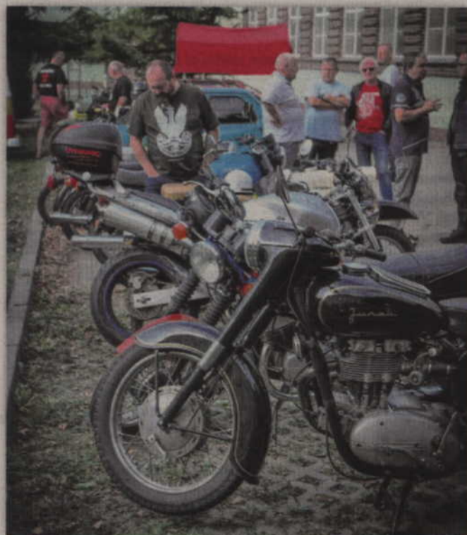
Zabytkowe auta i motocykle można było podziwiać m.in. na parkingu obok urzędu miasta.

KWIDZYN. Ford Ten z 1937 roku okazał się najstarszym pojazdem uczestniczącym w zlocie pojazdów zabytkowych, ciekawych i z czasów PRL. Miłośnicy motoryzacji spotkali się w Kwidzynie już po raz siódmy. Organizatorem zlotu jest Kwidziński Klub Motorowy.