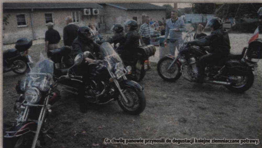
Co chwilę panowie przynosili do degustacji kolejne ziemniaczane potrawy.