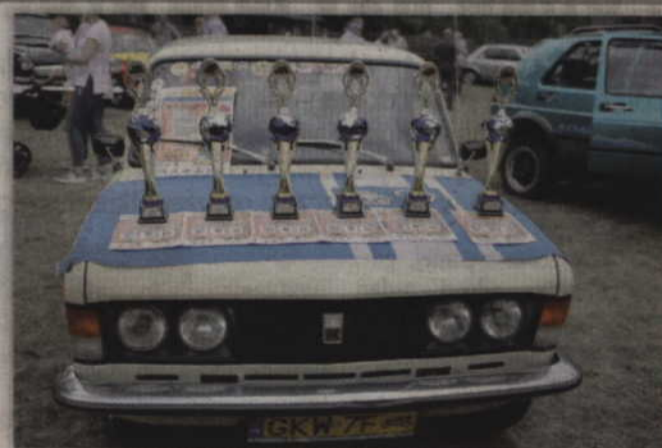
Podczas zlotu wyróżnione zostały pojazdy w sześciu w sześciu kategoriach. Wybrano między innymi najstarszy i najładniejszy pojazd.