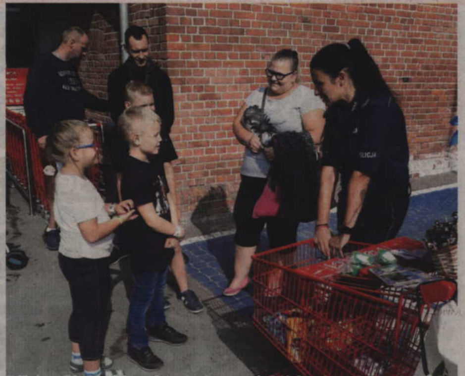
Kwidzyńscy policjanci wspólnie z marketem Carrefour przypominali dzieciom m.in. o podstawowych zasadach ruchu drogowego.