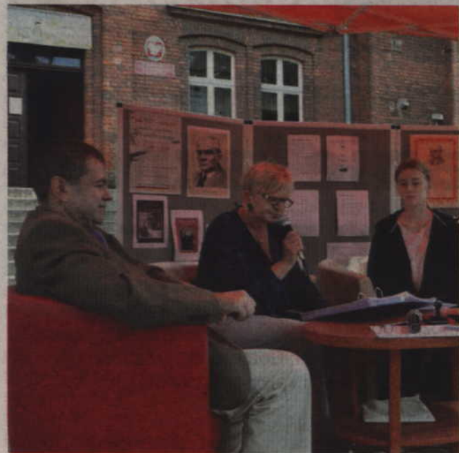
Wspólne czytanie „Przedwiośnia” odbywało się przed budynkiem kwidzyńskiej biblioteki.

KWIDZYN. W minioną sobotę, 8 września, mieszkańcy Kwidzyna przyłączyli się do ogólnopolskiej akcji Narodowego Czytania odbywającej się co roku pod honorowym patronatem Pary Prezydenckiej. Przy specjalnie przygotowanym stoliku, umiejscowionym przed budynkiem Biblioteki Miejsko-Powiatowej, chętni czytali na głos „Przedwiośnie” Stefana Żeromskiego.