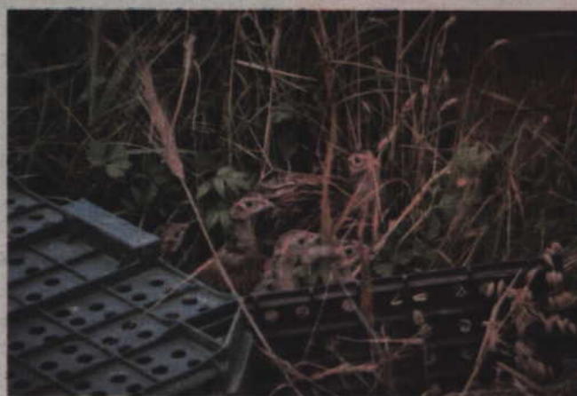
Leśnicy wypuścili na wolność 200 kuropatw.

ptakiem teraz stała się w wielu rejonach kraju bardzo nieliczna. Do spadku liczebności przyczyniły się m.in. chemizacja rolnictwa i wzrost liczebności drapieżników, zwłaszcza lisów. Nie można się więc dziwić, że leśnicy próbują ponownie wprowadzić tego ptaka na nasze tereny. W tym celu służy właśnie program wsiedlania kuropatw. Ptaki, a dokładnie 200 sztuk, wypuszczono na terenie przygotowanych przez Nadleśnictwo Kwidzyn remiz, pozostawionych przez rolników nieużytków i w okolicy śródpolnych zakrzaczeń. Jak podkreślają leśnicy, od kilku lat