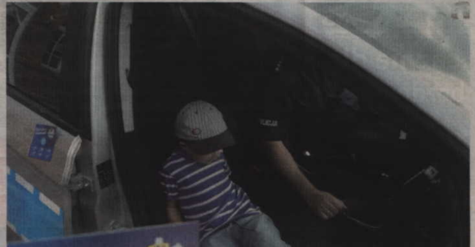
Atrakcją dla najmłodszych była możliwość wejścia do policyjnego radiowozu.