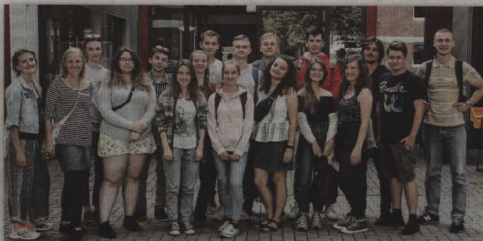
Wszyscy spotkali się w szkoleniowym Bildungsstätte Bredbeck, w powiecie Osterholz.

szu na swoje projekty, metody pracy z grupą oraz poznawali niezbędne etapy przygotowywania projektów. Niezwykle ciekawe okazały się dyskusje, w trakcie trwania seminariów