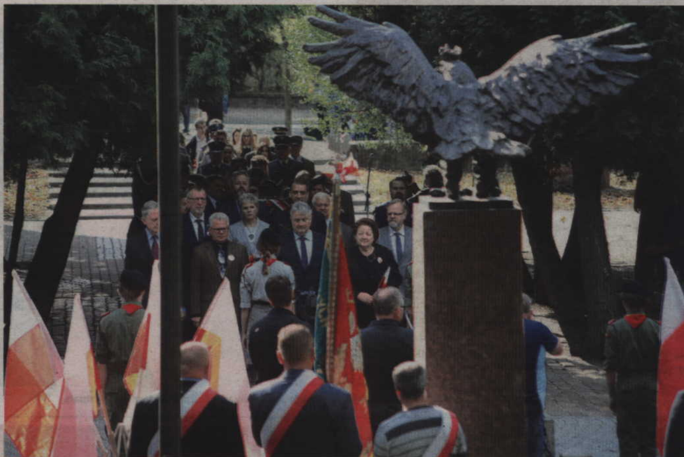
(fox) Delegacje złożyły wiązkanki kwiatów na Grobie Nieznanego Żołnierza.

Podczas spotkania odśpiewano także Hymn Polski oraz Hymn Sybiraków. Po złożeniu kwiatów i wieńców na Grobie Nieznanego Żołnierza zebrałi przeszli także ulicami miasta do kwidzyńskiej katedry, gdzie odprawiona została uroczysta Msza święta. W uroczystym orszaku oprócz kombatantów znaleźli się także przedstawiciele samorządów, szkół, organizacji oraz harcerze. Nie zabrakło także mażorettek oraz Orkiestry Dętej „Helikon”.