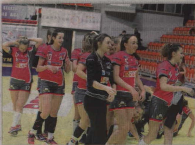
W meczu inauguracyjnym nowy sezon 1 ligi kobiet kwidzynianki pewnie pokonały PR URBIS Gniezno.