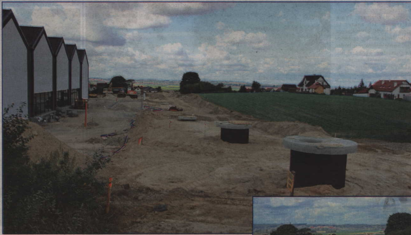
(s) Zbudowany zostanie odcinek o długości ok. 800 m. Inwestycja powinna zostać zakończona w tym roku. Jej koszt to ok. 4,2 mln zł.

Zbudowany zostanie odcinek o długości ok. 800 m. Wykonawcą jest Kwidzyńskie Przedsiębiorstwo Robót Drogowo-Budowlanych. Inwestycja powinna zostać zakończona w tym roku. Jej koszt to ok. 4,2 mln zł.