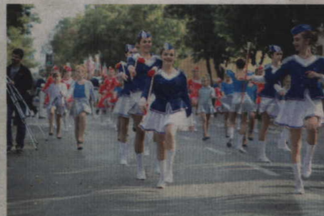
Orszak prowadziły trzy grupy mażorettek.