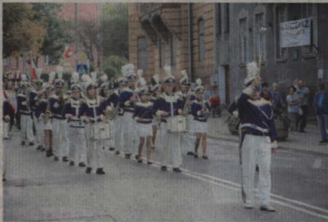
Nie zabrakło także Orkiestry Dętej „Helikon”.