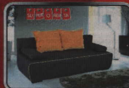
Sofa LENY 3DL - 899 zł