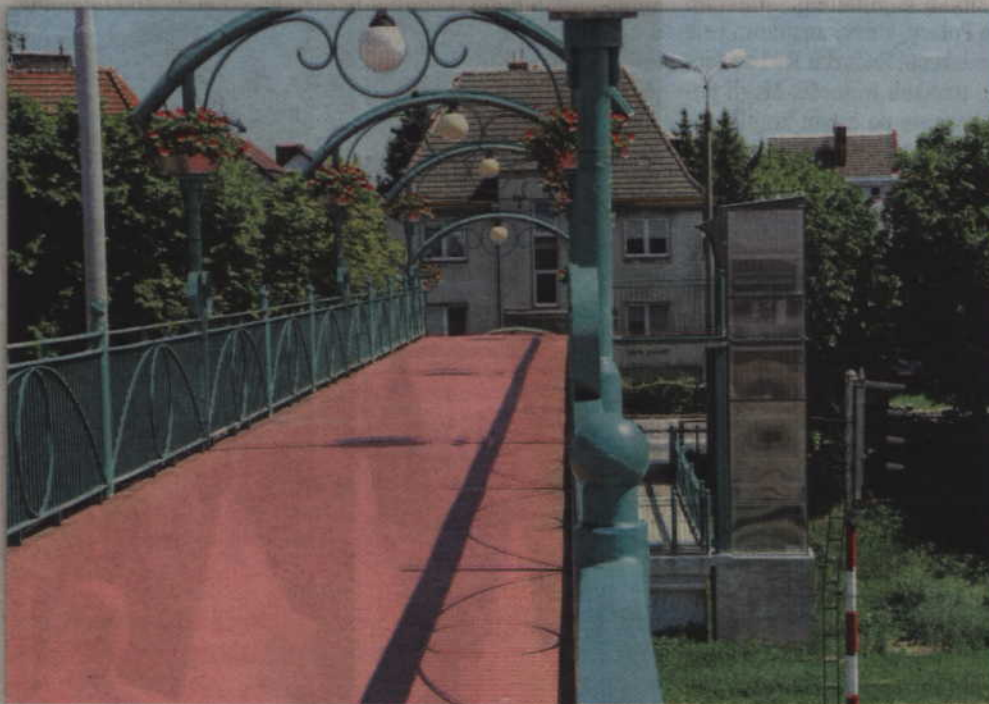
Konstrukcja wind jest dość wysoka i przez to narażona na wstrząsy.

wstrząsy. Mechanizm okazał się zbyt wrażliwy. Aby nie doprowadzić do ich uszkodzenia do czasu zakończenia prac wyłączyliśmy windy, ale po ponownym uruchomieniu będą one wymagały regulacji. Wystarczy kilkunastocentymetrowe przesunięcia w mechanizmie śrubowym, aby dochodziło do zacinania się windy. Poza tym konstrukcja windy jest dość wysoka,