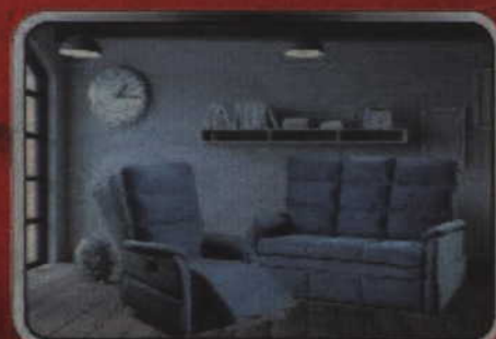
Zestaw PATIO z fotelem TV