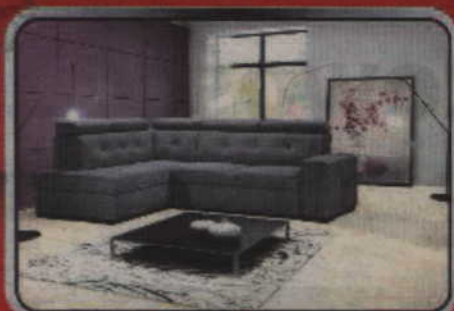
Narożnik METRO - 2899 zł