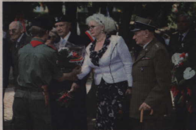
Kwiaty złożyli m.in. członkowie Koła Związku Kombatantów RP i Byłych Więźniów Politycznych.