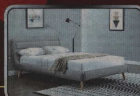
Łoże ELANDA - 1029 zł

KWIDZYN, ul. Wschodnia 2d - obok Pizzy Piwnica Tel. 500 771 839 www.doeringmeble.eu