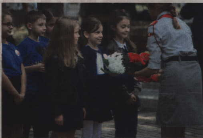
Kwiaty od delegacji odbierali harcerze.