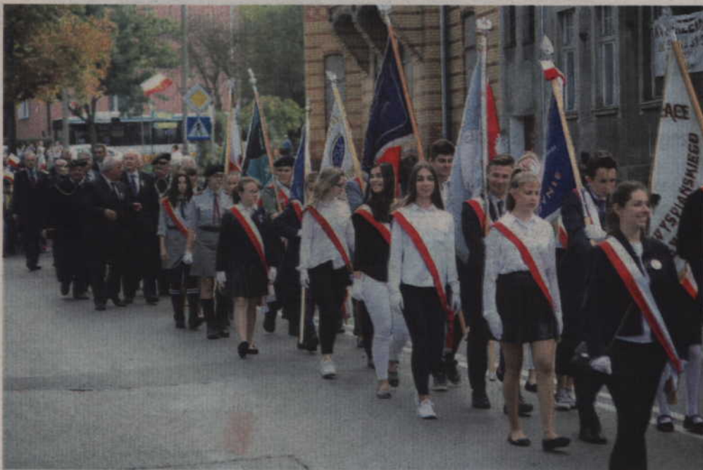
Wśród zebranych byli m.in. samorządowcy oraz przedstawiciele szkół i organizacji.