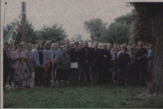
W uroczystości wzięli udział wierni uczestniczący w odprawianej Mszy św.