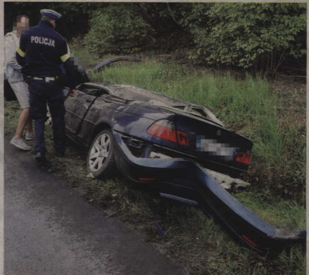
26-letni kierowca bmw próbując wyprzedzić auto doprowadził do zderzenia z wyprzedzającym pojazdem.