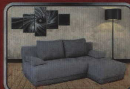
Narożnik HAGI - 1350 zł