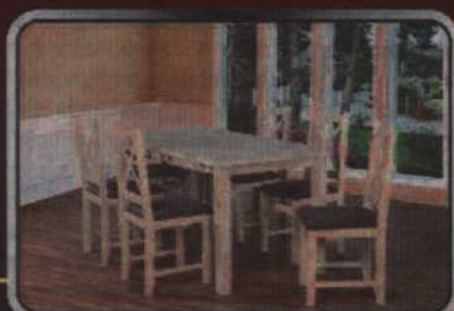
Stół + 6 krzeseł - 1359 zł