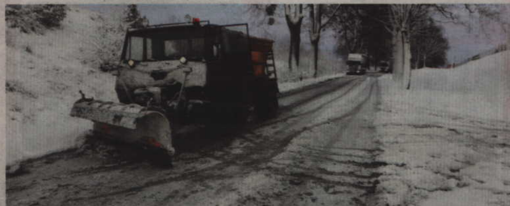
Władze powiatu wyłoniły firmy dla dwunastu z trzynastu rejonów zimowego utrzymania dróg. W jednym przypadku konieczne było powtórzenie przetargu.

-Wyłoniliśmy firmy dla dwunastu z trzynastu rejonów zimowego utrzymania dróg. Tylko w przypadku jednego rejonu powtarzamy przetarg. Przypomnę, że w ubiegłym roku przetargi ogłaszaliśmy kilka razy, aby znaleźć wykonawców. W tym roku umowy podpisujemy na trzy lata i będziemy płacić za gotowość. Dotychczas płaciliśmy tylko za wykonaną pracę, co powodowało coraz więcej problemów ze znalezieniem oferentów. Wykonawca musi zgromadzić materiał do posypywania i zapłacić pracownikom za dyżury, bez wzglę-