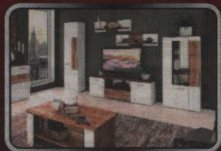
Zestaw mebli Candy