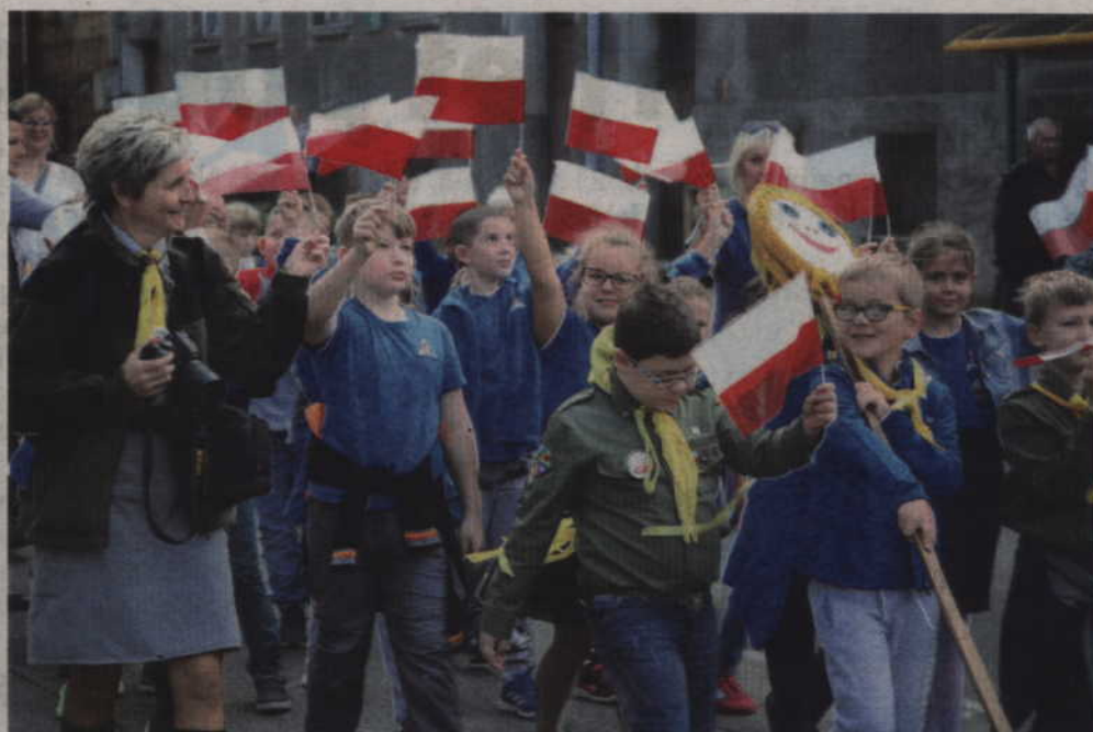
Na uroczystości przybyli także uczniowie SP 5 w Kwidzynie.