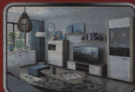
Zestaw mebli DAVIN