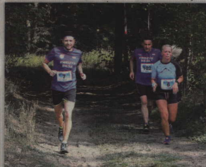
Trasa zawodów przebiegała po okolicach TRW „Miłosna”.