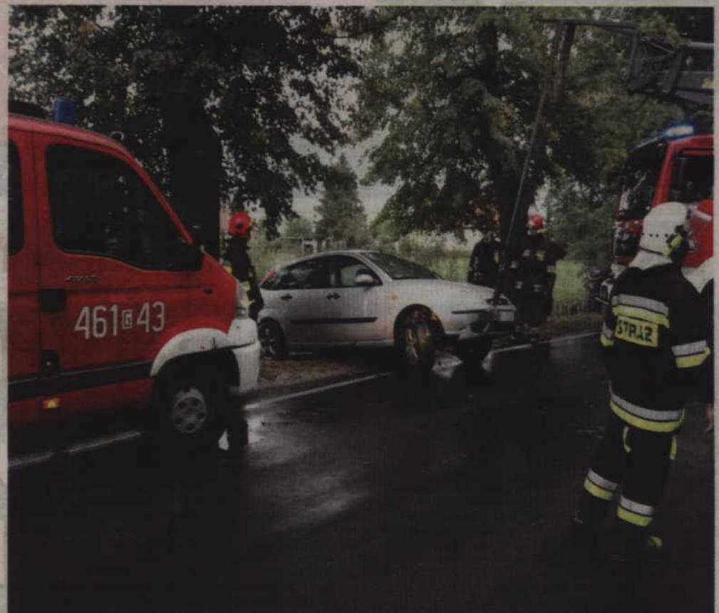
W Wandowie kierowca stracił panowanie nad autem i wjechał do stawu.