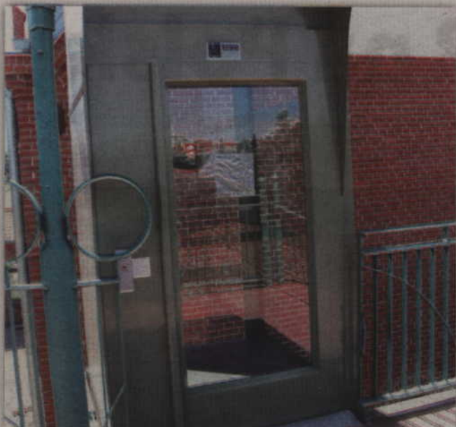
Wstrząsy, które pojawiły się podczas prac ziemnych przy dworcu, spowodowały rozregulowanie mechanizmu windy.

KWIDZYN. Konstrukcja wind zamontowanych przy kładce nad torami zostanie wzmocniona. Windy zostały wyłączone kilka miesięcy temu, gdyż praca ciężkich maszyn używanych przy wyburzeniu przejścia podziemnego łączącego perony kolejowe powodowała zbyt duże wstrząsy. Powodowało to częste awarie i mogło spowodować trwałe uszkodzenie mechanizmów nowych wind.