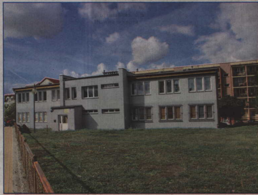
(s) Termomodernizacja budynku przy ul. Odrowskiego została zakończona. Samorząd miasta zamierza jednak urządzić przy nim plac zabaw.

Zakres prac, dotyczący wyremontowanego budynku, objął między innymi termomodernizację całego obiektu. Wyremontowany został dach. Wymieniona została część grzejników. Wyremontowano również instalację elektryczną. Inwestycja kosztowała ok. 300 tys. zł.