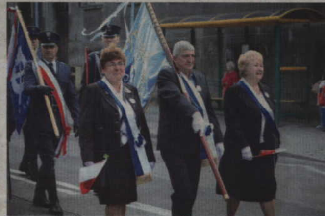
Delegacje i poczty sztandarowe udały się ulicami miasta do kwidzyńskiej Katedry.