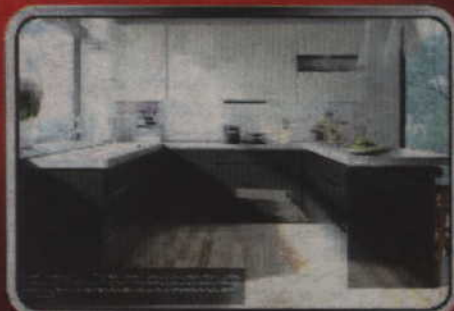
Kuchnie na wymiar