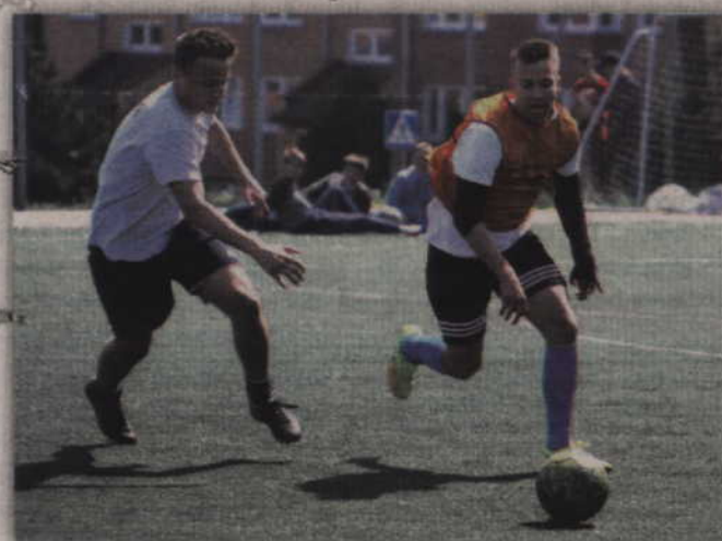
Osiedlowe turnieje „Renawy” odbywają się dwa razy do roku.

TURNIEJ NA ORLIKU PRZY UL. KAZIMIERZA WIELKIEGO