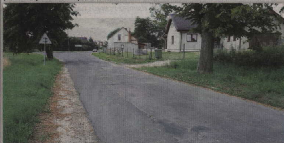
Modernizacja drogi Wandowo-Nowa Wioska obejmie odcinek o długości ok. 2 km.

POWIAT. Modernizacja drogi Wandowo-Nowa Wioska została rozpoczęta wcześniej niż planowano. Koszt tej inwestycji to ok. 1,3 mln zł. Pieniądze pochodzą z budżetu powiatu.