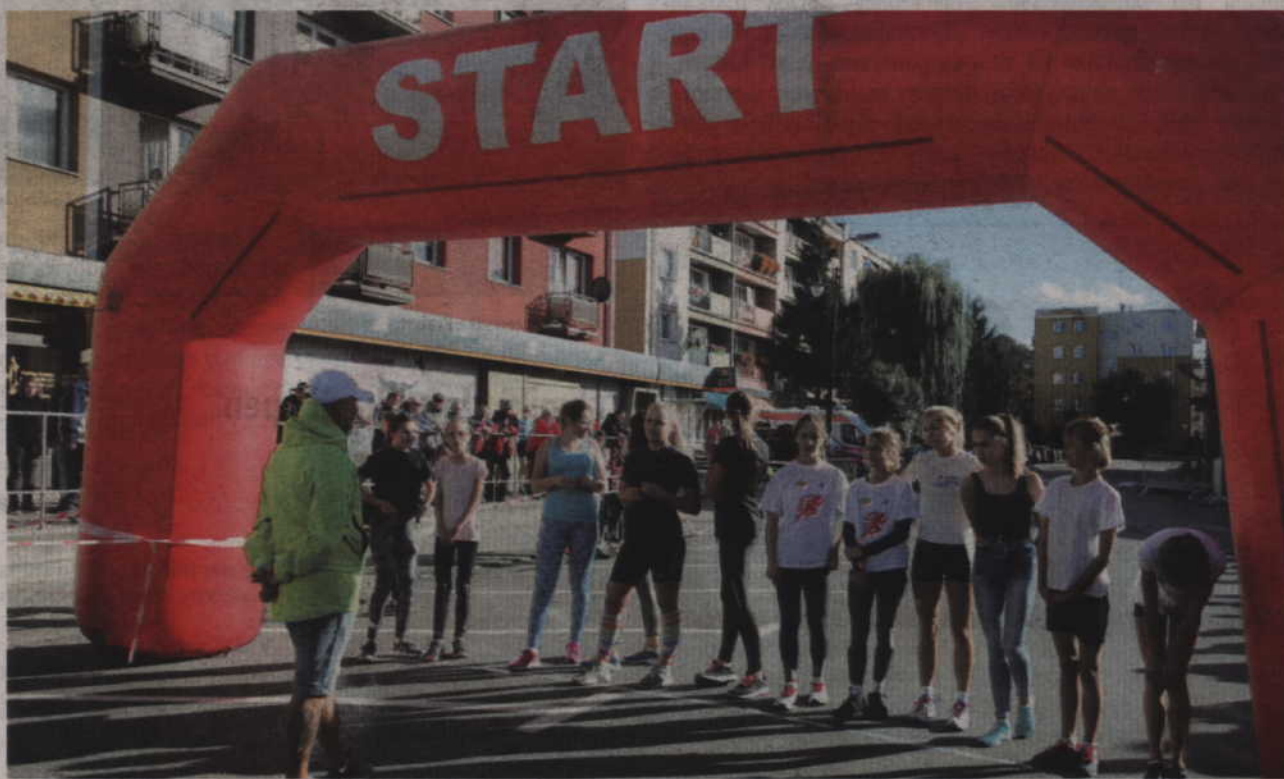
Biegowi głównemu zawsze towarzyszą zawody, w których startują przedszkolaki oraz młodzież szkolna.