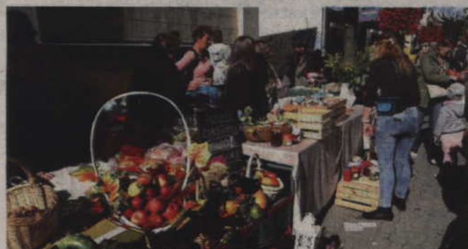
Uczniowie kwidzyńskich szkół jako co roku sprzedawali ciasta, przetwory i inne przysmaki.