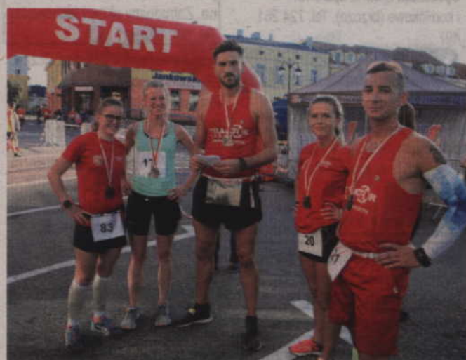
Już po biegu można odpocząć i cieszyć się osiągniętymi czasami.