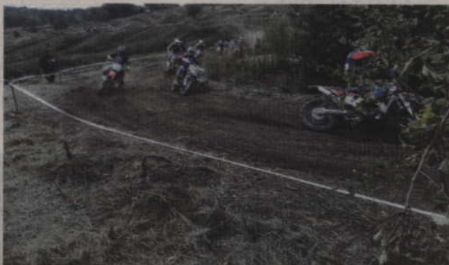
Zawody w Kaliszu Pomorskim odbywały się na 8 km trasie.