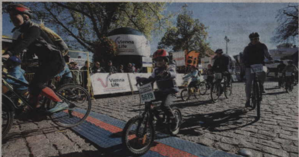
W Parady Rodzinnej jak zwykle uczestniczyli także najmłodszy sympatycy jazdy rowerem.