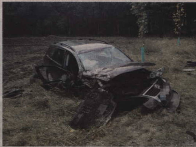
Do wypadku doszło w Antoninie, na trasie Prabuty – Sztum.

GMINA PRABUTY. Kierująca vw passatem uderzyła w przydrożne drzewo i dachowała na poboczu drogi Prabuty – Sztum. W wyniku wypadku ranne zostały trzy osoby, które trafiły do szpitala. Bezpośrednią przyczyną zdarzenia była najprawdopodobniej pęknięta opona.