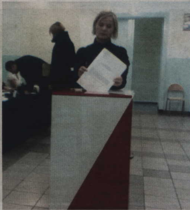
Do um wyborczych pójdziemy 19 października.

Oprócz tego, że 4 radnych uzyskało już mandat rad-