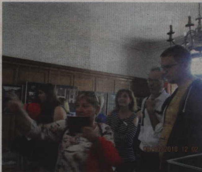
Kwidzyńska młodzież z I LO ponownie odwiedziła Celle.

KWIDZYN. Pierwsze dni nowego roku szkolnego młodzież I LO spędziła w Celle, realizując projekt wymiany szkolnej z zaprzyjaźnionym Gymnasium Ernestinum. Wymiana, trwająca już od 25 lat, pozwala uczniom przyrzeć się z bliska codziennemu życiu naszych zachodnich sąsiadów, poznać kulturę i historię ich kraju.