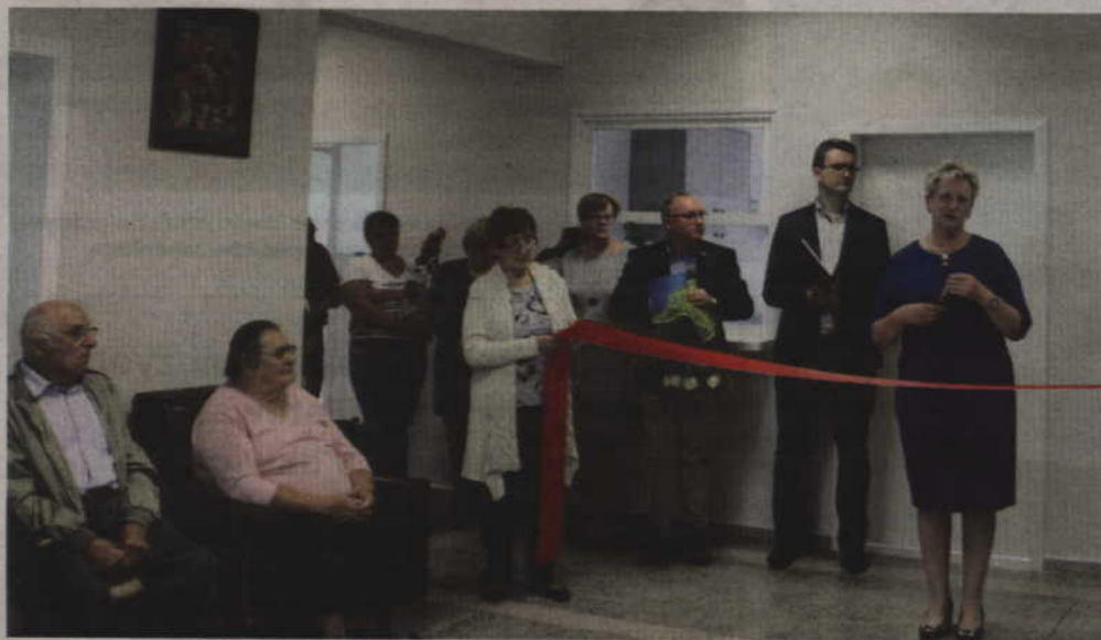
Centrum Usług Integracji Społecznej w Gminie Sadlinki to zupełnie nowa instytucja na powiatowej mapie integracji seniorów.