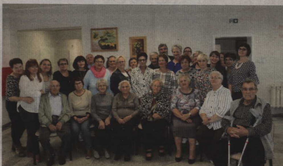
Na otwarciu centrum nie mogło zabraknąć adresatów tej instytucji czyli sadlińskich seniorów.