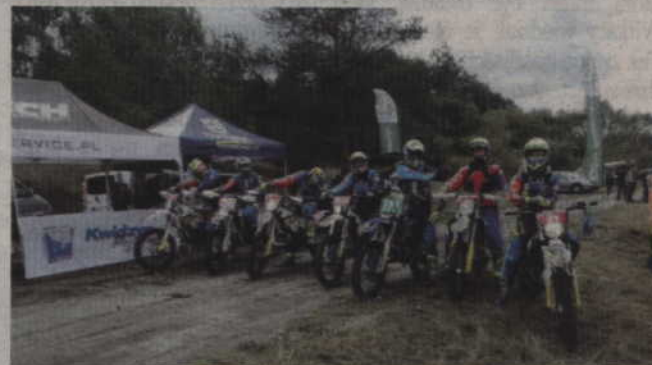
KKM Kwidzyn został mistrzem Polski w klasyfikacji klubowej.