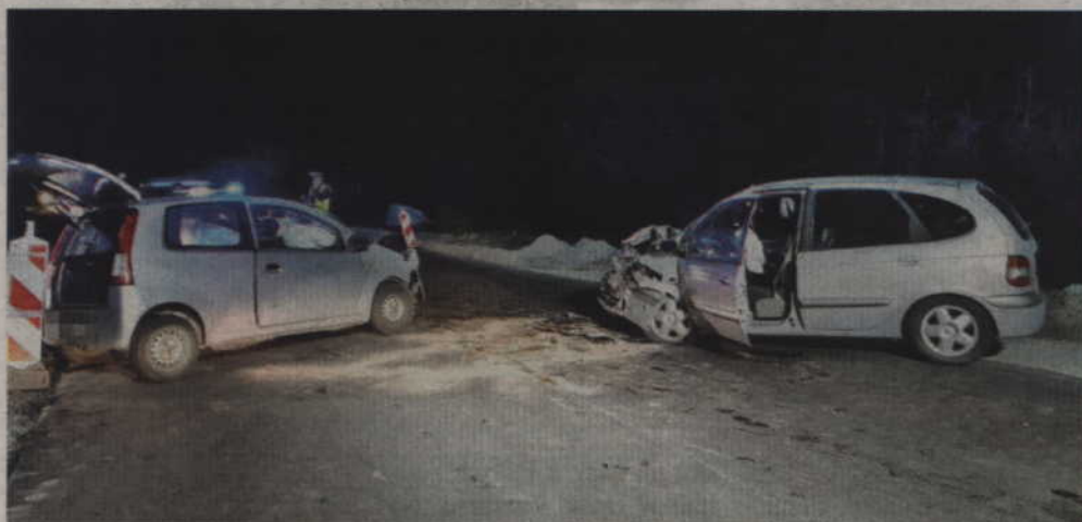
Do czołowego zderzenia aut doszło na modernizowanej trasie Kwidzyn - Prabuty.

GMINA KWIDZYN. Kierowca daihatsu zjechał na przeciwny pas ruchu i czołowo zderzył się z prawidłowo jadącą 44-latką prowadzącą renault. Ranni kierowcy zostali przetransportowani do szpitala w Kwidzynie. Policjanci ustalają natomiast przyczyny i okoliczności tego zdarzenia, także apelują o ostrożność na drodze.