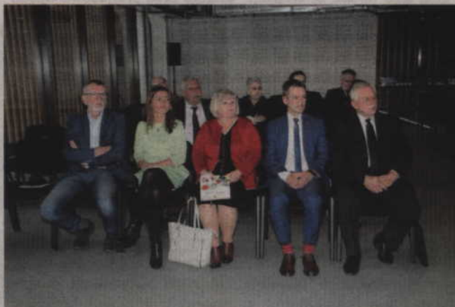
Umowy dotyczące dofinansowania ze środków unijnych montażu instalacji odnawialnych źródeł energii zostały podpisane w Kwidzyńskim Parku Przemysłowo-Technologicznym.