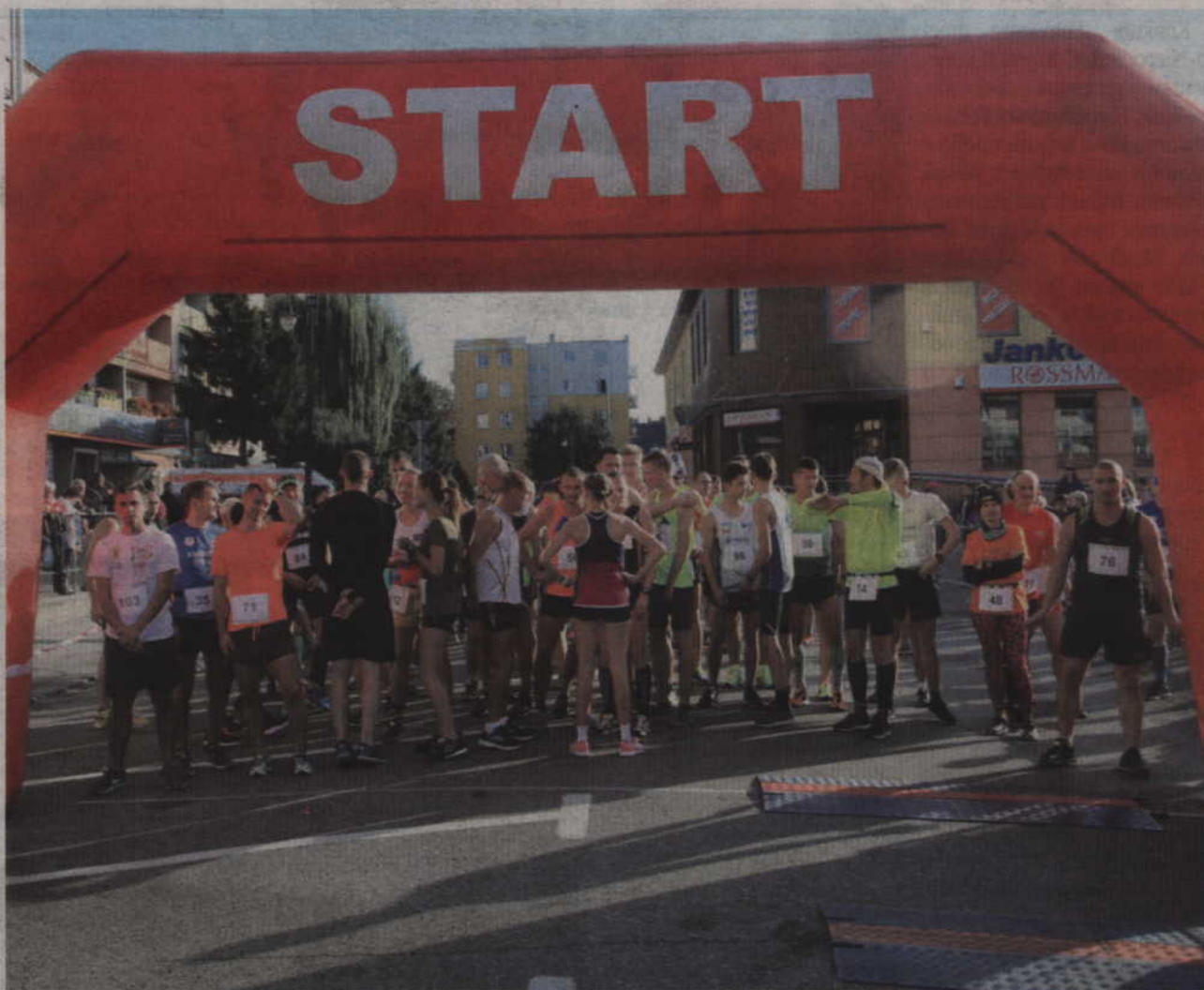
W jubileuszowym biegu „Liwa Cup” pobiegło 119 zawodników.