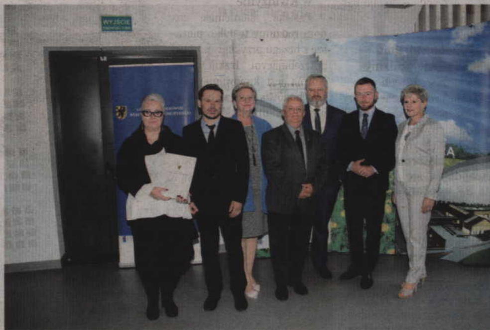
Umowę na „Montaż mikroinstalacji odnawialnych źródeł energii na terenie gmin: Kwidzyn, Sadlinki, Ryjewo, Gardeja”, podpisali przedstawiciele Powiślańskiej Regionalnej Agencji Zarządzania Energią.