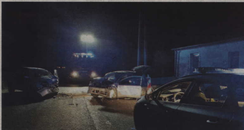
Na czas działań służb mundurowych ruch na drodze został zablokowany, a kierowcy musieli korzystać z wyznaczonych objazdów.

W poniedziałek (1 października), około godz. 19.00, dyżurny kwidzyńskiej Komendy został powiadomiony, że na łuku drogi wojewódzkiej nr 521, w miejscowości Licze, doszło do czołowego zderzenia dwóch pojazdów. Na miejsce wypadku natychmiast skierowani zostali policjanci oraz inne służby ratunkowe.