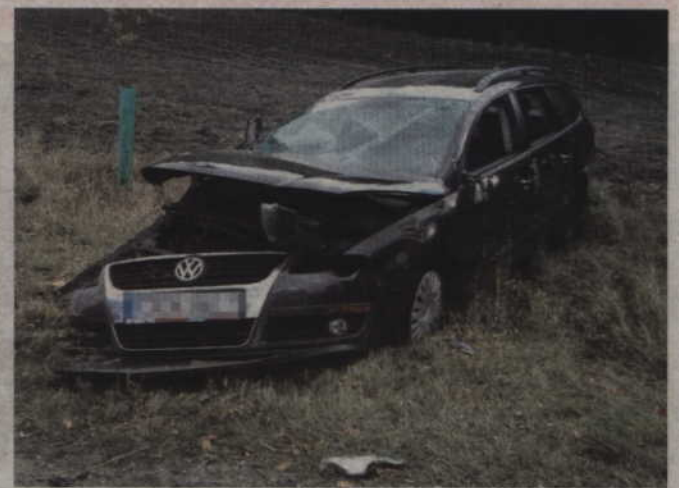
Poszkodowana kierująca passatem oraz dwie pasażerki auta trafiły do szpitala.

W piątek, 28 września, ok. godz. 11.00, dyżurny Komendy Powiatowej Policji w Kwidzynie otrzymał zgłoszenie o wypadku drogowym w miejscowości Antonin, znajdującej się na trasie Prabuty – Sztum. Na miejsce natychmiast skierowani zostali policjanci. Mundurowi zabezpieczyli miejsce wypadku, przeprowadzili oględziny oraz sporządzili dokumentację fotograficzną.