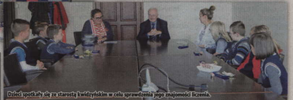
Dzieci spotkały się ze starostą kwidzyńskim w celu sprawdzenia jego znajomości liczenia.