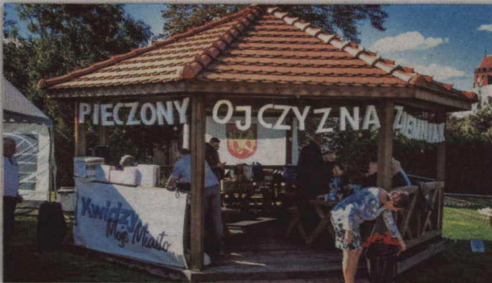
Członkowie i sympatycy Towarzystwa Kulturalnego Ludności Niemieckiej „Ojczyzna” bawili się podczas rocznicowego „Święta pieczonego ziemniaka”.