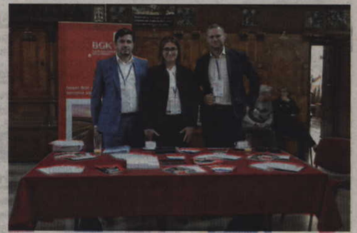
Zespół Banku Gospodarstwa Krajowego udzielał na miejscu informacji i porad dotyczących finansowania inwestycji.