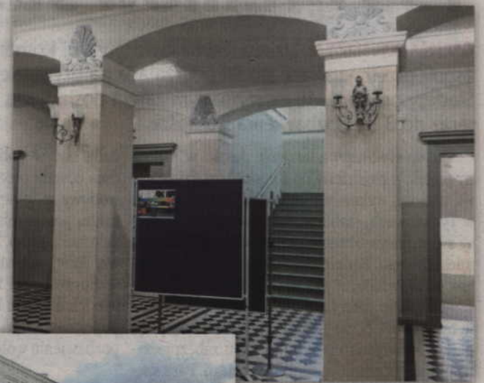
Wicestarosta Andrzej Fortuna twierdzi, że modernizacja budynku ZSP nr 1 została już ukończona.

choć zwracaliśmy się o przyspieszenie prac w tym zakresie. Uważam, że przy tak ogromnej inwestycji przesunięcie terminu o kilka dni nie jest wielkim problemem, tym bardziej, że wszyscy czekaliśmy wiele lat na możliwość modernizacji tego obiektu. Widać zresztą jak duży