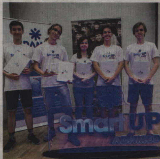
Uczestnicy programu „ADAMED SmartUp”.