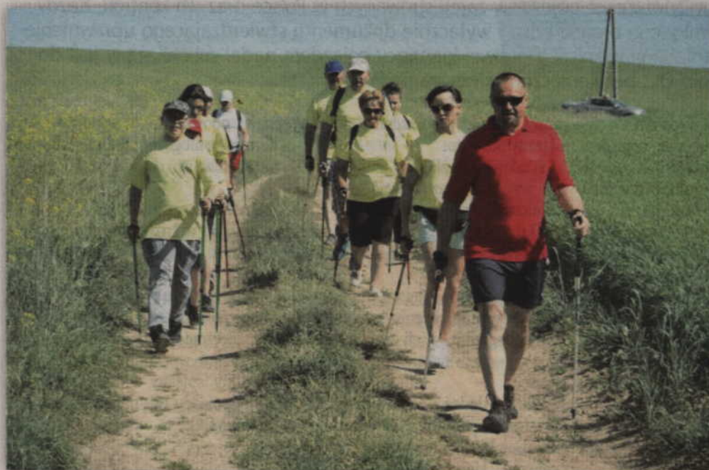
Uczestnicy marszu dla Niepodległej wyruszają na trasę w Opaleniu.

GMINA KWIDZYN. Gminny Ośrodek Kultury w Kwidzynie, Szkoła Podstawowa w Nowym Dworze oraz Stowarzyszenie „Zakątek Dankowo” zapraszają na „Marsz Nordic-Walking Dla Niepodległej”. Impreza odbędzie się w najbliższą sobotę, 13 października na trasie Opalenie – Nowy Dwór. Wstęp wolny.