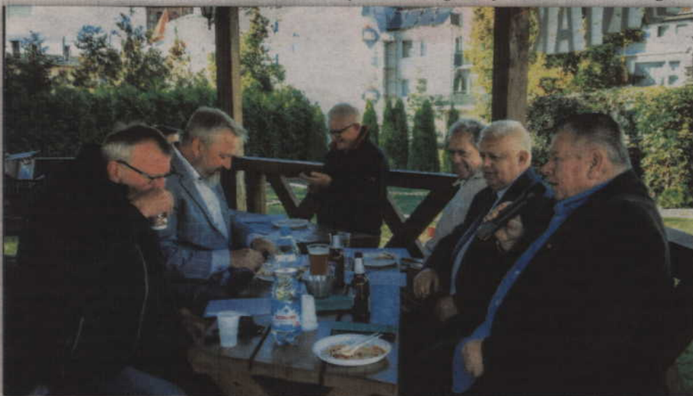
W imprezie wzięło udział ok. 100 osób, w tym także przedstawiciele samorządów.