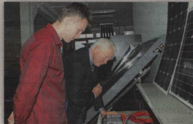
Starosta Jerzy Godzik uważa, że wykorzystanie urządzeń może w przyszłości zapewnić uczniom dobrze płatną pracę.

Starosta kwidzyński życzył młodzieży, aby dobrze wykorzystwała sprzęt do nauki, bo to w przyszłości może zapewnić im dobrze płatną pracę. Wszyscy uczestnicy uroczystego otwarcia pracowni mogli zapoznać się z urządzeniami, z których już korzysta młodzież kształcąca się w Centrum Kształcenia Zawodowego i Ustawicznego. (jk)