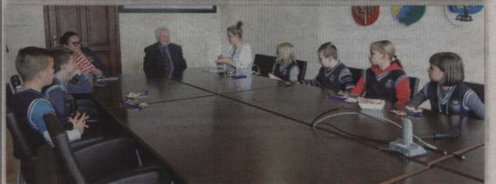
Podczas wizyty zadawały staroście pytania nie tylko pytania matematyczne, ale także związane z powiatem kwidzyńskim oraz pracą starosty.