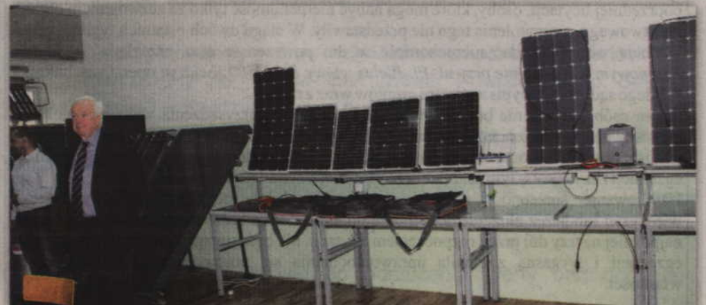
Pracownia odnawialnych źródeł energii.