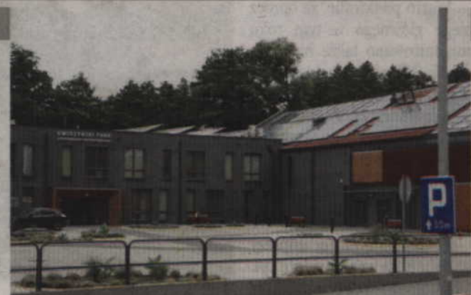
Konferencja odbędzie się w Kwidzyńskim Parku Przemysłowo-Technologicznym w Górkach.