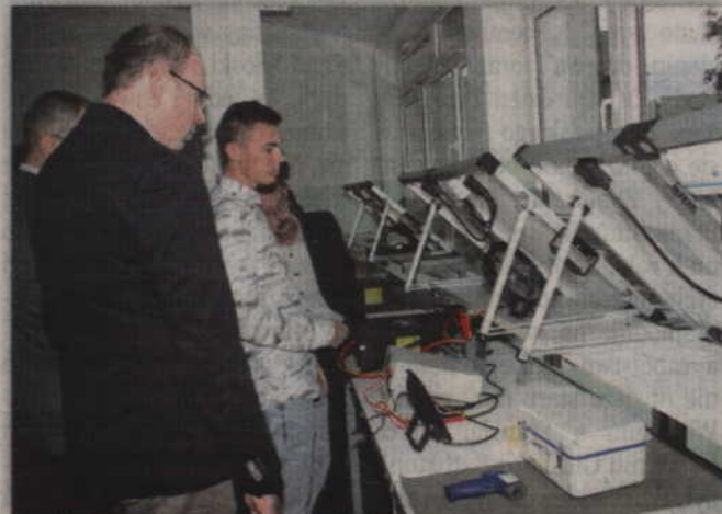
W ramach projektu zakupiono nowoczesne urządzenia do pracowni odnawialnych źródeł energii.