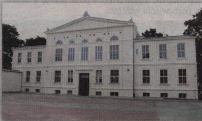
Zakończyła się modernizacja wnętrza budynku, w którym mieści się Zespół Szkół Ponadgimnazjalnych nr 1 w Kwidzynie.

Dłużej potrwają prace modernizacyjne w budynku zajmowanym przez