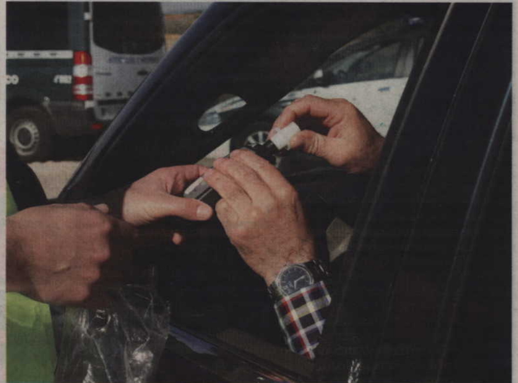
Badanie kierowcy hondy civic na zawartość alkoholu wykazało 2,3 promila.