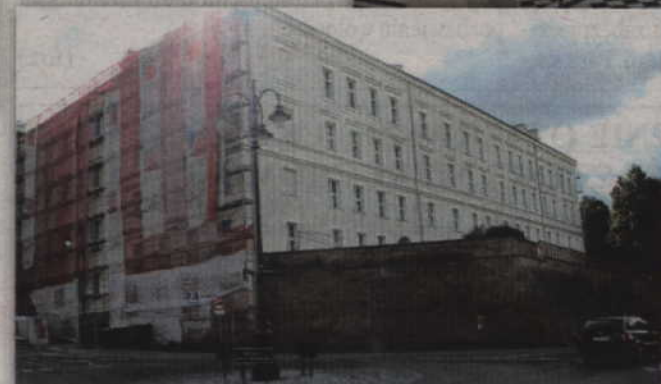
Dłużej potrwają prace modernizacyjne w budynku zajmowanym przez Zespół Szkół Ponadgimnazjalnych nr 2.