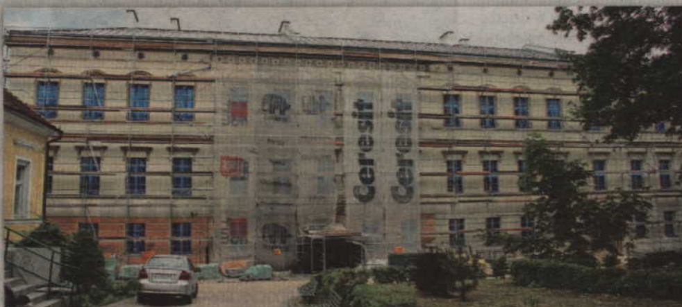
Modernizacja zabytkowego budynku ZSP nr 2 ma za zakończyć się 18 grudnia.

- Wykonawca stwierdził, że pierwszy powód to warunki w okresie letnim. Bardzo wysokie temperatury nie pozwoliły na wykonanie niektórych prac. Poza tym podczas realizacji inwestycji wprowadzonych zostało sporo zmian, które wymagały nowych pozwoleń na budowę. Dotyczyły one zakresu prac związanych z ochroną konserwatorską. To m.in. zmiana kolorystyki czy ukształtowania placu przed budynkiem. Trzeci element, który zdecydował, że inwestycja nie mogła zakończyć się w terminie, to przyłącze energetyczne o większej mocy, które jest niezbędne do funkcjonowania wszystkich urządzeń w szkole. To zadanie Zakładu Energetycznego, który ma długi termin wykonywania tego typu prac, przekraczający nawet rok. Mieliśmy obiecanie, że przyłącze zostanie wykonane szybciej, ale niestety nastąpiło do grudnia tego roku. W momencie podpisywania umowy, nie można było tego przewidzieć. Na wniosek