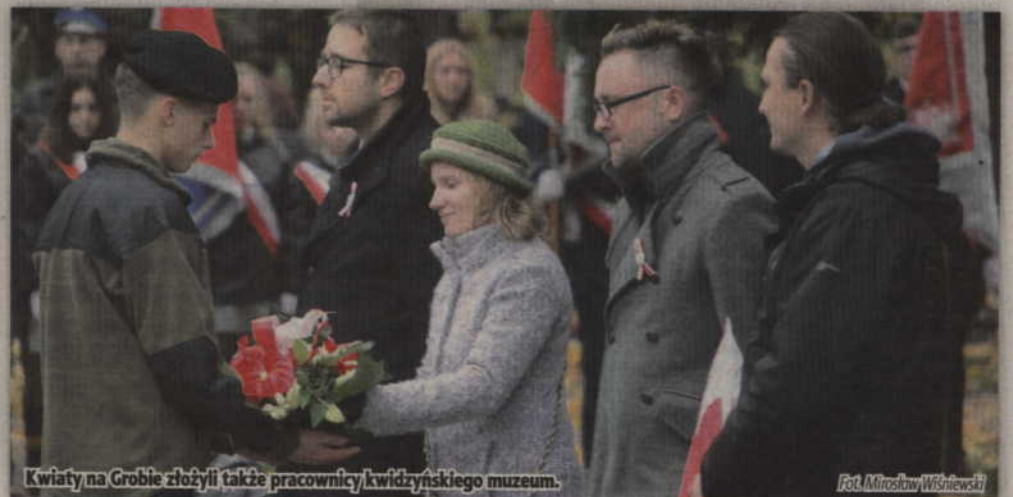
Kwiaty na Grobie złożyli także pracownicy kwidzyńskiego muzeum.