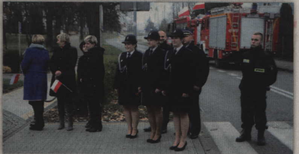
W uroczystym odsłonięciu tablicy pamiątkowej w Gardeji wzięli udział również strażacy – ochotnicy.

Po poświęceniu tablicy, delegacje z gardejskich szkół, przedstawiciele gminnych instytucji, strażacy – ochotnicy i mieszkańcy złożyli także wiązanki kwiatów i zapalili znicze. Nie był to jednak koniec gardejskich obchodów związanych z odzyskaniem niepodległości. W następnej kolejności udano się do pobliskiej szkoły, gdzie odbyła się uroczysta akademicka poświęcona wydarzeniom sprzed stu lat. (RB)