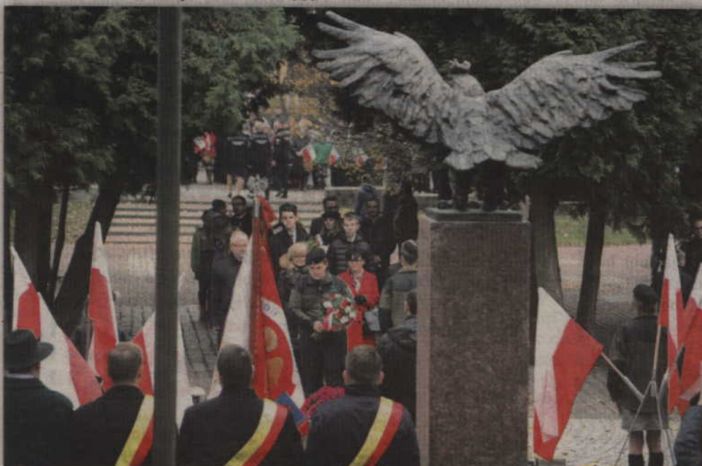
Uroczystości główne odbyły się na Skwerze Kombatantów.

cy polskiej tradycji niepodległościowej, sięgamy do skarbnicy dokonań naszych walecznych przodków. (...) Mieszkańcy powiatu kwidzyńskiego, niech bohaterowie walk o niepod-