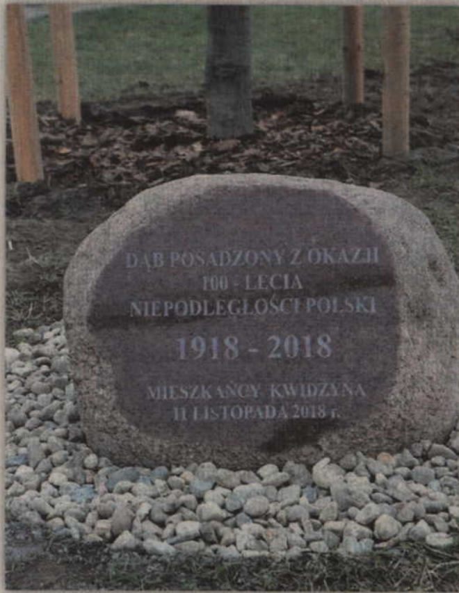
Tablica upamiętniająca posadzenie jubileuszowego dębu.