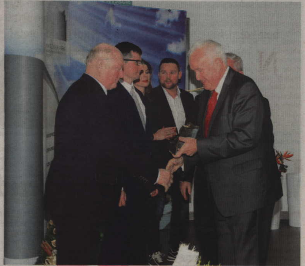
Nagroda dotycząca przedsiębiorczości przyznawana jest w kategoriach: przedsiębiorca roku i przedsiębiorca innowacyjny, a nagroda dotycząca rynku pracy w kategorii promocja zatrudnienia.