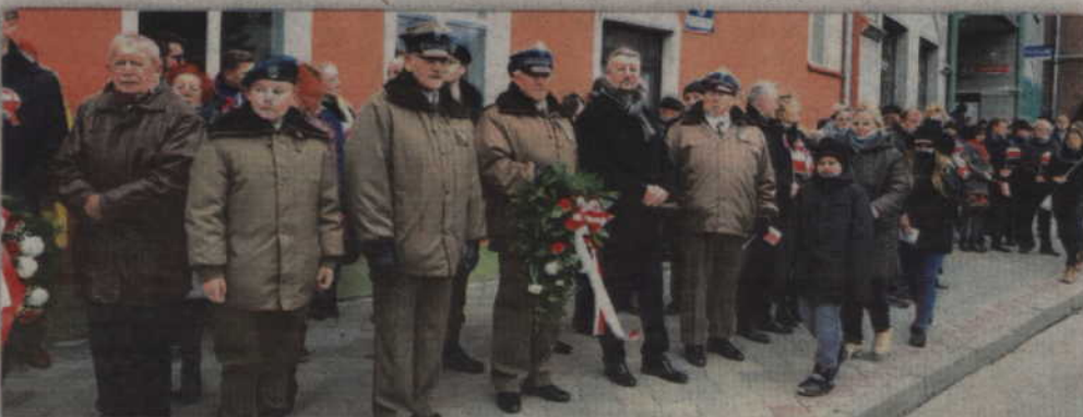
Żołnierze rezerwy Wojska Polskiego złożyli wiązanki kwiatów i zapalili znicze przy prabuckim obelisku znajdującym się przy ul. Kwidzińskiej.