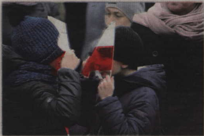
Młodzi wykorzystali chorągiewki do zabawy.