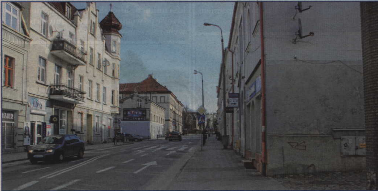
Ulicę Braterstwa Narodów czeka modernizacja. Przy ulicy pojawi się więcej zieleni.

Planowana jest modernizacja ulicy Braterstwa Narodów. Gotowa jest koncepcja przebudowy. Przy ulicy ma się pojawić zieleń, której obecnie brakuje.