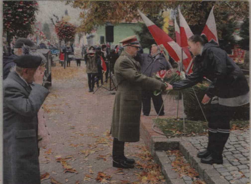
Wojskowi oddali hołd Józefowi Piłsudskiemu. red. tech. BR