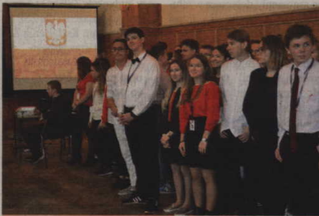
Społeczność ZSO nr 1 włączyła się do akcji bicie rekordu w śpiewaniu Hymnu.

KWIDZYN. Społeczność Zespołu Szkół Ogólnokształcących nr 1 w Kwidzynie włączyła się do wspólnego świętowania stulecia odzyskania przez Polskę niepodległości. Licealiści przyłączyli się do akcji Ministerstwa Edukacji Narodowej w bicie rekordu w odśpiewaniu czterech zwrotek Mazurka Dąbrowskiego.