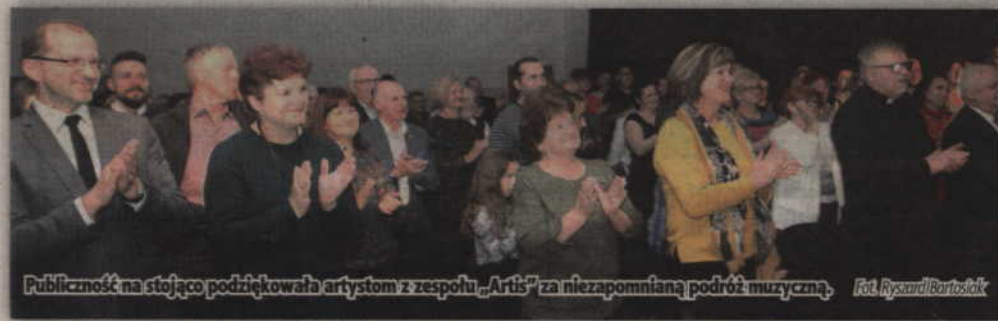
Publiczność na stojąco podziękowała artystom z zespołu „Artis” za niezapomnianą podróż muzyczną.

niepodległości, w programie nie mogło zabraknąć także pieśni legionowych. Są one tak doskonale znane, że kiedy tylko artyści poprosili o pomoc cała sala odpowiedziała gromkim śpiewem. Wspólnie zaśpiewano takie utwory jak: „Przybyli ula-