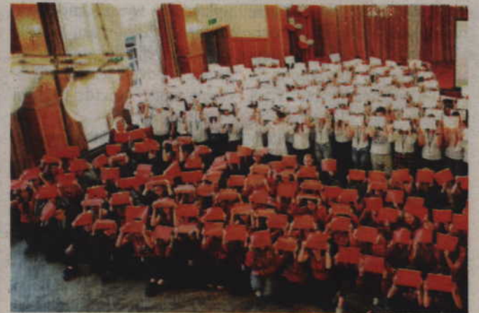
Na koniec części oficjalnej uczestnicy pozwolili do wspólnego zdjęcia w barwach narodowych.

Po części oficjalnej i odśpiewaniu hymnu o godz. 11.11, uczestnicy zapoznawali do pamiątkowego zdjęcia w barwach narodowych. W drugiej części uroczystości uczniowie I LO przygotowali