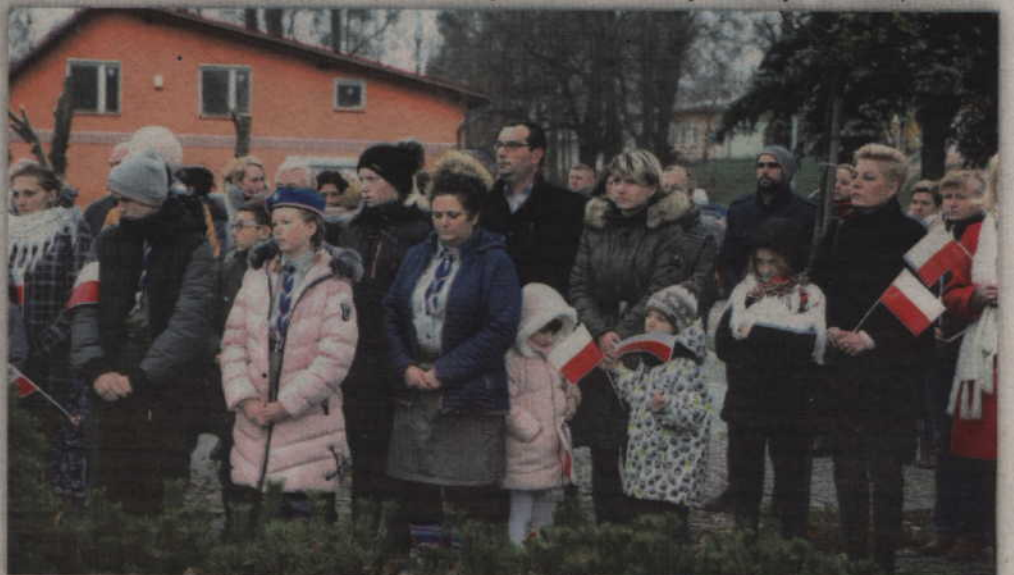
W gardejskich uroczystościach wzięła udział liczna grupa mieszkańców gminy.