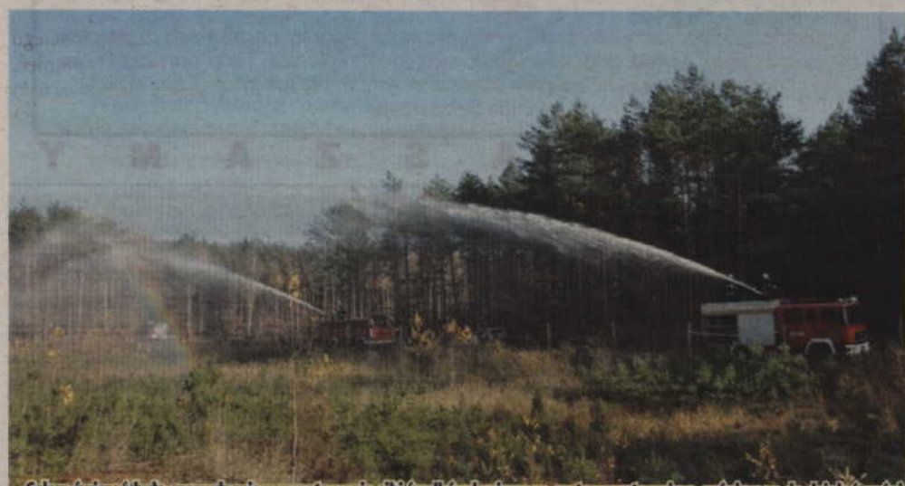
Celem ćwiczeń było sprawdzenie przygotowania sił i środków krajowego systemu ratowniczo-gaśniczego do działań gaśniczych na terenach leśnych oraz do dostarczania wody na duże odległości.