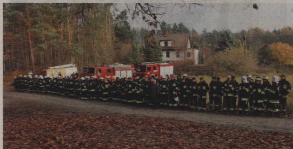
Ponad stu strażaków wzięło udział w wojewódzkich ćwiczeniach ratowniczych „Las Kwidzyn 2018”.