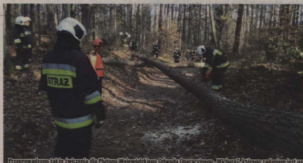
Przeprowadzono także ćwiczenia dla Plutonu Wojewódzkiego Odvodu Operacyjnego „Wichura”, którego zadaniem jest usuwanie następstw wichur, tornad oraz huraganów.