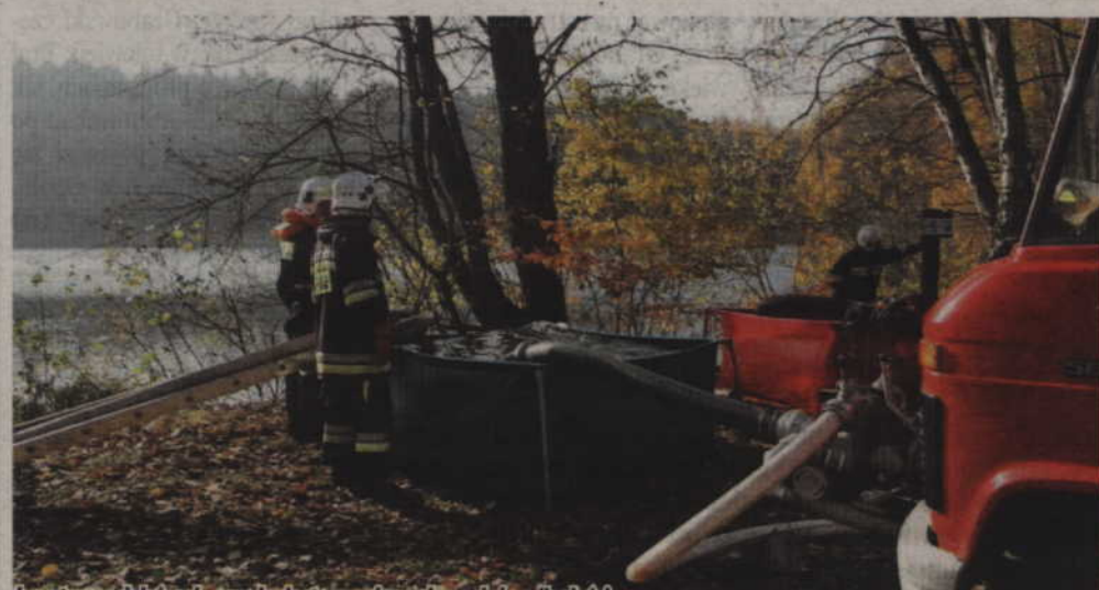
Celem ćwiczeń było sprawdzenie przygotowania sił i środków krajowego systemu ratowniczo-gaśniczego do działań gaśniczych na terenach leśnych oraz do dostarczania wody na duże odległości.