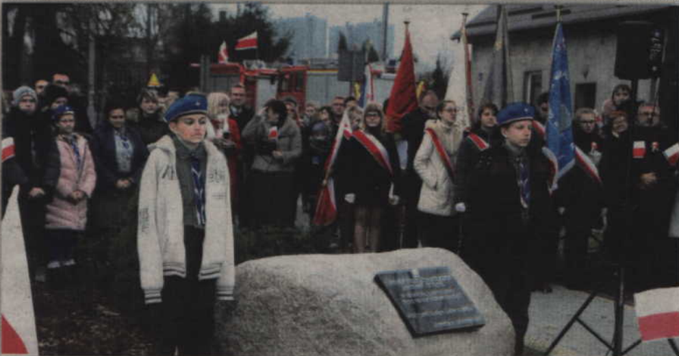
Wartę honorową przy tablicy pełnili harcerze z Drużyny Harcerskiej „Bezimienni” działającej w SP w Gardeji.