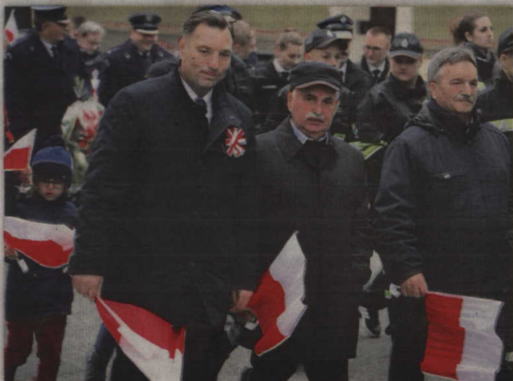
W uroczystej kolumnie przeszli także członkowie „Kwidzynańców”