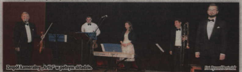
Zespół kameralny „Artis” w pełnym składzie.