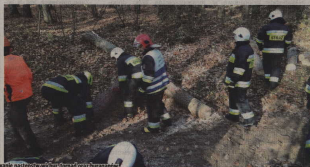
Przeprowadzono także ćwiczenia dla Plutonu Wojewódzkiego Odvodu Operacyjnego „Wichura”, którego zadaniem jest usuwanie następstw wichur, tornad oraz huraganów.