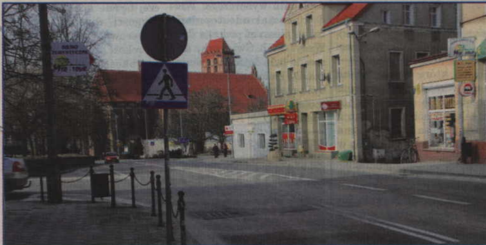
Odcinek ulicy Braterstwa Narodów znajdują się strefie ochrony konserwatorskiej. Prowadzenie prac będzie wymagało uzgodnień z konserwatorem zabytków.

burmistrz Kwidzyna. Jezdnia na odcinku od skrzyżowania z ulicami Słowiańską i Targową jest szeroka dlatego planowana jest także budowa nowych miejsc parkingowych. (s)