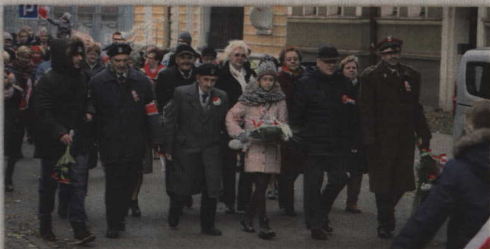
Wśród uczestników nie mogło zabraknąć kombatantów.