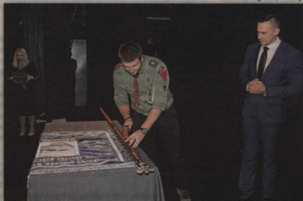
Podczas spotkania podziękowano także fundatorom sztandaru, którzy wbili symboliczne gwoździe na jego drzewcu.