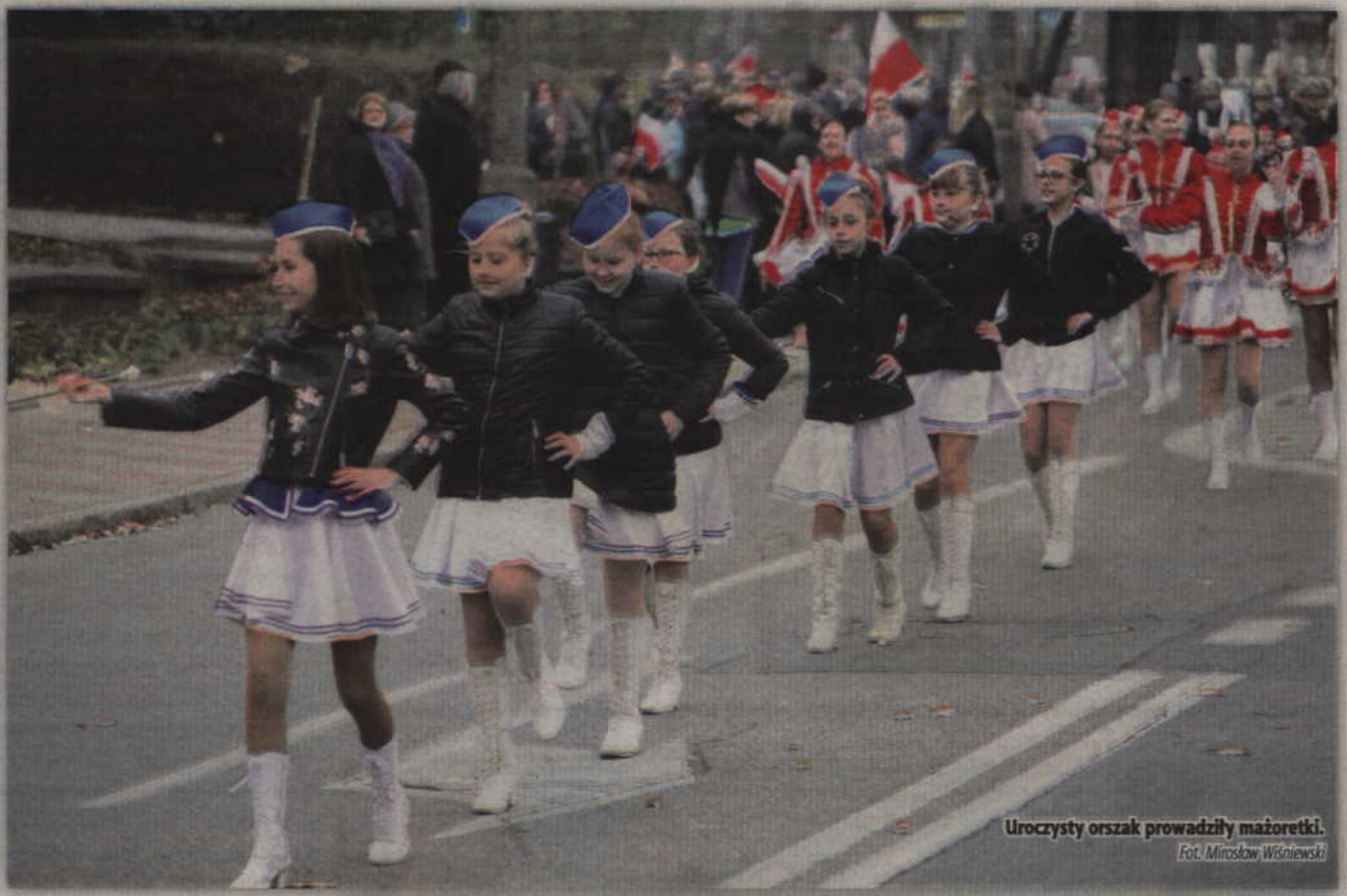
Uroczysty orszak prowadziły mażoretki.