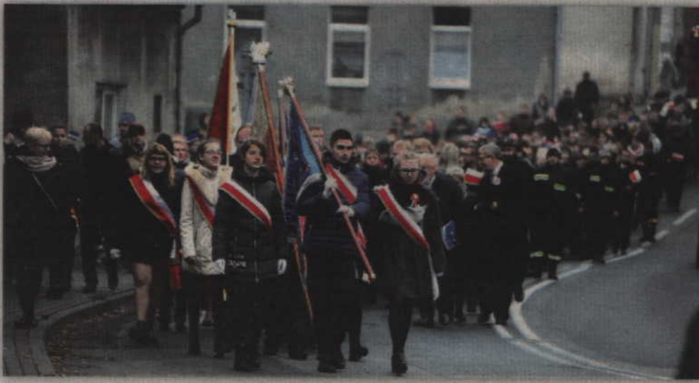
Po uroczystej Mszy świętej odprawionej w kościele parafialnym w Gardeji jej uczestnicy udali się na plac przy urzędzie gminy.