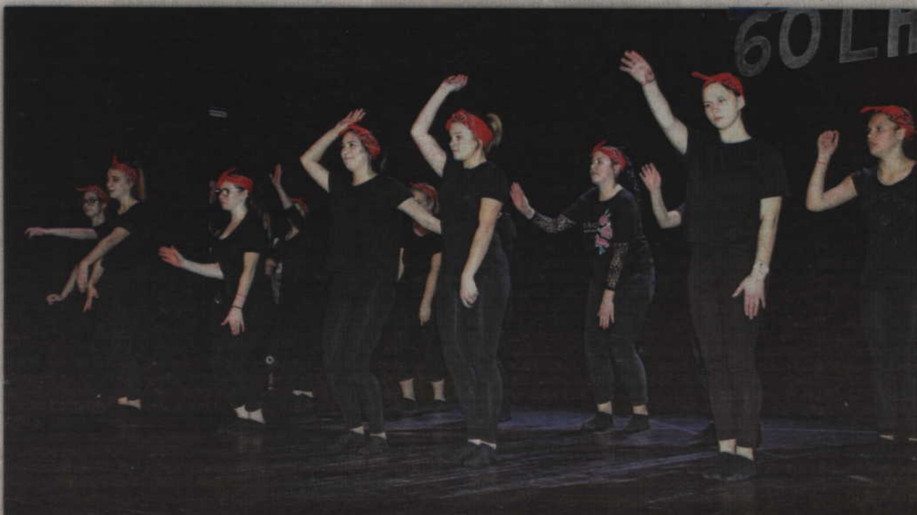
W specjalnym programie wystąpiły także wychowanki kwidzyńskiego ośrodka.

- Uważam, że będąc dyrektorem takiego ośrodka warto dla takich chwil poświęcać swój czas i warto dla nich żyć. Miałem okazję poznać trójkę dyrektorów i rzeczywiste państwa sposoby wychowania i edukacji, poprzez muzykę, śpiew i zajęcia teatralne uwrażliwiają młode dziewczyny, ale co istotne uwrażliwiają też nas, mieszkańców Kwidzyna. To dzięki tej wrażliwości opiekunów, nauczycieli i wychowawców, młodzież przejmując wasze wzorce, jest empatyczna, ciepła i dostarcza nam wzruszeń.