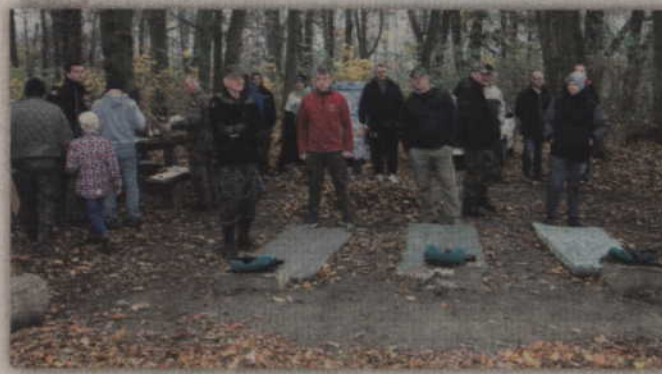
W zawodach strzeleckich wzięło udział ponad dwadzieścia osób.

Strzelnica „na wyspie”, która znajduje się w parku, tuż przy centrum Gardei, co pewien czas jest miejscem zawodów strzeleckich. Warto w tym miejscu przypomnieć, że już przed II Wojną Światową byli mieszkańcy Garnsee spotykali się w tym miejscu, aby ćwiczyć swoje umiejętności strzeleckie. W czasach nam współczesnych, miejsce to wykorzystywali harcerze. Dziś, gospodarzem strzelnicy jest natomiast kwidzyński „Gward”. I to członkowie tego stowarzyszenia we współpracy z Gminnym Ośrodkiem Kultury zorganizowali jubileuszowe zawody strzeleckie.