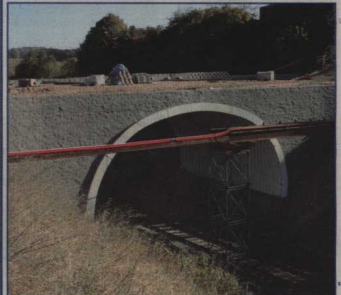
Dobiega końca budowa mostu na ul. Owczej. Po zakończeniu prac ruch samochodów będzie się odbywał w dwóch kierunkach.

Dobiega końca budowa mostu na ul. Owczej. Po zakończeniu prac ruch samochodów będzie się odbywał bez przeszkód w dwóch kierunkach. Mieszkańcy mogli niedawno przejść po wiadukcie między innymi podczas wyborów samorządowych.