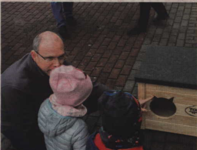
Firma „Tor-Pal” przygotowała 6 domków dla kotów, które są ocieplane i mają zadaszony podest.