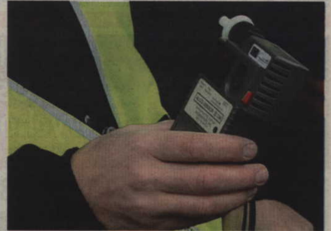
Kierujący seatem 22-latek miał prawie 2 promile alkoholu.

- Pamiętajmy, że każdy pijany uczestnik ruchu drogowego stwarza realne zagrożenie dla siebie oraz innych. Policjanci apelują do kierowców, aby za kierownicę wsiadali za-