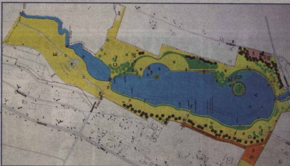
Projekt zalewu na Liwie czeka na realizację. Obecnie przygotowujemy jest tzw. raport środowiskowy.