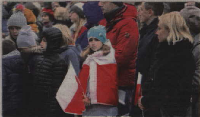
Niektórzy byli wręcz odziani w barwy narodowe.