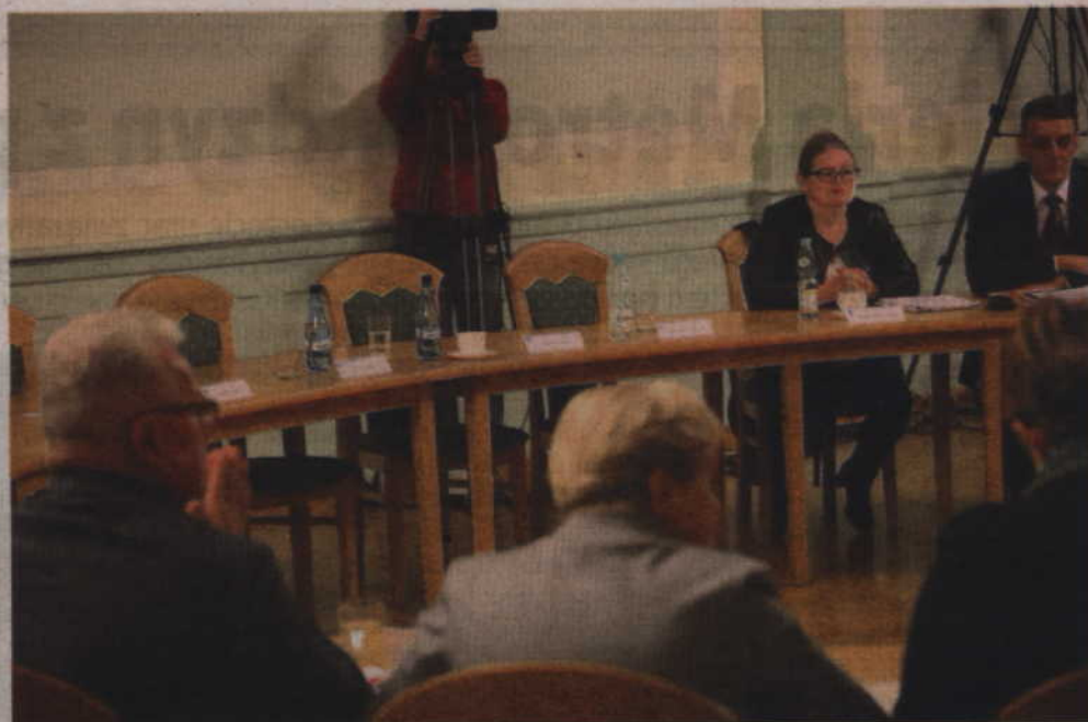
Przy braku politycznych oponentów koalicja przegłosowała 21 uchwał.