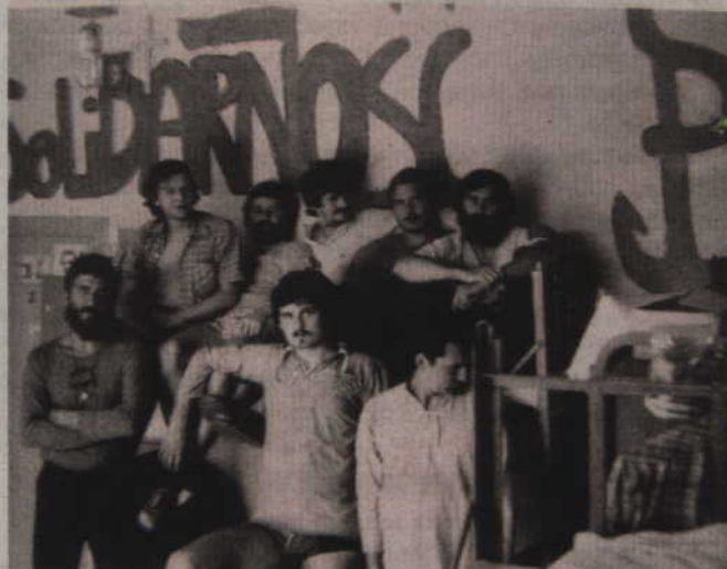
Działacze „Solidarności” internowani w kwidzyńskim zakładzie karnym.