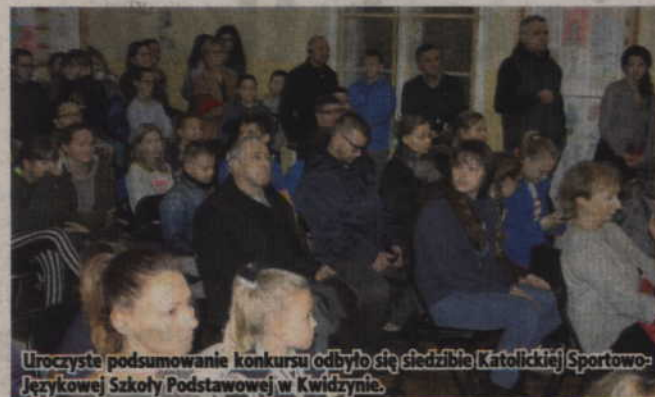
Uroczyste podsumowanie konkursu odbyło się siedzibie Katolickiej Sportowo-Językowej Szkoły Podstawowej w Kwidzynie.

KWIDZYN. Wernisażem w Katolickiej Sportowo-Językowej Szkole Podstawowej oraz wydaniem książki „Czy Ją kochasz?” zakończył się konkurs pod tym samym tytułem. Organizatorem konkursu było Stowarzyszenie Rodzin Katolickich Diecezji Elbląskiej w Kwidzynie oraz Placówki Wsparcia Dziennego (świetlica środowiskowa) funkcjonujące przy Stowarzyszeniu Rodzin Katolickich. Głównym zadaniem konkursu było uczczenie 100-lecia Niepodległej.