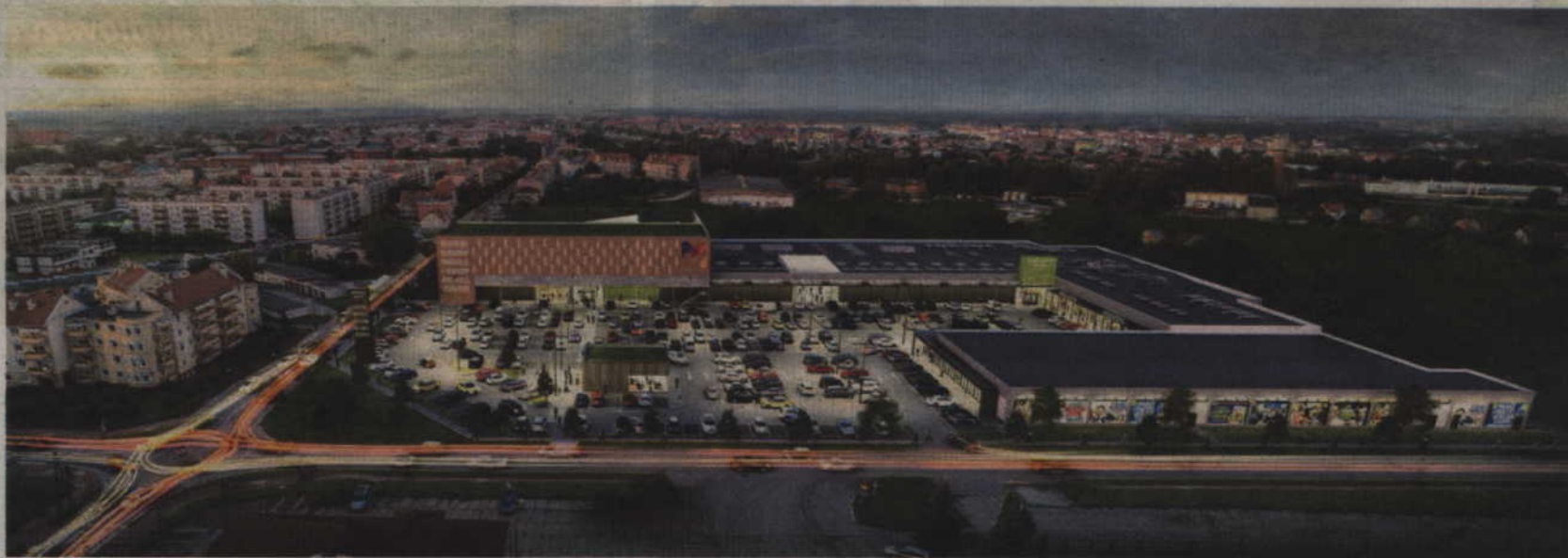
Projektowana Galeria Metro Kwidzyn powstanie u zbiegu ulic Południowej i Toruńskiej, na terenie dawnego WZPOW.