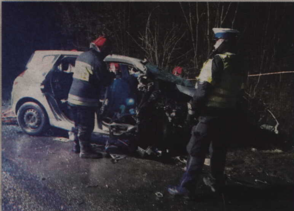
W wyniku wypadku śmierć poniosły cztery osoby podróżujące renault.