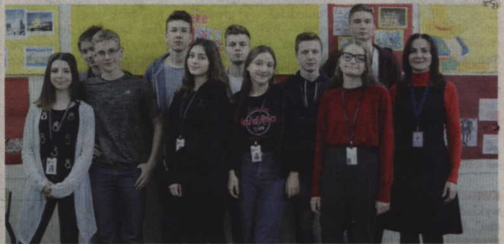
Poznaliśmy już uczniów, którzy w przyszłym roku wyjadą na wymianę do Włoch i Grecji.