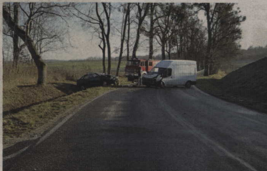
Kierowca busa wpadł w poślizg, zjechał na drugi pas ruchu i czołowo zderzył się z nadjeżdżającym seatem.

-Jak ustalili pracujący na miejscu policjanci, 37-letni kierowca busa, na łuku oblodzonej drogi, wpadł w poślizg, zjechał na przeciwległy pas jezdni i czołowo zderzył się z nadjeżdżającym seatem kierowanym przez 64-letnią kobietę. W wyniku wypadku oboje trafili do szpitala - wyjaśnia sierż. sztab. Anna Filar z Komendy Powiatowej Policji w Kwidzynie.