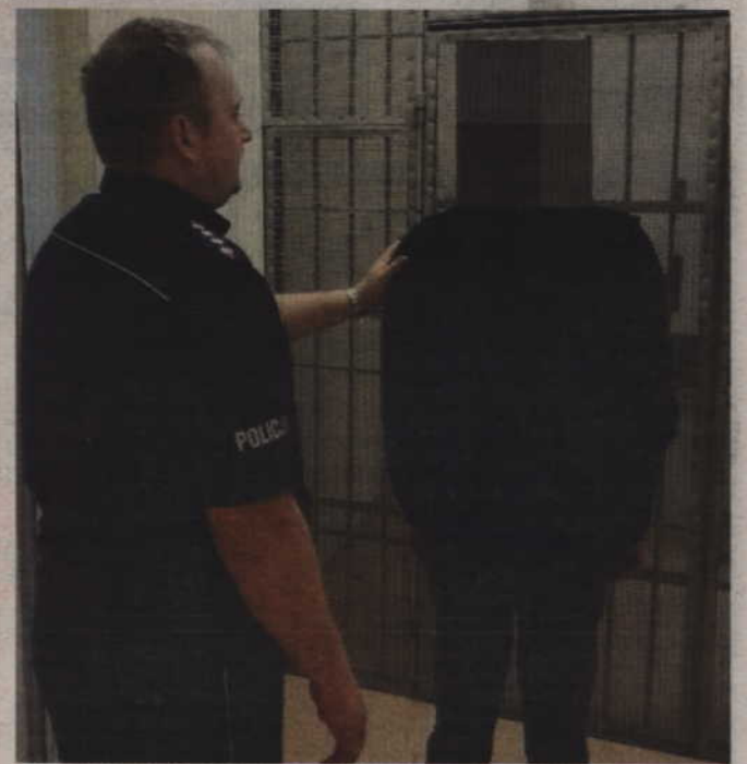
Zatrzymany 50-latek przyznał się do winy. Poinformował również, że zgubił skradzione mienie.