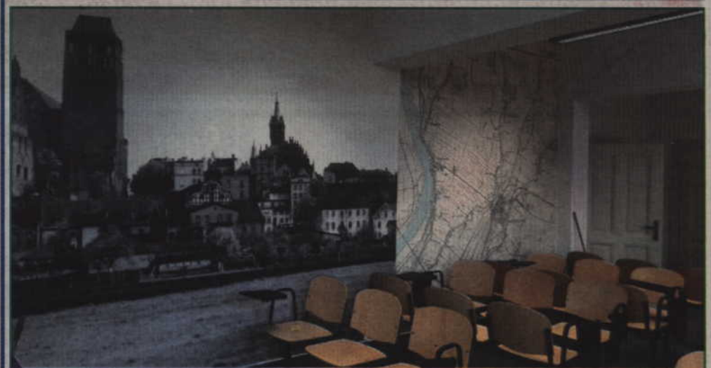
W budynku będą pomieszczenia na kasy biletowe oraz poczekalnia.

typowo kolejowe. W budynku będą pomieszczenia na kasy biletowe oraz poczekalnia. Na najbliższy piątek zaplanowano otwarcie budynku, ale na rozpoczęcie działalności biblioteki będzie trzeba trochę poczekać.