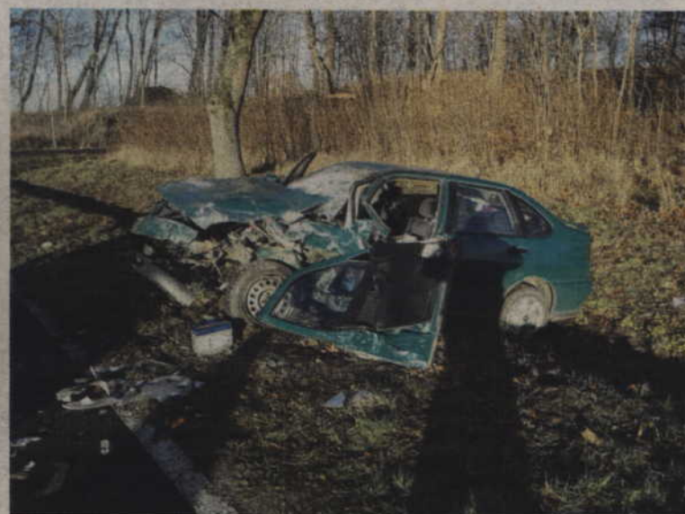
Tak wyglądał wrak seata po feralnej stłuczce.