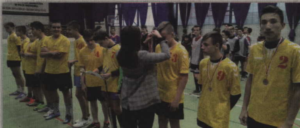
Dekoracja zawodników SP Gardeja.