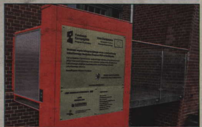
Wykonawcą jest konsorcjum firm, którego liderem jest Spółdzielnia Produkcyjno - Usługowa „Rodło” w Kwidzynie.

Koszt modernizacji budynku i jego adaptacja, między innymi na potrzeby Biblioteki Miejsko-Powiatowej, to ok. 10 mln zł. Wykonawcą jest konsorcjum firm, którego liderem jest Spółdzielnia Produkcyjno - Usługowa „Rodło” w Kwidzynie. Koszt budowy węzła to ok. 4 mln zł. Jego wykonawcą był Zakład Usług Wielobranżowych w Prabutach. W gmachu dworca swoją nową siedzibę znajdzie Biblioteka Miejsko-Powiatowa, jednak budynek będzie także pełnił funkcje