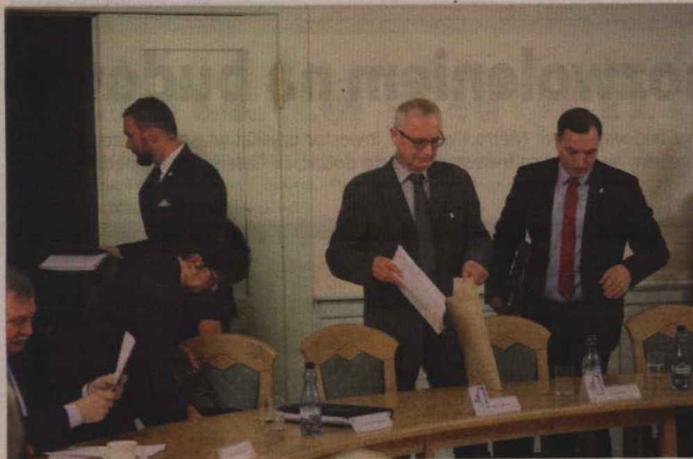
Radni PiS i Kwidziniaków zdecydowali się opuścić salę obrad zgodnie z decyzją prowadzącego obrady radnego seniora.