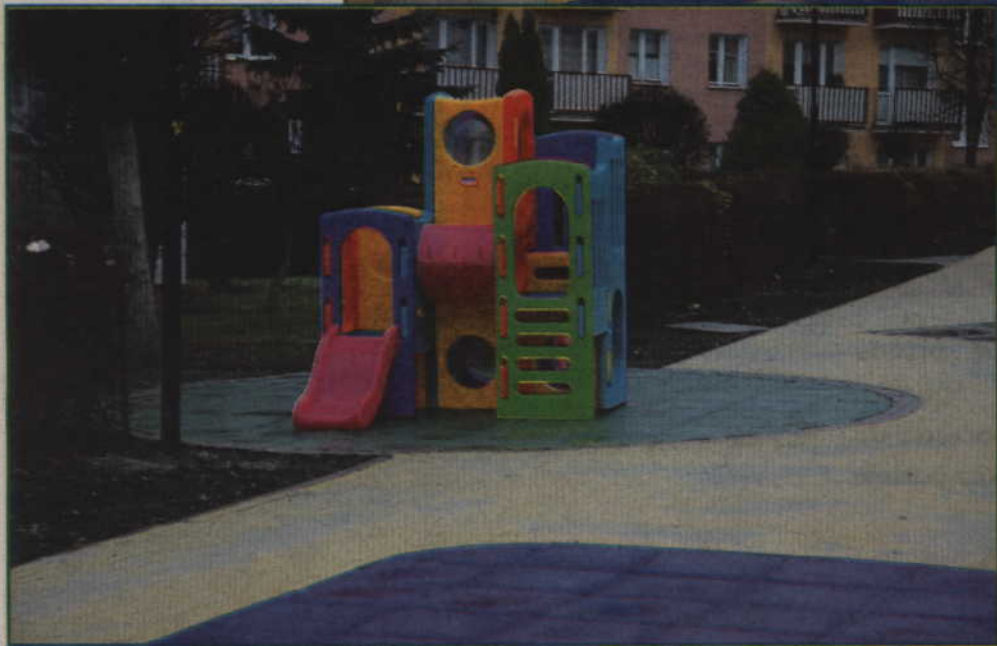
Koszt inwestycji, prowadzonej w ramach budżetu obywatelskiego to ok. 450 tys. zł.