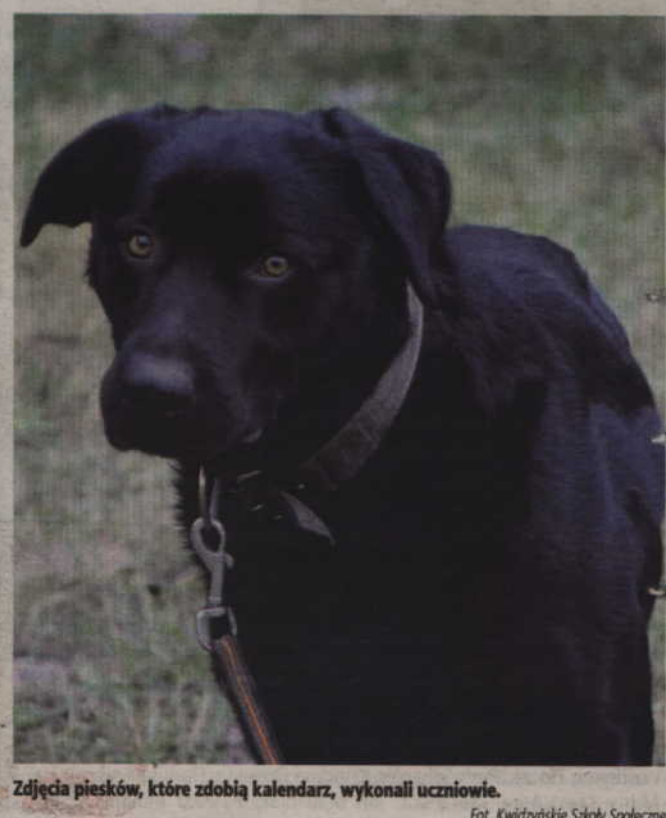
Zdjęcia piesków, które zdobią kalendarz, wykonali uczniowie.