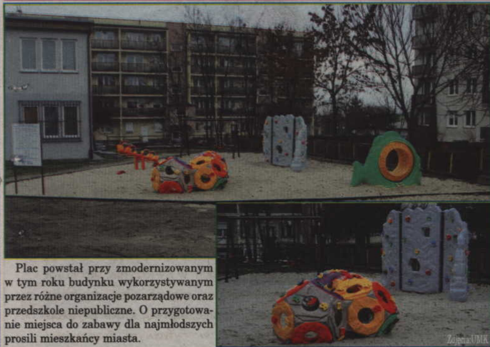
Plac powstał przy zmodernizowanym w tym roku budynku wykorzystywanym przez różne organizacje pozarządowe oraz przedszkole niepubliczne. O przygotowanie miejsca do zabawy dla najmłodszych prosili mieszkańcy miasta.

Dzieci będą mogły cieszyć się nowym placem zabaw, który powstał przy ul. Odrowskiego. To spełnienie postulatów mieszkańców.