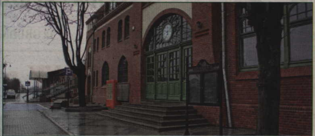
Koszt modernizacji budynku i jego adaptacja, między innymi na potrzeby Biblioteki Miejsko-Powiatowej, to ok. 10 mln zł.

Dobiegła końca modernizacja budynku dworca kolejowego. Zakończono także budowę tzw. węzła integracyjnego, który będzie nowoczesnym i funkcjonalnym miejscem dla mieszkańców korzystających z różnych form komunikacji, w tym kolejowej i autobusowej.