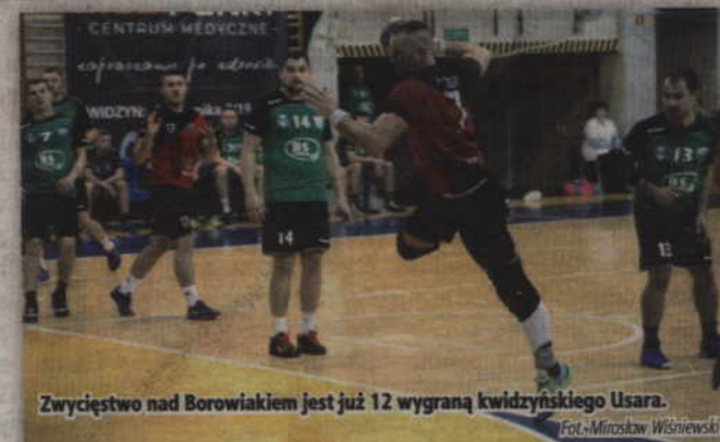
Zwycięstwo nad Borowiakiem jest już 12 wygranych kwizyńskiego Usara.