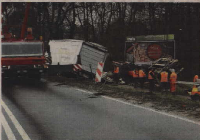
Przewrócony ciągnik z przyczepą na kilka godzin zablokował drogę krajową nr 55.

Jak informują mundurowi prawdopodobną przyczyną wypadku było niedostosowanie prędkości do warunków panujących na drodze. W efekcie kierujący ciągnikiem doprowadził do wywrócenia się całego składu. (fox)