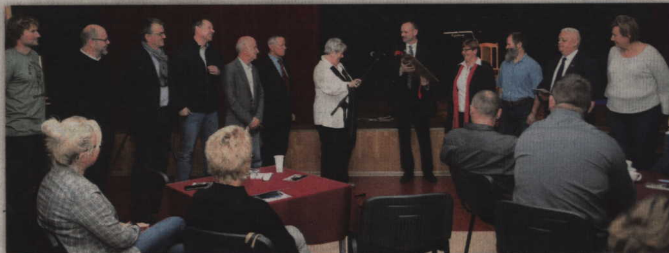
W dwunastym plenerze w Rogóżnie - Zamku uczestniczyło jedenastu artystów.