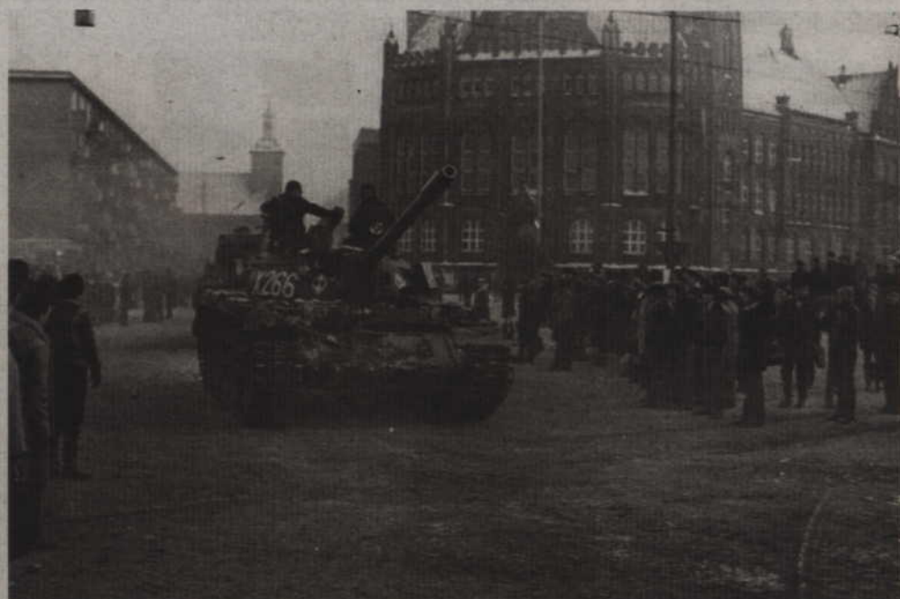
13 grudnia 1981 r. na ulicach miast pojawiło się wojsko i patrole policyjne.