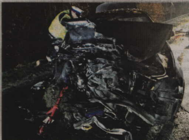
Tak wyglądało bmw po zderzeniu z drugim pojazdem.