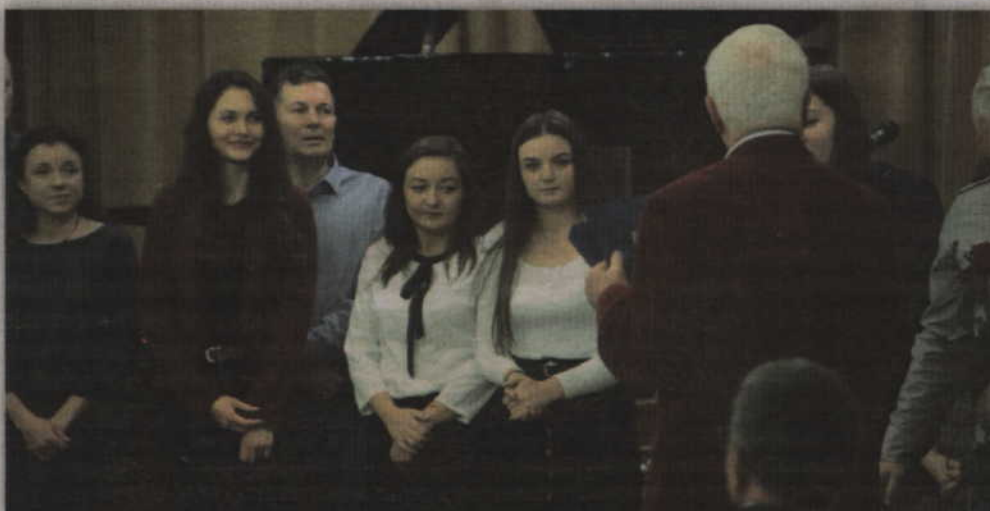
Uroczyste wręczenie stypendiów odbyło się w auli I LO w Kwidzynie.