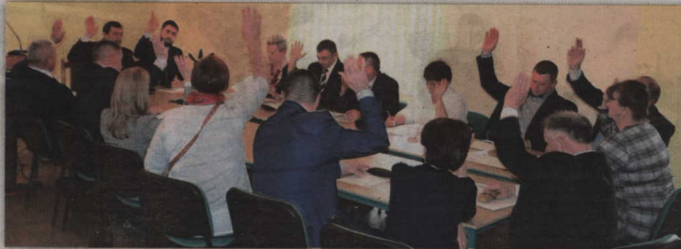
Za uchwaleniem budżetu na 2019 rok głosowało 11 radnych.

- Mieszkańcy oraz osoby korzystające z terenu dworca PKP informowały mnie, że taka toaleta jest w tym miejscu potrzebna. Ponadto, w imieniu klubu