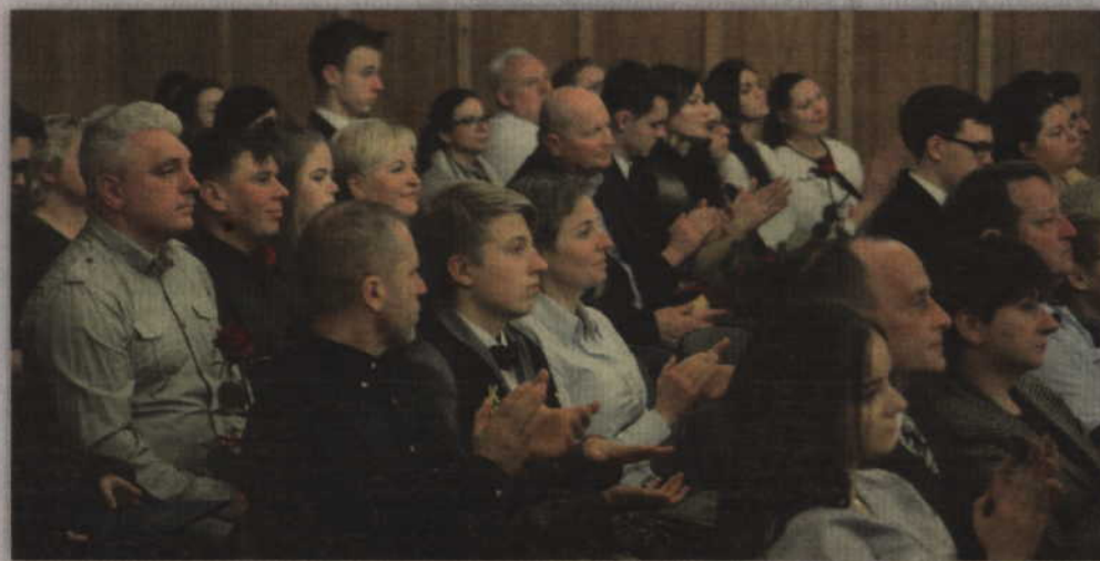
Stypendyści przybyli na uroczystą galę w towarzystwie swoich rodziców.