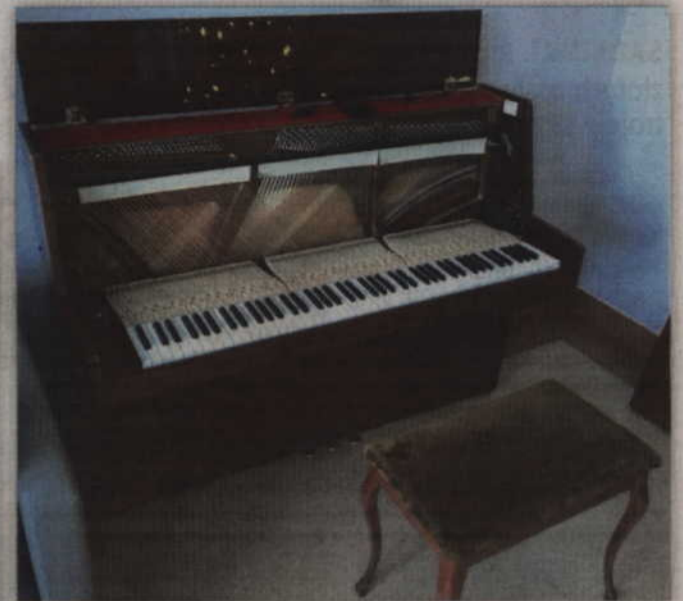
Pianino Leszka Moźdżera, wybitnego pianisty i kompozytora, trafiło do Hospicjum Świętego Wojciecha w Kwidzynie.