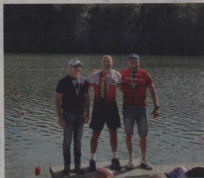
Dekoracja po koronnym dystansie „Syberii” w K-1 200 m.