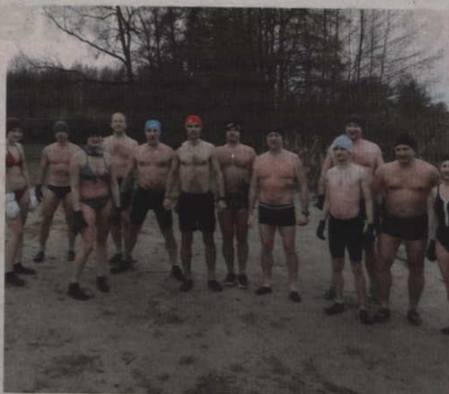
Prabucki sympatycy morsowania regularnie spotykają się na plaży nad jeziorem Sowica.