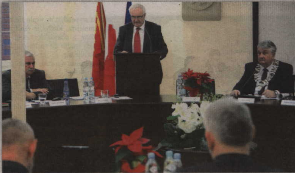
Radni koalicji przegłosowali odrzucenie projektu uchwały mówiącej o zmianie wynagrodzenia starosty.