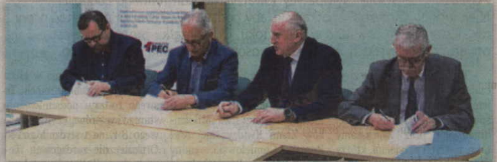
Podpisanie umowy między PEC Kwidzyna a firmą Elektromex odbyło się w siedzibie kwidzyńskiej spółki.

„Budowa i modernizacja sieci ciepłowniczej i węzłów ciepłych na terenie Kwidzyna” obejmował likwidację węzła grupowego przy ulicy Korczaka i zmianę sposobu zasilania w ciepło obiektów korzystających z tego węzła, tj. budynków zlokalizowanych przy ulicy Gębika, Korczaka, Kasprowicza, Polnej, Żeromskiego. Prace budowlane dotyczące tego zadania zostały zakończone z końcem października minionego roku i obejmowały wybudowanie 2963 metrów sieci i przyłączy