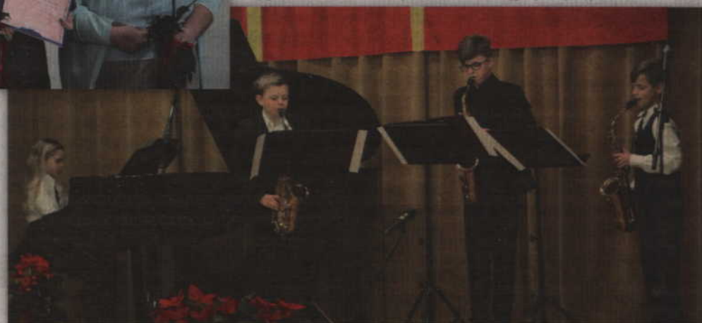
O warstwę muzyczną zadbał uczniowie kwidzyńskiej szkoły muzycznej.

- Kryteria, które decydują o przyznaniu stypendium są trudne do spełnienia, ale lic-