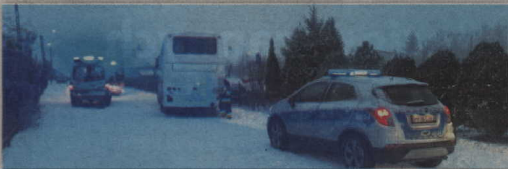
Do tragicznego wypadku doszło na ulicy Szkolnej w Rakowcu.