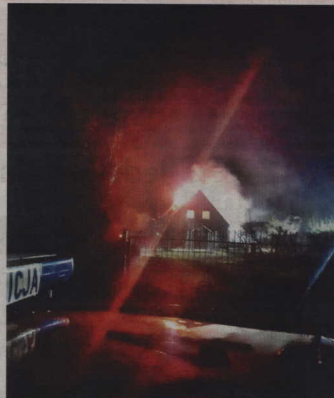
Pożar strawił dach dwurodzinnego domu w Marezie.

-W wyniku pożaru dach budynku uległ całkowitemu spalaniu. Żaden z mieszkańców budynku nie odniósł jednak obrażeń. Obecnie trwają ustalenia dotyczące przyczyn powstania pożaru. Szybka akcja ratunkowa podjęta przez policjantów niewątpliwie przyczyniła się jednak do uratowania życia mieszkańców tego domu - dodaje sierż. sztab. A. Filar. (fox)