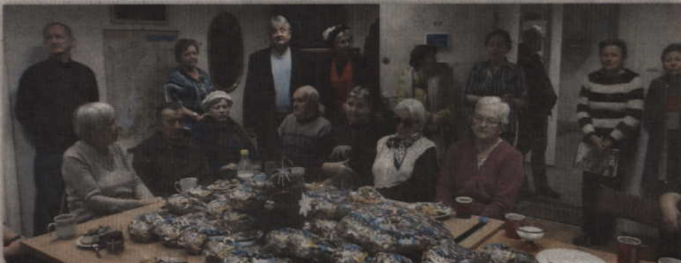
Spotkanie opłatkowe odbyło się w siedzibie kwidzyńskiego koła Związku Kombatantów RP i Byłych Więźniów Politycznych.