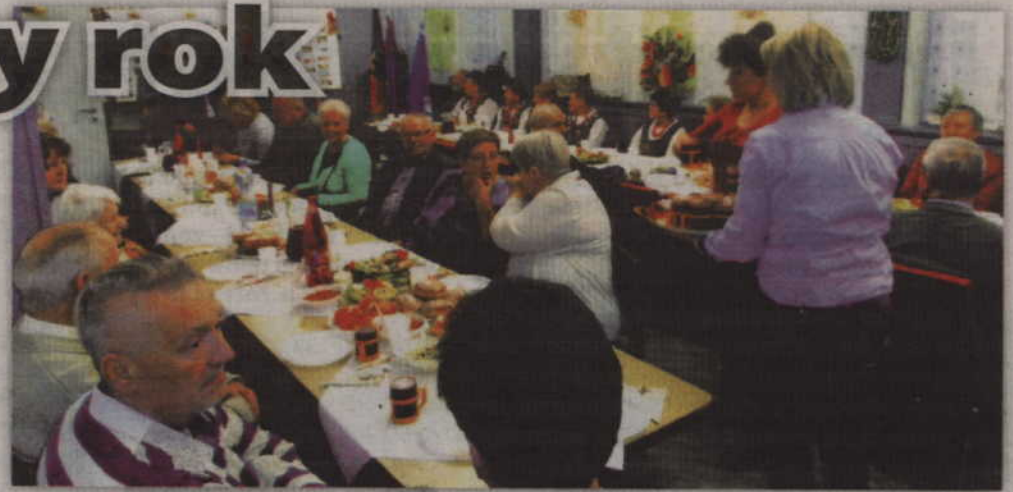
Członkowie i sympatycy Towarzystwa Kulturalnego Ludności Niemieckiej „Ojczyzna” spotkali się, aby podsumować stary i przywitać nowy rok.

Dodaje, że spotkanie nie mogło by się odbyć, gdyby nie wsparcie Związku Niemieckich Stowarzyszeń Społeczno-Kul-