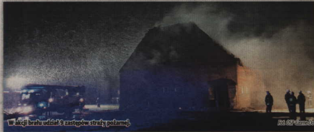
W akcji brała udział 9 zastępów straży pożarnej.

Działania zostały zakończone około godziny 7.45. Warto również dodać, że w akcji uczestniczyły dwa zastępy z Jednostki Ratowniczo-Gaśniczej w Kwizdynie oraz siedem zastępów z OSP w Gardei, Rozajnach, Czarnem Dolnem, Prabutach, Trumiejkach oraz Kołodziejach. Przyczyna zdarzenia nie została natomiast ustalona (RB)