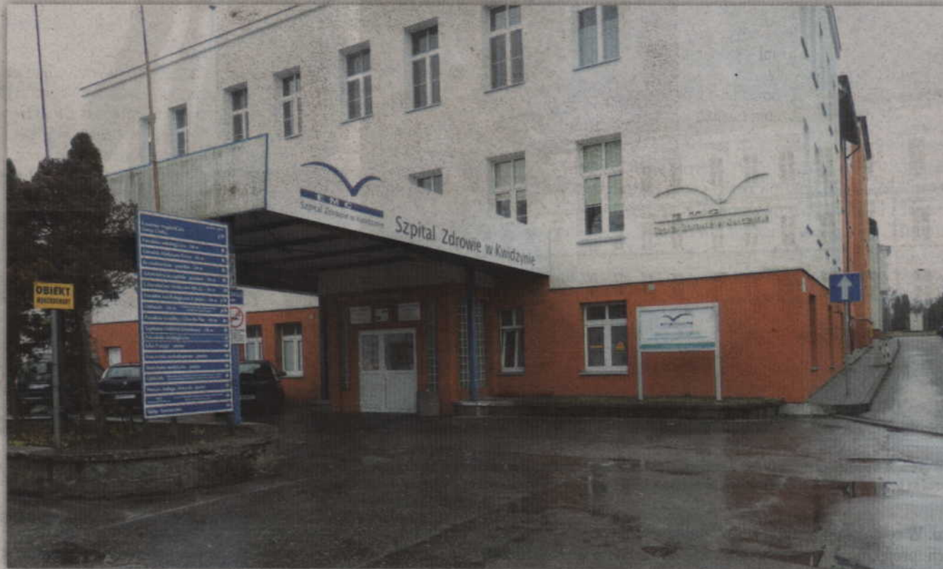
Program Koordynowanej Opieki Ciężarnej (KOC) od 1 stycznia funkcjonuje również w kwidzińskim szpitalu.

Jak informuje spółka EMC Instytut Medyczny do programu można przystąpić na każdym etapie ciąży, nawet tuż przed porodem. Po podpisaniu deklaracji pacjentki otrzymają kartę informacyjną KOC, wraz z danymi kontaktowymi do koordynatora, który będzie sprawował opiekę. W ramach KOC pacjentki mogą teraz wybrać, czy ich ciążę będzie prowadziła położna, czy lekarz ginekolog. Nowością jest także specjalny numer telefonu pod którym o każdej porze przyszła mama