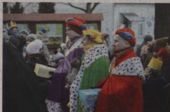
Trzej Królowie przed złożeniem darów Dzieciątku.