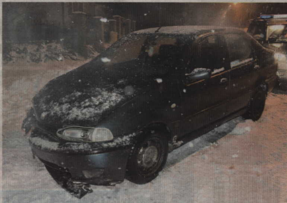
(f) Jak informują policjanci kierowca fiata był trzeźwy, jednak nie posiadał prawo jazdy.