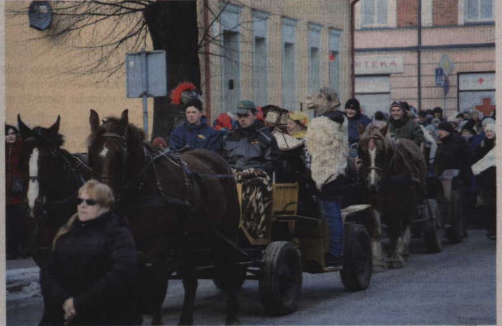
Główne postacie widowiska wiozły pokonały trasę w bryczkach z TRW „Miłosna”.