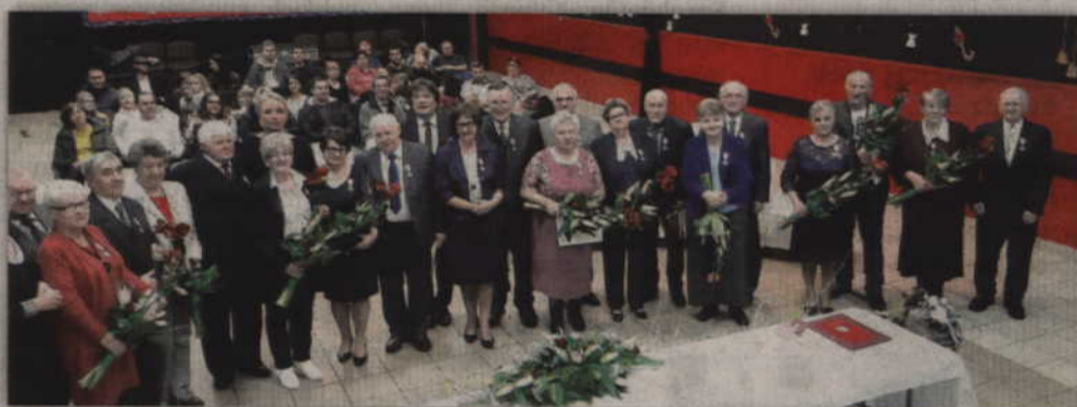
W uroczystym wręczeniu medali „Za Długoletnie Pożycie Małżeńskie” uczestniczyło 16 par małżeńskich.