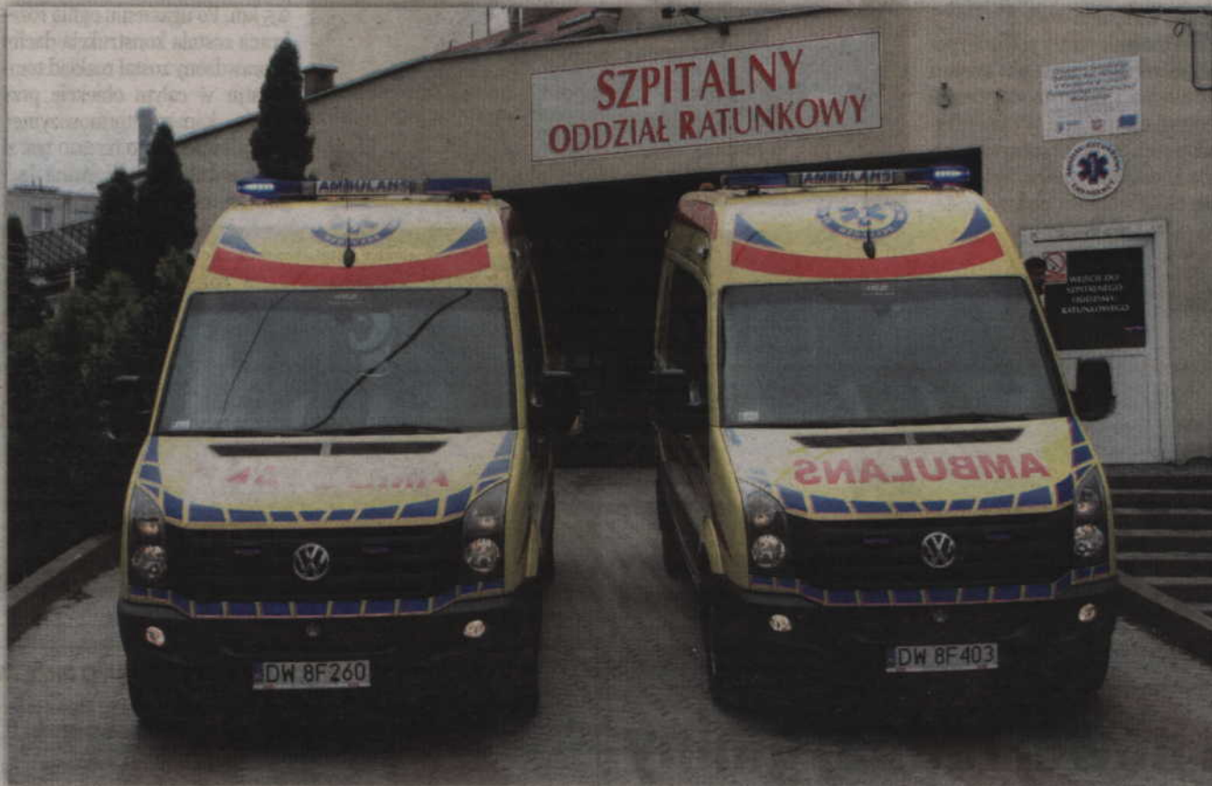
Radni zgodzili się na utworzenie spółki z większościovym udziałem samorządu powiatu, która ma umożliwić funkcjonowanie ratownictwa medycznego w powiecie kwidzińskim.

- Zgodnie z ustawą o państwowym ratownictwie medycznym od dnia 1 kwietnia umowy na wykonywanie zadań ratownictwa medycznego mogą być zawarte jedynie z podmiotami leczniczymi spełniającymi wymogi. Wśród nich mogą być spółki kapitałowe, w których co najmniej 50 proc. udziałów albo akcji należy do Skarbu Państwa lub jednostki samorządu terytorialnego. Aby od 1 kwietnia 2019 r. otrzymać kontrakt na prowadzenie zadań ratownictwa medycznego niezbędne jest utworzenie przedmiotowej spółki - stwierdził Jerzy Godzik, starosta kwidziński.