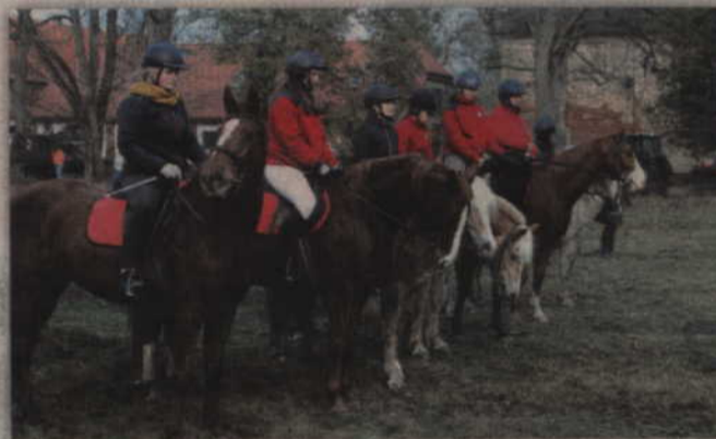
Od ponad dziesięciu lat Ośrodek Jeździecki Julianowo oddaje hołd bohaterom spod Samosierry.