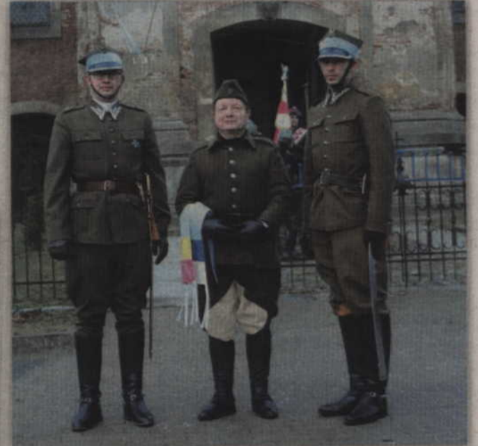
W kamienieckiej uroczystości wzięli udział członkowie Kwidzińskiego Ochotniczego Szwadronu Kawalerii im. 6 Pułku Ułanów Kaniowskich.

- Mój tata, nie pamiętam od kiedy, interesuje się historią. I tak narodził się pomysł, aby rocznicę szarży polskich szwoleżerów upamiętniać poprzez wyjazd do Kamieńca. Z Julianowa do miejsca narodzin 1. Pułk Szwoleżerów Gwardii Cesarskiej jest zaledwie 14 kilometrów. Staramy się każdego roku zachęcać jak najwięcej osób do udziału w upamiętnianiu rocznicy tej brawurowej szarży podkomendnych pułkownika Jana Kozietulskiego. Nasza impreza jest jeszcze wprawdzie