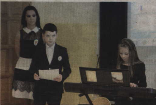
Uczniowie przygotowali specjalny program na powitanie honorowego gościa.