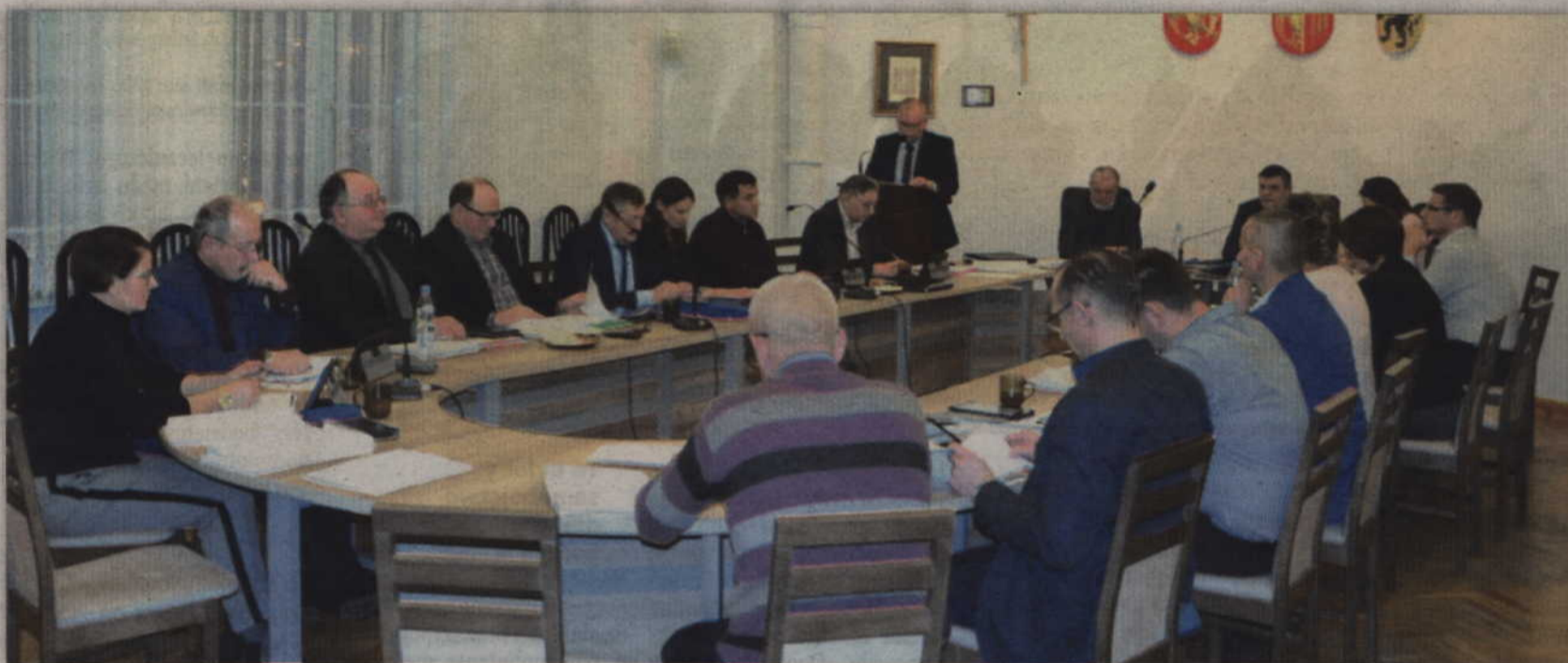
Budżet na 2019 rok to budżet kompromisu, łatany do aktualnych możliwości gminy.

- W związku ze zmniejszeniem się dochodów własnych gminy z tytułu kar za korzystanie ze środowiska (w kwocie 2,3 mln. zł) konieczne było szukanie możliwych oszczędności i zastanawianie się, z czego można zrezygnować. Podjąłem więc decyzję o rezygnacji z budowy