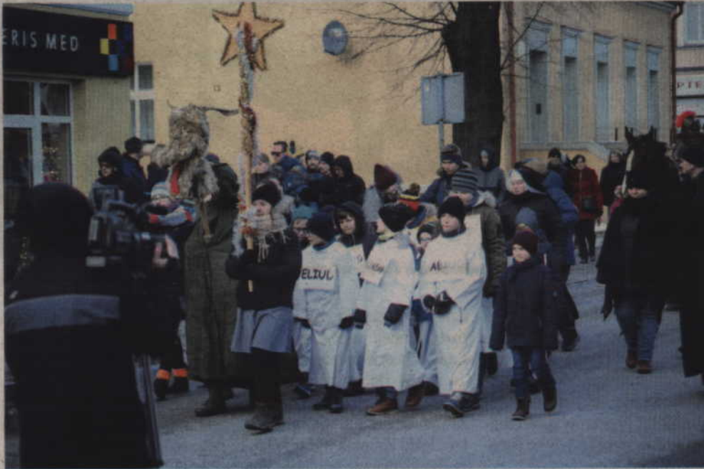
Orszak Trzech Króli połączył kwidzyńskie parafie Św. Jana Ewangelisty oraz Św. Trójcy.