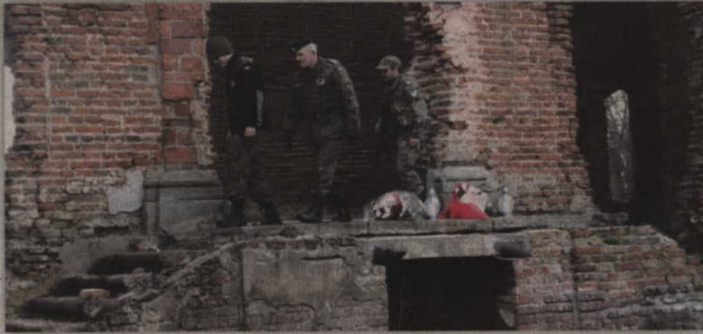
W ruinach kamienieckiego pałacu złożono wiązanki kwiatów i zapalono znicze.

Nie wiadomo, czy ostateczna decyzja o utworzeniu oddziału polskich szwoleżerów gwardii wiązała się z myślą o swoistym zabezpieczeniu wierności polskiego ziemiaństwa, wcale nie tak jednomyślnie popierającego Napoleona czy stanowiła dowód uznania cesarza dla wkładu Polaków w jego zwycięstwa. Stworzenie polskiego pułku w Gwardii Cesarskiej na początku nie miało znaczenia militarnego, jednak poprzez jego skład wywodzący się z elity narodu wiązało ją bezpośrednio ze "sprawą" Napoleona, a jednocześnie, co dla nowej dynastii miało również znaczenie, skojarzyło tę ostatnią z ważnymi europejskimi rodami arystokratycznym. Pułk miał być jednostką elitarną i taką pozostał do końca swego istnienia. Składał się wyłącznie z ochotników przyjmowanych z zachowaniem cenzusu majątkowego i stanowczego. Chłopów do pułku nie przyjmowano. W efekcie korpus oficerski pułku stanowili prawie