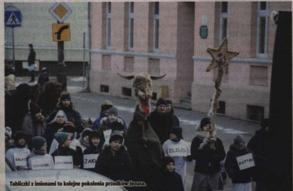
Tabliczki z imionami to kolejne pokolenia przodków Jezusa.