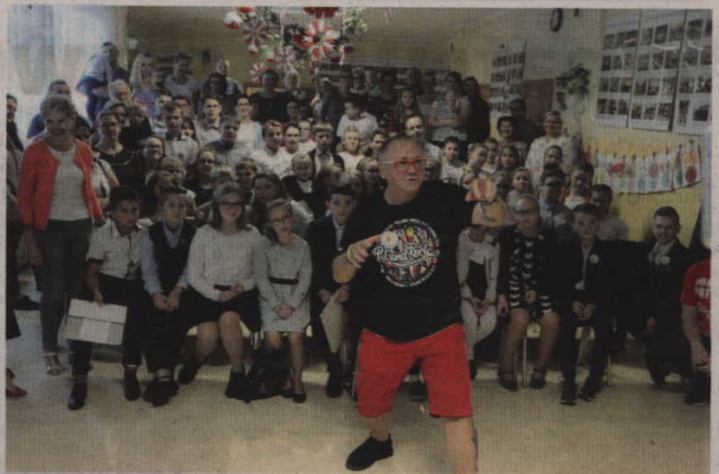
Jerzy Owsiak w październiku odwiedził wolontariuszy e szkoły w Tychnowach.

-Polska jest pięknym krajem – mówił szef Orkiestry. - Zapamiętajcie to sobie. Ten kraj nie jest w ruinie. Był w ruinie 27 lat temu kiedy zaczęliśmy grać. Dbajcie o ten kraj, żeby właśnie tak wyglądał, żeby się tak rozwijał, żeby nikt nie przeszkadzał, żebyśmy mogli robić swoje, tak jak wy żebyście robili wolontariat, bo jest to uzupełnieniem czegoś co w życiu jest niezmiernie ważne. Pamiętajcie wolontariat najlepiej brzmi w krajach bogatych, więc jesteśmy krajem bo-