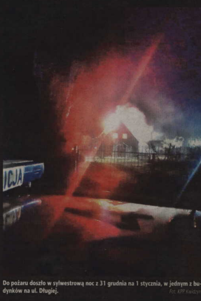
Do pożaru doszło w sylwestrową noc z 31 grudnia na 1 stycznia, w jednym z budynków na ul. Długiej.

Podano dwa prądy wody w natarciu na palące się poddasze oraz jeden w obronie na poddasze, które nie zostało objęte pożarem. Ewakuowano również mienie z parteru obydwu mieszkań, w tym wyniesiono na zewnątrz trzy butle 11 kg na gaz propan-butan. Rozebrana