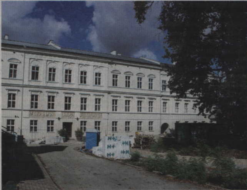
W grudniu wykonawca remontu ZSP 2 stwierdził, że nie uda mu się wykonać inwestycji w terminie. Aby można było finansować przedsięwzięcie pieniądze z 2018 muszą zostać przeniesione na ten rok.

Pod koniec 2016 roku samorząd powiatu uzyskał dofinansowanie z funduszy unijnych na realizację przedsięwzięcia, w ramach Regionalnego Programu Operacyjnego województwa pomorskiego. W ramach programu, na przełomie sierpnia i września ubiegłego roku, zakończono modernizację wnętrza budynku Zespołu Szkół Ponadgimnazjalnych nr 1. Prace prowadzone w ZSP nr 2 obejmują natomiast cały gmach. Starosta Jerzy Godzik wyjaśnił, że 7 grudnia wykonawca stwierdził, że nie uda mu się wykonać inwestycji w terminie. Aby można było finansować przedsięwzięcie pieniądze z 2018 muszą zostać przeniesione na ten rok.