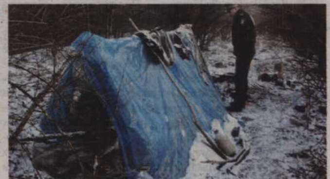
Policyjne patrole sprawdzają altany, pustostany, a także miejsca, w których gromadzą się bezdomni narażeni na zamrożenie.

Policjanci podkreślają, aby reagować na wszystkie sytuacje mogące zagrozić zdrowiu lub życiu. Funkcjonariusze zapewniają także, że odpowiedzą na każdą prośbę o udzielenie pomocy.