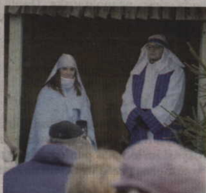
Każdy chciał się pokłonić Nowonarodzonemu.

wej szopki znajdującej się przed kościołem pw. Św. Trójcy. Po drodze Orszak zatrzymał się na chwilę, a zgromadzeni poznali dziadków Jezusa – Joachima i Annę, którzy również dołączyli do orszaku.