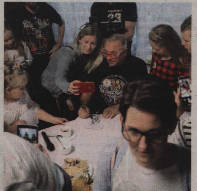
Po spotkaniu gość nie odmawiał autografów oraz chętnie pozował do fotografii.