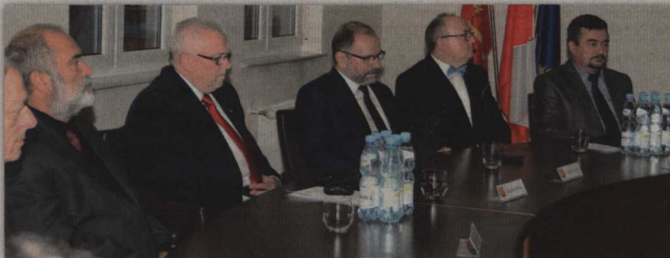
W głosowaniu nad projektem uchwały wstrzymali się radni Prawa i Sprawiedliwości.