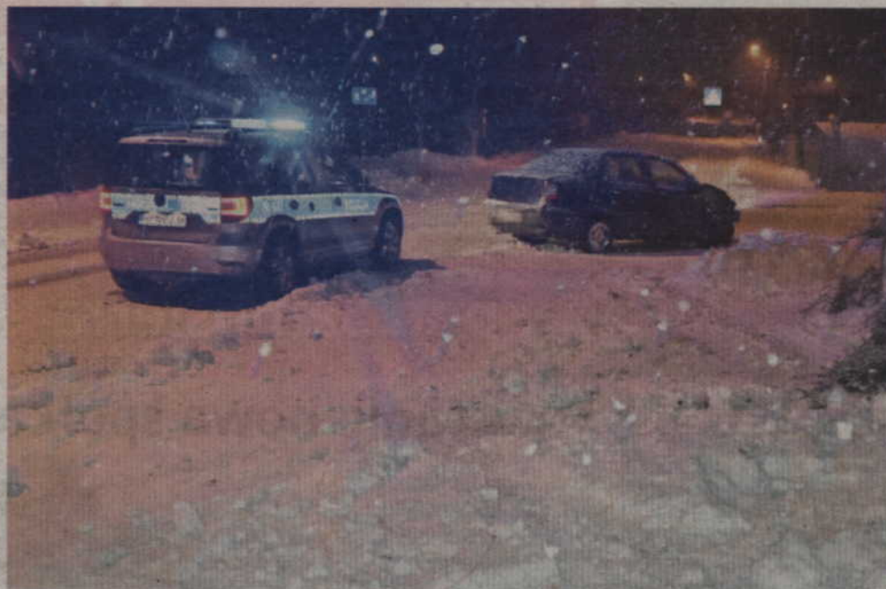
Do wypadku doszło na ul. Chodkiewicza w Prabutach.

Kierowca i pasażer fiata nie doznali żadnych obrażeń. Samochód odholowano natomiast na policyjny parking. Jak informuje KPP Kwidzyn sprawca wypadku był trzeźwy, jednak nie posiadał prawa jazdy. Wkrótce jego sprawa trafi do sądu.