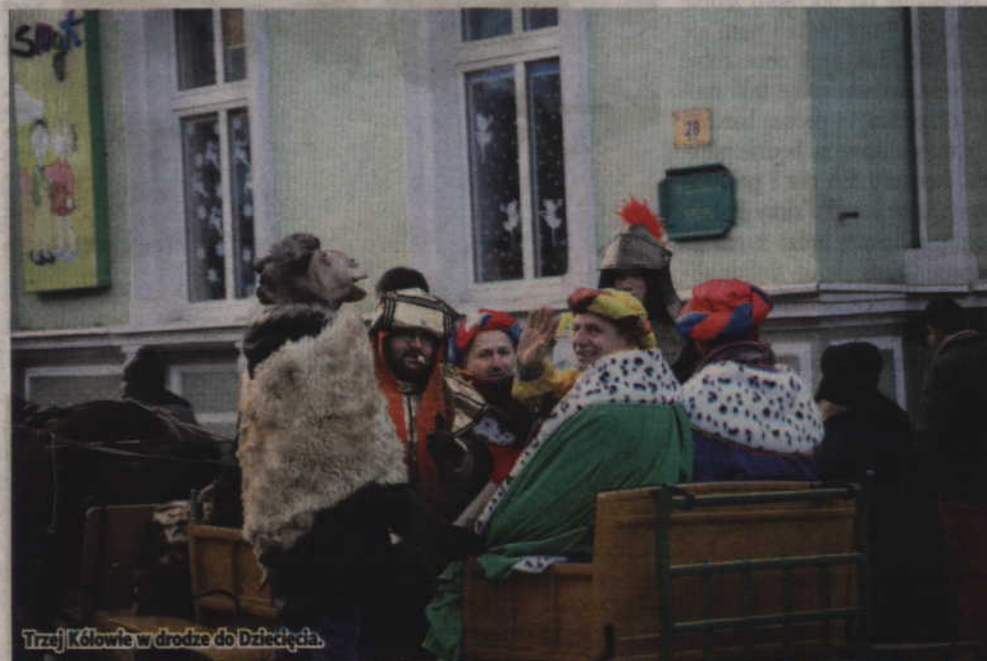
Trzej Królowie w drodze do Dziecięcia.

Oczywiście pojawili się również Trzej Królowie: Kacper, Melchior i Baltazar, którzy podążali za świecą gwiazdą. Za jej wskazaniem wszyscy ruszyli ulicami miasta, wędrując do ży-