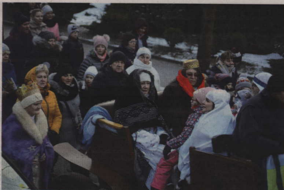
Zgromadzeni poznali dziadków Jezusa: Joachima i Annę, którzy również dołączyli do orszaku.