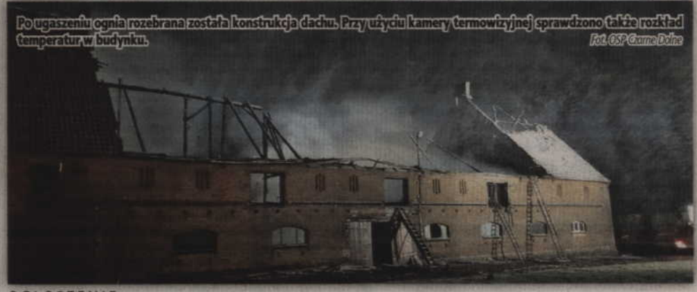
Po ugaszeniu ognia rozebrana została konstrukcja dachu. Przy użyciu kamery termowizyjnej sprawdzono także rozkład temperatur w budynku.