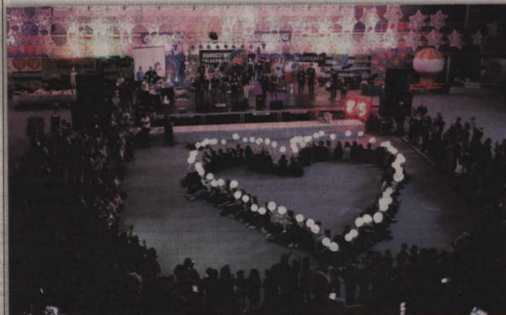
Finał kwidzińskiej WOŚP od lat odbywa się w hali przy ul. Wiejskiej.