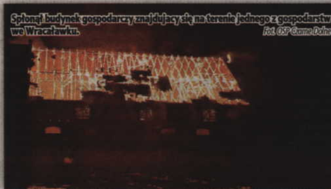
Spłonął budynek gospodarczy znajdujący się na terenie jednego z gospodarstw we Wraclawku.

-Działania straży pożarnej polegały na zabezpieczeniu miejsca zdarzenia i zdalnym odłączeniu energii elektrycznej w całej miejscowości przez dyspozytora zakładu energetycznego. Na palącą się część budynku podane zosta-