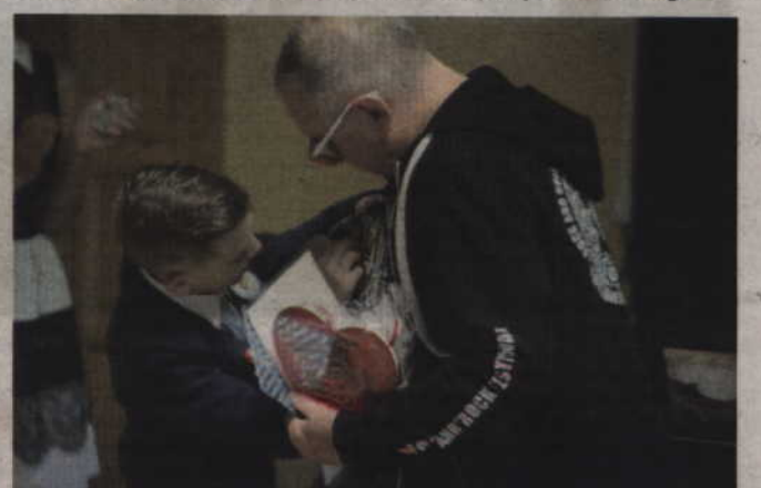
Szef WOŚP otrzymał odznakę honorowego wolontariusza SP Tychnowy.