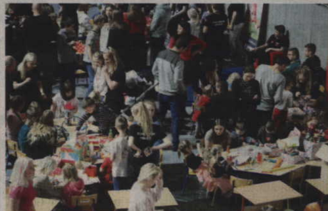
Stałym elementem kwidzyńskiej Orkiestry jest „Strefa dziecka”.