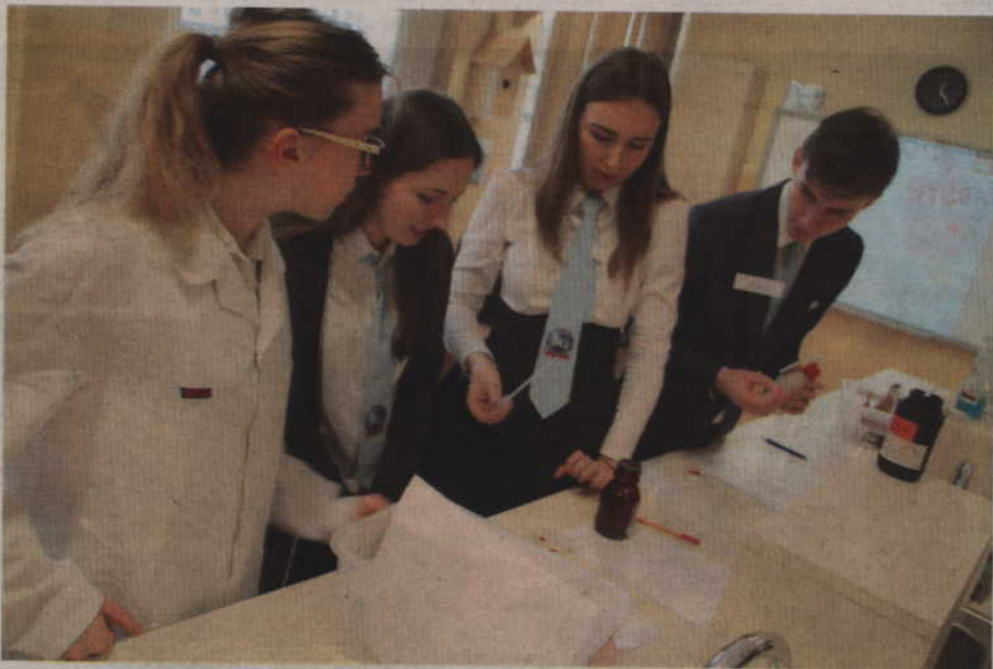
„Zabawy z Noblistami” odbyły się w Społecznym Liceum Ogólnokształcącym już po raz jedenasty.

KWIDZYN. Samorząd Uczniowski Społecznego Liceum Ogólnokształcącego w Kwidzynie już po raz jedenasty zorganizował „Zabawy z Noblistami”. Prezentacja dorobku patronów szkoły stanowiła zachętę do kreatywnego działania młodzieży z powiatu kwidzińskiego.