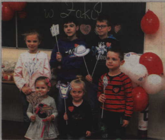
Podczas żakowego finału WOŚP nie mogło zabraknąć dzieci.

W minioną niedzielę, kwidzyński oddział CNIb „Żak” wziął udział w 27 finale WOŚP. Zanim rozpoczęła się akcja, w szkole przygotowano wielkoorkiestrową dekorację. Największe wrażenie na uczestnikach żakowego finału czyniło wielkie białoczerwone serce, wykonane z balonów. Podczas finału można było napić się kawy, herbaty, gorącej czekolady, a także spróbować domowych ciast, wykonanych przez uczniów. Dużą popularnością cieszyła się także loteria. Za 4 zł można było wylosować ciekawe nagrody. Każdy kupon wygrał. Fantami były: żakowskie gadzety, kosmetyki, książki, a także zabawki przekazane przez ofiarodawców. Dzieci wzięły także udział w konkursie, w którym za zadanie było przy-