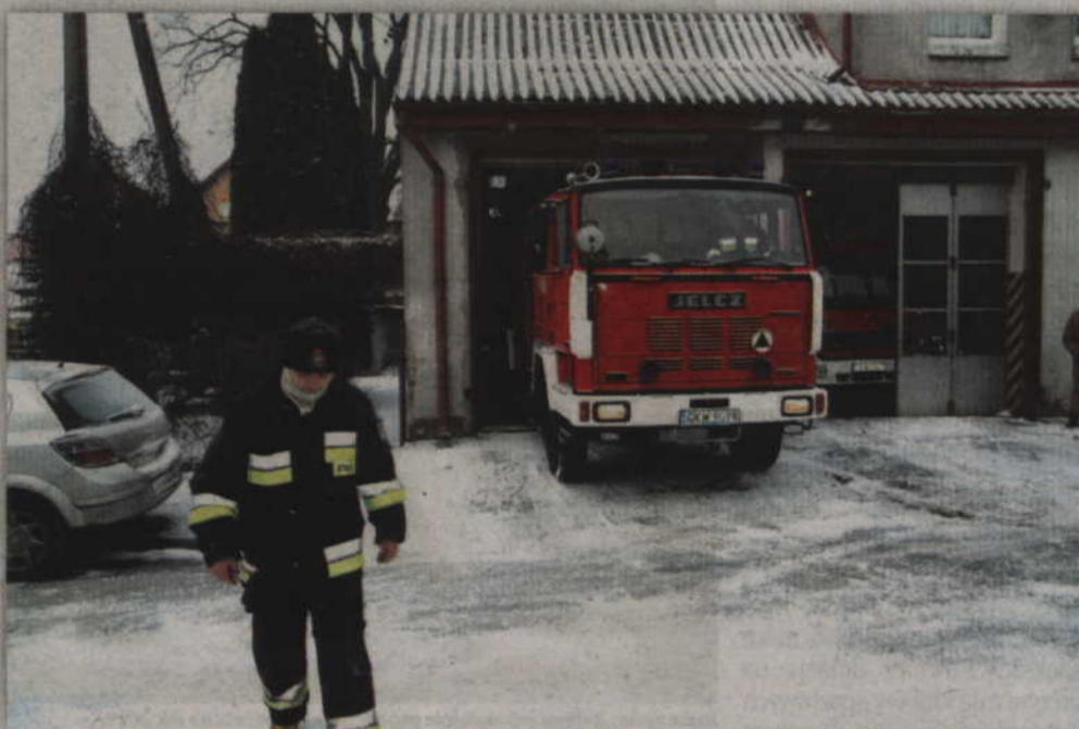
W budżecie zaplanowano kwotę 1,7 mln zł na budowę nowej remizy straży pożarnej. Dotychczasowa siedziba strażaków nie nadaje się bowiem do użytkowania.