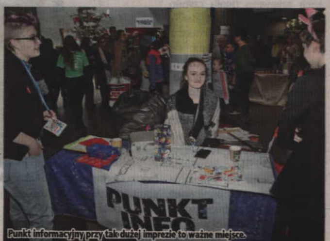
Punkt informacyjny przy tak dużej imprezie to ważne miejsce.