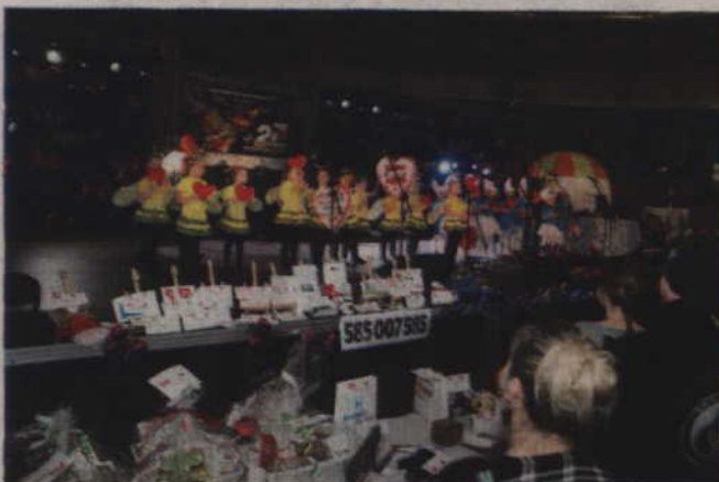
Na scenie prezentują się pszczołki z Przedszkola „Promyk”.