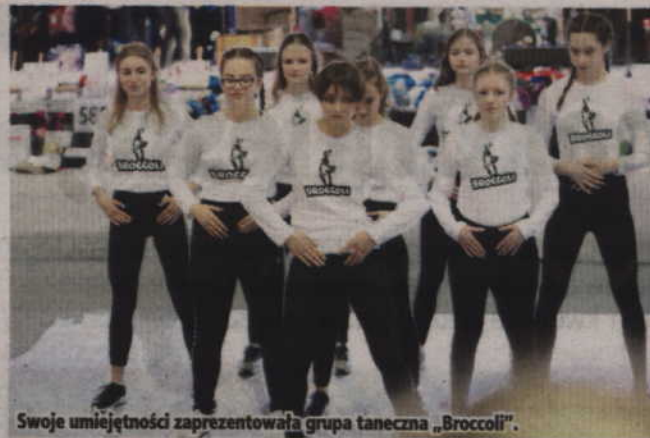
Swoje umiejętności zaprezentowała grupa taneczna „Broccoli”.