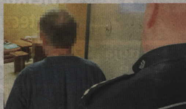
Sprawcy usłyszeli zarzut kradzieży i trafili do kwidzyńskiego aresztu.

Podejrzani zostali przesłuchani oraz usłyszeli zarzut kradzieży. Warto dodać, że prze-