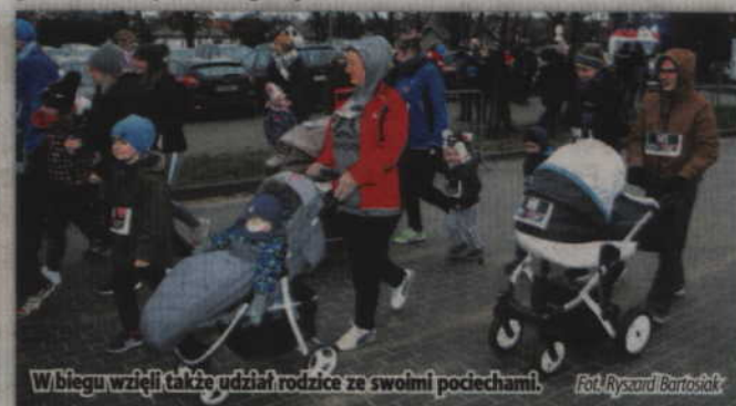
W biegu wzięli także udział rodzice ze swoimi pociechami.