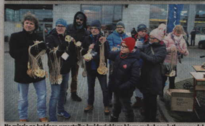
Na mecie na każdego uczestnika kwidzyńskiego biegu czekał pamiątkowy medal.