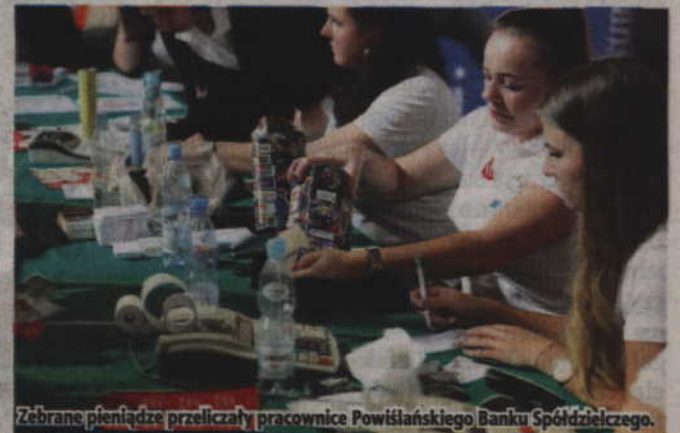
Zbrane pieniądze przeliczały pracownice Powiatowego Banku Spółdzielczego.