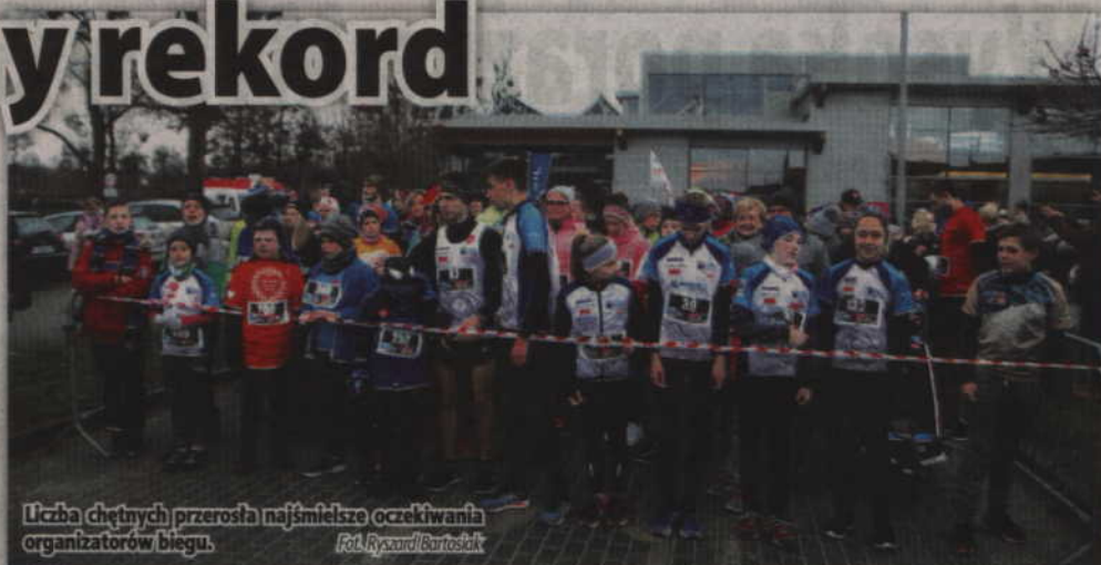
Liczba chętnych przerosła najsmielsze oczekiwania organizatorów biegu.

- Kolejny raz mamy sukces frekwencyjny. Pobiliśmy ubiegłoroczny rekord i jesteśmy po