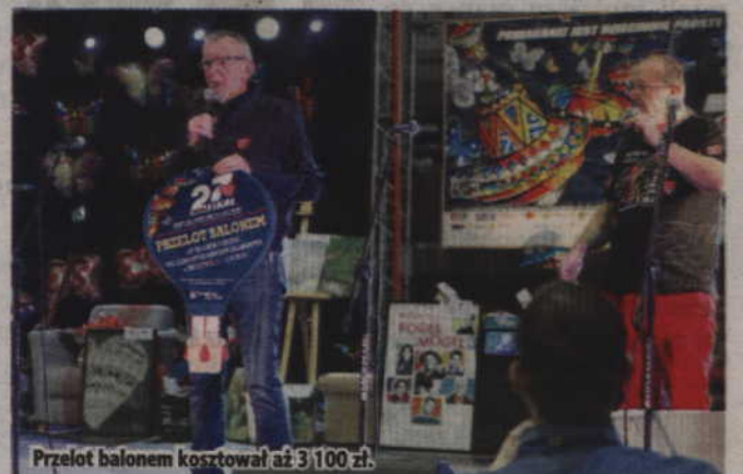
Przebieg balonem kosztował aż 3 100 zł.