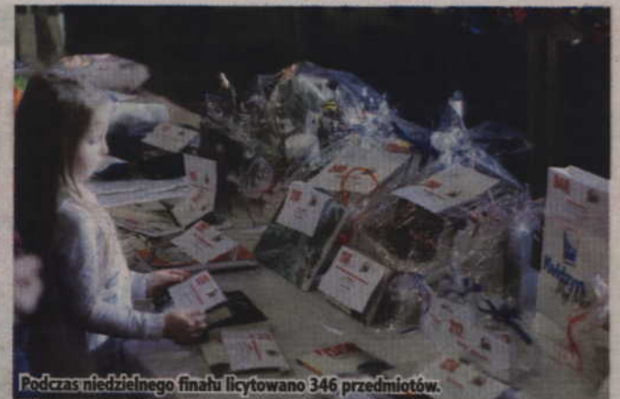
Podczas niedzielnego finału licytowano 346 przedmiotów.