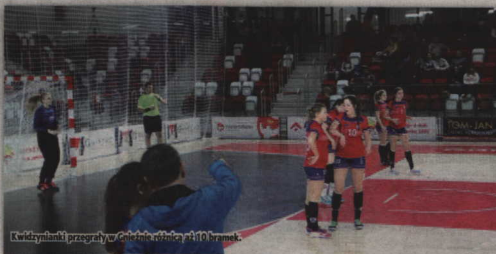
Kwidzynieki przegrały w Gnieźnie różnicą aż 10 bramek.

Niestety przewaga MTS utrzymała się tylko przez 2 kolejne minuty. Od stanu 3:6 na parkiecie dominowały już gospodynie, które zdobyły cztery