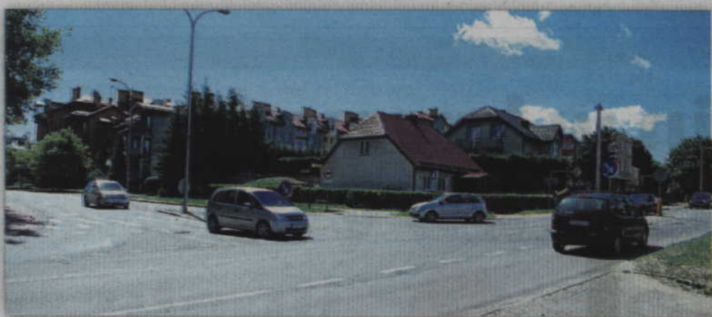
Nowe rondo powstanie u zbiegu ulic Warszawskiej i Machutty.

POWIAT. Zarząd powiatu pozytywnie zaopiniował nową inwestycję, którą będzie budowa kolejnego ronda w Kwidzynie. Powstanie ono u zbiegu ulic Warszawskiej i Jana Machutty, w ramach prowadzonej obecnie modernizacji drogi wojewódzkiej Kwidzyn-Prabuty.