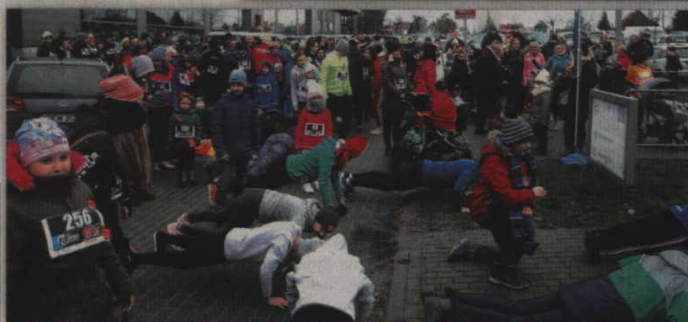
Wspólna rozgrzewka w mroźny dzień okazała się wręcz niezbędna.

była się wspólna rozgrzewka. W ten wyjątkowo chłodny i chwilami deszczowy dzień rozgrzewka była ona wręcz niezbędna.