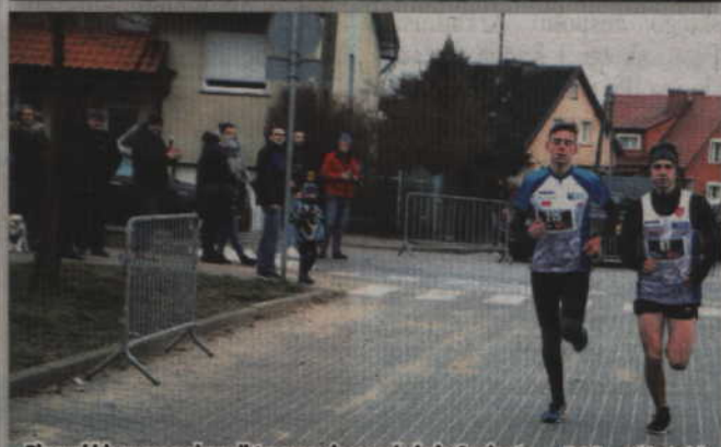
Pierwsi biegacze pokonali trasę w ciągu zaledwie 6 minut.