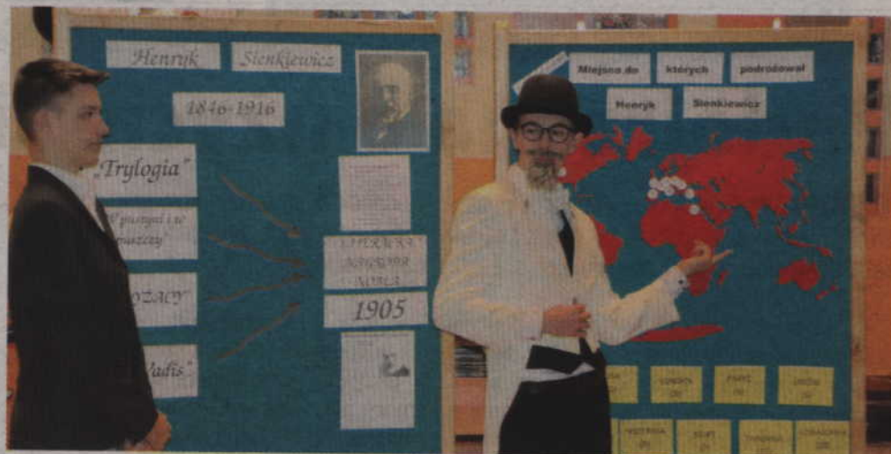
Podczas spotkania można było dowiedzieć się czegoś więcej m.in. o Henryku Sienkiewiczu.