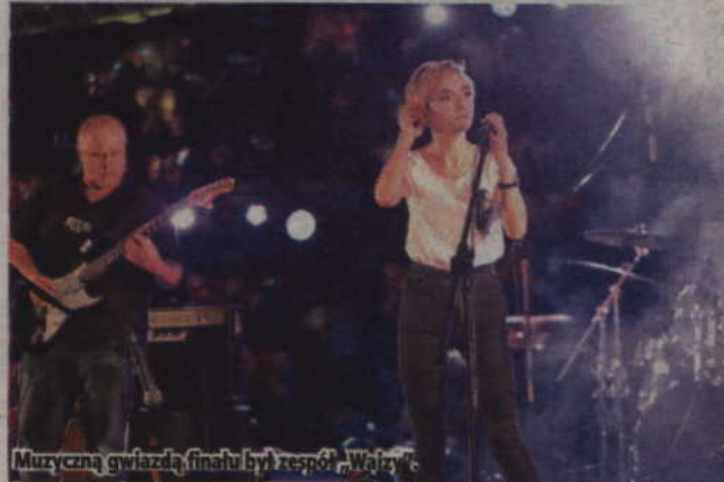
Muzyczną gwiazdą finału był zespół „Wajzy”.