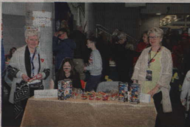
Podczas kwidzyńskiego finału WOŚP nie mogło zabraknąć Przedszkola z Oddziałami Integracyjnymi.