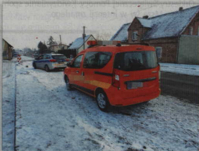
Do wypadku doszło na ul. Kwidzyńskiej w Rakowcu.

- Ze wstępnych ustaleń funkcjonariuszy wynika, że 55-letni mężczyzna kierujący samochodem marki Dacia, jadąc od strony Kwidzyna, nie zachował szczególnej ostrożności podczas wykonywania manewru omijania autobusu i uderzył w prawidłowo jadący swoim pasem motorower, którym kierował 34-letni mężczyzna - wyjaśnia sierż. sztab. Anna Filar z