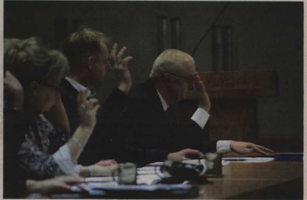
Radni gminy Ryjewo jednogłownie poparli projekt budżetu na rok 2019.