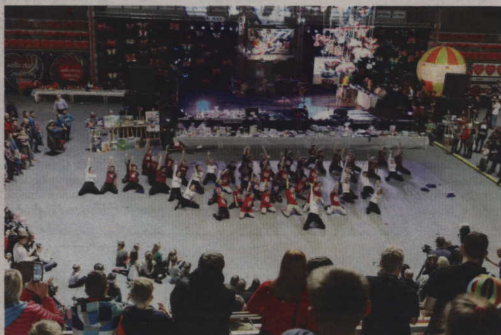
Tak wyglądał finał tegorocznego „Światelka do nieba”.

Łącznie z licytacji pięciu złotych serduszek uzyskano kwotę 34 300 zł. Niedzielny finał zakończył się natomiast kwotą 174 210 zł.