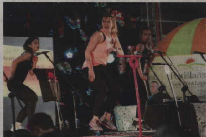
Do wspólnych ćwiczeń zachęcały dziewczyny z Gold Wellness Fitness & Gym.