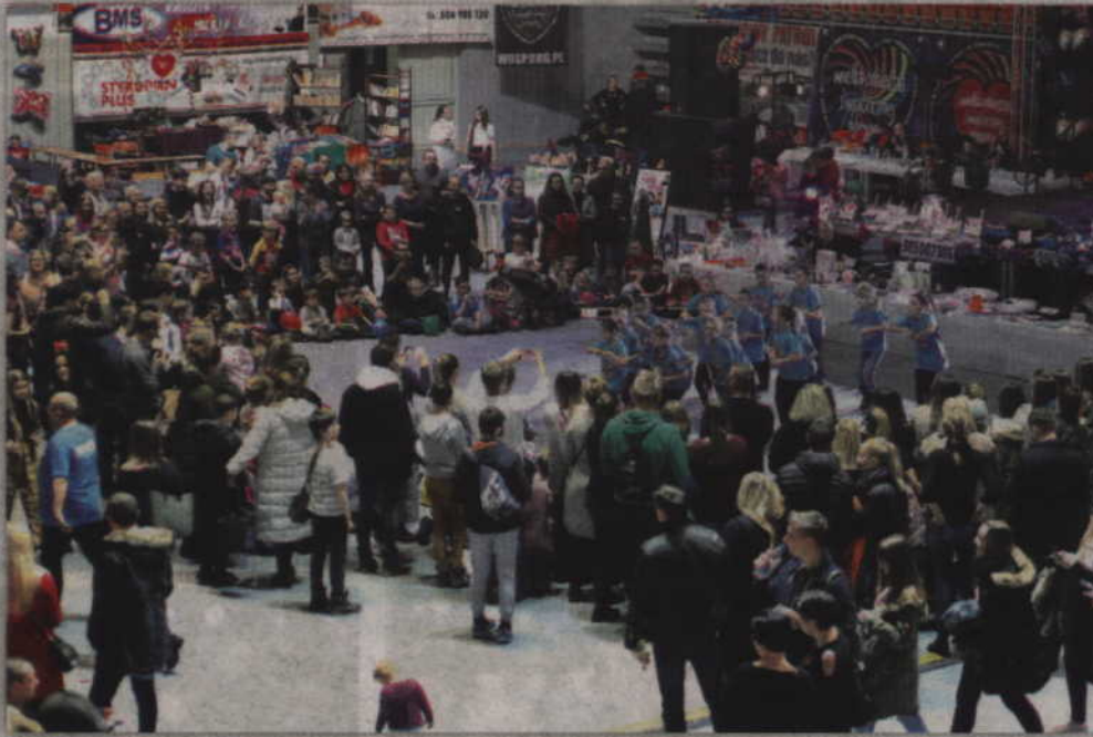
Podczas całego dnia mieszkańcy tłumnie odwiedzali halę przy ul. Wiejskiej, gdzie biło serce kwidzyńskiej Orkiestry.

- To jest sprawa dyskusyjna. Jak ktoś chce pomóc Orkiestrze, chce przyjść i wrzucić coś do puszek to i tak zrobi. I naprawdę nie przeszkadza mu w tym fakt, że jest to niedziela handlowa czy też sklepy akurat są zamknięte. Może dzięki