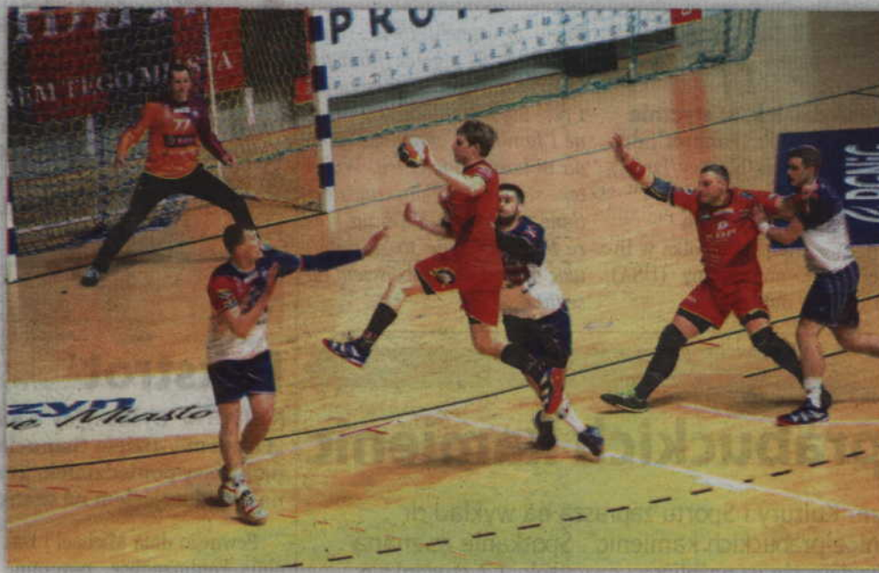
W grudniowym spotkaniu ligowym górą byli kwidzynianie, którzy na własnym terenie pokonali Energię MKS 24:21. W starciu pucharowym lepsi okazali się gracze z Kalisza, którzy lepiej wykonywali rzuty karne.

Sandra SPA Pogoń Szczecin – Gwardia Opole/Olimpia Medex Piekary Śląskie NMC Górniki Zabrze – Zagłębie Lubin MKS Wieluń – Energia Wybrzeże Gdańsk Piotrkowianin Piotrków Trybunalski – Energia MKS Kalisz Azoty II Puławy – Czuwaj Przemyski/KPR Legionowo