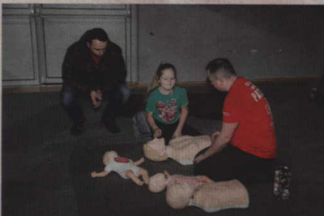
Członkowie Pokojowego Patrołu uczyli, jak ratować ludzkie życie.