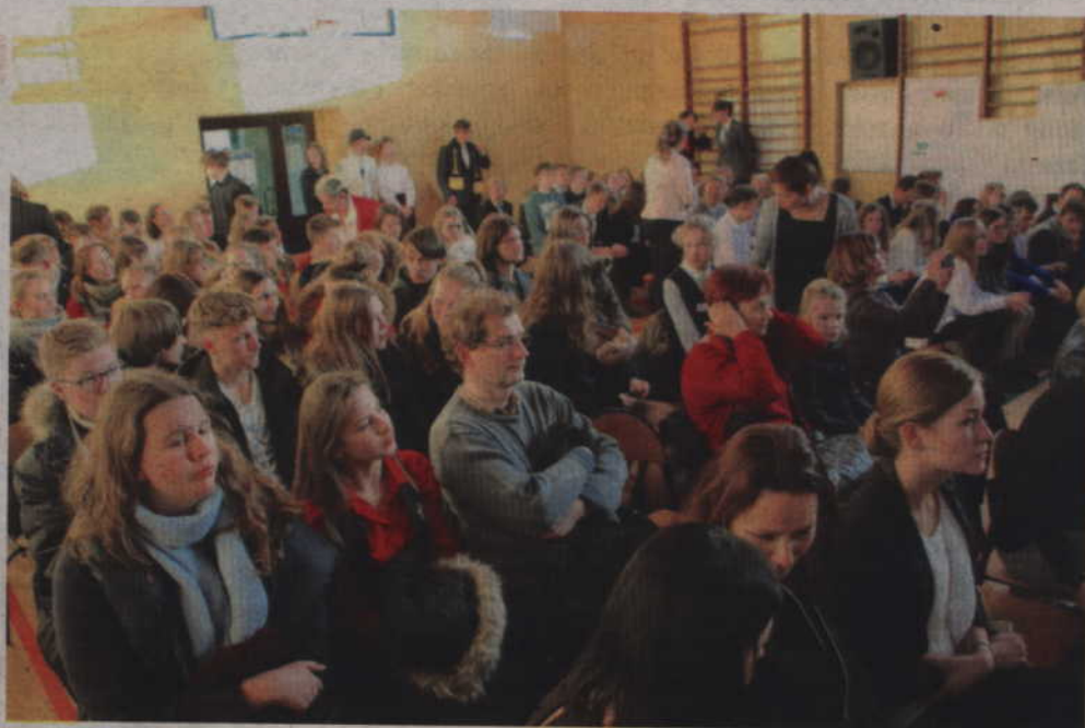
Podsumowanie akcji odbyło się w szkolnej sali gimnastycznej.

Uczestnicy spotkania mieli do wykonania prace literackie (wiersz ku czci Noblisty), a także prace plastyczne inspirowane patriotycznymi słowami latarnika z noweli H. Sienkiewicza. Podejmowali również działania eksperymentalne w postaci nagrania filmu prezentującego ich w trakcie doświadczenia fizycznego i chemicznego oraz wykazywali się postawą obywatelską układając slogan dotyczący pokoju na świecie. Wszystkie działania podle-