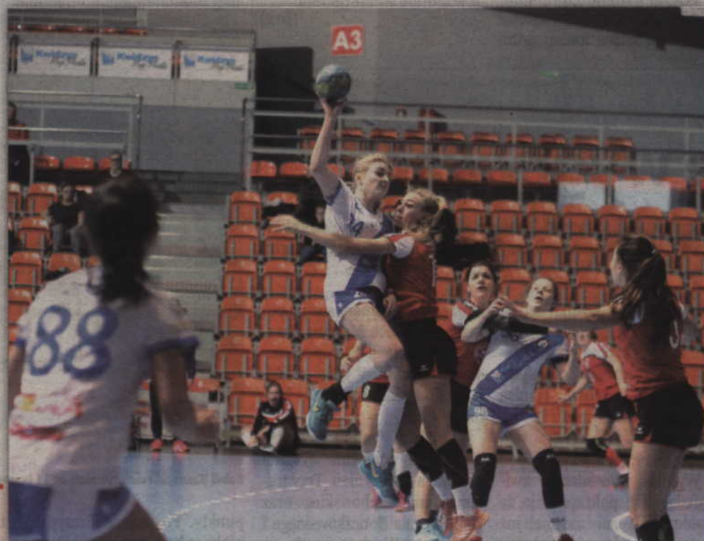
W pierwszej fazie rywalizacji centralnej kwidzynieki odprawiły m.in. Kusego Szczecin.

Niedziela, 10 lutego 10.00 MKS Karczew - UKPR Agrykola Warszawa 12.00 MTS Kwidzyn - Korona Handball Kielce