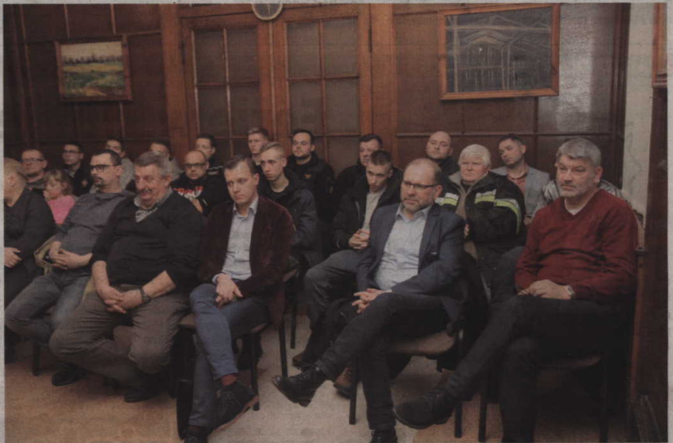
Na styczniową sesję rady miasta przyszedł również prabucy strażacy-ochotnicy.

-Przejeżdżam obok boiska asfaltowego praktycznie każdego dnia i mogę z całą odpowiedzialnością powiedzieć, że nie byłem świadkiem korzystania z tego boiska. Jeśli już mówimy o jego wykorzystaniu to okazją do tego są