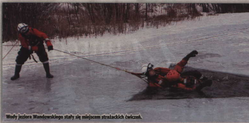
Wody jeziora Wandowskiego stały się miejscem strażackich ćwiczeń.

GARDEJA. Komenda Powiatowa Państwowej Straży Pożarnej w Kwidzynie przeprowadziła szkolenie z ratownictwa lodowego. Strażackie ćwiczenia odbyły się na jeziorze Wandowskim (gm. Gardeja).