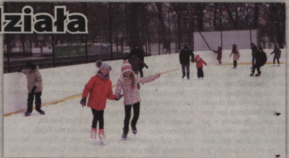
Lodowisko funkcjonuje na Orliku przy ul. Hallera (za budynkiem SP5).