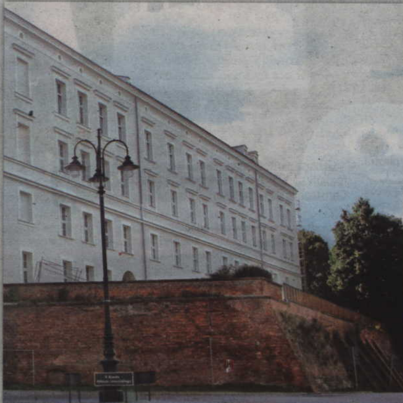
Do końca czerwca rozliczona zostanie modernizacja budynku Zespołu Szkół Ponadgimnazjalnych nr 2 w Kwidzynie. Prace modernizacyjne powinny zakończyć się ok. 1,5 miesiąca wcześniej.

Modernizacja wnętrza budynku Zespołu Szkół Ponadgimnazjalnych nr 1 zakończyła się w połowie ubiegłego roku. Zakres prac w tej szkole był jednak o wiele mniejszy. Za-