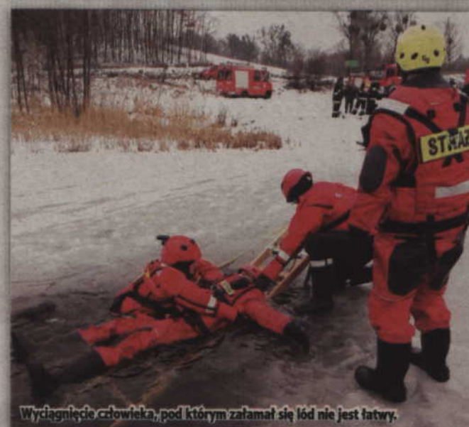
Wyciągnięcie człowieka, pod którym załamał się lód nie jest łatwy.