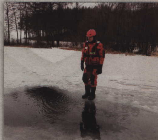
Wejść czy nie wejść do lodowatej wody, zdaje się zastanawiać strażak-ochotnik.

Tegoroczna zima nie powinna nikogo zbytnio martwić. Temperatury nie są wprawdzie bardzo niskie, ale wystarczające na tyle, aby śnieg zbyt szybko nie zniknął. Panujące mrozy skuli lodem wszystkie jeziora, stawy i najróżniejsze rozlewiska. Nie brakuje więc osób, które korzystają z tego i czasami wbrew rozsądkowi postanawiają wejść na lodową taflę, a to już może zakończyć się nieszczęśliwym wypadkiem. Dlatego Komenda Powiatowa PSP w Kwidzynie postanowiła przeprowadzić specjalistyczne ćwiczenia na zamrożonym zbiorniku wodnym. Odbyły się one w minioną sobotę (2 lutego) na jeziorze Wandowskim w gmina Gardeja. Ich celem było ćwiczenie umiejętności niesienia pomocy osobom, pod którymi załamał się lód, a w zajęciach wzięły udział jednostki OSP włączane do Krajowego Systemu Ratowniczo-Gaśniczego. Na miejscu ćwiczeń zameldowały się zatem zastępy strażackie z OSP w Sadlinkach, Pastwie, Rakowcu, Tychnowach, Prabutach, Sypanicy, Ryjewie i Gardej. W doskonaleniu umiejętności niesienia pomocy osobom, pod którymi załamał się lód, wzięli udział również strażacy z Nebrowa Wielkiego, Kaniczek, Bronisławowa i Olszanicy.