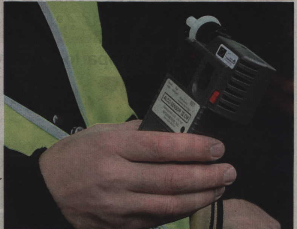
Zatrzymany 25-latek prowadził auto mając 1,7 promila alkoholu. Dodatkowo podczas interwencji próbował wręczyć funkcjonariuszom „łapówkę”, a także znieważał mundurowych i naruszył ich nietykalność.

Funkcjonariusze poinformowali kierującego, że popełnił przestępstwo. Wówczas mężczyzna zaproponował im pieniądze, by mundurowi odstąpili od swoich czynności. Gdy policjanci poinformowali go, że zostaje zatrzymany za popełnione przestępstwo, spowodowało to u niego agresywne zachowanie. Stróża prawa pouczali mężczyznę, aby zachowywał się zgodnie z prawem. Jednak 25-latek nie reagował na wydawane polecenia, zaczął znieważać funkcjonariuszy oraz naruszył ich nietykalność. Policjanci byli zmuszeni użyć wobec niego chwytów obezwładniających i kajdanek – wyjaśnia sierż. sztab. Anna Filar z Komendy Powiatowej Policji w Kwidzynie.