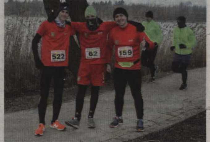
Traktor Team Gmina Kwidzyn także był obecny w sztumskim Grand Prix.