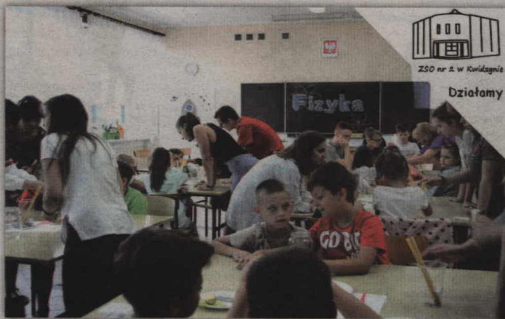
Szkolny Festiwal Nauki przygotowany był dotychczas dla uczniów wybranych szkół podstawowych i przedszkoli.

uczniowskie grupy projektowe, prowadzone przez nauczycieli zgłaszają pomysły, a jury po ich ocenie przyznaje granty finansowe wspierające ich realizację. Dzięki temu uczniowie mają szansę na spełnienie marzeń oraz możliwość wdrożenia w życie swoich planów. Uczą się, jak przejść drogę od projektowania do wykonania. Zyskują teoretyczną, ale i praktyczną