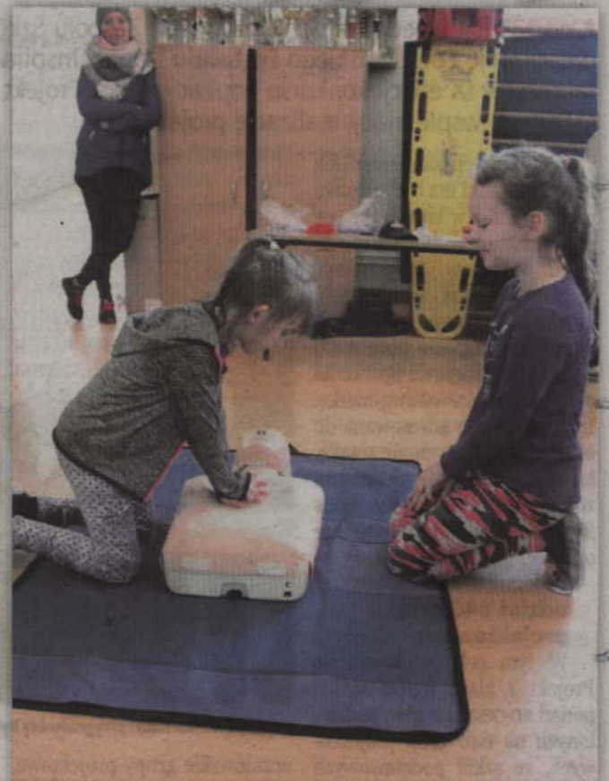
Masaż serca przeprowadzono z wykorzystaniem fantoma.