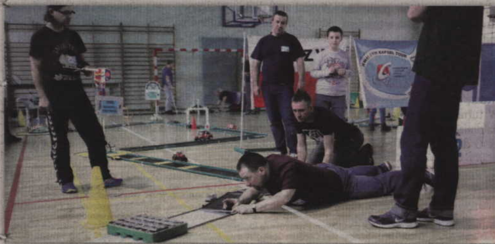
Tor do gry w kapsle ułożony zostanie w hali KCSiR przy ul. 11 Listopada.