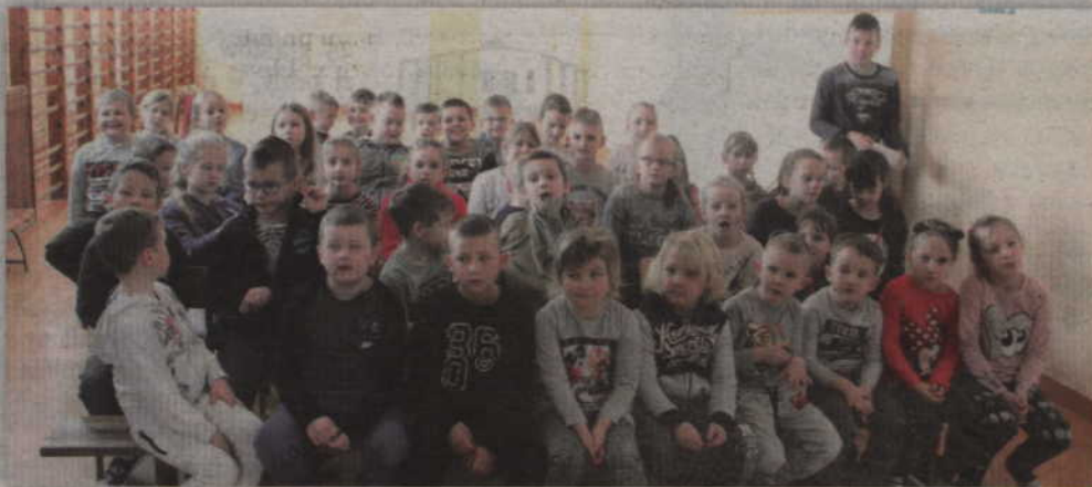
Strażacy – ochotnicy odwiedzili szkołę w Cyganach w ramach tygodnia profilaktyki.