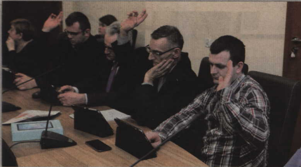
Siedmiu radnych było za podjęciem uchwały intencyjnej, dzięki której będzie możliwa zmiana miejsca istnienia szkoły w Morawach.

gminie Gardeja odniosła się ponownie Małgorzata Kensicka-Knyblewska. Poinformowała, że pewne pomysły już są i kiedy ktoś np. z mieszkańców pyta o szkoły, to dowiaduje się o planach. W 2019 roku urzędnicy chcą rozpocząć spokojną pracę nad ostatecznym kształtem oświaty i sieci szkół. Tym samym kolejne etapy będą przygotowywane bardzo spokojnie i na pewno z wyprzedzeniem.