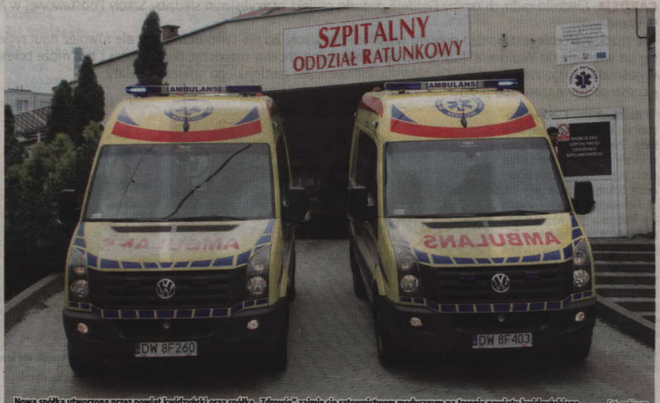
Nowa spółka utworzona przez powiat kwidziński oraz spółkę „Zdrowie” zajmie się ratownictwem medycznym na terenie powiatu kwidzińskiego.