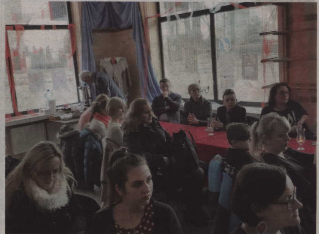
Miejsko - Gminna Biblioteka Publiczna w Prabutach była współorganizatorem spotkania autorskiego.

śliwe i sprawiedliwe zakończenie, gdzie dobro pokonuje zło, uniwersalne miejsce i czas akcji, a także nieskomplikowana fabuła. Dla urozmaicenia czytelnik otrzymuje wątek miłosny i sensacyjno-kryminalny. Autorka przez całą fabułę trzyma czytelnika w niepewności i nie zdradza nawet rąbka tajemnicy. Dopiero w ostatnim rozdziale odsłania pełni-