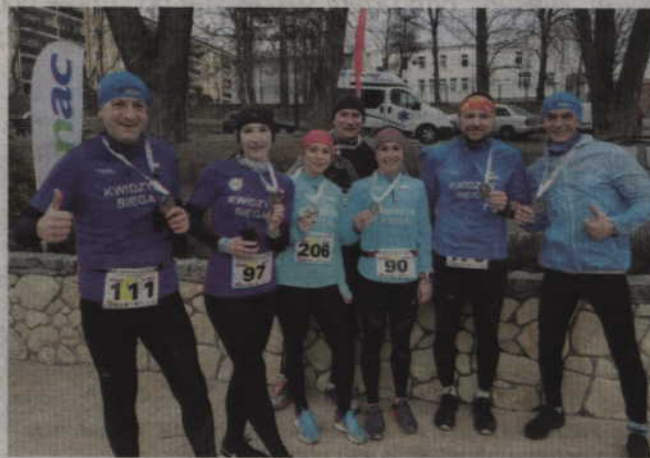
Silna biegowa ekipa ze stowarzyszenia Kwidzyn Biega.

tyr Sztum, cieszy się niesłabnącym zainteresowaniem. W tym roku zawody składały się z czterech biegów organizowanych w miesięcznych odstępach. Trasa biegu, tak jak w latach ubiegłych, została wytyczona wokół jeziora Zajezierskiego. Biegacze mieli natomiast do pokonania dwie