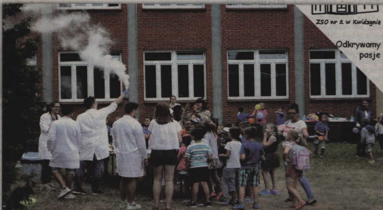
Na realizację Powiślańskiego Festiwalu Nauki „Inspiracje” uczniowie II LO otrzymali grant w wysokości 1000 zł.

W szkolnej pracowni biologicznej, chemicznej i fizycznej będzie można samodzielnie wykonać eksperymenty. Na wszystkich będzie też czekał pokój zagadek, escape rooms. Na wystawionych stanowiskach każdy będzie mógł rozwiązać quiz, wykazać się kreatywnością i zgłębić pod mikroskopem tajniki biologii. Odbędą się także warsztaty papieru czerpanego, pokazy chemiczne, kurs pierwszej pomocy, pokazy sportów walki w wykonaniu uczniów klas mundurowych, kurs tańca, plener malarski. Nie jest możliwe, aby wymienić wszystkie zaplanowane aktywności. Grupy uczniów, nauczyciele opracują poszczególne wydarzenia festiwalowe. Projekt zostanie zrealizowany w czerwcu 2019 roku.