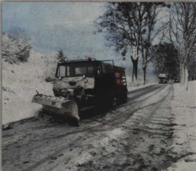
W ciągu ostatnich 6 lat najkosztowniejsza była zima na przełomie lat 2011 i 2012. Samorząd powiatu wydał wówczas ok. 1,1 mln zł.

Warto przypomnieć, że od tego roku obowiązują inne umowy z wykonawcami zajmującymi się zimowym utrzymaniem dróg. Zostały one podpisane na 3 lata. Zmieniła się także forma rozliczania usług, gdyż firmy otrzymują pieniądze za gotowość. W poprzednich okresach zimowych