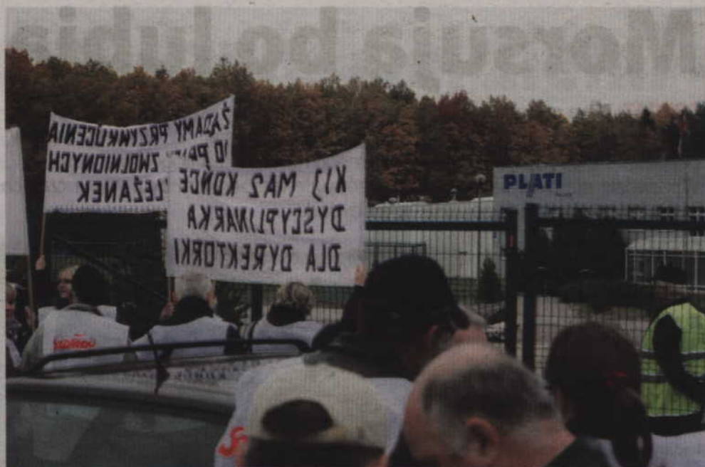
Początek strajku w firmie „Plati” zaplanowany został na czwartek, 21 lutego. Pracownicy powstrzymają się od pracy przez 3 godziny, na każdej zmianie.

-Tak jak zaznaczyliśmy w komunikacie przesłanym do pracodawcy, nie doszło do porozumienia. Referendum się odbyło i w jego wyniku zapadła decyzja o zaostrożeniu protestu. Należy przypomnieć, że w trakcie wcześniejszych rozmów pracodawca obiecał nam i na dodatek dał na piśmie zapewnienie, że we wrześniu ubiegłego roku będą podwyżki. W tym samym miesiącu doszło do spotkania z przedstawicielami załogi oraz zarządu firmy i zarząd wycofał się z tych obietnic. Nie chciano z nami rozmawiać o podwyższeniu wynagrodzeń z powodu złej sytuacji ekonomicznej zakładu. Zaznaczono również, że tych podwyżek nie będzie nie tylko w 2018 roku ale także w 2019. Ta wiadomość została przekazana załodze „Plati”. Poprosiliśmy o pomoc mediatora, ale ono także nic nie dało. Po referendum strajkowych zarząd firmy w ogóle nie chce z nami rozmawiać. Chcę to bardzo mocno zaznaczyć, że pod-