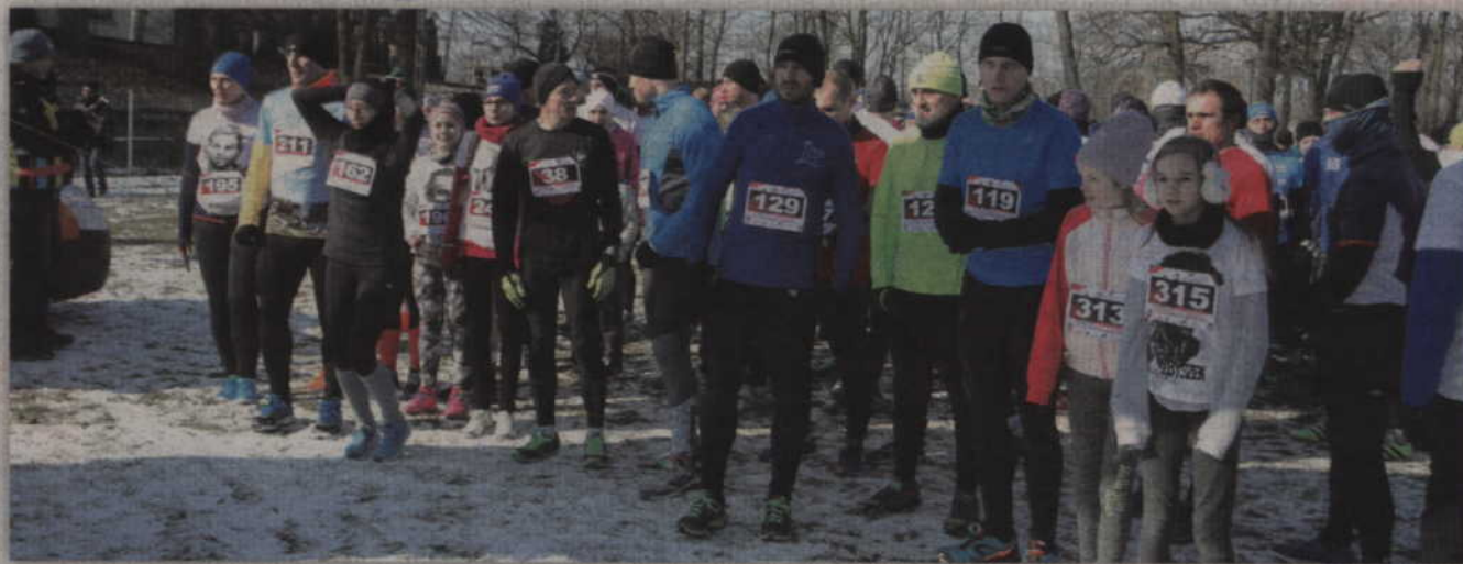
W trzeciej, gardejskiej edycji biegu wystartowało ponad 268 biegaczy.

jest zbyt mała. Ilość telefonów do biura ośrodka czy liczba e-maili z pytaniami czy są jeszcze wolne miejsca na nasz bieg jest dowodem na to, że bieg na stałe wpisał się kalendarz sportowych imprez w naszym regionie. Również dla nas jest to powód do radości. Wzorem poprzednich biegów, wyznaczymy dwie trasy. Pierwsza, licząca dokładnie 1963 metry, to trasa rodzinna. Druga trasa będzie liczyła 10 km i będzie przeznaczona dla tych osób, które lubią większy wysiłek biegowy. Szczegóły związane z biegiem zamieszczamy na bieżąco na stronie internetowej ośrodka