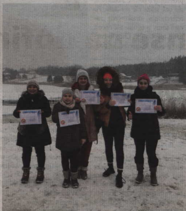
Certyfikat z morsowania fajna rzecz, zawsze można się tym pochwalić w gronie znajomych.