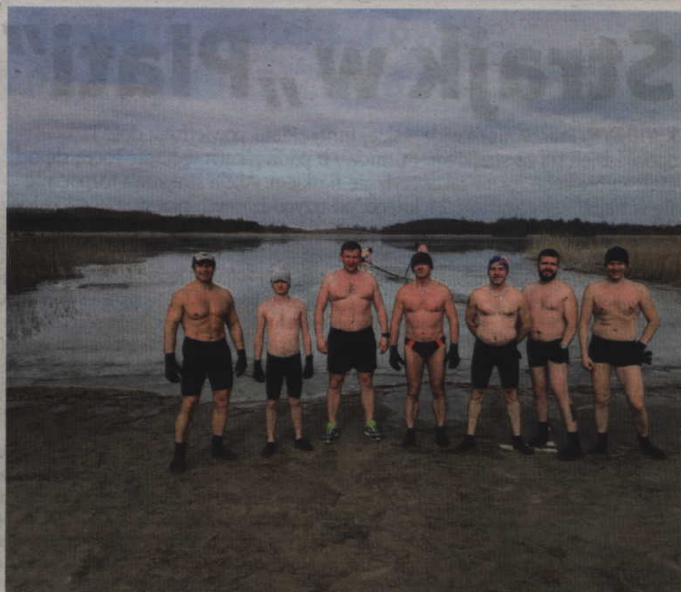
Prabuciacy jako miejsce swoich stałych kąpiel wybrali jezioro Sowica.