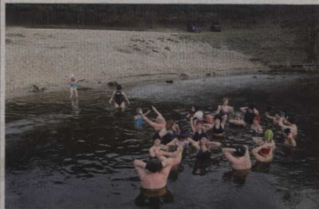
Kwidzyniaci aby pomorsować jeżdżą za Wisłę do Rakowca.