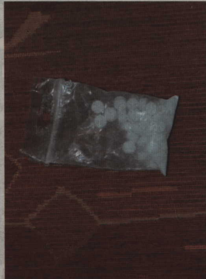
W mieszkaniu prabucanina znaleziono ponad 500 g amfetaminy oraz 25 tabletek metaamfetaminy.