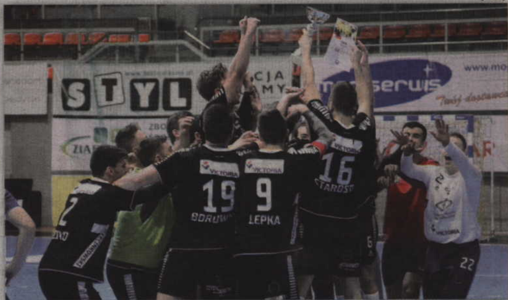
Radość ŚKPR Świdnicy I po zwycięstwie w kwidzyńskim turnieju.