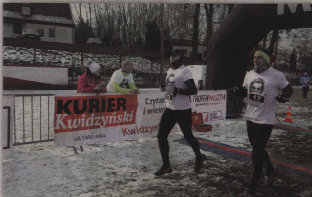
Od trzech lat imprezie biegowej patronuje K „Kurier Kwidzyński” i portal www.kwidzyn1.pl .