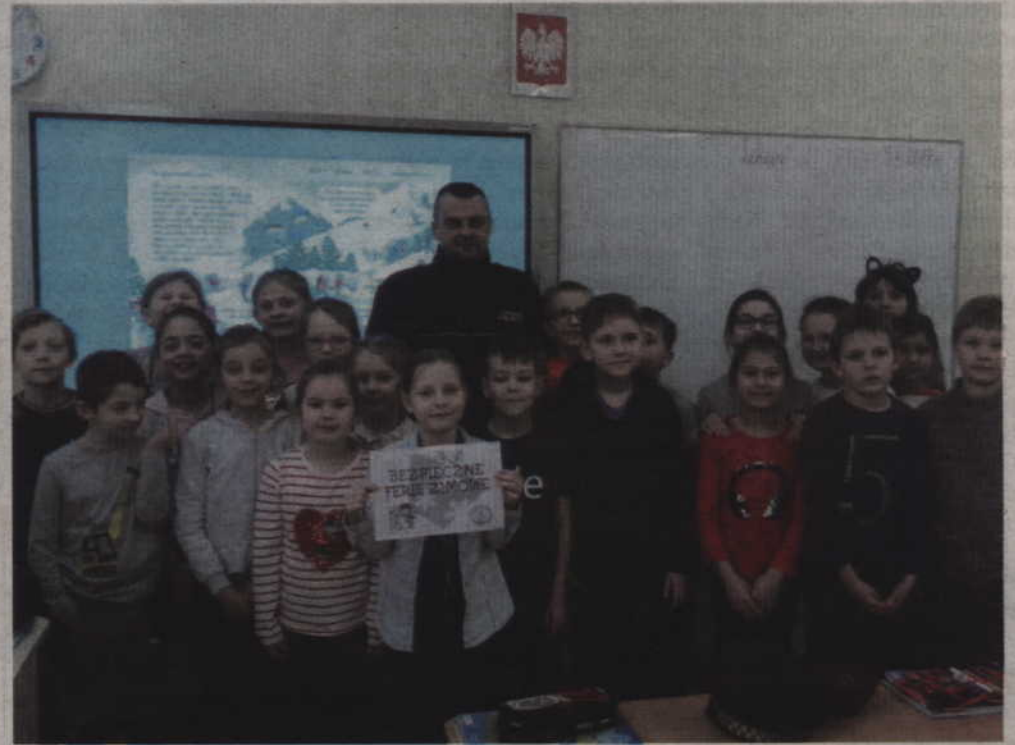
Bezpieczne ferie w szkole sportowej.