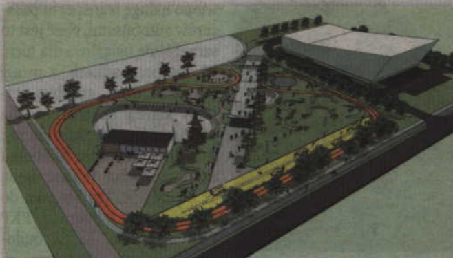
Budowa zadaszania dla targowiska przy ul. Kopernika wyprzedzi inną planowaną inwestycję, którą ma być park rekreacyjno-wypoczynkowy przy ul. Słowackiego. Projekt przewiduje budowę skateplazy, wrotkowiska i lodowiska oraz toru dla rolkarzy.

Mamy gotowy projekt i pozwolenie na budowę parku rekreacyjnego. To jednak dość kosztowna inwestycja, gdyż zagospodarowanie całego terenu szacujemy na 8 mln zł. Ogłosiliśmy dwa przetargi w ubiegłym roku i nie zostały one rozstrzygnięte. Teren wykorzystywany jest jako targowisko. Chcemy jednak to zmienić i stworzyć jedno targowisko przy ul. Kopernika, które funkcjonowałyby przez cały tydzień. Dlatego też zdecydowaliśmy się na zadaszanie. Nie