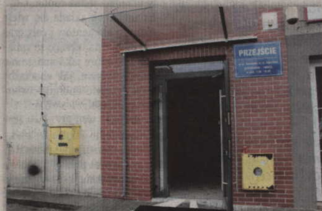
Mieszkańcy mogą korzystać z przejścia łączącego targowisko z parkingiem położonym za siedzibą starostwa przy ul. Kościuszki.