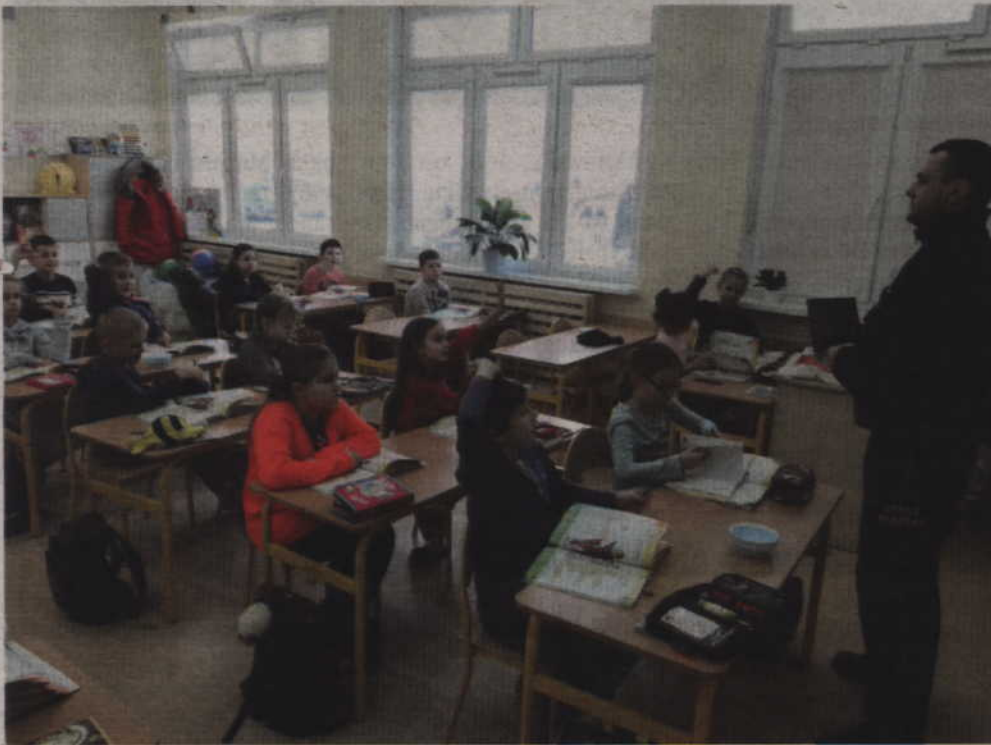
Wizyta w Szkole Podstawowej z Oddziałami Mistrzostwa Sportowego.