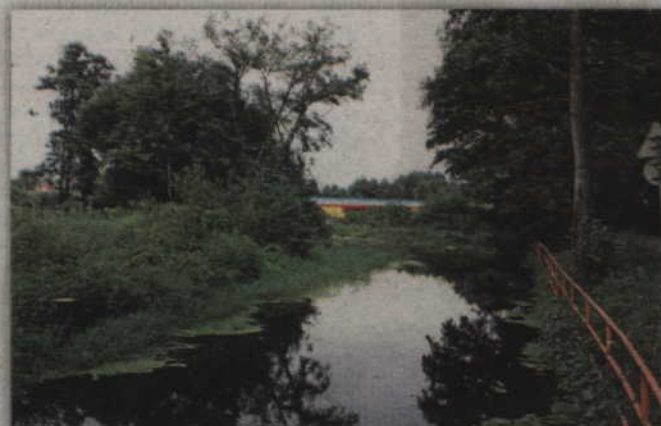
Według przygotowanego projektu budowy zalewu szerokość rozlewiska na poziomie normalnego lustra wody miałby wynosić od 20 do 150 m, natomiast na poziomie maksymalnego poziomu do 160 m. Planowana długość to ok. 600 m.

- Zawiesiliśmy inwestycje, ale z niej nie rezygnujemy. Mamy przeprowadzoną inwentaryzację środowiskową. Nie mamy jeszcze raportu wpływu zalewu na środowisko. Próbowaliśmy znaleźć wykonawcę, ale proponowane ceny były bardzo duże. Nie spieszymy się obecnie z pracami. Przygotowanie pełnej dokumentacji było dla nas ważne 2 lata temu, gdyż