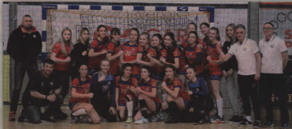
Juniorki MTS Kwidzyn awansowały do ćwierćfinału z pierwszego miejsca w swojej grupie.