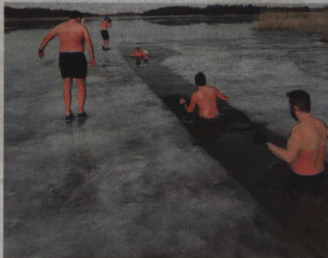
Przerębel w lodzie wycięty można powoli się zanurzać w lodowatych wodach jeziora Sowica.