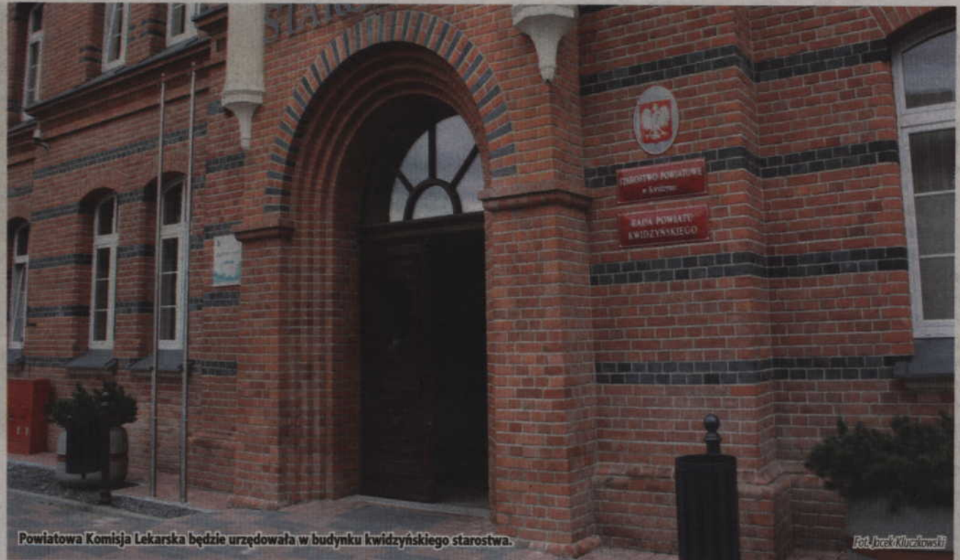
Powiatowa Komisja Lekarska będzie urzędowała w budynku kwidzińskiego starostwa.

Osoby chcące uzyskać informacje związane z kwalifikacją wojskową mogą kontaktować się pod numerem telefonu 55 646 50 70.