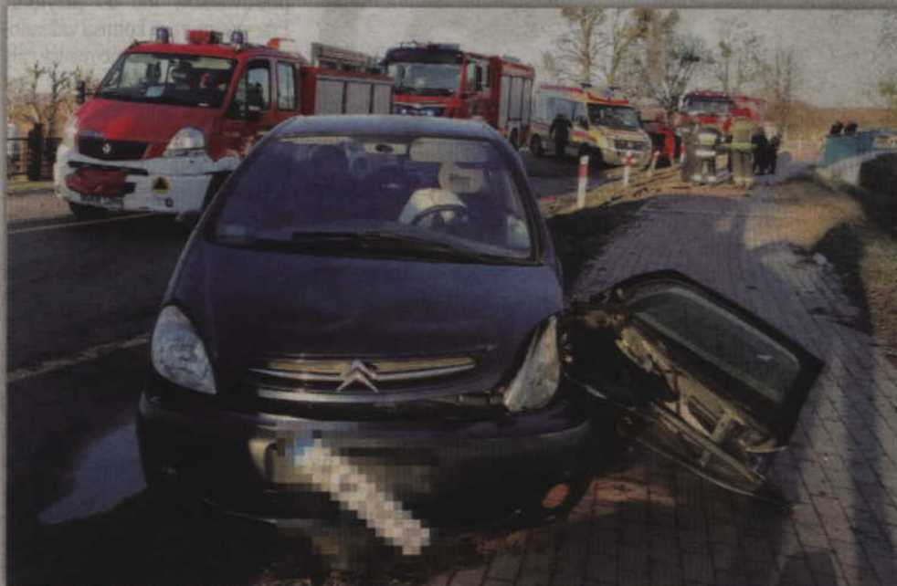
Sprawcą wypadku był 43-letni kierowca citroena. Jak informuje kwidzyńska Policja pobrano od mężczyzny krew do badań, gdyż wyczuwalna była od niego woń alkoholu.

- Pamiętajmy, że bezpieczeństwo na drogach zależy od nas samych, od decyzji, które podejmujemy - podkreśla sierż. sztab. A. Filar. (fox)