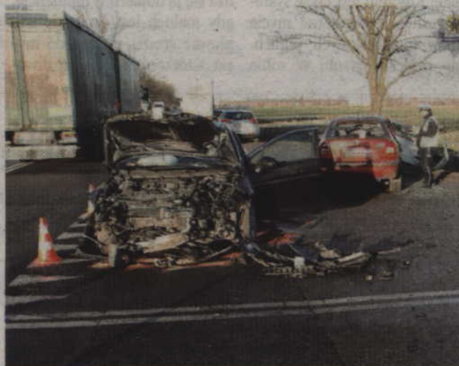
Funkcjonariusze zabezpieczyli pojazdy na policyjnym parkingu. Śledczy szczegółowo wyjaśniają przyczyny i okoliczności tego zdarzenia.

Mundurowi zabezpieczyli miejsce wypadku, podczas gdy strażacy uwalniali z renaulta zakleszczoną 45-letnią kobietę. Policjanci dokonali oględzin, rozpytali świadków, technik kryminalistyki zabezpieczył ślady i wykonał dokumentację fotograficzną. Kierowcy skody i oplota z obrażeniami zostali przewiezieni do szpitala w Tczewie, a kierująca renaultem i jej pasażerowie do szpitala w Malborku.