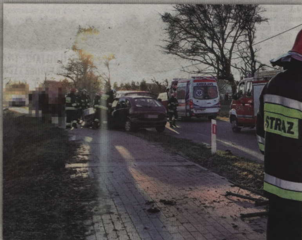
Do wypadku doszło na trasie Mareza - Nowy Dwór.