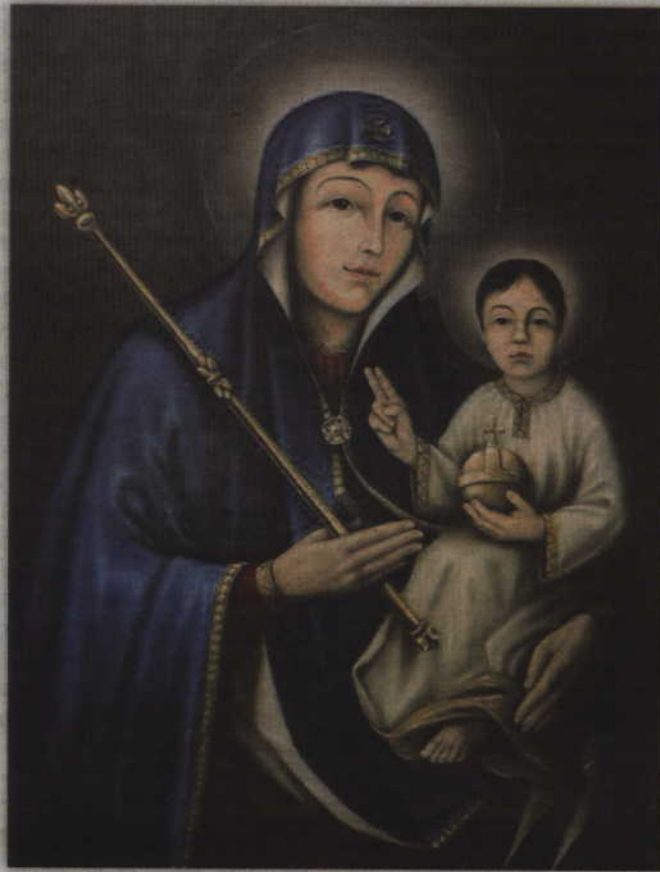
Matka Boska Kazimierzecka w rzeczywistości była ikoną.

Wykonana w XVII wieku kopia tego obrazu była obiektem kultu w sanktuarium w Kazimierce, wsi założonej w 1629 roku przez kanclerza wielkiego litewskiego Stanisława Albrechta Radziwiłła. Obecnie miejscowość ta nosi nazwę Kuźmówka i znajduje się na Ukrainie, w obwodzie rówieńskim. Jak informują ówczesne kroniki, od czasu kiedy obraz pojawił się w kaplicy kazimier-