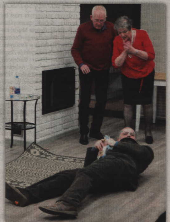
W spektaklu nie brakuje żywych i dowcipnych dialogów oraz nagłych zwrotów akcji.