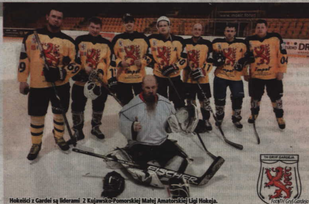
Hokeiści z Gardej są liderami 2 Kujawsko-Pomorskiej Małej Amatorskiej Lidze Hokeja.