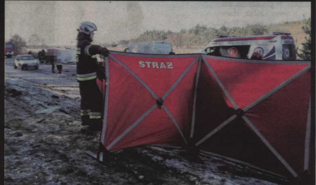
W wyniku wypadku śmierć poniósł 54-letni mieszkaniec powiatu kwidzińskiego.

GMINA SADLINKI. Kierujący dostawczym vw 21-latek najpierw czołowo zderzył się z nadjeżdżającym audi, po czym uderzył także w jadącego za nim opla. W wyniku wypadku kierujący audi 54-latek poniósł śmierć na miejscu. Kierujący vw i oplem zostali natomiast przetransportowani do szpitali w Grudziądzu i Kwidzynie.