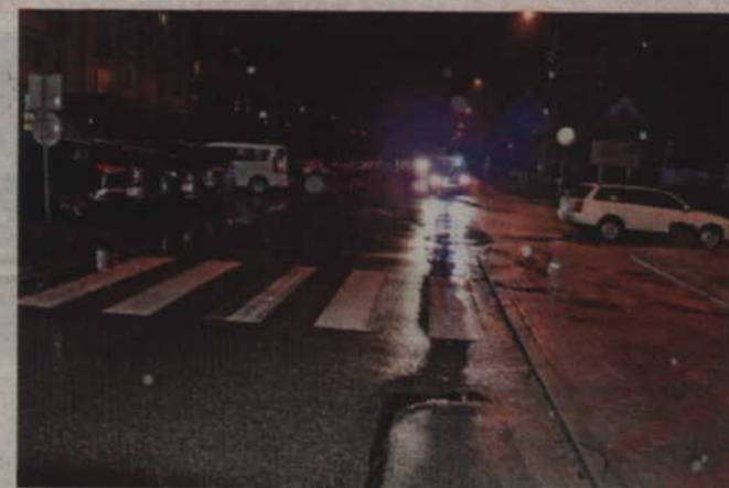
Siedemnastolatka została potrącona przez kierującego audi na przejściu dla pieszych znajdującym się na ul. Szerokiej.

-Kiedy tylko zaczyna brakować nam wyobraźni i zdrowego rozsądku dochodzi do przykrych, a niejednokrotnie tragicznych w skutkach zdarzeń, w których poszkodowa-