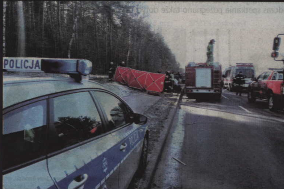
Zderzenie dostawczego vw i dwóch osobówek nastąpiło na prostym odcinku drogi, tuż przed Sadlinkami.

Do wypadku doszło w miniony piątek, 22 lutego. Około godz. 11.00 dyżurny kwidzińskiej Komendy został powiadomiony, że na prostym odcinku drogi przed Sadlinkami doszło do czołowego zderzenia pomiędzy dostawczym vw i osobowym audi. Na miejsce natychmiast skierowani zostali policjanci oraz inne służby ratunkowe.