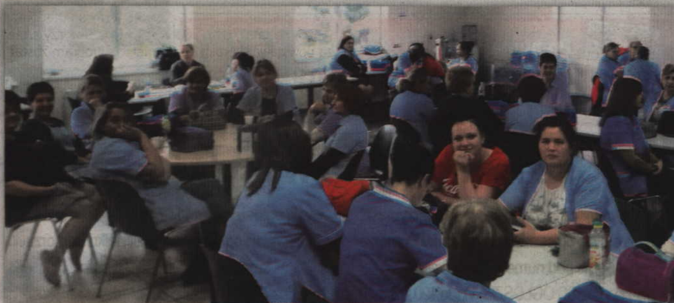
Od wtorku, 26 lutego, związkowcy zaostrożili strajk.

Od 5 dni prowadzimy strajk, domagamy się podwyżek płac dla pracowników Plati Polska. W strajku uczestniczy zdecydowana większość pracowników (...). Część pracowników nie uczestniczy w strajku i mają do tego prawo. Rozumiemy ich postawę jako rezygnację z podwyżek, o które zabiegamy. Jeżeli koleżanki i koledzy nie podzielają przekonania większości pracowników o konieczności walki o podwyżki wynagrodzeń to nie będą również ubiegać się o ewentualne podwyżki będące skutkiem strajku. To chyba minimum przyzwoitości a przecież wszyscy podzielamy zasadę, że warto być przyzwoitym (...). Dziękujemy wszystkim organizacjom zakładowym popierającym nasz protest. Dziękujemy mediom lokalnym jak i ogólnokrajowym, które informują o naszym strajku.