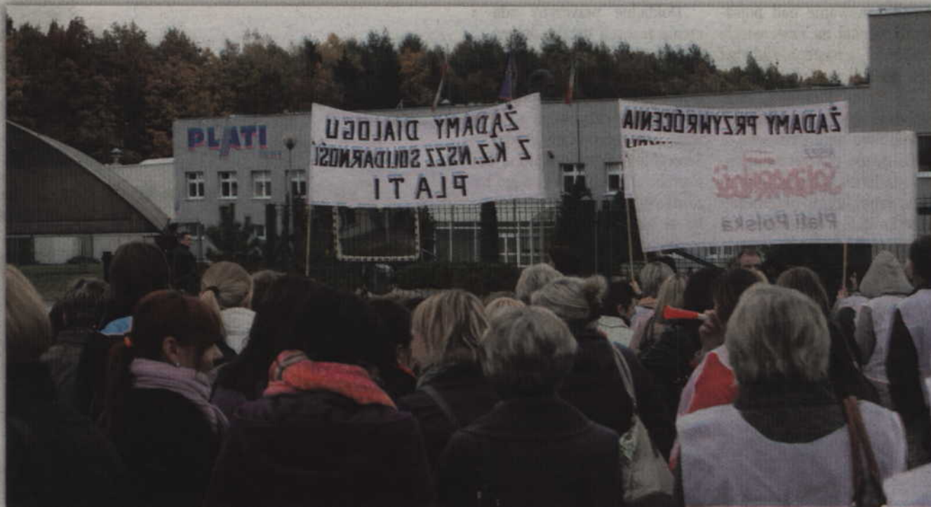
Większość załogi Plati Polska stanowią kobiety.

Mimo chęci rozmów i ustępstw ze strony pracowników, zarząd firmy nie zdecydował się na podwyższenie pracowniczych pensji. W dniu 21 lutego o godzinie 11.00 pracownicy Plati Polska sp. z o.o. w Kwidzynie przystąpili zatem do strajku. Stał się dział produkcyjny zakładu. Jak podkreślają działacze „Solidarności” jest to efekt braku porozumienia zakładowej „S” z pracodawcą i jednocześnie braku podwyżek. Część pracowników zarabia niewiele