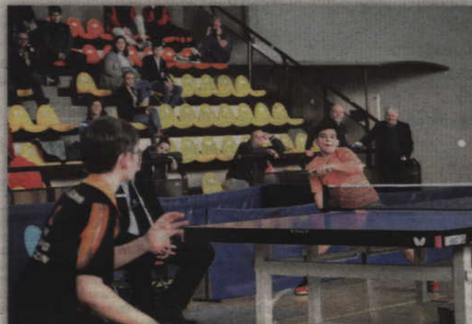
Finałowe rozgrywki dostarczyły wielu emocji.