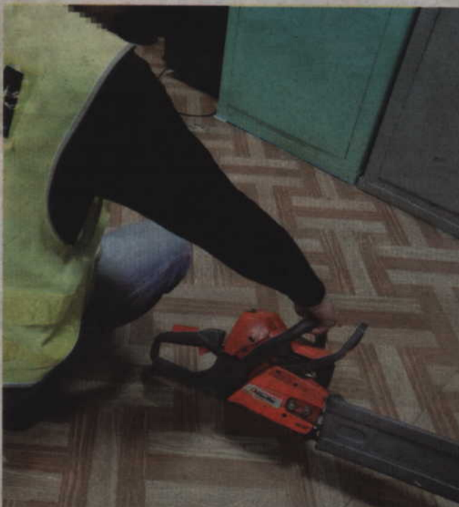
Kryminalni odzyskali skradzioną piłę spalinową.

KWIDZYN. Kryminalni zatrzymali 51-latkę podejrzanego o kradzież piły spalinowej. Mężczyzna ukradł piłę w jednym z kwidzińskich lombardów, aby następnie....zastawić ją w innym lombardzie. Za kradzież zatrzymanemu grozi kara do 5 lat pozbawienia wolności.