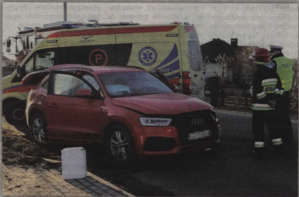
W wyniku wypadku do szpitala trafiły trzy osoby podróżujące citroenem oraz kierowca audi.