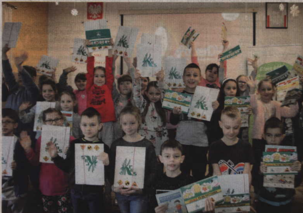
Dzieci z klas od I do III chętnie brały udział w dyskusji o bezpieczeństwie i zagrożeniach na wsi. Na zakończenie otrzymały malowanki, książeczki oraz komiksy z treścią dotyczącą pogadanki.