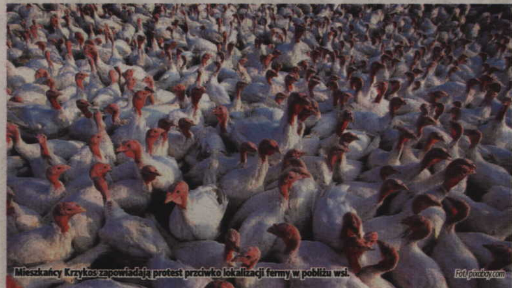
Mieszkańcy Krzykos zapowiadają protest przeciwko lokalizacji fermy w pobliżu wsi.