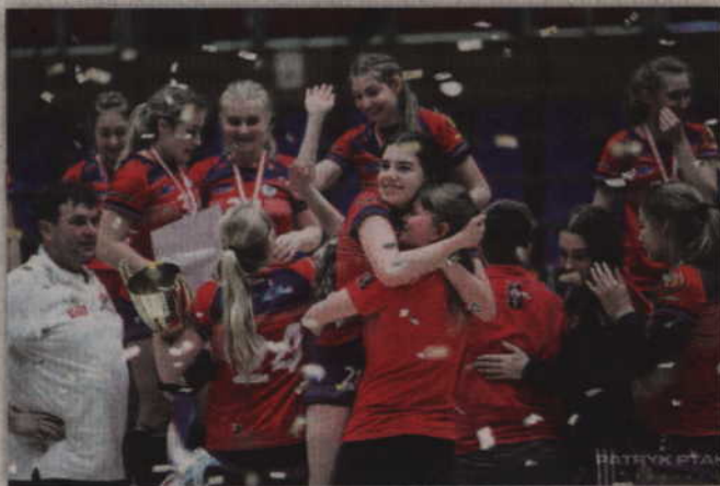
Radości ze zdobycia złotego medalu nie było końca.