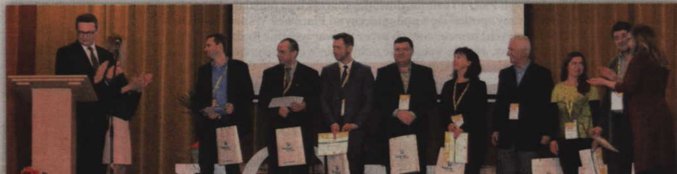
Jurorzy kwidzyńskiego Konkursu Naukowego E(x)plory.