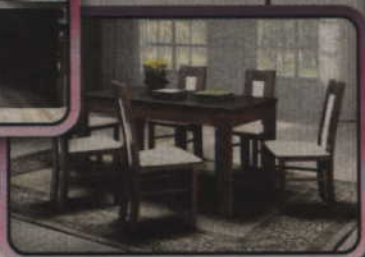
Stoły i krzesła