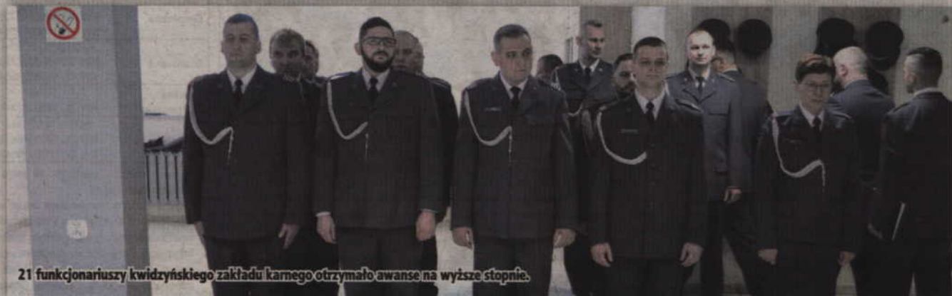
21 funkcjonariuszy kwidzyńskiego zakładu karnego otrzymało awanse na wyższe stopnie.