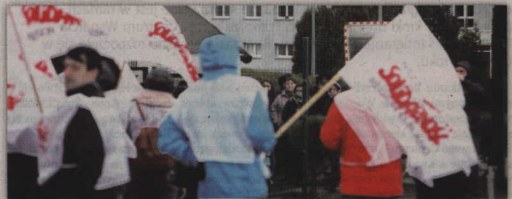
Związkowcy spotkali się pod bramką kwidzyńskiego zakładu Plati Polska.

ki, mieliśmy spotkania z pracodawcą. Pracodawca przekazał nam i całej załodze, że jest ciężka sytuacja w zakładzie, będą zachodziły zmiany i żebyśmy nie żądali podwyżek od kwietnia (...). Dostaliśmy gwarancję na piśmie, że dostaniemy podwyżki od września. Pracodawca wycofał się jednak z tego mówiąc, że jest ciężka sytuacja finansowa, że grupa przechodzi zmiany i w 2018 i 2019 roku nie przewiduje dla nas żadnych podwyżek. Co niektóre osoby z wyższego szczebla mówiły nam wręcz i mówią, że jak nam się nie podoba to