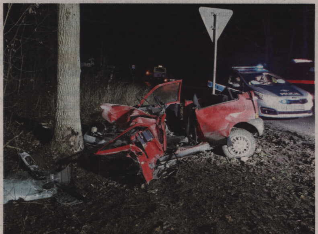
Trzy osoby jadące autem, z poważnymi obrażeniami ciała, trafiły do szpitala w Grudziądzu.

-Będąc pod wpływem alkoholu nasza uwaga jest rozproszona, a reakcje opóźnione. Nie potrafimy właściwie ocenić od-