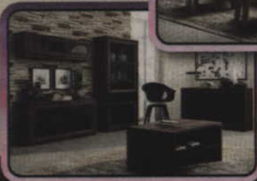
Szafy - komody