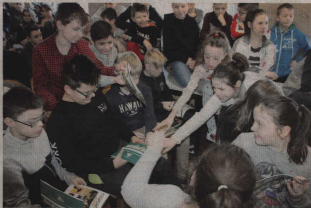
Młodzież z klas IV-VIII po brzegi wypełniła salę, w której rozmawiano o zagrożeniach na wsi.