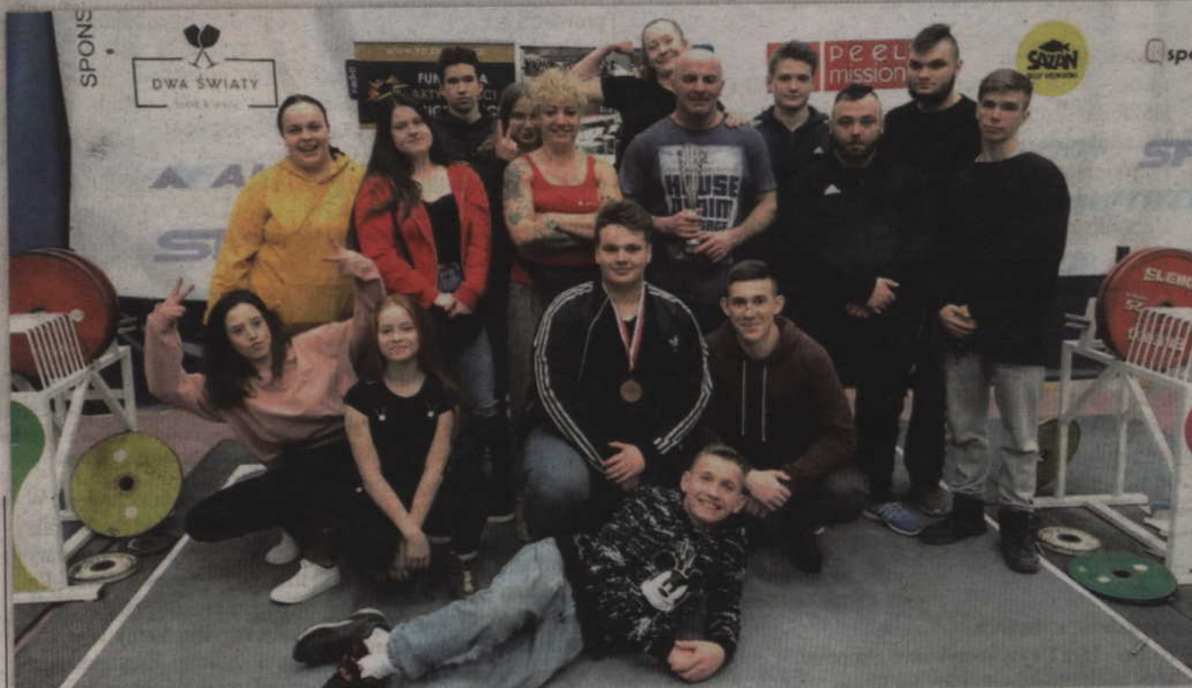
Kwidzyńscy ciężarowcy w Białymstoku nie mieli sobie równych. W rywalizacji drużynowej wywalczyli złoto i srebro.