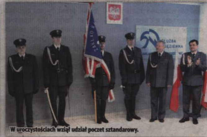
W uroczystościach wzięli udział poczet sztandarowy.