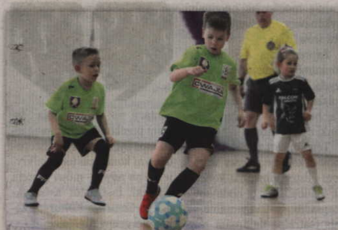
Rywalizacja roczników 2012-2013 to przede wszystkim dobra zabawa.