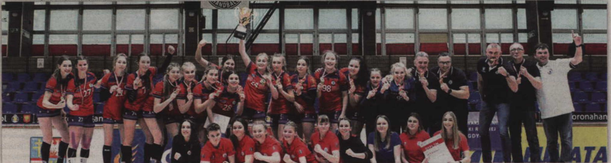
Drużyna MTS I Kwidzyn została mistrzem Polski juniorek. W finale kwidzynianki pokonały Koronę Handball Kielce 22:29.