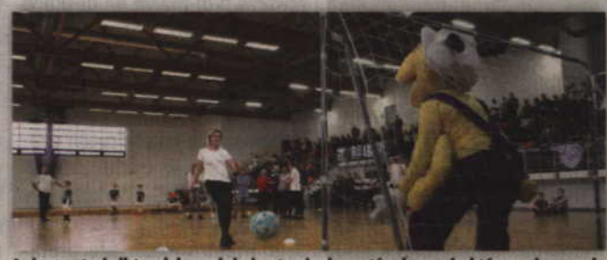
Jedną z atrakcji turniejowych było strzelanie rzutów karnych, które wykonywały mamy zawodników.

Rodło Kwidzyn oraz reprezentacja SP 6 i dwie drużyny gospodarzy. W grupie A pierwsze miejsce z kompletem punktów zajęła drużyna DSPN Kwidzyn