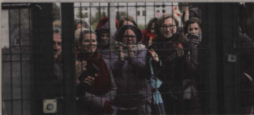
Część z protestującej załogi pojawiła się pod bramką kwidzyńskiego zakładu.