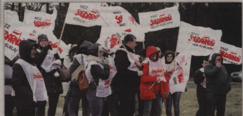
Pikietujący przyszłi wesprzeć strajkujących w kwidzyńskim zakładzie.

mamy się zwolnić z pracy. To nie jest rozwiązanie. Trzeba tak pracowników traktować i szanować, żeby pracownicy zostali w tym zakładzie pracy (...). Jeżeli pracodawcy nie zależy, żeby pracownik został w pracy tylko poszedł sobie to jaki to jest szacunek. Poza tym jest nasza taka wspólna zaduma nad tym wszystkim. Który pracodawca lub jaki pracodawca, jeżeli raz przeszedł strajk w zakładzie,