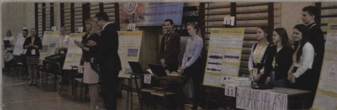
Zmagania zorganizowane w kwidzyńskim I LO były pierwszą edycją Szkolnego Festiwalu E(x)plory w województwie pomorskim.