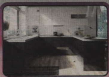
Kuchnie na wymiar