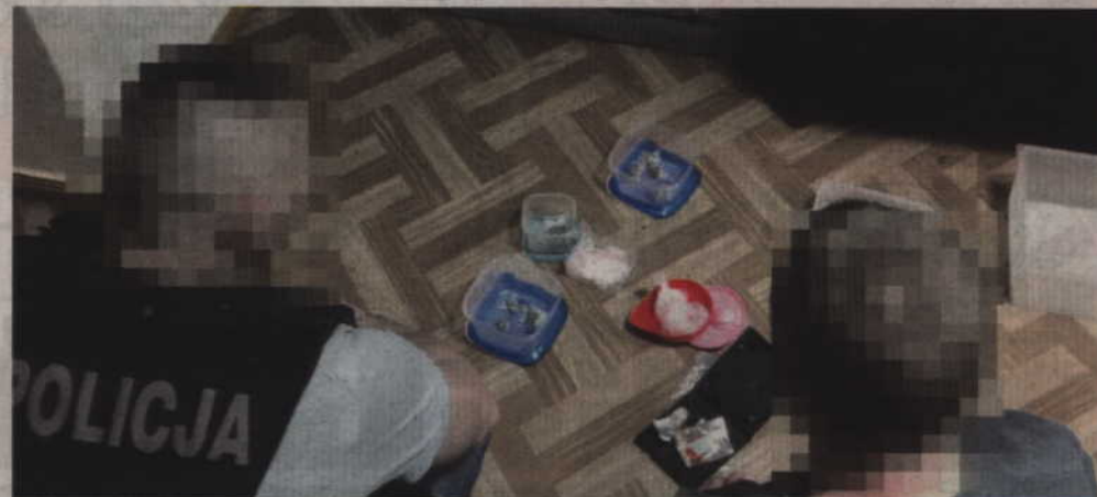
Funkcjonariusze zabezpieczyli łącznie 362 gramy zabronionych substancji.

-Ustalenia policjantów potwierdziły się. W miejscu zamieszkania pierwszego podejrzanego tj. 25-latkę, podczas przeszukania, policjanci znaleźli pudełko ze sporą ilością zielono-brązowego suszu roślinnego, białego proszku i różnokolorowych tabletek. Policjanci poddali mężczyznę kontroli osobistej i znaleźli przy nim torbę foliową z zawartością białego proszku. Łącznie u zatrzymanego mężczyzny ujawniono susz roślinny w ilości 9,10 gramów, amfetaminę o łącznej wadze 23,75 gramów oraz