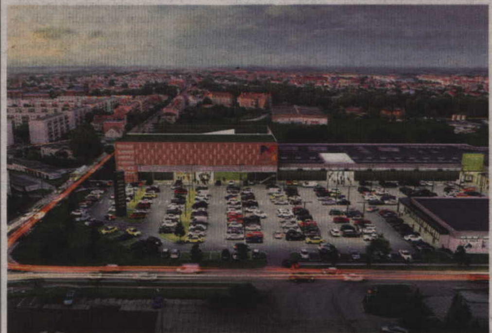
Galeria Metro Kwidzyn powstanie przy zbiegu ulic Toruńskiej i Południowej, na terenie po byłych zakładach WZPOW.

KWIDZYN. Pod koniec lutego Galeria Metro Kwidzyn zyskała nowego najemcę. Metropolitan Investment S.A. podpisał umowę najmu powierzchni z popularnym operatorem spożywczym - siecią Lidl. Dzięki podpisanemu porozumieniu powstanie tam sklep o powierzchni blisko 1,6 tys. m 2 .