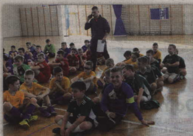
W dwudniowym turnieju uczestniczyli zawodnicy z okolicznych klubów piłkarskich.

Weekendowe (2-3 marca) zmagania rozpoczęły się od rywalizacji chłopców z rocznika 2007. Uczestniczyły w niej lokalne drużyny, podzielone na dwie grupy: AP Champions Kwidzyn/Ryjewo, Spójnia Sadlinki, Supra Kwidzyn I i II,