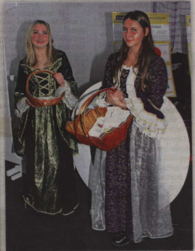
Szkoły, jak i Liceum Ogólnokształcące, stosowały różne formy promocji.