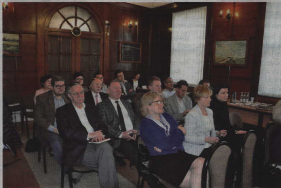
W prabuckim urzędzie miasta spotkali się samorządowcy zainteresowanych rozwojem lokalnych połączeń kolejowych.

PRABUTY. Dotychczasowe działania PKP Intercity są co prawda zadowalające, ale samorządowcy oczekują skoordynowania kolejowych przewozów regionalnych z rządowym przedsięwzięciem „Połączenia Lokalne”. Efektem prabuckiego spotkania był pomysł powołania zespołu roboczego, który opracuje potrzeby komunikacyjne na terenie powiatów malborskiego, sztumskiego, kwidzyńskiego i iławskiego.