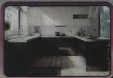
Kuchnie na wymiar