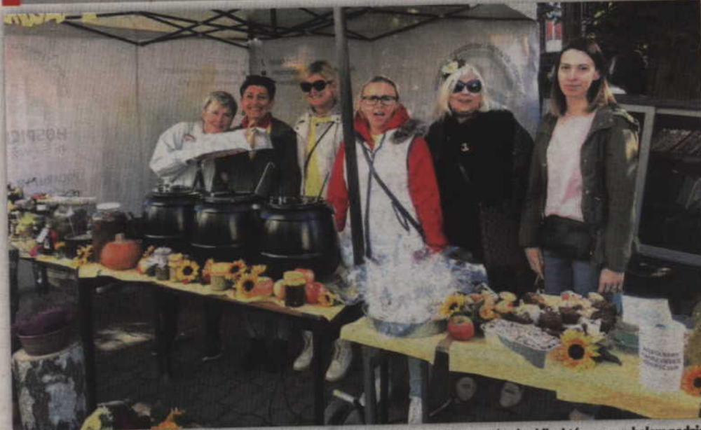
W niedzielę, 7 kwietnia, wolontariusze ubrani w żółte koszulki będą kwestować wręczając żonkile, które są symbolem nadziei na nowe życie. Na deptaku przy dawnej bibliotece pojawią się natomiast stoiska wolontariuszy z przysmakami i rękodzielami wolontariuszy.

- Wolontariusze ubrani w żółte koszulki będą kwestować w okolicach kościołów oraz na deptaku wręczając żonkile, które są symbolem nadziei na nowe życie. Na deptaku przy dawnej bibliotece staną natomiast stoiska z pysznościami i rękodzielami hospicyjnych wolontariuszy. Będą też występy zdolnych