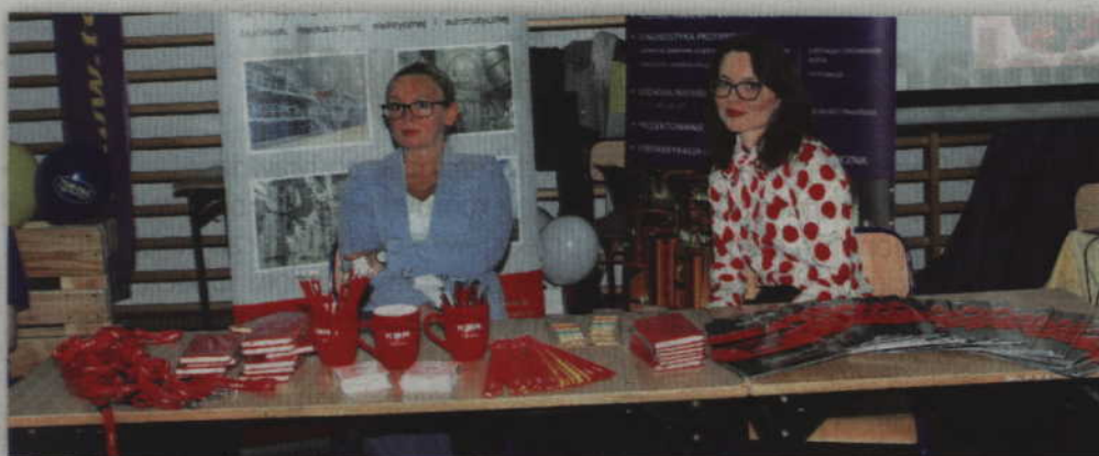
Swoją ofertę dla młodzieży zaprezentowała również firma KBR Poland.