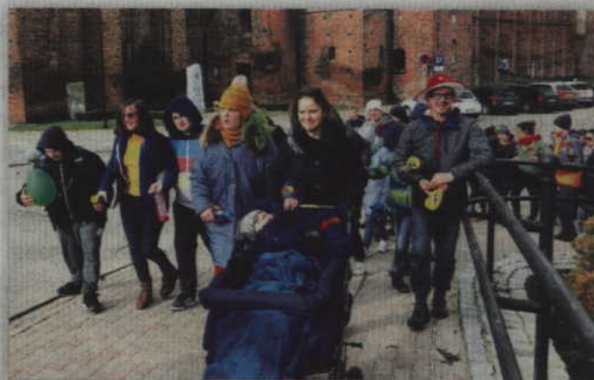
W kolorowej „Zakinadzie” uczestnicy przeszli ulicami miasta od Placu Św. Jana Pawła II do siedziby ZSS przy ul. Ogrodowej.

Jak podkreślano skarpetki nie do pary, które są symbolem Dnia Zespołu Downa, i które