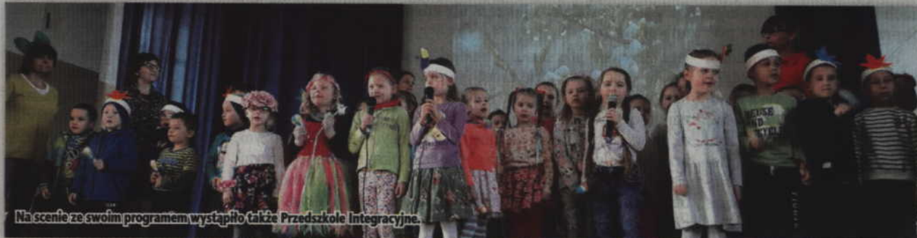
Na scenie ze swoim programem wystąpiło także Przedszkole Integracyjne.