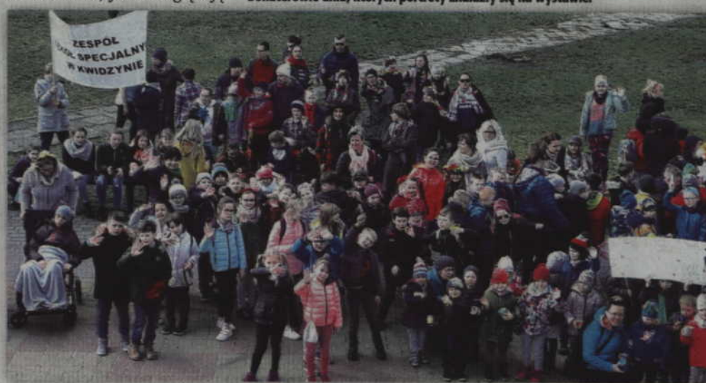
Wspólne zdjęcie uczestników imprezy.