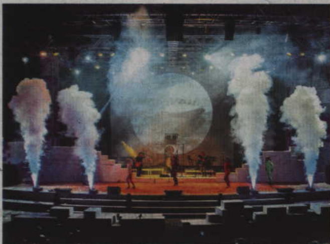
Jak podkreśla KCK koncert w Kwidzynie przygotowywany jest z dużym rozmachem. Pojawi się m.in. słynny floydowski mur, specjalne światła i lasery.

Jak podkreśla KCK koncert w Kwidzynie przygotowywany jest z dużym rozmachem. Pojawi się m.in. słynny floydowski mur, specjalne światła i lasery. Na koncercie nie zabraknie także oryginalnych floydowskich wizualizacji i filmów, tak charakterystycznych dla koncertów tego zespołu. W części wizualizacji wykorzystane zosta-