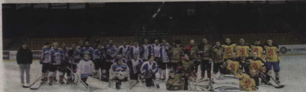
Wspólne zdjęcie czyli miła pamiątka na zakończenie mini turnieju oraz tegorocznych rozgrywek ligowych.