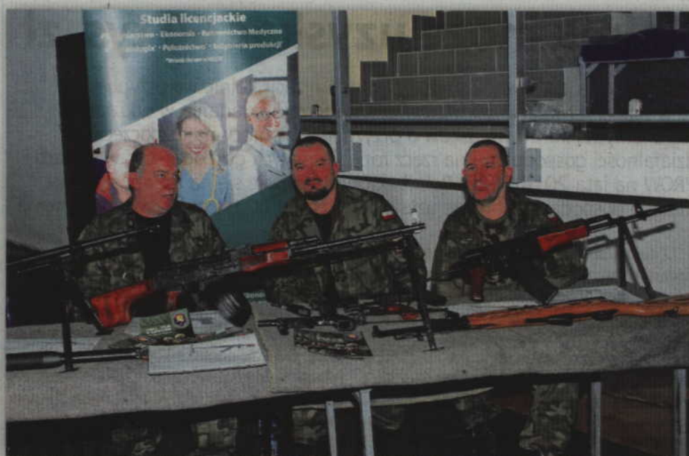
Do rozpoczęcia kształcenia zachęcało Liceum Ogólnokształcące Mundurowe Spartakus w Kwidzynie