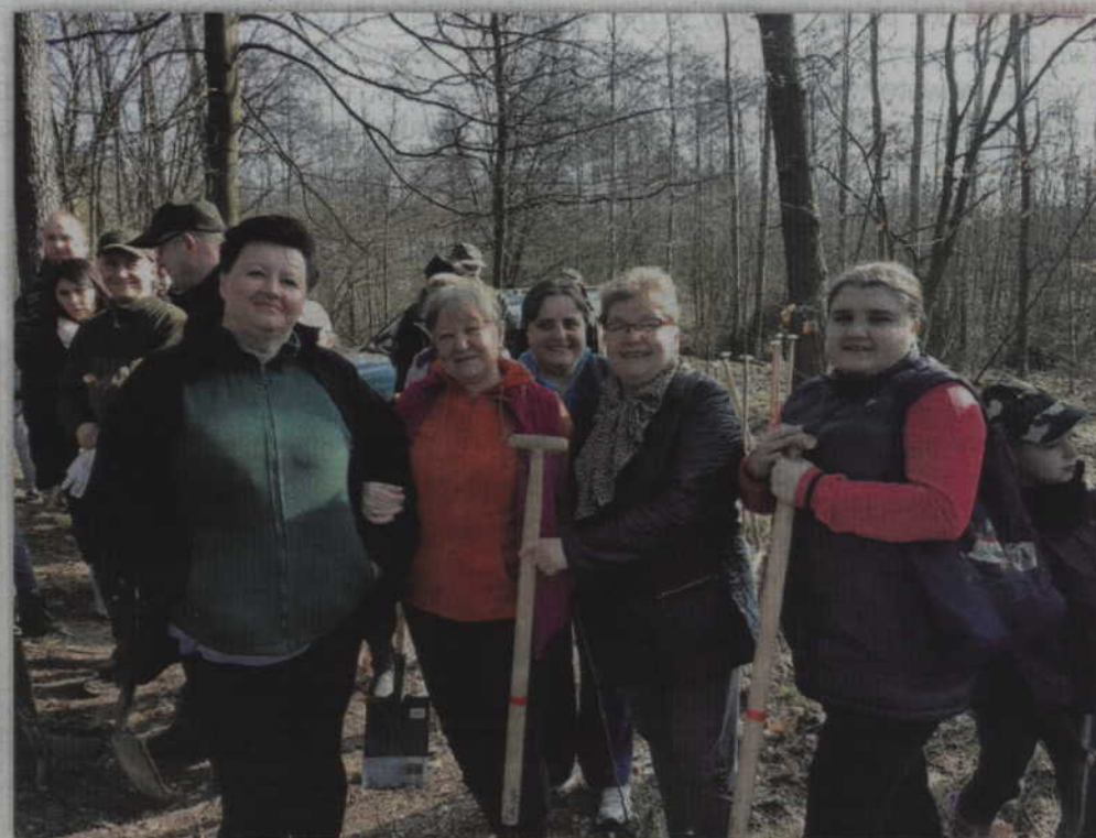
Humory dopisywały wszystkim uczestnikom akcji.