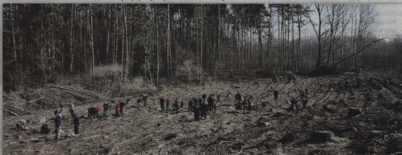
Ponad hektar lasu powstał na terenie Leśnictwa Dziwno.