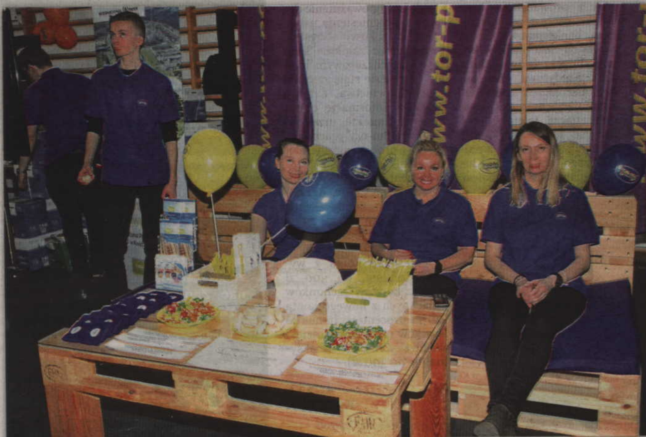
Na targach nie zabrakło również pracodawców. Na zdjęciu stoisko firmy Tor-Pal.

- Mieliśmy grupę nauczycieli, która uzupełniała etaty w innych placówkach. W tej chwili wszyscy będą mieli pełne zatrudnienie. Część nauczycieli będzie mogła korzystać z godzin ponadwymiarowych, ale w ograniczonym zakresie. Pani minister przygotowała bowiem zapis w ustawie „Prawo oświatowe”, który mówi, że w szkołach ponadgimnazjalnych, w nadchodzącym roku szkolnym 2019/2020, nauczyciele przedmiotów ogólnokształcących w szkołach ponadgimnazjalnych