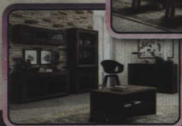
Szafy - komody