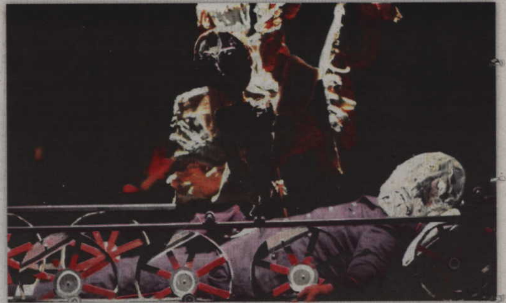
Spektakl „Dziadek” będzie można obejrzeć zarówno w Gardei (28 marca), jak i Kwidzynie (29 marca).