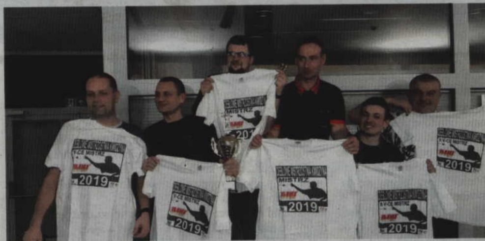
(fox) Deblowym Mistrzem Kwidzyna w darta została malborska drużyna MLD, która wyprzedziła malborsko-kwidzyńskich „Krzyżaków” i elbląską ekipę „Newstory Mistrz”.