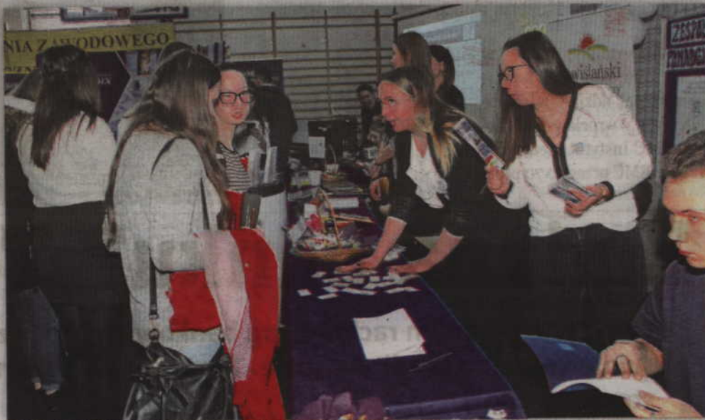
Targi Edukacyjne i Targi Pracy odbyły się w hali sportowej Zespołu Szkół Ponadgimnazjalnych nr 2 w Kwidzynie.

KWIDZYN. W hali sportowej Zespołu Szkół Ponadgimnazjalnych nr 2 w Kwidzynie odbyły się Targi Edukacyjne i Targi Pracy. To znak, że absolwenci gimnazjów i klas ósmych muszą zacząć zastanawiać się nad wyborem kierunku dalszego kształcenia. Targi adresowane były przede wszystkim do tegorocznych absolwentów, ale także do rodziców, nauczycieli i pracodawców. Podczas spotkania można było zapoznać się nie tylko z ofertą szkół, ale także firm, których przedstawiciele odpowiadali na pytania młodzieży i podpowiadali wybór kierunku.