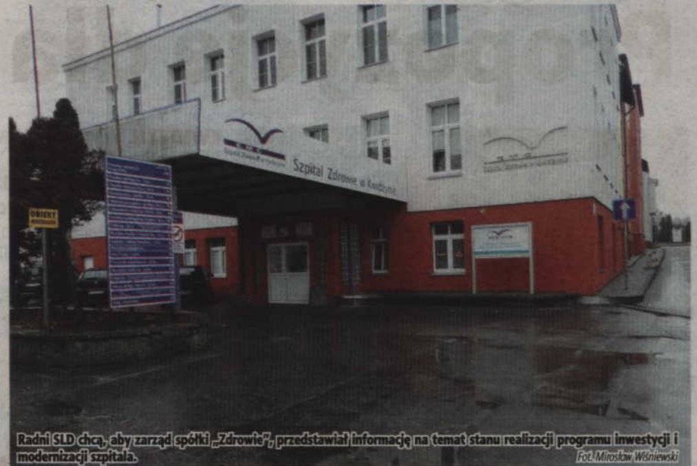
Radni SLD chcą, aby zarząd spółki „Zdrowie” przedstawiał informację na temat stanu realizacji programu inwestycji i modernizacji szpitala.