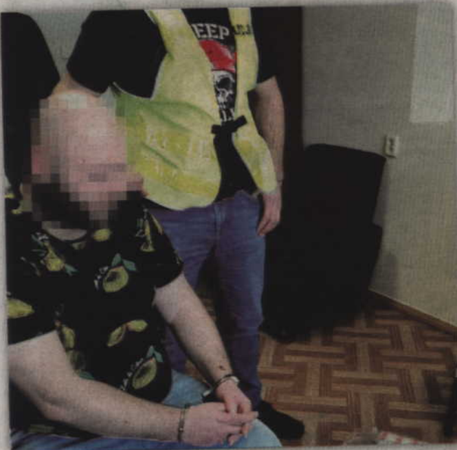
Mężczyźni zabrali z mieszkania 65-latki kilkanaście paczek papierosów, które nie posiadały polskich znaków akcyzy.

podając się za funkcjonariusza publicznego albo wyzyskując błędne przeświadczenie o tym innej osoby, wykonuje czynność związaną z jego funkcją, podlega grzywnie, karze ograniczenia wolności albo pozbawienia wolności do roku - dodaje A. Filar z KPP Kwidzyn. (fox)