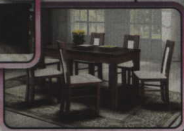
Stoły i krzesła