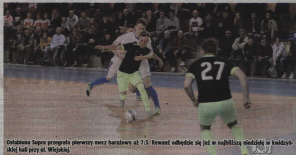
Ostabiona Supra przegrała pierwszy mecz barażowy aż 7:3. Rewanż odbędzie się już w najbliższą niedzielę w kwidzińskiej hali przy ul. Wiejskiej.