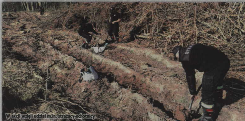
W akcji wzięli udział m.in. strażacy-ochotnicy.

W sadzeniu lasu brali również udział członkowie kół łowieckich "Daniel" i "Dzik", a także członkinie Koła Gospodyń Wiejskich z Sadlinek. W tegorocznej akcji uczestniczyło łącznie około 100 osób. Wspólnie posadzono ponad 5000 sztuk dębu, a także wiąz, lipę, świerki i jawory. Leśnicy, dzięki tej inicjatywie powiększyli nasze lasy o ponad hektar. (RB)