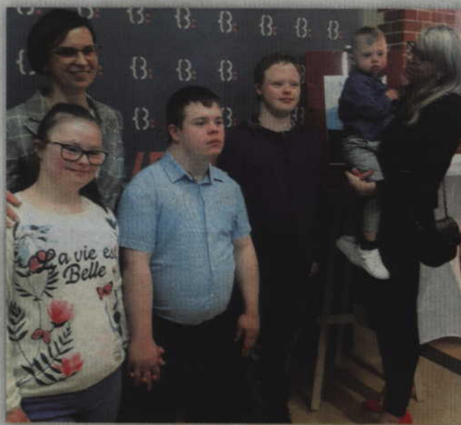
Bohaterowie dnia, których portrety znalazły się na wystawie.

jako symbol przynosili ze sobą wszyscy uczestnicy „Zakinady”, nie pasują do siebie na pierwszy rzut oka. Gdy jednak człowiek wyjdzie poza schemat tradycyjnego funkcjonowania, to może się okazać, że skarpetki nie do pary potrafią być śmieszne, urocze i nietuzinkowe. Gdy się tak chwilę zastanowić, to można dojść do wniosku, że tak naprawdę każdy, jeśli ma ochotę, to może na co dzień normalnie funkcjonować i dobrze czuć się w skarpetkach nie do pary.