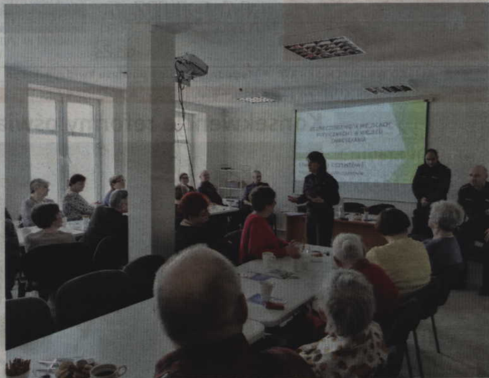
Podczas spotkania funkcjonariuszy z prabuckimi seniorami rozmawiano o różnych aspektach bezpieczeństwa osób starszych.

Uczestnikom spotkania przedstawiono różnorodność oszustw i innych przestępstw jakie dokonywane są na osobach starszych. Zebrani żywo dyskutowali i wymieniali się doświadczeniami na temat reagowania i zapobiegania tego rodzaju przestępstwom. Podczas debaty omówiono także zagadnienia bezpieczeństwa w ruchu drogowym dotyczące noszenia odblasków po zmierzchu w ramach akcji „Świeć Przykładem” oraz akcji „Patrz i słuchaj” - Policjanci wskazali jak istotne jest utrzymanie bliskiego kontaktu dzielnicowego ze społeczeństwem. Omówiono funkcjonowanie i sposób użytkowania narzędzi po-