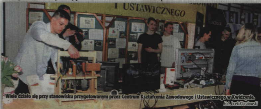
Wiele działo się przy stanowisku przygotowanym przez Centrum Kształcenia Zawodowego i Ustawicznego w Kwidzynie.