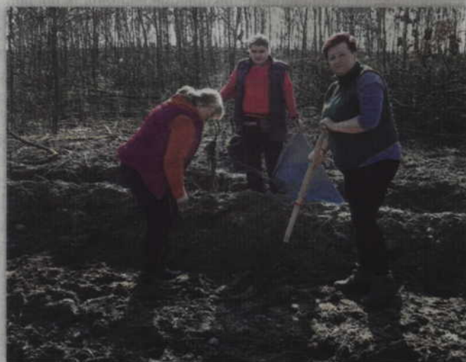
Ciężkiej pracy nie unikały także panie.