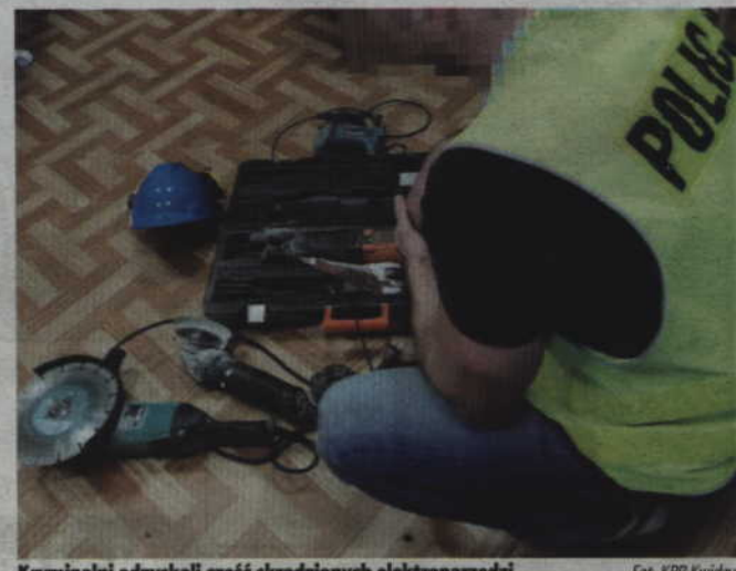
Kryminalni odzyskali część skradzionych elektronarzędzi.

Mundurowi zatrzymali dwóch mężczyzn, w wieku 38 i 29-lat. Po przesłuchaniu obaj mężczyźni usłyszeli zarzut kradzieży, złożyli wyjaśnienia i przyznali się do winy. Za popełnione przestępstwo grozi im teraz nawet do 5 lat pozbawienia wolności. (fox)