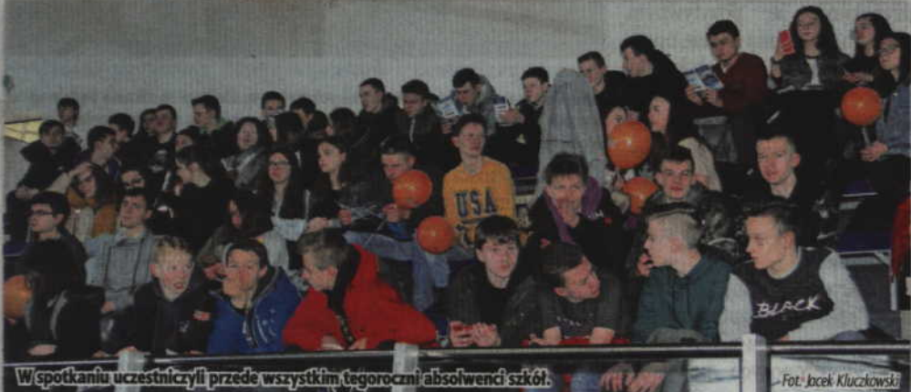
W spotkaniu uczestniczyli przede wszystkim tegoroczni absolwenci szkół.