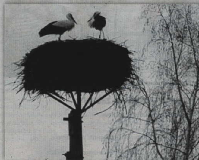
Sfotografowana bociania para zajęła gniazdo w Cyganach (gm. Gardeja).