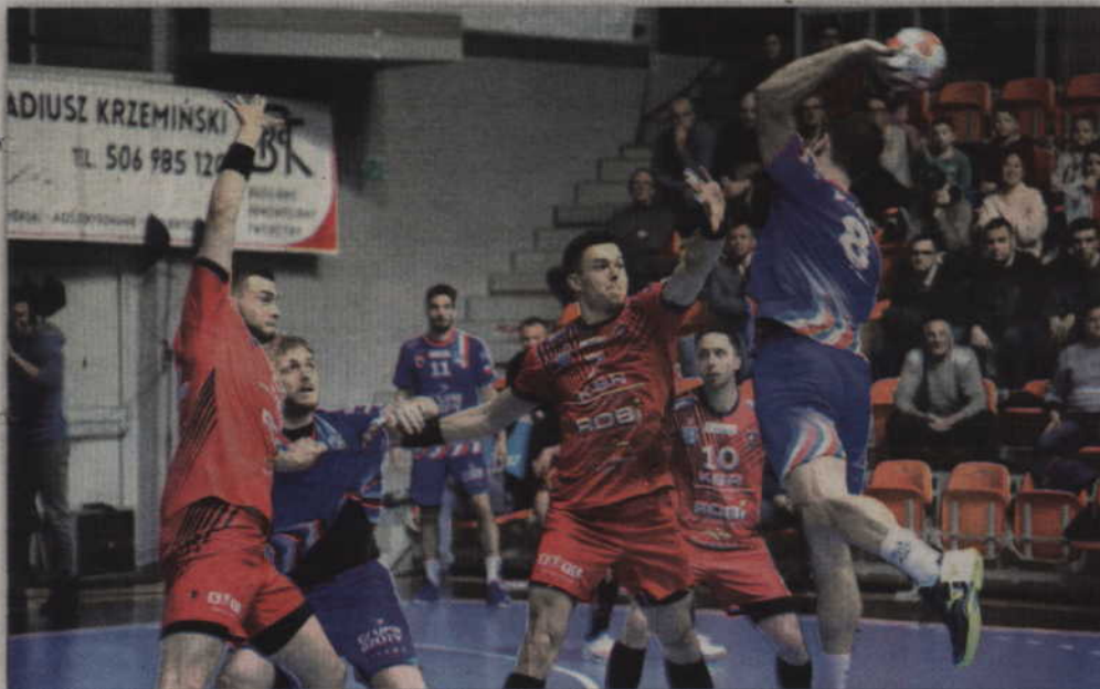
Kwidzyńscy obrońcy mieli wiele pracy w starciu z silną ekipą Azotów.