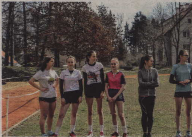
Pogoda dopisała zarówno organizatorom, jak i zawodnikom.