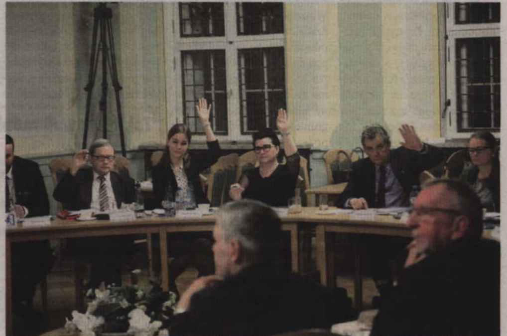
Radni PKO i SLD poparli propozycję zmiany metody naliczania opłat i przegłosowali opozycję jednym głosem.