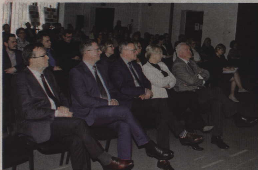
Konferencja „Doradztwo zawodowe w powiecie kwidzyńskim - o dobrych praktykach” odbyła się w Kwidzyńskim Parku Przemysłowo-Technologicznym w Górkach.

POWIAT. „Doradztwo zawodowe w powiecie kwidzyńskim - o dobrych praktykach” – to temat konferencji, która odbyła się w Kwidzyńskim Parku Przemysłowo-Technologicznym w Górkach. Jej celem była promocja działań dotyczących rozwoju sieci doradców edukacyjno-zawodowych, a także sieci instytucji współpracujących z Poradnią Psychologiczno-Pedagogiczną w Kwidzynie. Spotkanie zorganizowane zostało w ramach projektu „Podniesienie jakości szkolnictwa zawodowego w powiecie kwidzyńskim – większa zatrudnialność uczniów”.