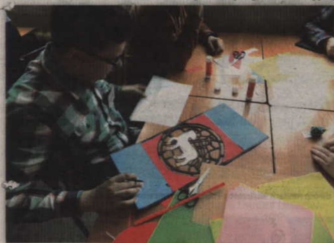
Papierowe witraże ozdobią szkolną salę religii w ZSO nr 2.

temu Pawłowi Apostołowi. Początkowo brały w nich udział uczennice II Liceum Ogólnokształcącego i uczniowie Centrum Kształcenia Zawodowego i Ustawicznego. Od drugiej edycji dołączyły do zajęć wychowanki Młodzieżowego Ośrodka Wychowawczego, a od trzeciej także uczennice Sportowego Liceum Ogólnokształcącego.