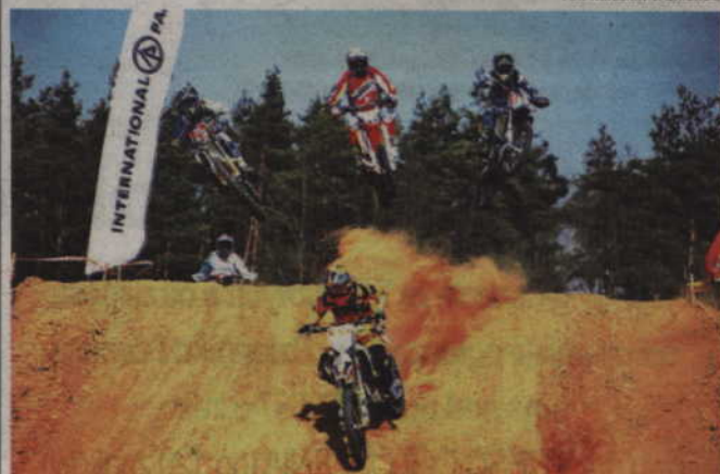
Tor w Bądkach okazał się sporym wyzwaniem dla niektórych startujących.