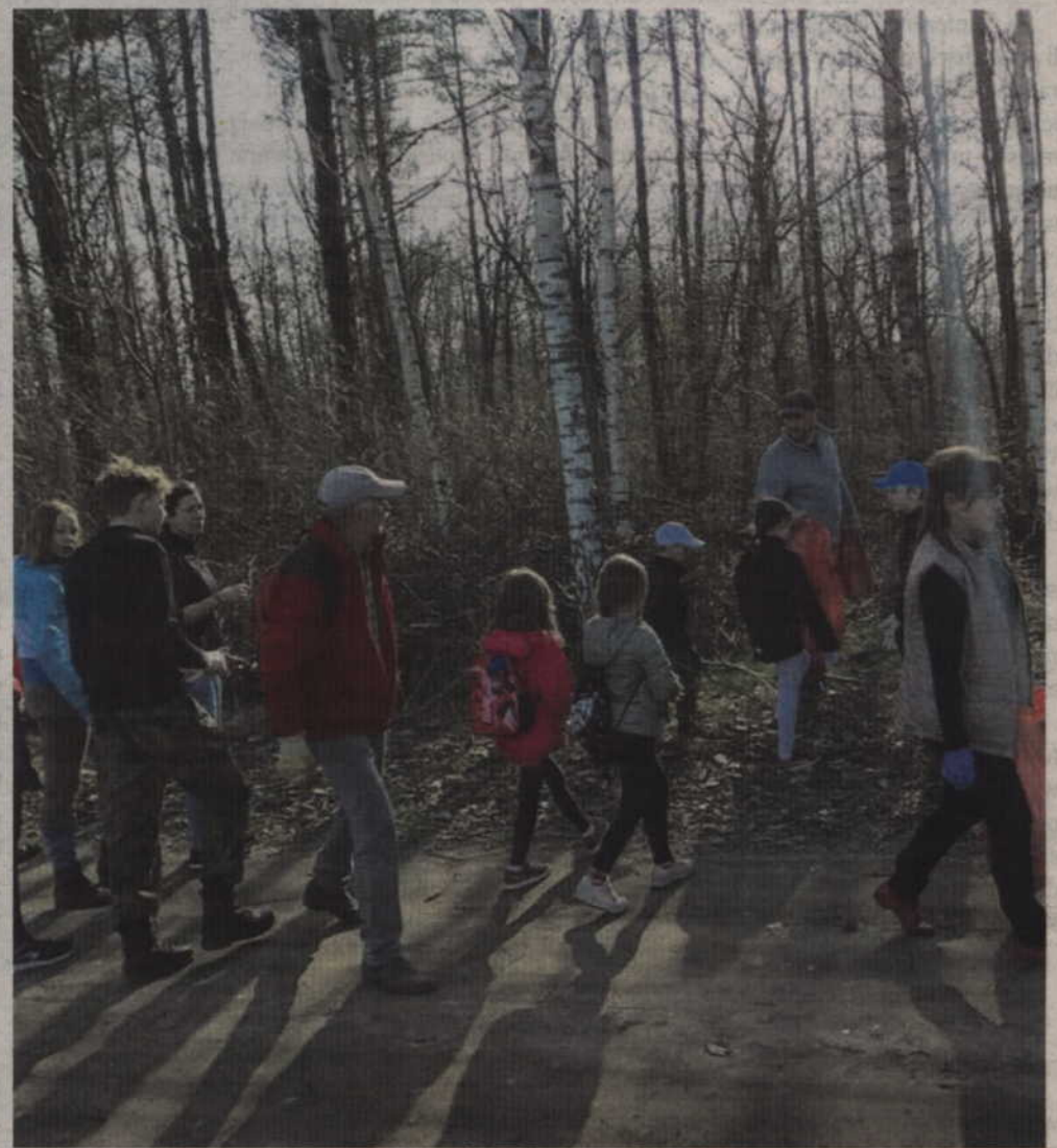
W gronie uczestników akcji sprzątania lasu nie zabrakło dzieci i młodzieży.