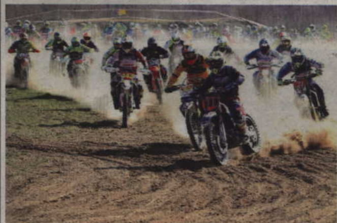
W dwóch rundach Mistrzostw Polski rywalizowało 69 zawodników.