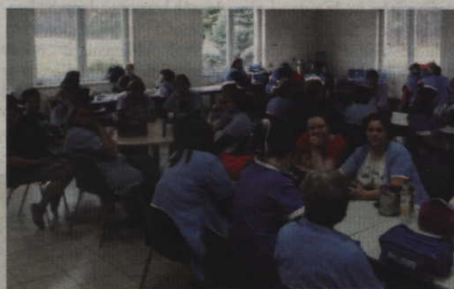
Strajk w Plati Polska polegał na rotacyjnym przebywaniu pracowników na terenie zakładowej stołówki.

od 200 do 300 złotych. Cieszy nas, że doszliśmy do porozumienia – poinformował Andrzej Zmysłowski, prze-