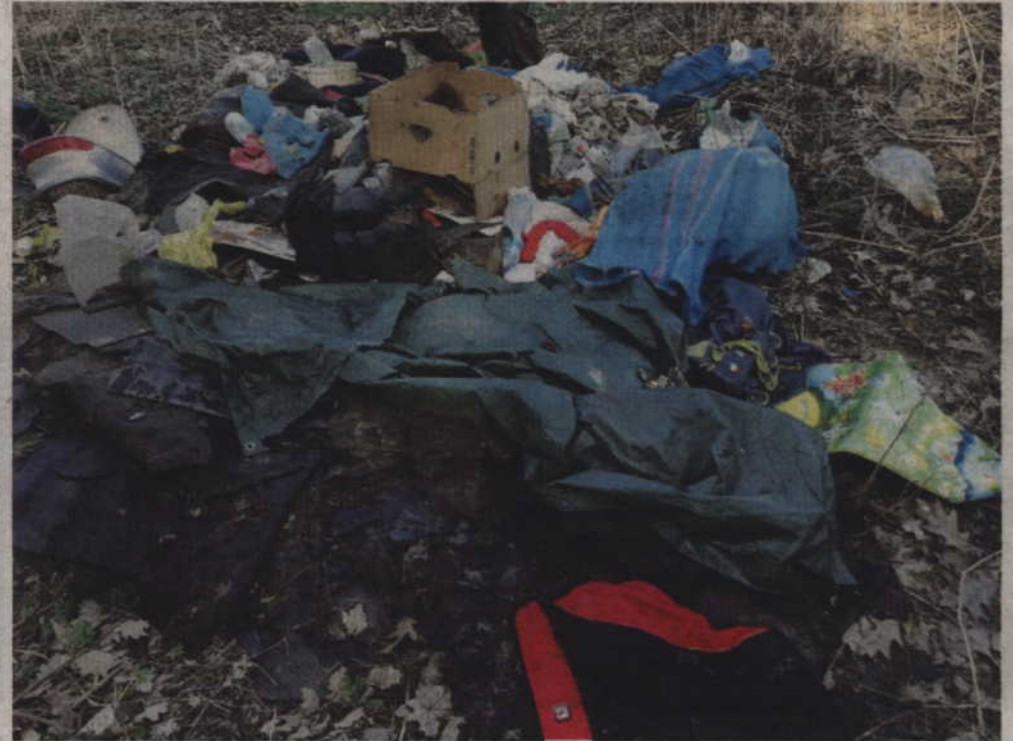
Z roku na rok śmieci jest co raz mniej, ale i tak ludzie wyrzucają praktycznie wszystko.