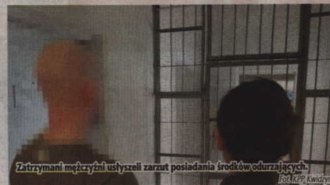
Zatrzymani mężczyźni usłyszeli zarzut posiadania środków odurzających.