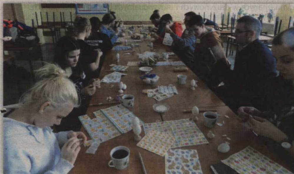
Wspólna praca zżyła uczestników zajęć.

Cały cykl składał się z trzech kolejnych edycji, zorganizowanych w listopadzie 2018 oraz w styczniu i marcu 2019.