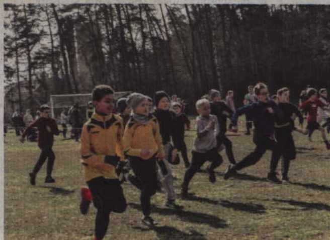
Już na początku biegu trzeba dać z siebie wszystko.