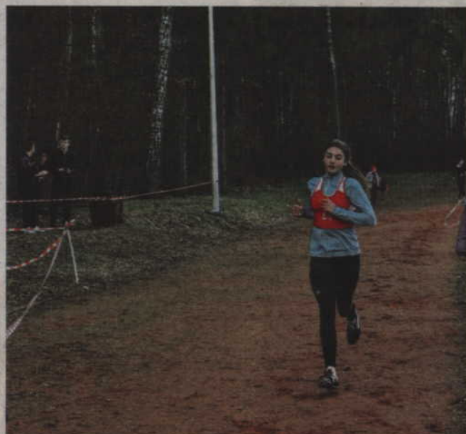
Jeszcze parę metrów i będzie meta.