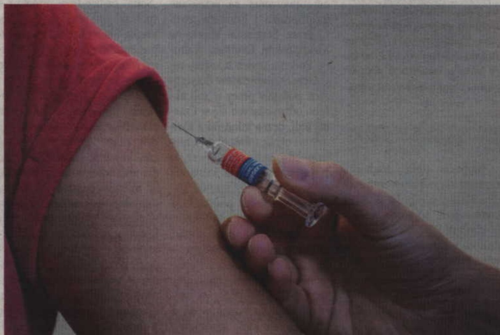
Od chwili jego wdrożenia w listopadzie 2017 ze szczepień skorzystało ogółem 220 dziewczynek z rocznika 2005 i 227 dziewczynek z rocznika 2006.

cję pochodzą z budżetu powiatu i budżetów gmin, które partycypują w 50 proc. kosztów szczepień i edukacji dziewczynek ze swojego terenu. Pozostałą część kosztów programu pokrywa powiat. Realizator programu wyłaniany jest w drodze konkursu ofert. Od chwili jego wdrożenia w listopadzie 2017 roku szczepieniami zostały objęte dziewczęta z roczników 2005 i 2006. Ze szczepień skorzystało ogółem 220 dziewczynek z rocznika 2005 i 227 dziewczynek z rocznika 2006. Wszystkie dziewczynki, spełniające kryteria udziału w programie, których rodzice wyrazili zgodę, zostały zaszczepione szczepionką 4-walentną według schematu trzydawkowego – dodaje Danuta Woronowicz.