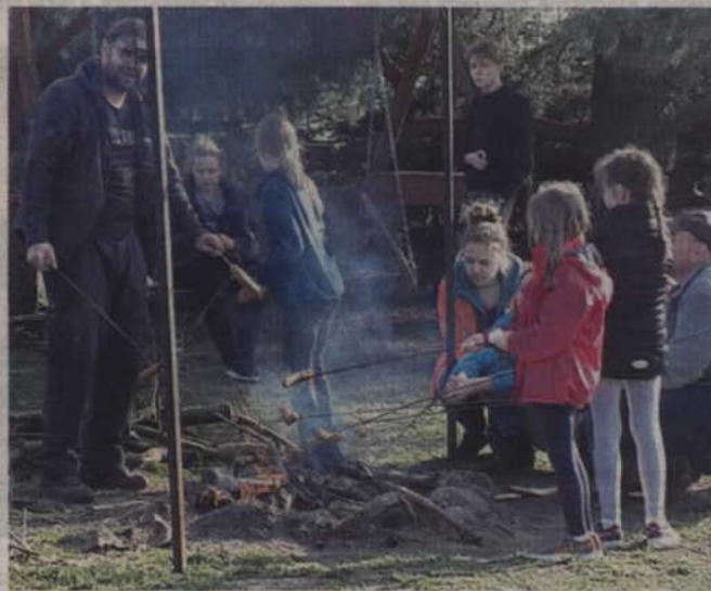
Na zakończenie akcji zorganizowano ognisko.