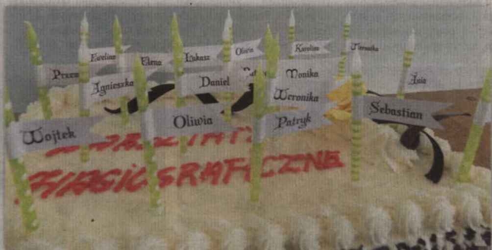
Efektownie ozdobiony tort zakończył ostatnie zajęcia hagiograficzne.