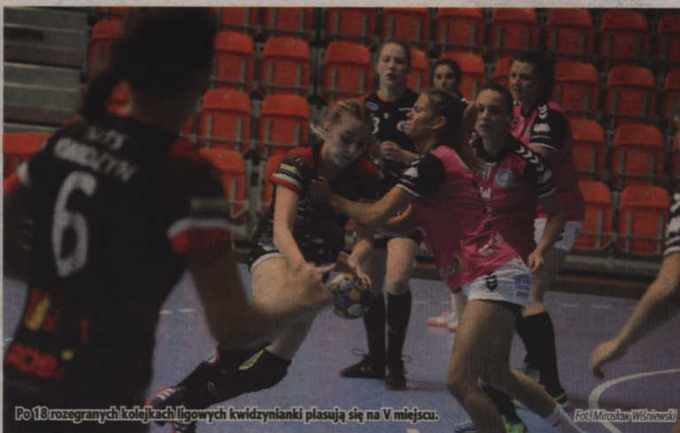
Po 18 rozegranych kolejnych ligowych kwidzynieki plasują się na V miejscu.

Jak się okazało po przerwie kwidzynieki nie oddały już