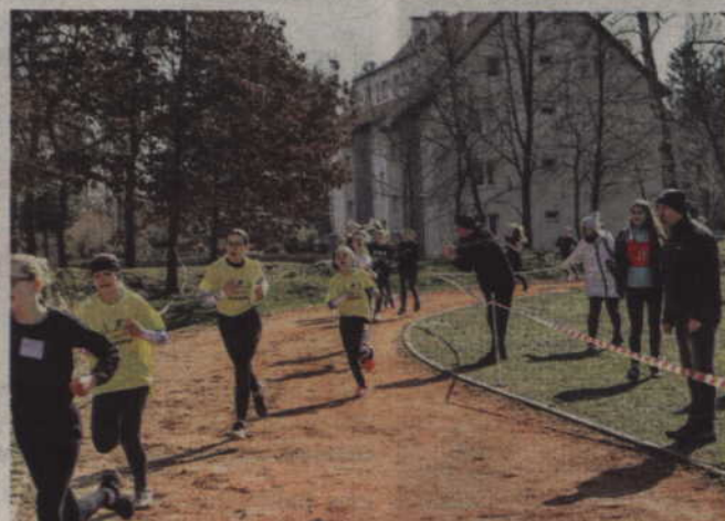
Trenerzy dopingowali swoich zawodników.