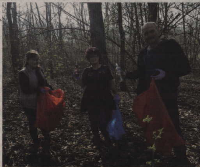
Butelki to niestety stałe znalezisko w zaśmieconych lasach.