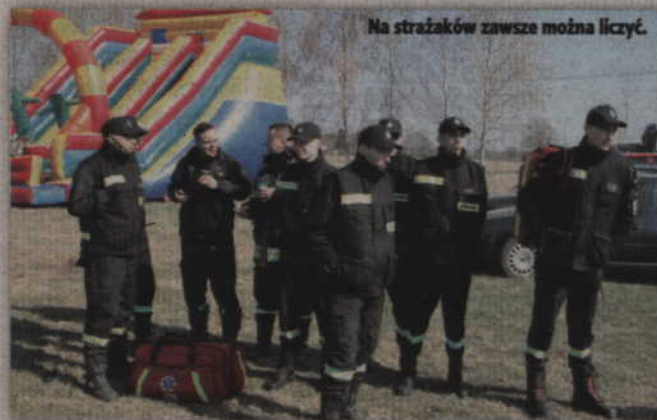
Na strażaków zawsze można liczyć.