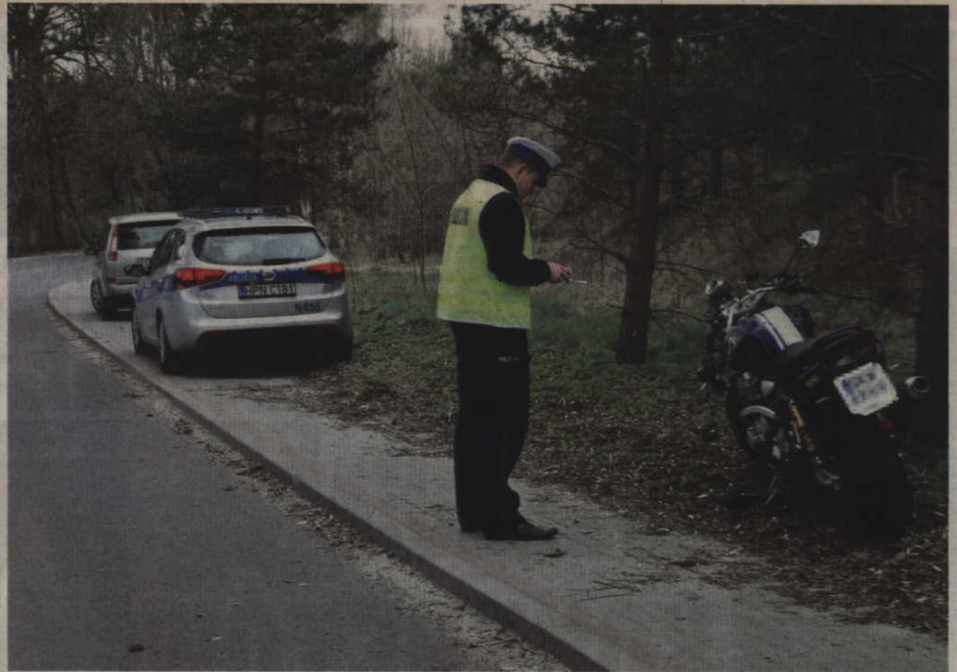
Motocyklista wjechał na chodnik przy łuku drogi w Baldramie Małym.

GMINA KWIDZYN. Kierujący motocyklem yamaha, na łuku drogi w Baldramie Małym, wjechał na chodnik i potrafił idącą nim 17-latkę. Oboje trafili do szpitala. Funkcjonariusze drogówki zatrzymali mężczyźnię prawo jazdy, za swój czyn odpowie także przed sądem.