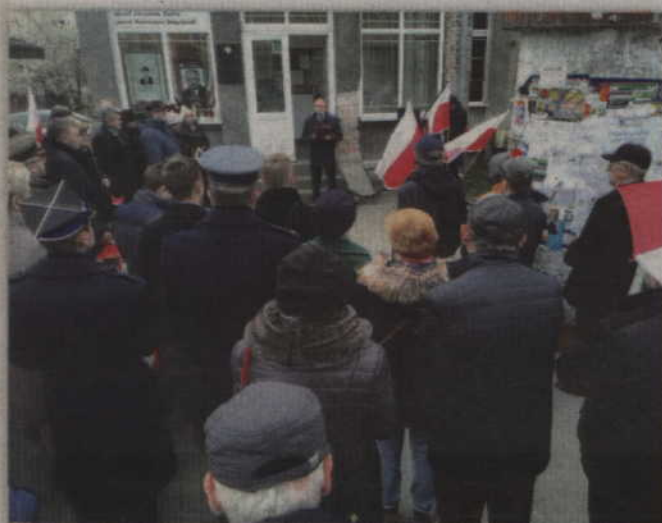
Mieszkańcy tradycyjnie spotkali się przed budynkiem kwidzyńskiej „Solidarności”.