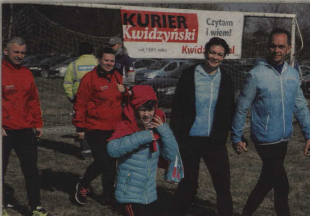
Biegowi w Gardei patronował „Kurier Kwidzyński”.

W minioną sobotę, już od wczesnych godzin porannych plac rekreacyjny w Gardei III tętnił życiem. Trwały bowiem przygotowania do biegu „Aktywny Turysta”, którego organizatorem było stowarzyszenie „Gmina Gardeja Biega”. Zanim jednak pierwsi biegacze odebrali pakiety startowe, członkowie stowarzyszenia jak w przy-