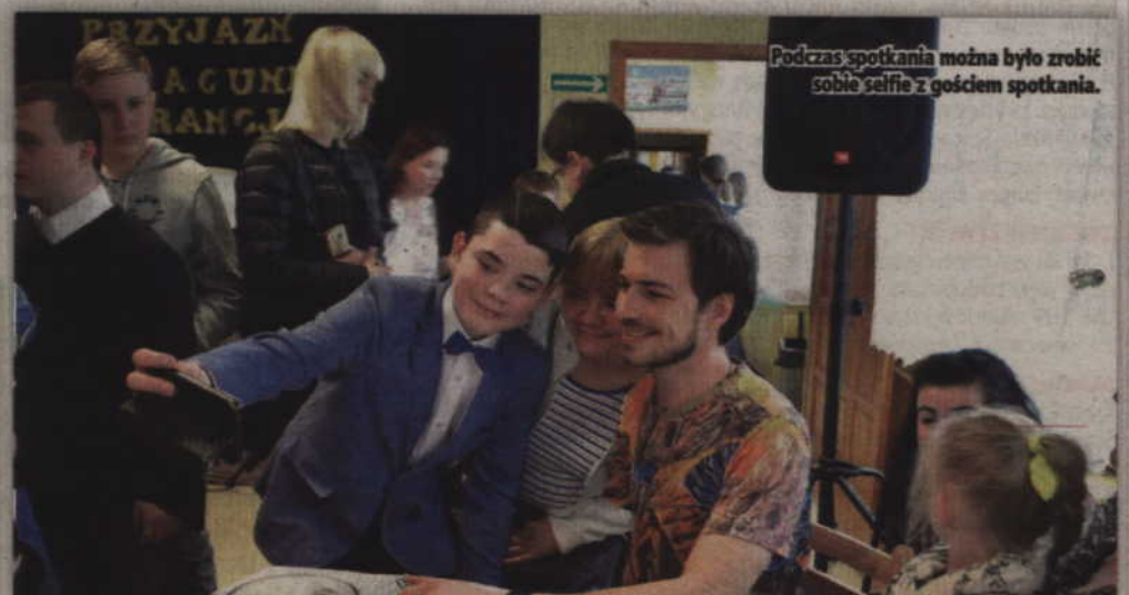
Podczas spotkania można było zrobić sobie selfie z gościem spotkania.