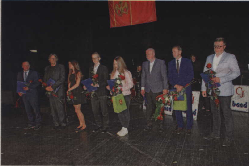
Nagrodzeni trenerzy i zawodnicy.