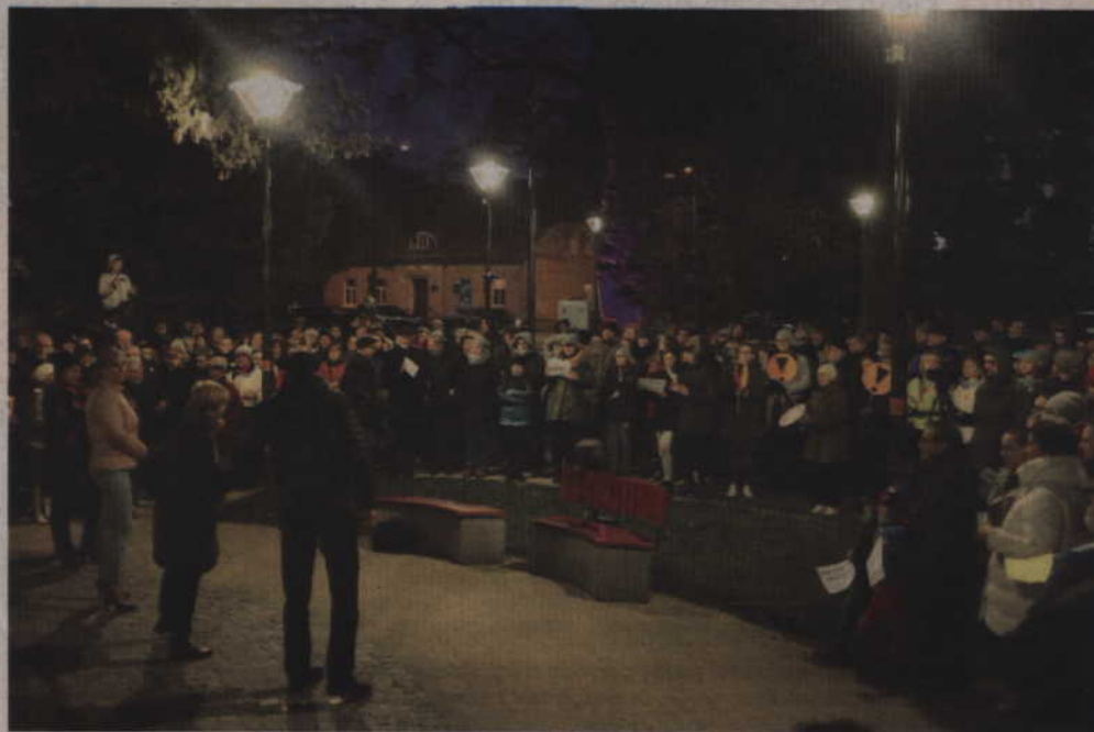
Wiec poparcia dla protestujących nauczycieli odbył się na kwidzyńskim Placu Plebiscytowym.

-Chciałem powiedzieć wiele, bo jest we mnie dużo złości, ale chciałem wystosować apel do pana Premiera. Polacy składają się na pensje pana Premiera nie po to, żeby odkładał rozmowę z