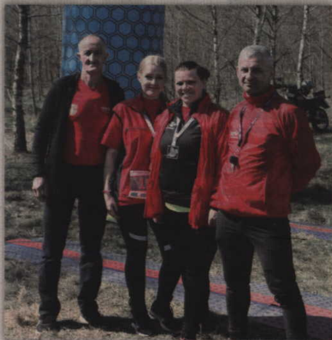
Biegacze ze stowarzyszenie Traktor Team Gmina Kwidzyn nie mogło zabraknąć w Gardel.