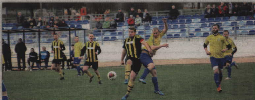
Jak przystało na spotkanie derbowe na boisku nie brakowało walki.