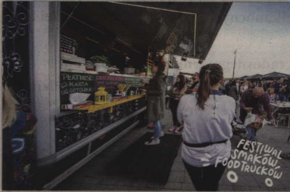
Festiwal Smaków Food Trucków odbędzie się w Kwidzynie po raz pierwszy.

KWIDZYN. W ostatni weekend kwietnia (27-28) w Kwidzynie odbędzie się I Festiwal Smaków Food Trucków. Miłośnicy street foodu będą mogli spotkać się na targowisku przy ul. Kopernika. Wstęp wolny.