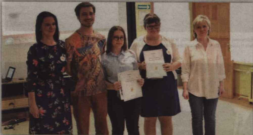
Spotkanie odbyło się w ramach projektu „Wolontariat - jesteśmy na tak! Działamy, by rozwijać talenty, zainteresowania, pasje młodych, uwrażliwiać na potrzeby innych ludzi oraz wzbogacać funkcje szkoły”.