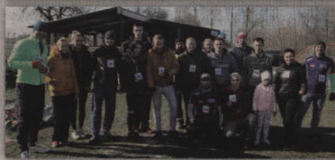
Stowarzyszenie Gmina Gardeja Biega zorganizowało swój pierwszy bieg.