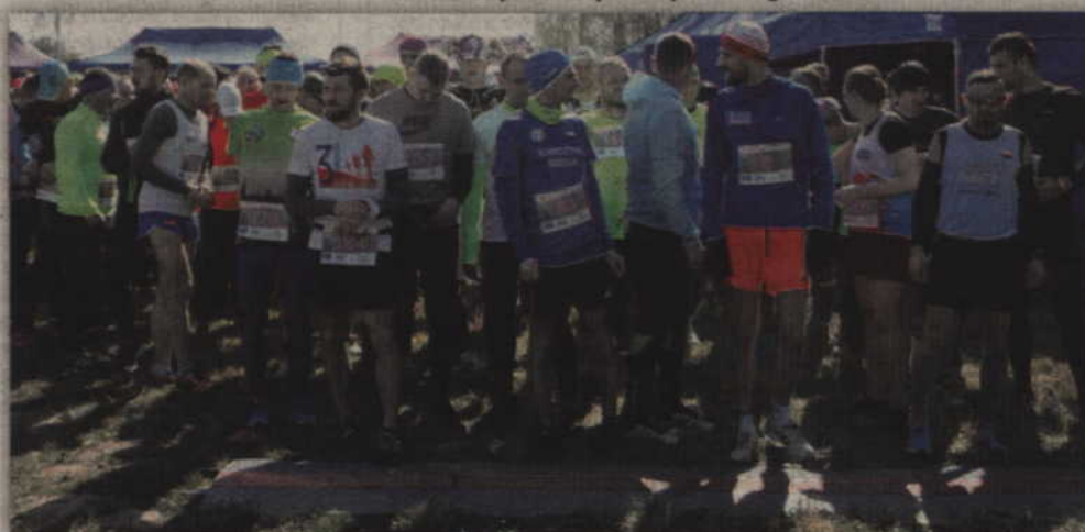
Na linii startu pierwszego biegu organizowanego przez GGB stanęło około 200 zawodników.