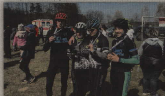
Członkowie Cyklo Kwidzyn zabezpieczali bieg.

sprawdzeniu przez biegaczy. Jak sięgam pamięcią, pomysł na zorganizowanie biegu właśnie w Gardei pojawił się w sierpniu