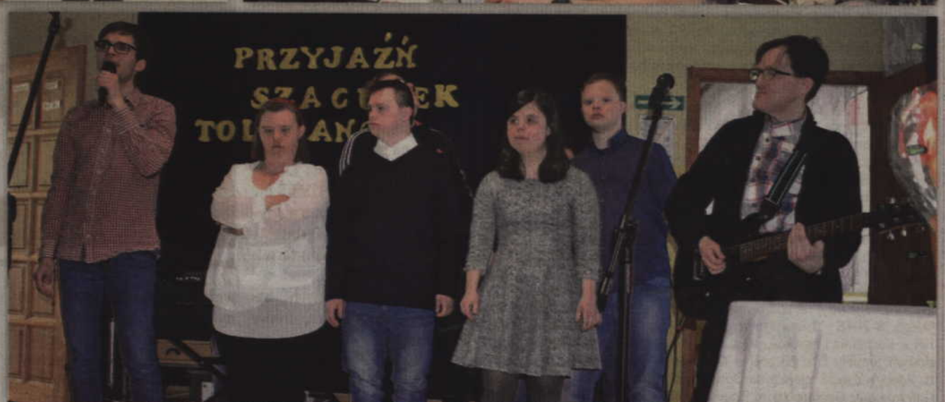
Program artystyczny przygotowali wspólnie wolontariusze ze Szkoły Podstawowej w Tychnowach oraz zespół Warsztatów Terapii Zajęciowej w Kwidzynie (na zdjęciu).