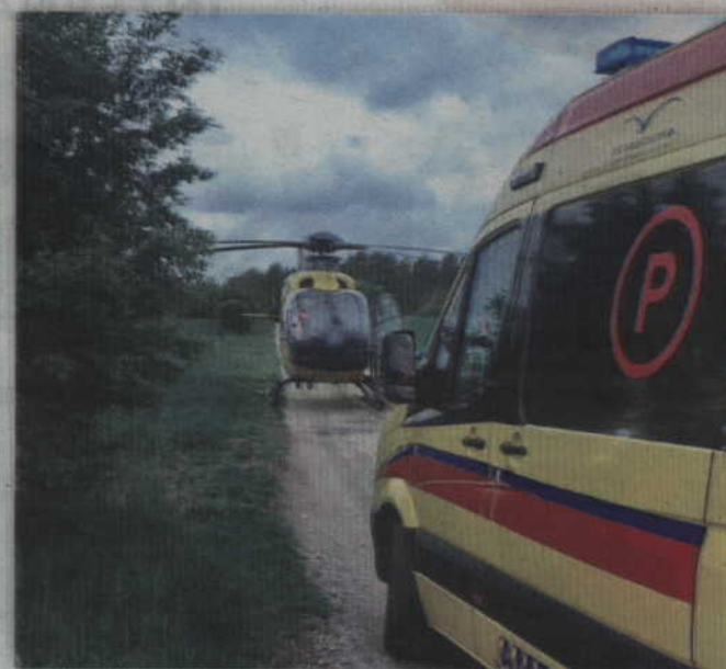
Poszkodowaną kobietę helikopterem przetransportowano do szpitala w Grudziądzu.