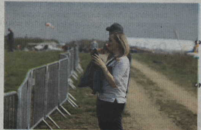
Aparat fotograficzny to nieodłączny gadżet na każdej lotniczej imprezie.

Warto również dodać, że nie byłoby tej imprezy gdyby pomoc najróżniejszych instytucji i oczywiście strażaków m.in. z OSP w Kołodziejach. Za pomoc w organizacji miejsca stacjonowania samolotów organizatorzy bardzo dziękują wszystkim, którzy chociaż w niewielkim stopniu wsparli tę imprezę. Dzięki nim było nie tylko bezpiecznie, ale przede wszystkim piknikowo.