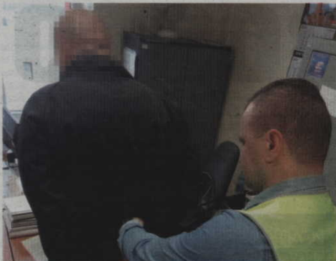
Policja zatrzymała 44-latkę podejrzanego o zniszczenie krzyża w kwidzyńskiej katedrze. Mężczyzna nie przyznaje się jednak do zarzucanego mu czynu.