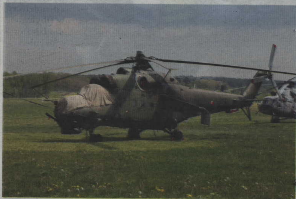
Śmigłowiec bojowy Mi-24 był prawdziwą gratką dla miłośników lotnictwa.