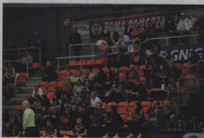
Juniorzy młodzi MTS I Kwidzyn przez trzy dni byli wspierani przez wiernych kibiców.