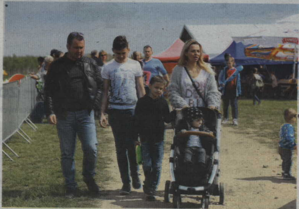
Na lotnisko polowe do Starego Kamienia przyjeżdżały całe rodziny.

Warto również dodać, że nie byłoby tej imprezy gdyby pomoc najróżniejszych instytucji i oczywiście strażaków m.in. z OSP w Kołodziejach. Za pomoc w organizacji miejsca stacjonowania samolotów organizatorzy bardzo dziękują wszystkim, którzy chociaż w niewielkim stopniu wsparli tę imprezę. Dzięki nim było nie tylko bezpiecznie, ale przede wszystkim piknikowo.