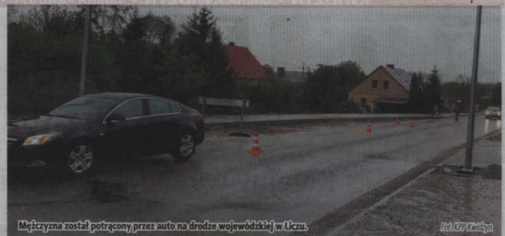
Mężczyzna został potrącony przez auto na drodze wojewódzkiej w Liczu.

-Działania straży pożarnej polegały na zabezpieczeniu miejsca zdarzenia, udzieleniu