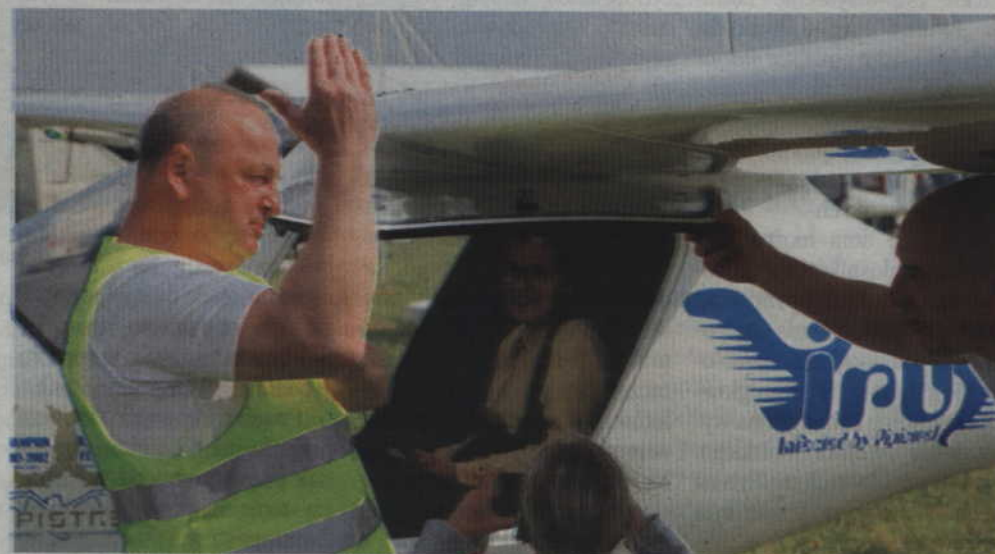
Publiczność zgromadzona na lotnisku polowym w Starym Kamieniu miała również możliwość zobaczenia namiastki tego, co wcześniej oglądano nad Itawą.