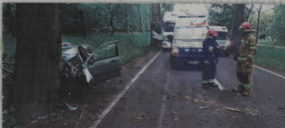
Kierująca fordem na prostym odcinku drogi K-55 zjechała na pobocze i uderzyła w przydrożne drzewo.

- Ze wstępnych ustaleń funkcjonariuszy wynika, że 44-letnia kobieta kierująca fordem, na prostym odcinku drogi, zjechała na prawe pobocze i uderzyła w przydrożne drzewo. Kobieta helikopterem przetransportowano do szpitala w Grudziądzu. Ruch na drodze krajowej był całkowicie zablokowany - wy-