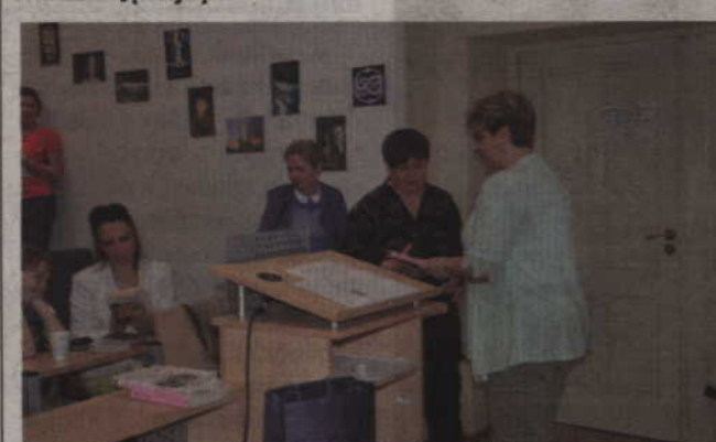
Organizatorzy wręczyli również specjalne podziękowania dla nauczycieli przygotowujących uczniów do konkursu.