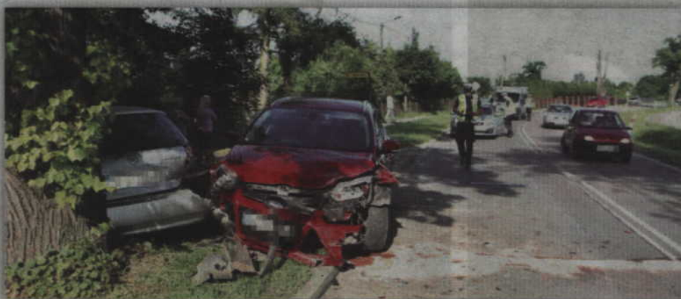
Do kolizji dwóch aut doszło na trasie Kwidzyn - Korzeniewo.

- Jak ustalili policjanci pracujący na miejscu wypadku, kierujący fordem 21-latek, jadąc od strony Kwidzyna wraz z dwojgiem pasażerów, nie zachował należytej ostrożności oraz nie dostosował odpowiedniej prędkości do warunków panujących na drodze. W efekcie najechał na poprzedzającą go toyotę, którą kierowała 24-letnia mieszkanka Kwidzyna. Pasażerka forda, która była w zaawansowanej