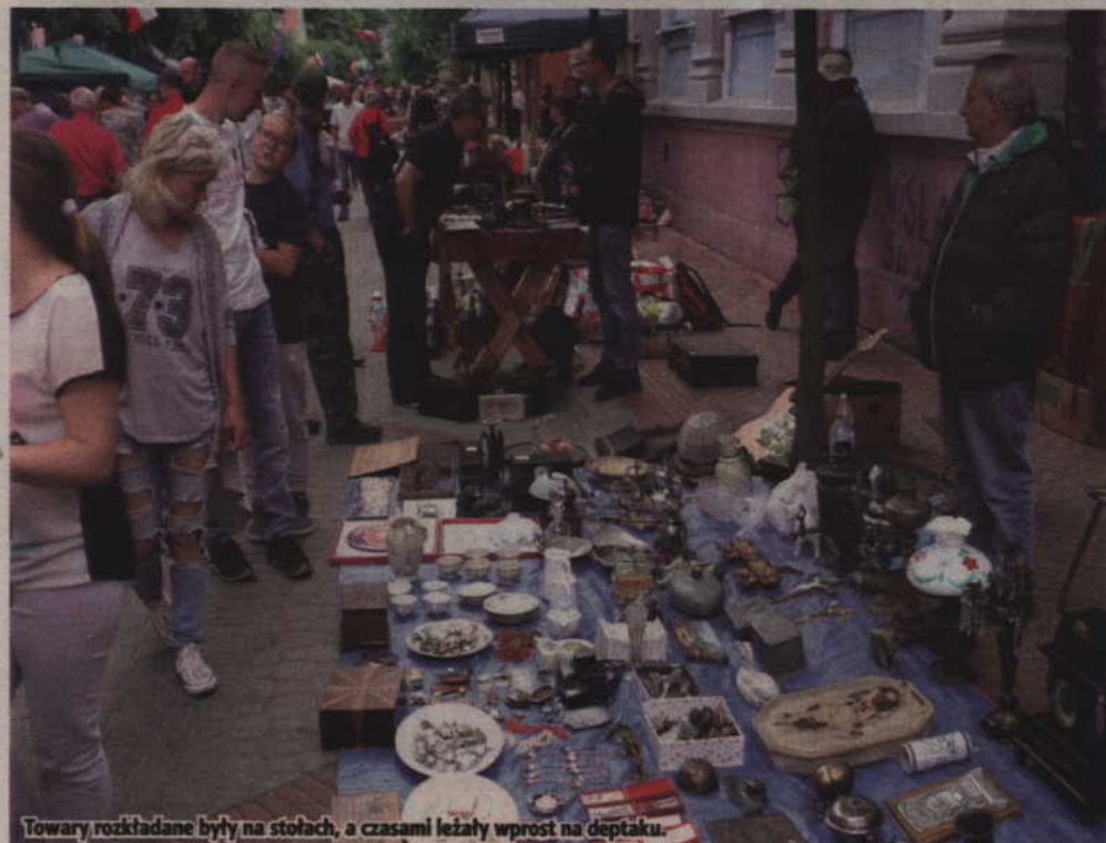
Towary rozkładane były na stołach, a czasami leżały wprost na deptaku.