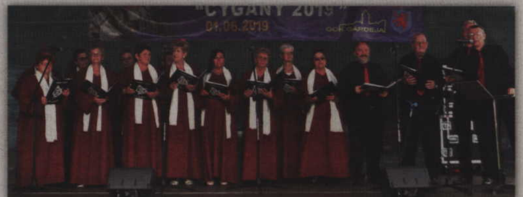
Na scenie prezentuje się Chór "Lira" z Ryjewa.