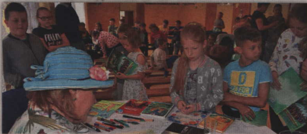
Uczestnicy spotkania mogli zdobyć autografy autorki.