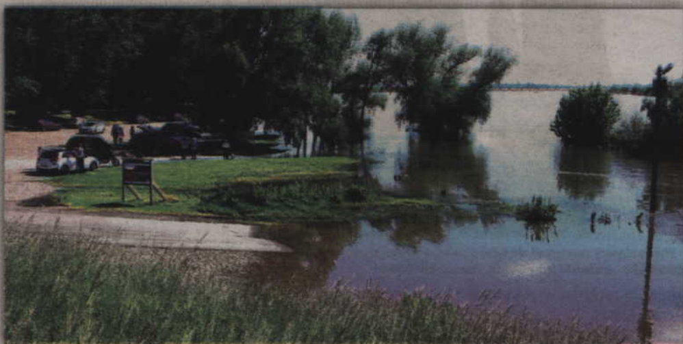
Dawna przystań promowa znalazła się głęboko pod wodą.