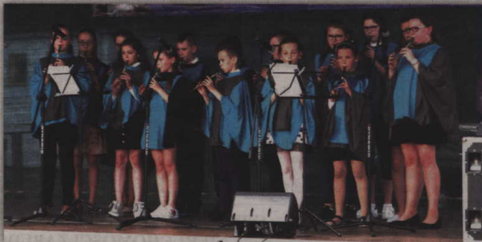
Pierwsze muzyczne takty należały do gospodarzy. Na scenie zespół "Flauto Dolce".

- Nie mieliśmy żadnych niespodzianek w postaci tego, że