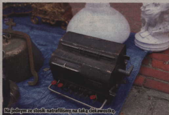
Na jednym ze stoisk natrafilismy na taką ciekawostkę.