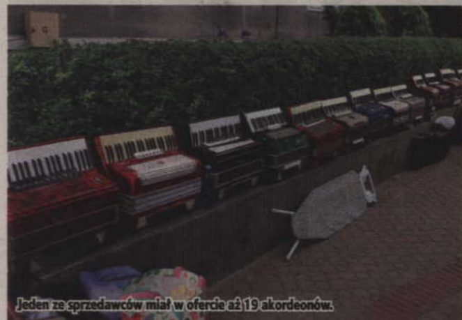
Jeden ze sprzedawców miał w ofercie aż 19 akordeonów.