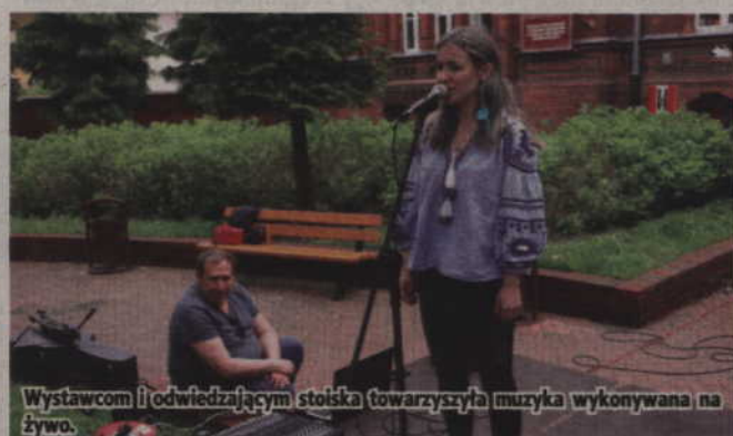
Wystawcom i odwiedzającym stoiska towarzyszyła muzyka wykonywana na żywo.