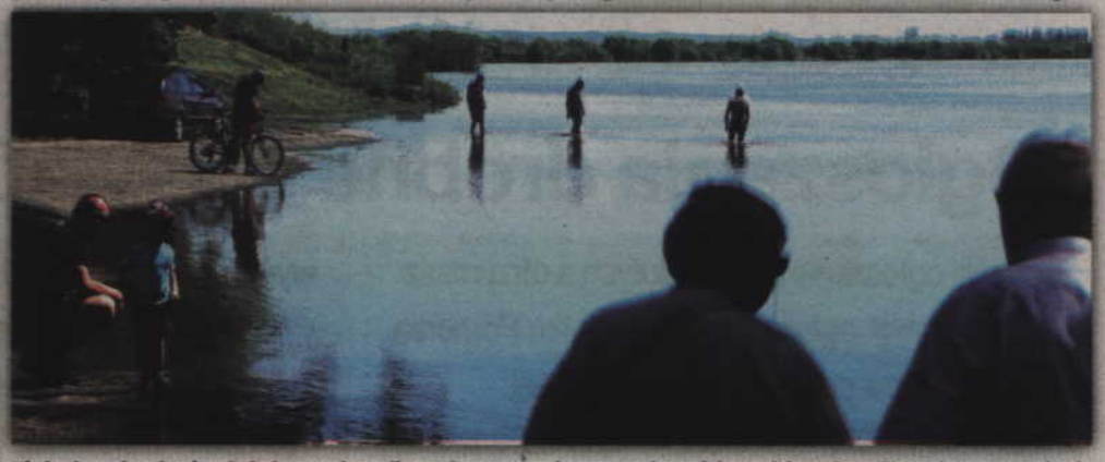
Nie brakowało odważnych, którzy wędrowali po zalanym terenie przystani, w miejscu gdzie podczas festynów w Korzeniewie zazwyczaj parkowane są samochody.