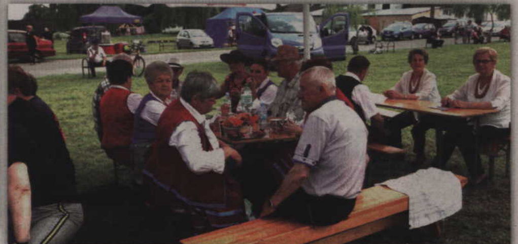
Z pobliskich Kisielic przyjechała kapela "Pomerania".