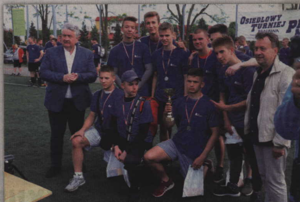
Drugie miejsce zajęli gracze FC Podkowa.