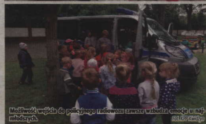
Możliwość wejścia do policyjnego radiowozu zawsze wzbudza emocje u najmłodszych.

bać i do której zawsze i w każdej sytuacji można zwrócić się o pomoc – dodaje Oficer Prasowy KPP Kwidzyn. (fox)