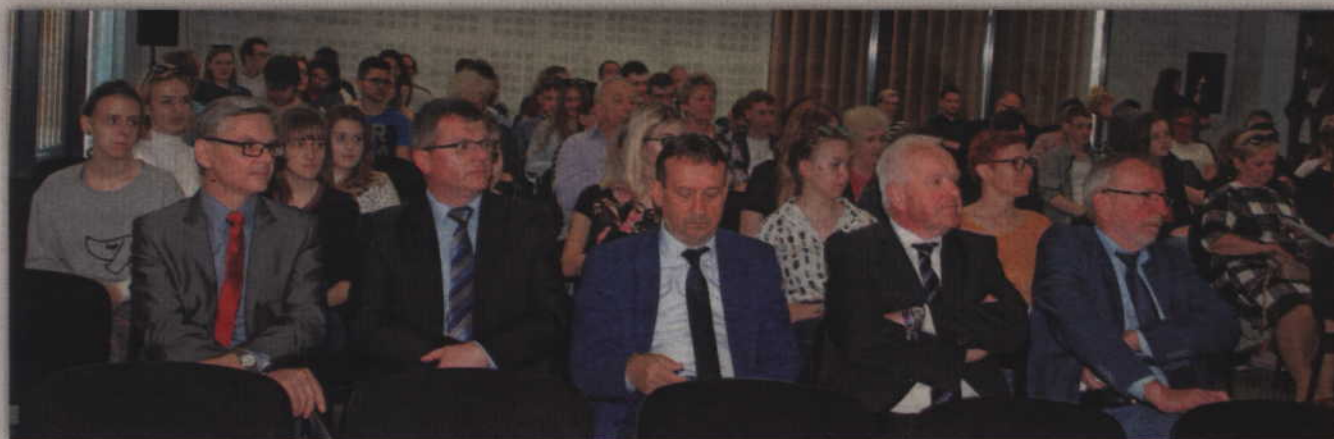
Spotkaniu przysłuchiwali się członkowie zarządów Kwidzyna oraz powiatu kwidzyńskiego.