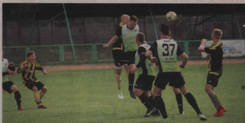
Rodło Kwidzyn w poprzedniej kolejce pokonało Świt Radostowo wygrywając 3:0. Tym razem nie miało jednak argumentów w starciu z liderem z Ostaszewa.

Rodło Trzciano przegrało w Waplewie 6:2 Wysoko swoje mecze prze-