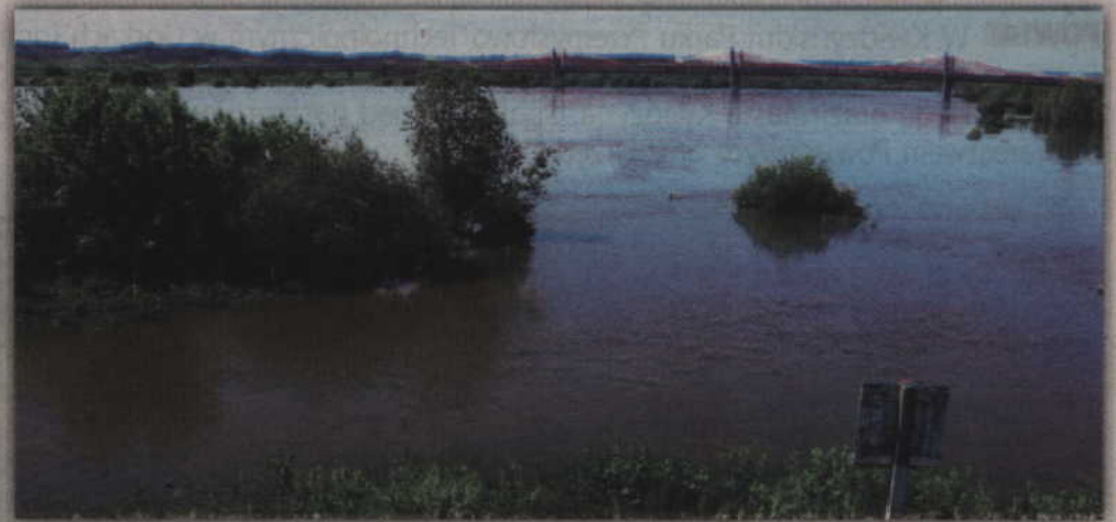
Najwyższy poziom wody w Korzeniewie zarejestrowano w sobotę, 1 czerwca.

W piątek, 30 maja o godz. 7.00, wodowskaz w Korzeniewie wskazał 515 cm, czyli znacznie mniej od stanu ostrzegawczego. W sobotę, 31 maja o godz. 7.00, wodowskaz wskazywał już 586