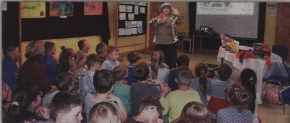
Razem z autorka dzieci zaśpiewały jej najbardziej znane piosenki.