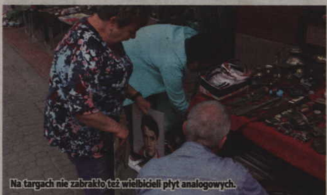
Na targach nie zabrakło też wielbiciele płyt analogowych.