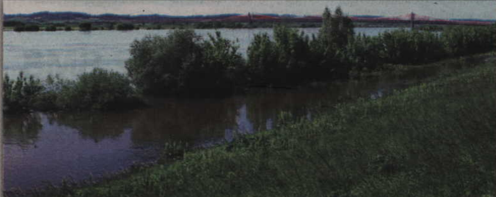
Zalana została cała boczna ścieżka prowadząca wzdłuż brzegu rzeki.