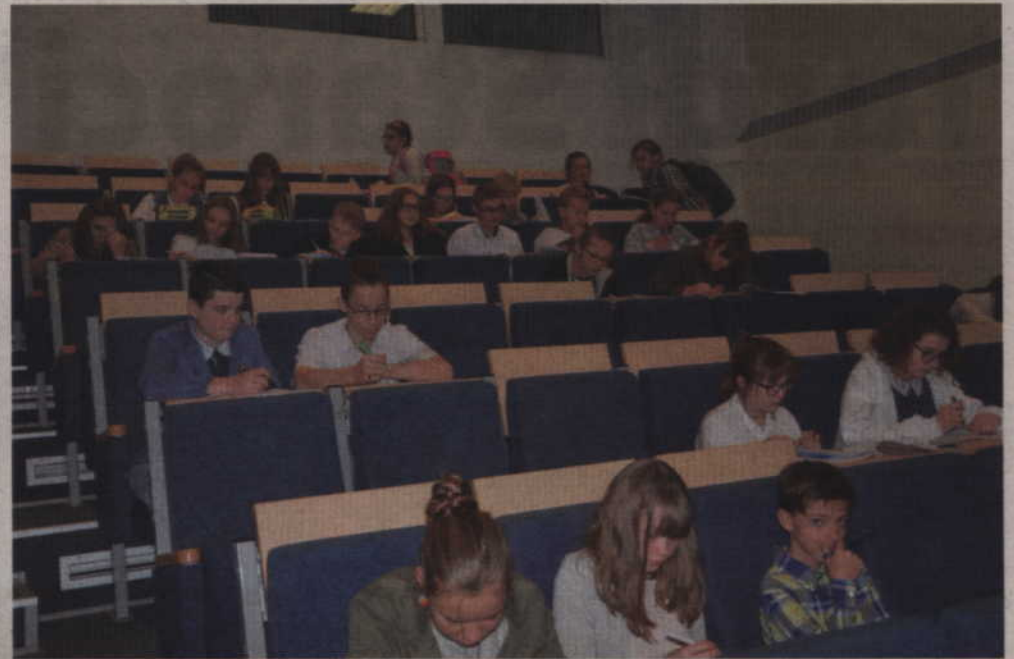
(n) Uczniowie starszych klas podczas testu.

że nagrody książkowe. Nagrody w tym roku ufundowali: Starosta Powiatu Kwidzyńskiego, Burmistrz Miasta i Gminy Prabuty, Wójt Gminy Ryjewo, Biblioteka Miejsko-Powiatowa w Kwidzynie oraz Pedagogiczna Biblioteka Wojewódzka w Gdańsku Filia w Kwidzynie.