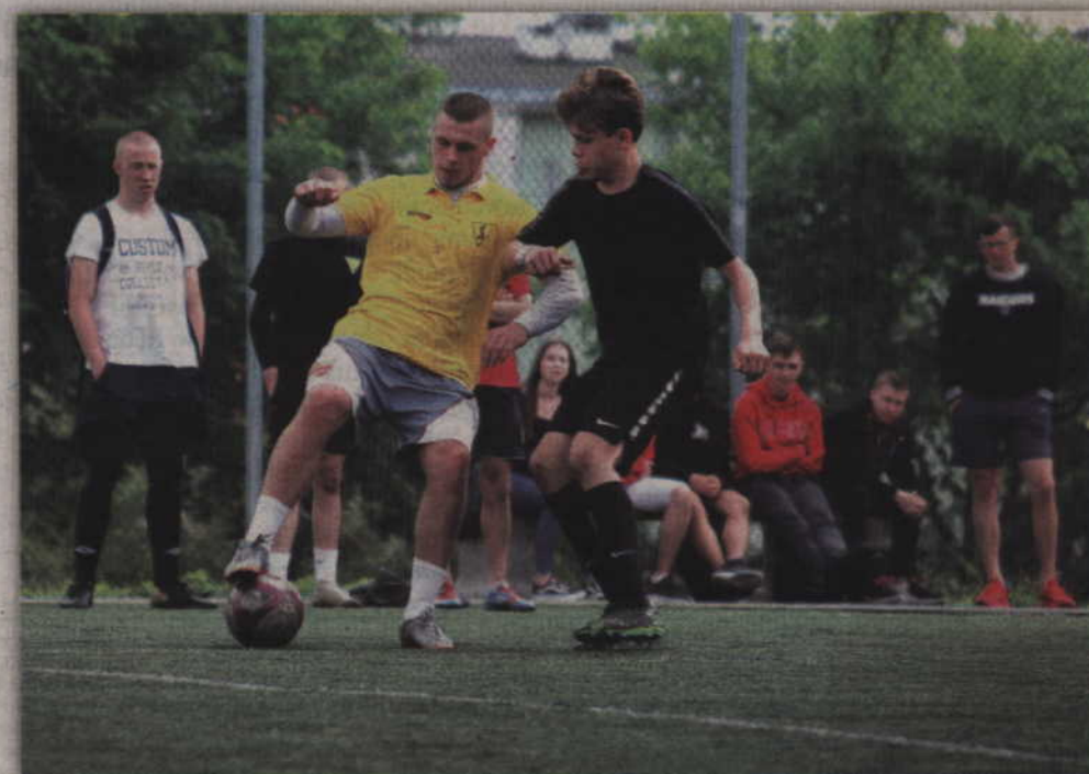
W meczu o brąz FC Ogórki pokonały drużynę Wybrzeża Klatki Schodowej.