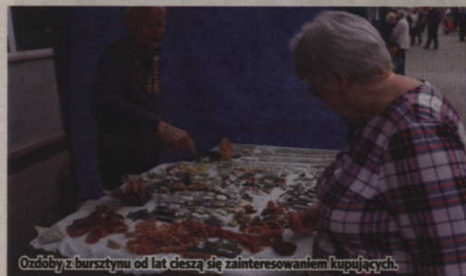
Ozdoby z bursztynu od lat cieszą się zainteresowaniem kupujących.