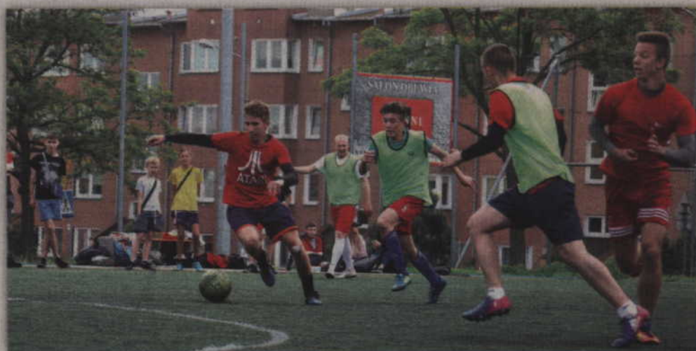
W finale FC Promil pokonał piłkarzy FC Podkowa.

Po występach maluchów na boisko ponownie weszli starsi zawodnicy, którzy rozegrali półfinały oraz mecze o III i I miejsce. Ostatecznie turniej w tej kategorii wygrał FC Promil, który w finale pokonał FC Podkowa. Trzecie miejsce wywalczyły natomiast FC Ogórki, które w bezpośrednim pojedynku pokonały Wybrzeże Klatki Schodowej.