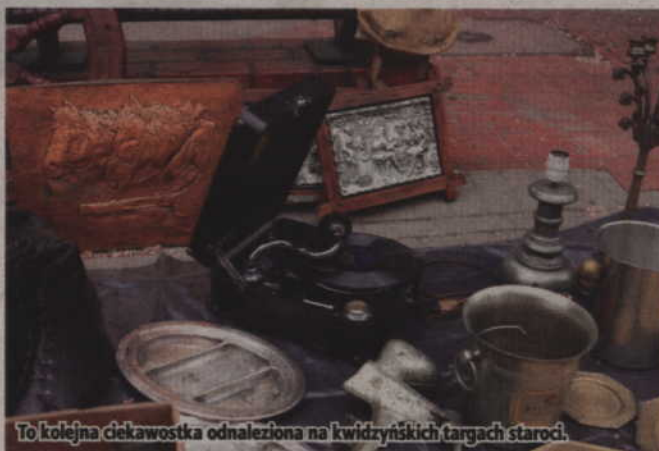
To kolejna ciekawostka odnaleziona na kwidzińskich targach staroci.