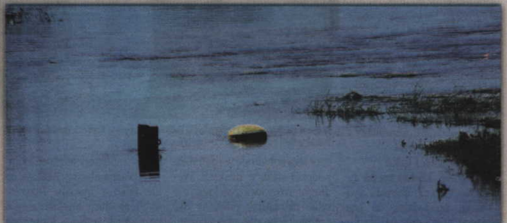
Gdzieniedzie z wody wystawały znajome elementy dawnej przystani promowej.