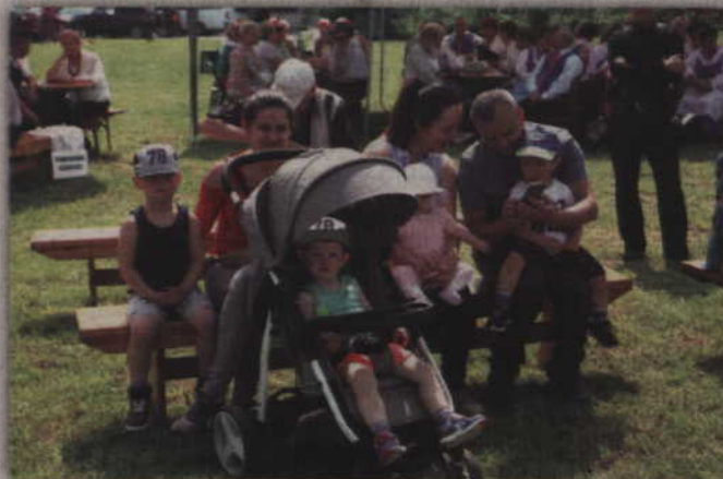
Najmłodszy miłośnicy piosenki biesiadnej.