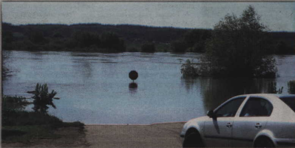
Wezbrana woda w Wiśle stanowiła nie lada atrakcję dla okolicznych mieszkańców.

POWIAT. Tylko nieznacznie został przekroczony stan ostrzegawczy poziomu wody w Wiśle, podczas przechodzenia fali kulminacyjnej. Stan ostrzegawczy na wodowskazu w Korzeniewie wynosi 610 cm. Najwyższy poziom jaki zanotowano to natomiast 642 cm, czyli o 32 cm powyżej stanu ostrzegawczego. Stan alarmowy wynosi 700 cm.