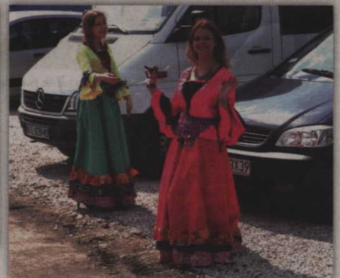
Kolorowe stroje to już tradycja na cyganowskim przeglądzie.

Organizatorzy zadbali także o aspekt kulinarny. Rada Sołecka sołectwa Cygany przygotowała stoisko z przekąskami, ciastem i napojami. Dochód ze sprzedaży pomysłodawcy stoiska postanowili przeznaczyć