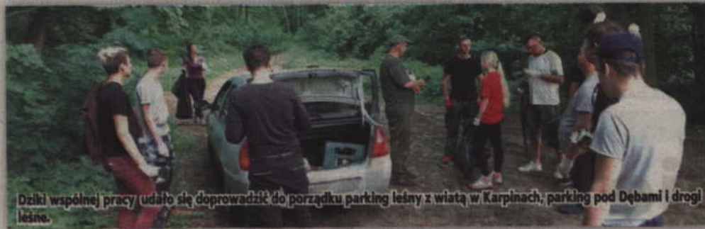
Dzięki wspólnej pracy udało się doprowadzić do porządku parking leśny z wiatą w Karpinach, parking pod Dębami i drogi leśne.

SADLINKI. Stowarzyszenie „Szansa dla Młodych” zorganizowało akcję sprzątnięcia parkingów w pobliżu Sadlinek. Podczas akcji zebrano 25 worków śmieci. Inicjatywę wspólnie podsumowano przy ognisku.