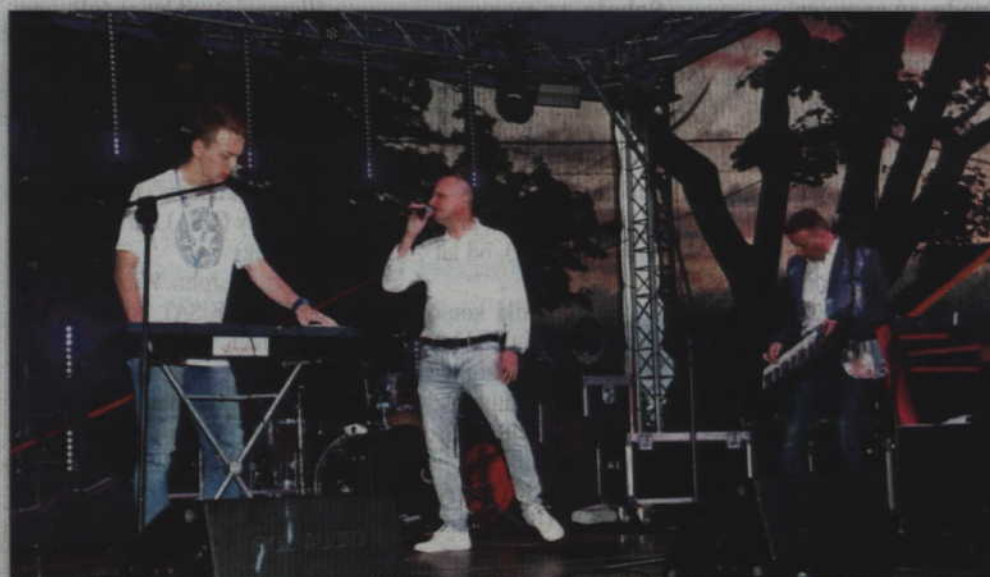
Dla fanów muzyki disco polo występ zespołu „Voyager” był ukoronowaniem drugiego dnia święta miasta.