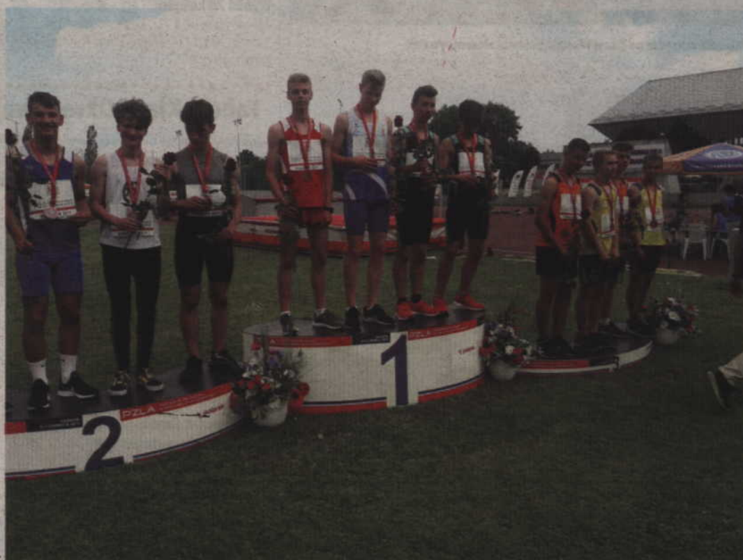
Podium rywalizacji w sztafecie szwedzkiej chłopców U16. Zwyciężyła ekipa województwa Pomorskiego, przed biegaczami z Podkarpackiego i Małopolski.