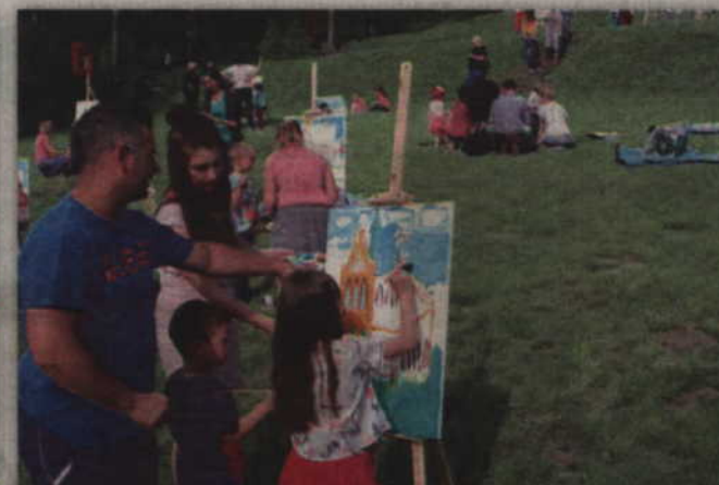
Niekiedy obraz powstawał przy współpracy czterech osób.