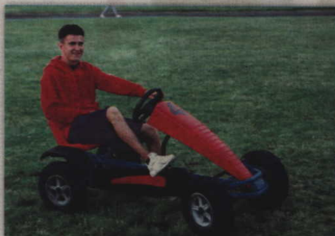
Robert Kubica też kiedy tak zaczynał swoją przygodę z samochodami wyścigowymi.

Gród Rolanda po raz kolejny obchodził swoje święto. Organizatorzy przygotowując program obchodów zaplanowali dla każdego coś fajnego. Pierwszy dzień należał do młodzieży, a konkretnie do uczniów Zespołu Szkół Ponadgimnazjalnych. Przygotowali oni widowisko pod nazwą „Świętojańska Ku-