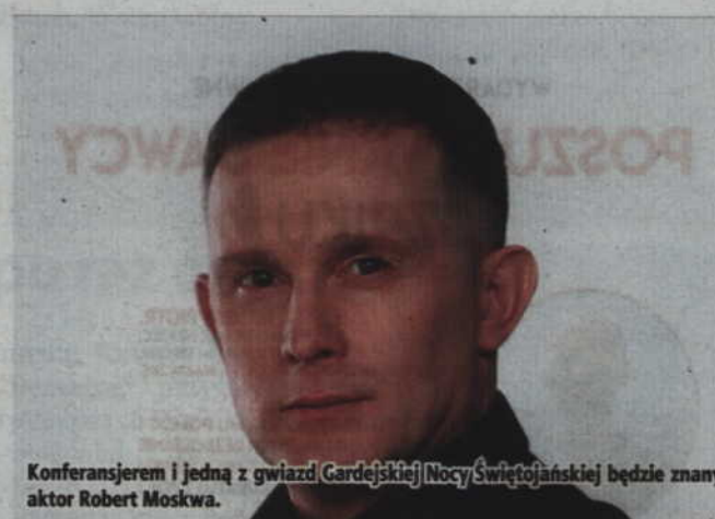
Konferansjerem i jedną z gwiazd Gardejskiej Nocy Świętojańskiej będzie znany aktor Robert Moskwa.