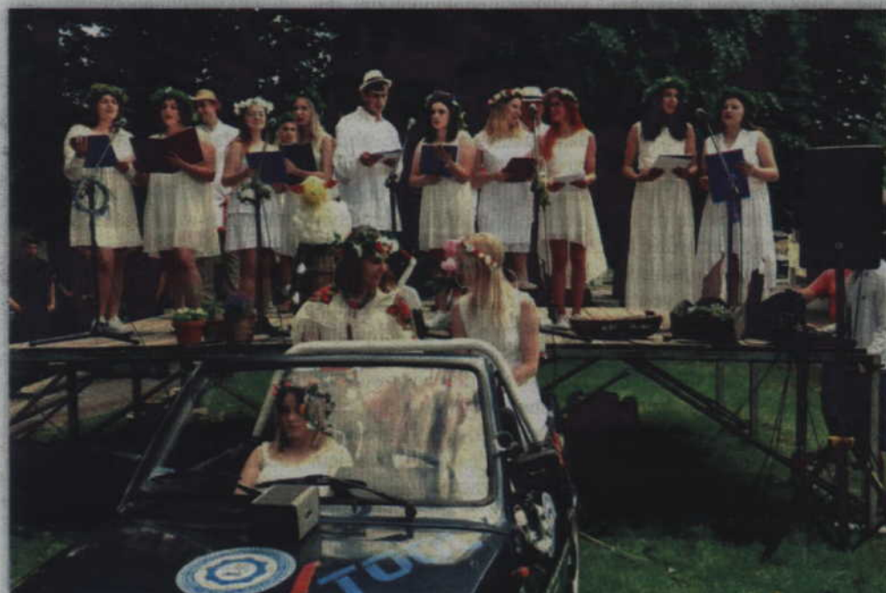
„Świętojańską Kupalnockę” przygotowali uczniowie z Zespołu Szkół Ponadgimnazjalnych w Prabutach.