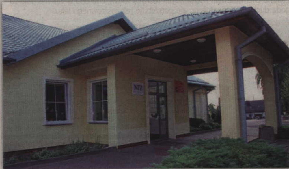
W najbliższą sobotę, 15 czerwca, w Hospicjum św. Wojciecha w Kwidzynie odbędzie się uroczystość związana z dwudziestą rocznicą utworzenia placówki.

- Do naszego hospicjum trafiają także pacjenci z Gniewu, Sztumu, Malborka czy z Susza. widać, że jest deficyt na tego typu świadczenia, szczególnie