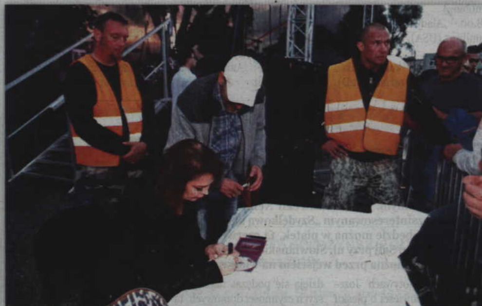
Nie brakowało osób, które chciały mieć na pamiątkę nie tylko płytę, ale również autograf artystki.