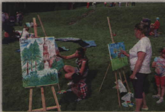
Podczas pleneru malarskiego przy sztalugach pracowały dzieci oraz rodzice.