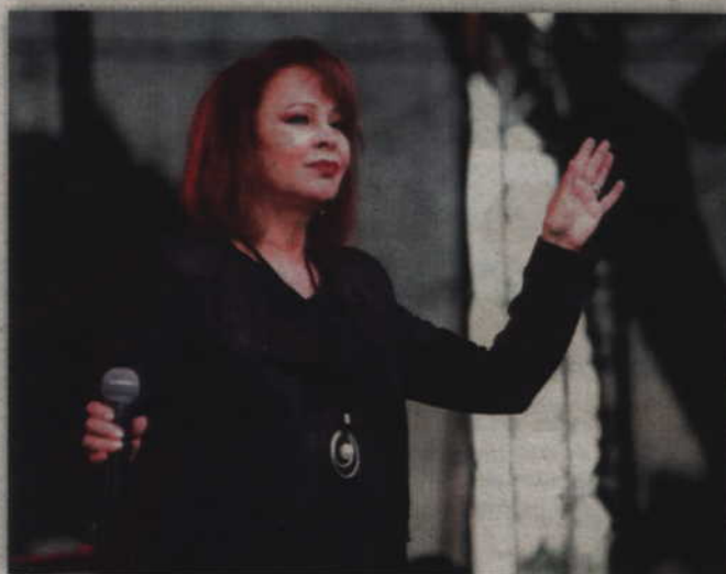
Występ Izabeli Trojanowskiej ujął prabucką publiczność.