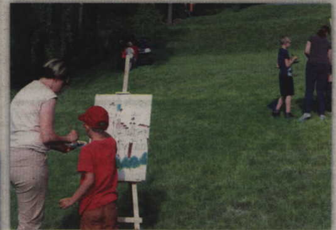
Zajęcia odbyły się na terenie ryjewskiego Sanktuarium Świętej Rodziny.