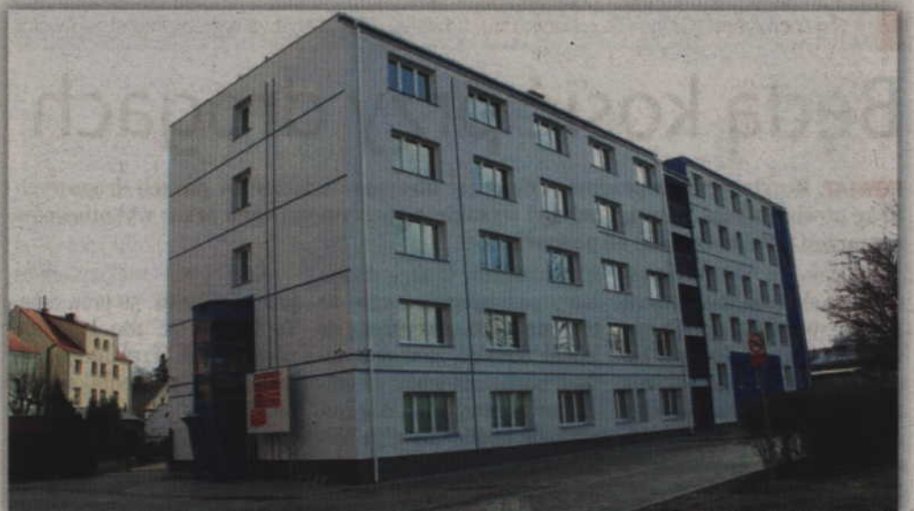
Trwa ostatni etap prac modernizacyjnych w budynku przy ul. Grudziądzkiej. Remontem objęte zostały dwa ostatnie piętra.