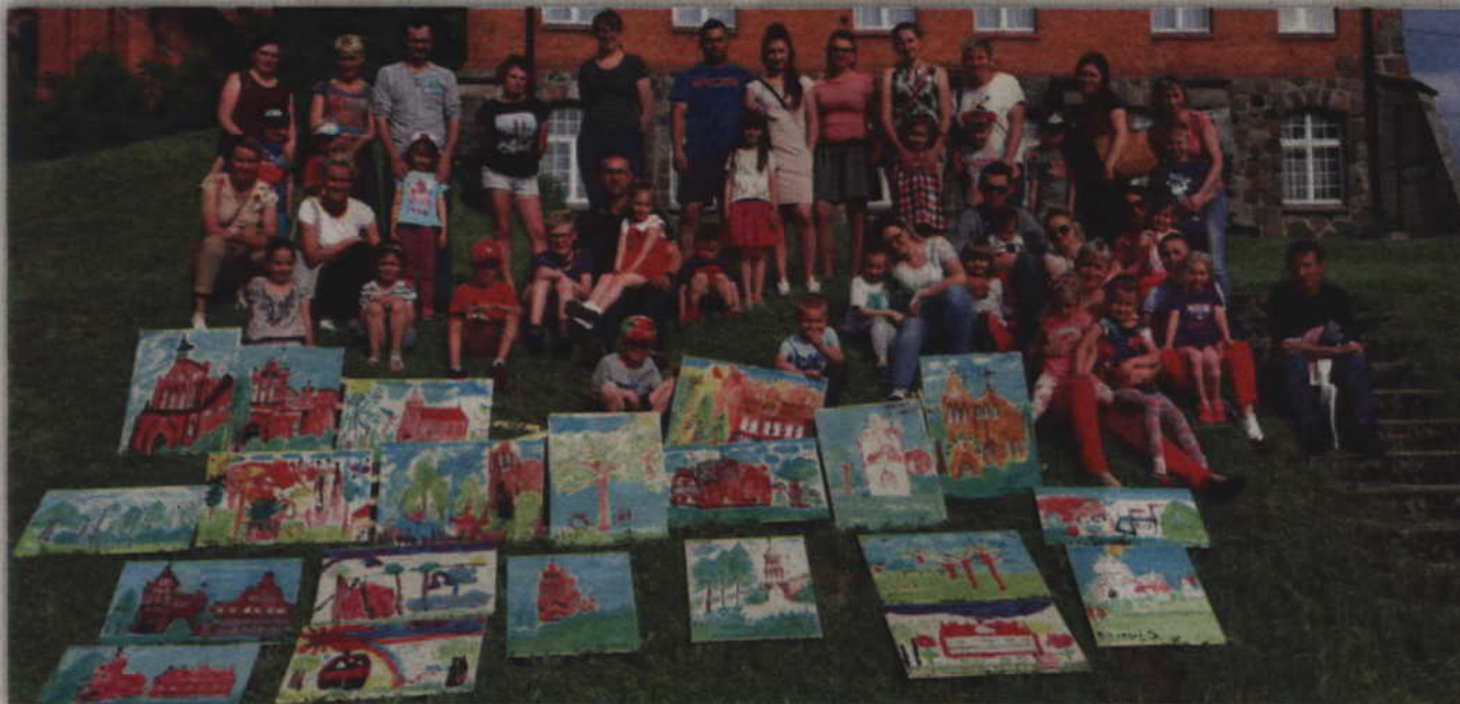
Uczestnicy ryjewskiego pleneru malarskiego i powstałe prace.