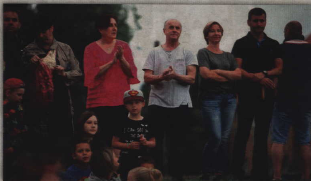
Ze wzniesienia lepiej widać.

klamstw” oraz kultowy hit czyli „Podaj cegłę”.