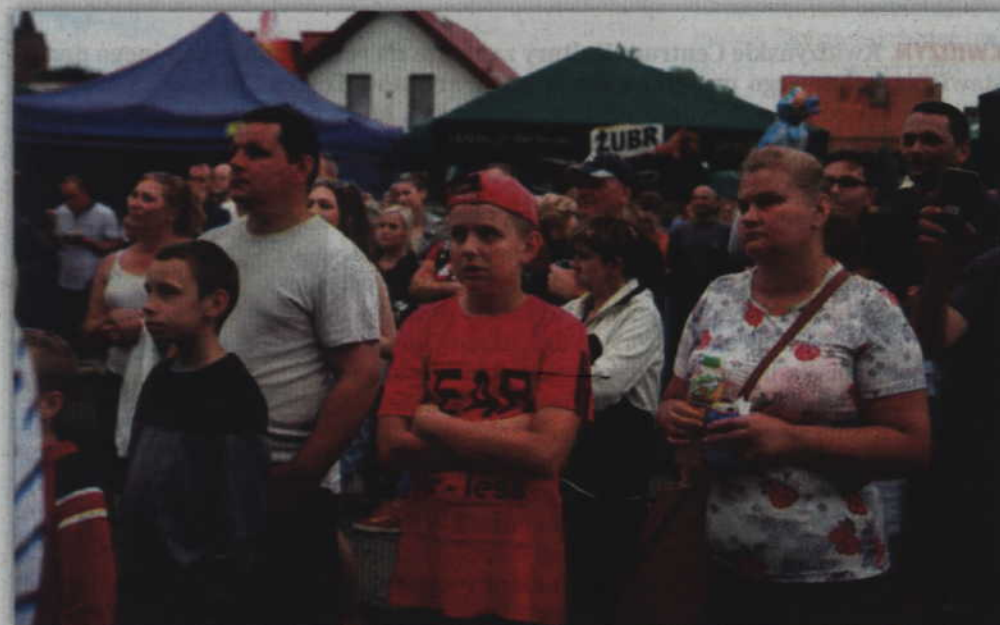
Prabucanie podczas sobotnich propozycji zorganizowanego festynu.