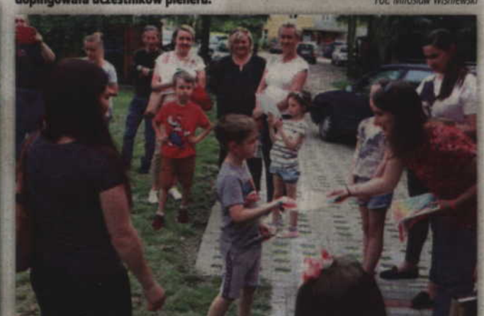
Po zakończeniu zajęć wszyscy uczestnicy otrzymali pamiątkowe dyplomy.