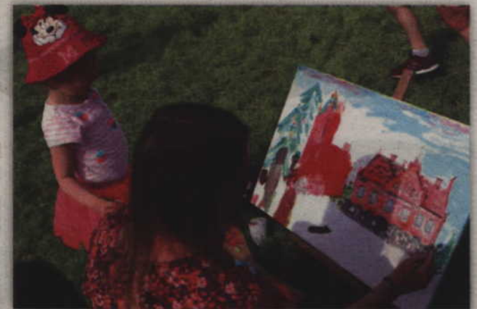
Wspólne dzieło Małgorzaty Gutowskiej i jej mamy Agnieszki.