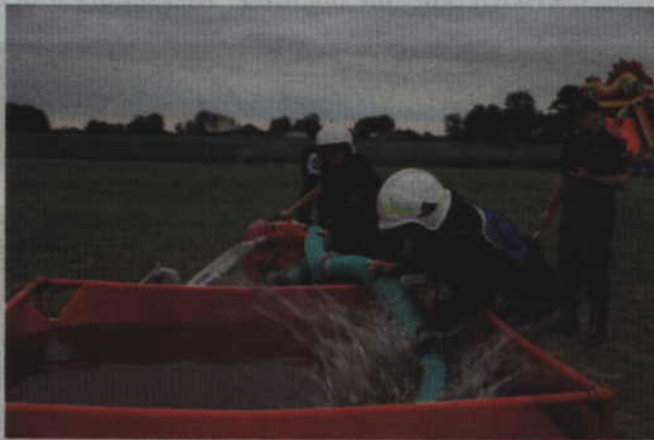
Motopompa uruchomiona, więc wąż może trafić do basenu z wodą. Na zdjęciu druhowie z OSP w Nebrowie Wielkim.

Po rozegraniu wszystkich konkurencji, specjalna komisja złożona ze strażaków z PSP w Kwidzynie podsumowała punktację. W konkurencji drużyn se-