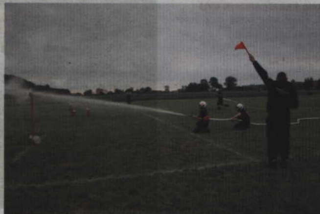
Zadanie wykonane, woda z prądnicy trafiła w wyznaczone miejsce.