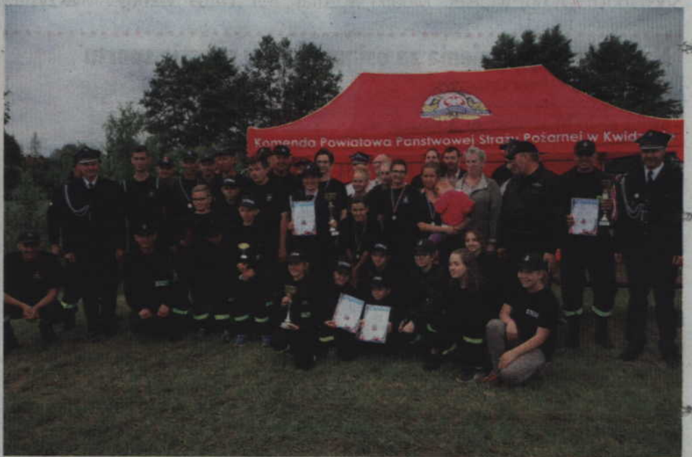
Seniorki, seniorzy i najmłodszy adepci strażackiej przygody czyli OSP Kaniczki.