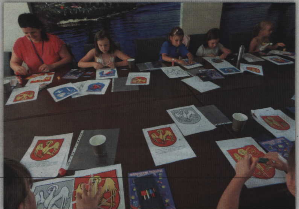
Dzieci miały do wykonania różne zadania, które przygotowano dla nich w Sali Partnerskiej.