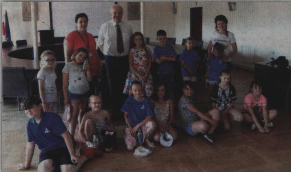
Dzieci ze świetlicy środowiskowej przy ul. Hallera odwiedziły Jerzego Godzika, starostę kwidzińskiego.

Warto dodać, że placówki wsparcia dziennego, w tym także świetlica przy ul. Hallera, funkcjonują w ramach Stowarzyszenia Rodzin Katolickich. Zapewniają pomoc w nauce i