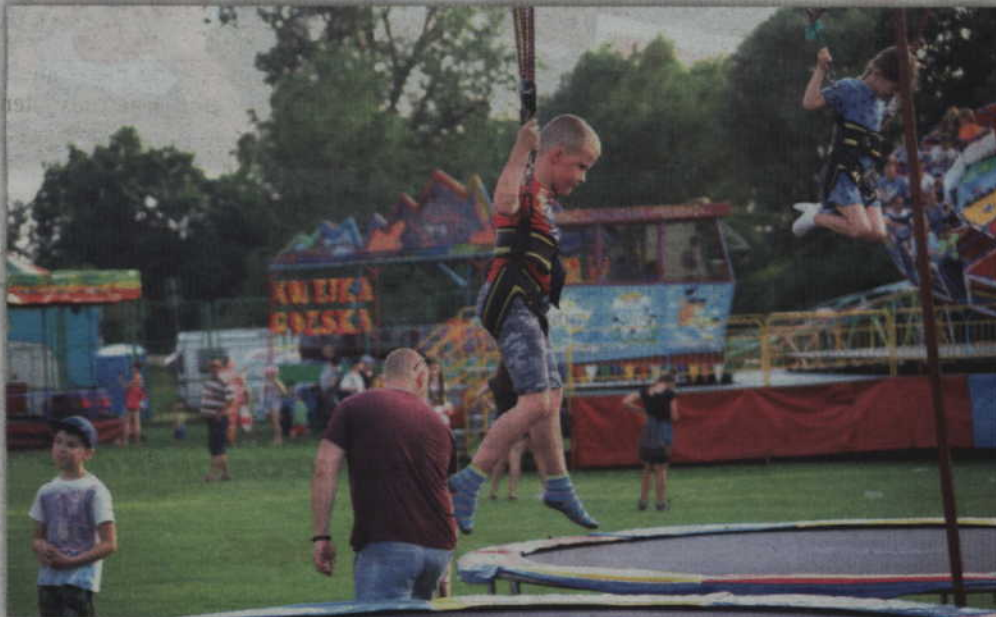
Na górnej płycie boiska nie brakowało atrakcji dla najmłodszych.