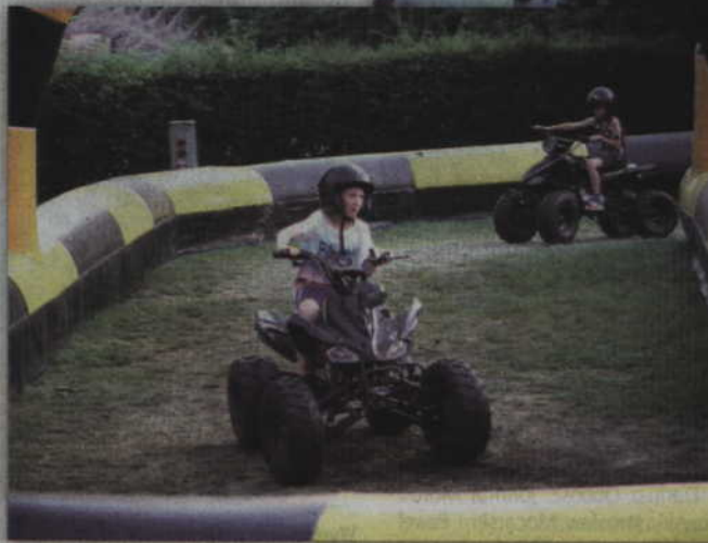
W tym roku na chętnych czekała także przejażdżka quadami.