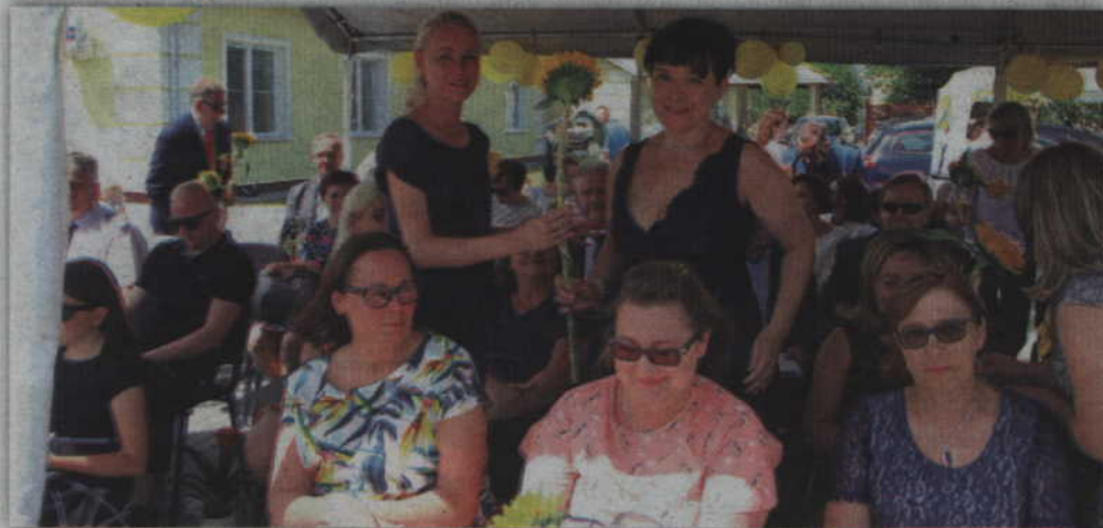
Pracownikom hospicjum wręczono kwiaty.

Hospicjum działa w ramach kontraktu zawartego z Narodowym Funduszem Zdrowia. Wspieraniem bieżącej działalności zajmuje się Kwidzyńskie Towarzystwo Przyjaciół Chorych. Członkami wspierającymi są samorządy miasta Kwidzyna, powiatu kwidzyńskiego i gminy Sadlinki. Pacjenci, którzy mogą liczyć na pomoc hospicjum, pochodzą z całego powiatu kwidzyńskiego. (jk)