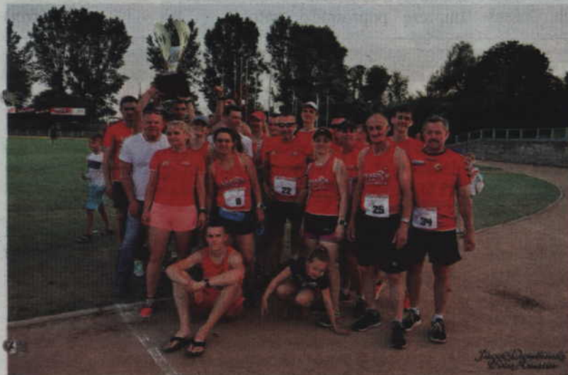
Zwycięska ekipa Traktor Team Gmina Kwidzyn.

BIEGI. Ekipa „Traktor Team Gminy Kwidzyn” zwyciężyła w Pojedynku Maratońskim, pokonując zawodników „Kwidzyn Biega”. Impreza zorganizowana przez Kwidzyńskie Centrum Sportu i Rekreacji towarzyszyła wiosennej edycji Testu Coopera. W pojedynku zorganizowanym na kwidzyńskim stadionie wzięło udział 84 biegaczy.