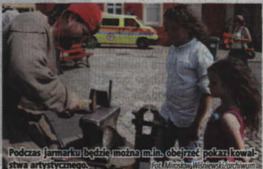
Podczas jarmarku będzie można m.in. obejrzeć pokaz kowalstwa artystycznego.

Podczas jarmarku mieszkańcy będą mogli przyrzeć się dawnym rzemiosłom, a także wziąć czynny udział w warsztatach rzemieślniczych czy też spróbować smaków z dawnych lat. Na zainteresowanych czekać będą warsztaty tkackie, warsztaty serwarskie, warsztaty garncarskie, warsztaty wikliniarskie oraz pokazy kowalstwa artystycznego. Nie zabraknie także miodów, stoisk kół gospodyń wiejskich, tradycyjnego jadła oraz atrakcji dla dzieci.