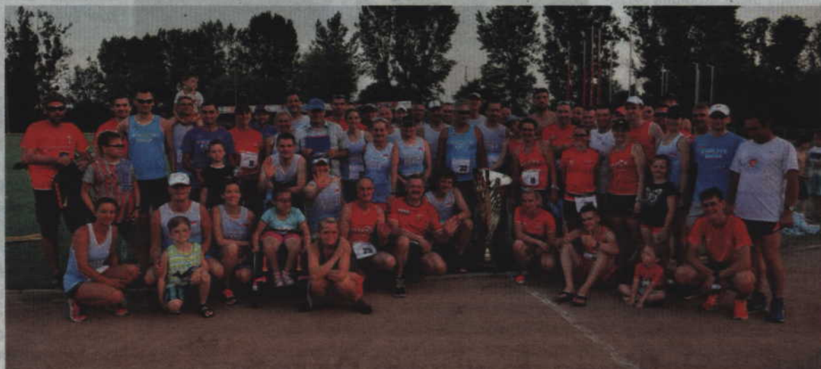
Wspólna fotografia dwóch rywalizujących zespołów.

Warunki pogodowe nie ułatwiały bicia rekordów (35 stopni), ale jak na biegaczy przystało dzielnie stawili się na starcie. W teście Coopera wzięło udział 12 uczestników, uzyskując bardzo dobre rezultaty. Strażem w dziesiątkę okazała się natomiast impreza towarzysząca czyli sztafeta. W rywalizacji wzięło udział aż 84 biegaczy w niebieskich (Kwidzyn Biega) i czerwonych (Traktor Team Gmina Kwidzyn) koszulkach, którzy walczyli ze sobą o zwycięstwo.