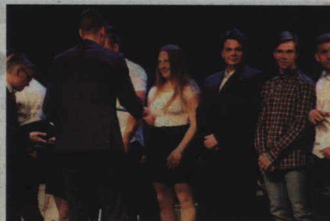
Wśród wyróżnionych znaleźli się również zawodnicy sekcji trójboju siłowego i podnoszenia ciężarów LKS Nadwiślanin Kwidzyn.