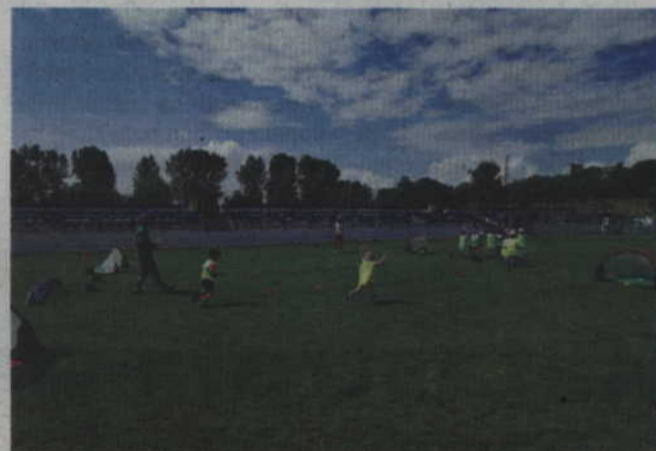
W zmaganiach piłkarskich zorganizowanych na kwidzyńskim stadionie wzięło udział ponad 400 dzieci.