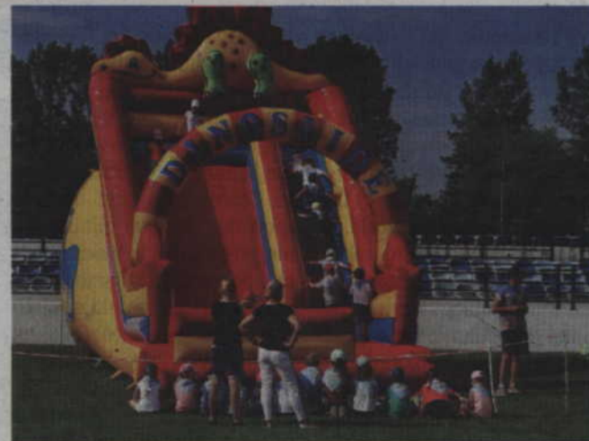
Atrakcją imprezy była możliwość zabawy na dmuchanej zjeżdżalni.