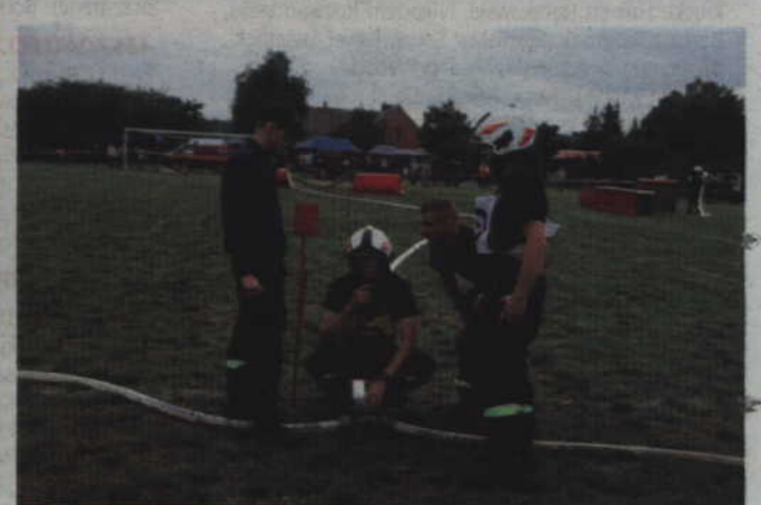
Czy wszystko zrobiliśmy dobrze? - zastanawiają się druhowie z OSP Sadlinki.