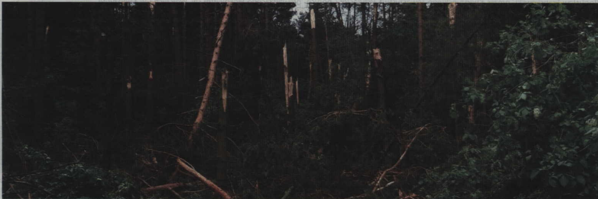
Strażacy najczęściej pracowali przy usuwaniu powalonych drzewa. Na zdjęciu zniszczony las przy drodze Brokowo-Rakowiec.

POWIAT. Sobotnia nawałnica, która przeszła przez powiat kwidzyński, na szczęście nie wyrządziła zbyt wielu szkód. Interweniujący strażacy pracowali najczęściej przy usuwaniu połamanych drzew lub też pomagali w usuwaniu wody z zalanych posesji. O wiele gorzej było w przypadku czwartkowej burzy, która m.in. unieruchomiła wyremontowany niedawno mostek na ul. Owczej.