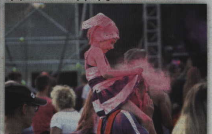
Sobota upłynęła mieszkańcom w wielu kolorach.