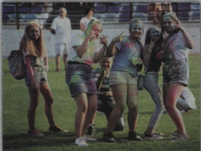
Grupy ubarwionych młodych ludzi przewijały się niemal wszędzie.