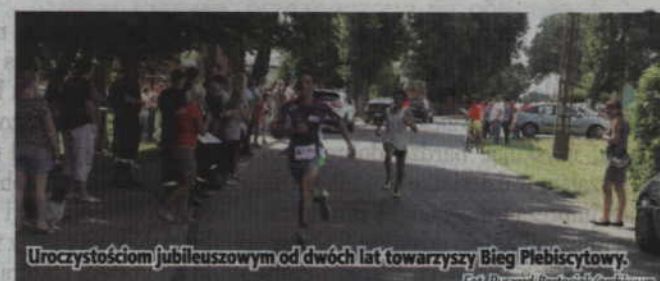
Uroczystościom jubileuszowym od dwóch lat towarzyszy Bieg Plebiscytowy.

tego dnia czekać będą również dodatkowe atrakcje, jak animacje dla dzieci, dmuchany zamek czy stoiska z kawą i ciastem. W godzinach 11.00-13.00 będzie można także zwiedzić szkolną Izbę Pamięci Narodowej w Janowie.