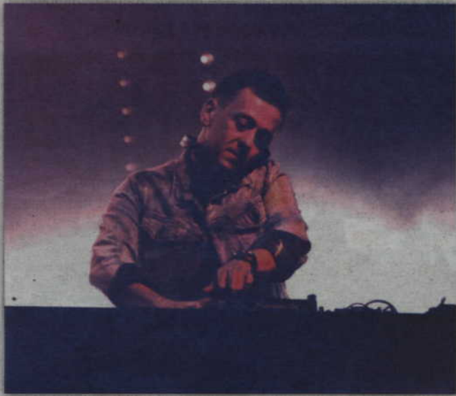
DJ potrafił znakomicie rozruszać kwidzyńską publiczność.