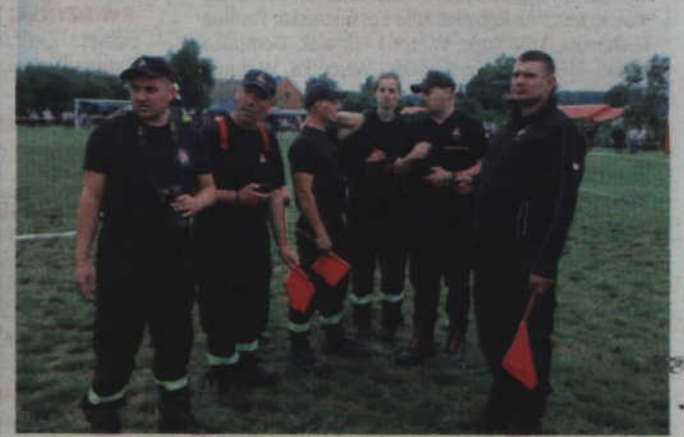
Po rozegraniu ćwiczenia bojowego czas na krótkie podsumowanie ze strony komisji sędziowskiej.