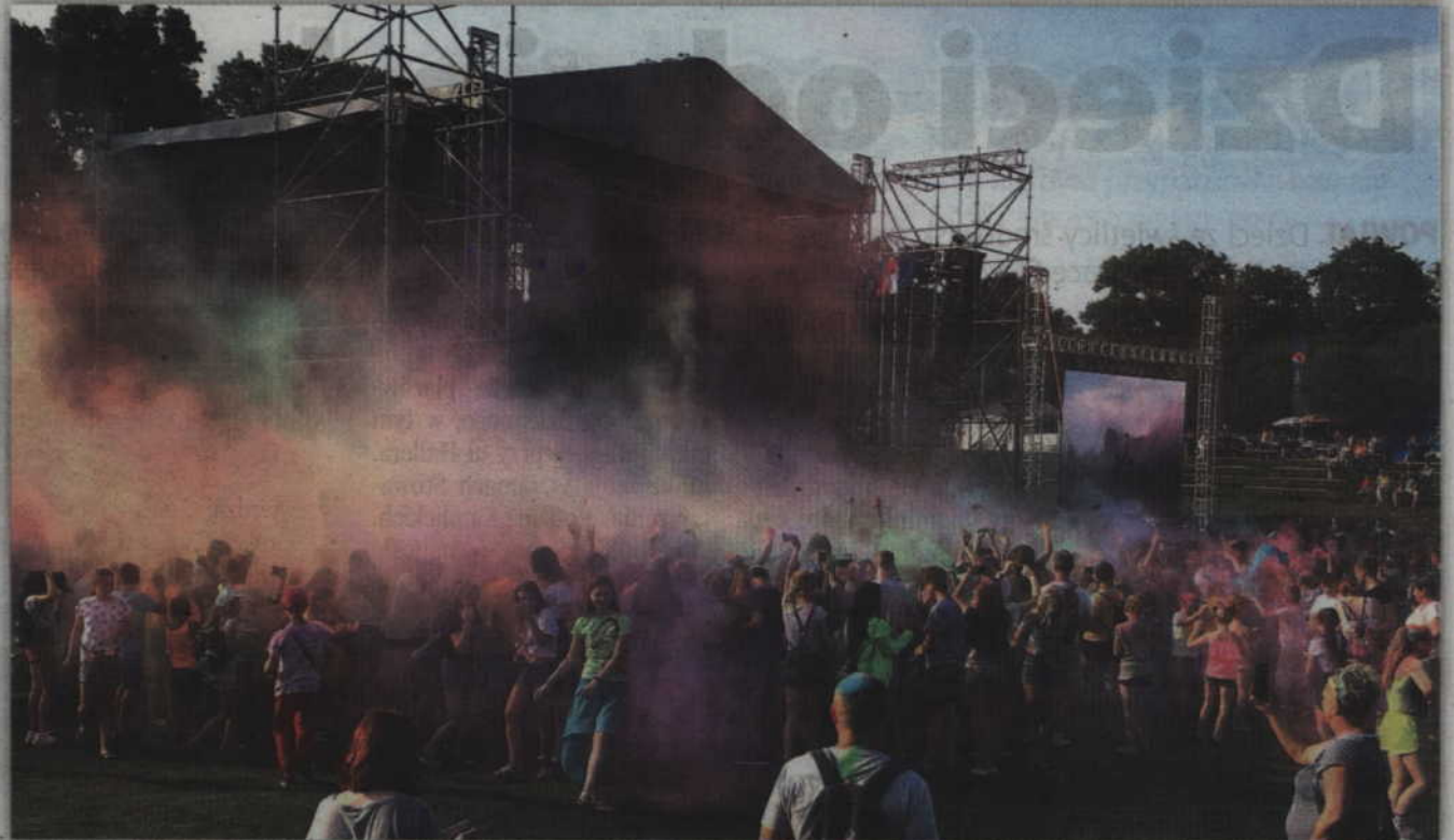
Efektowna „Eksplozja kolorów” odbywała się pod sceną główną.