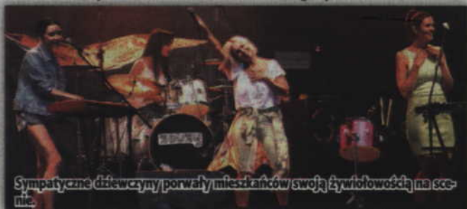
Sympatyczne dziewczyny porwały mieszkańców swoją żywiołowością na scenie.