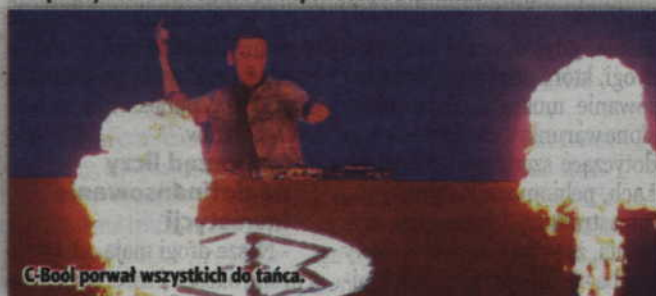
C-Boo! porwał wszystkich do tańca.