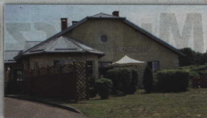
Oddział stacjonarny hospicjum dysponuje obecnie 19 miejscami. Całodobową opieką paliatywną w ubiegłym roku objęto ponad 200 chorych.

Hospicjum”. Kapituła przyznała dziewięć statuetek osobom i placówkom, które angażowały się w rozwój hospicjum. Zarząd Kwidzyńskiego Towarzystwa Przyjaciół Chorych przyznał wyróżnienia instytucjom, szkołom oraz osobom, które na 100 dzień współpracują z organizacją i wspierają hospicjum. Statuetki