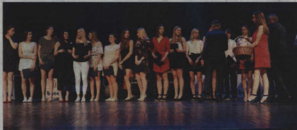
Nagrody odbierają złote medalistki Mistrzostw Polski junierek.