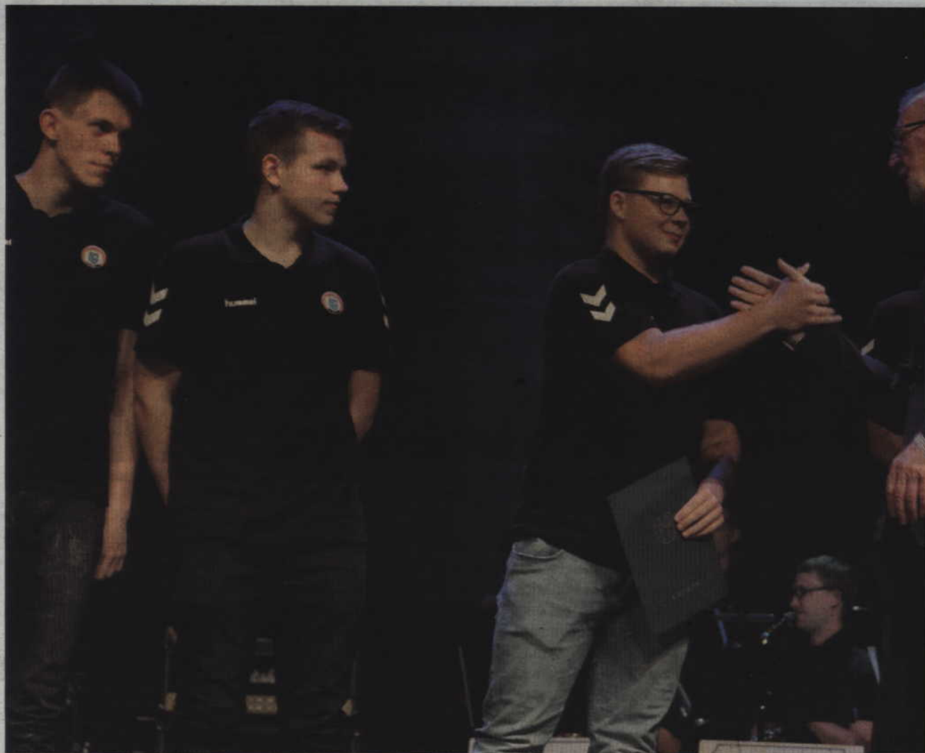
Trzecią drużyną w Polsce wśród juniorów młodszych zostali piłkarze ręczni MTS Kwidzyn.