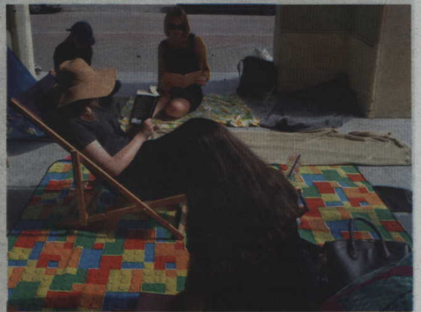
Na zewnątrz szkoły trafić można było na relaks z książką podczas plażowania.