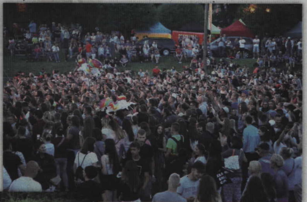
Największa widownia towarzyszyła występowi Kamila Bednarka.