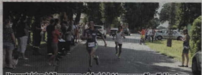
Uroczystościom jubileuszowym od dwóch lat towarzyszy Bieg Plebiscytowy.

tego dnia czekać będą również dodatkowe atrakcje, jak animacje dla dzieci, dmuchany zamek czy stoiska z kawą i ciastem. W godzinach 11.00-13.00 będzie można także zwiedzić szkolną Izbę Pamięci Narodowej w Janowie. (fox)