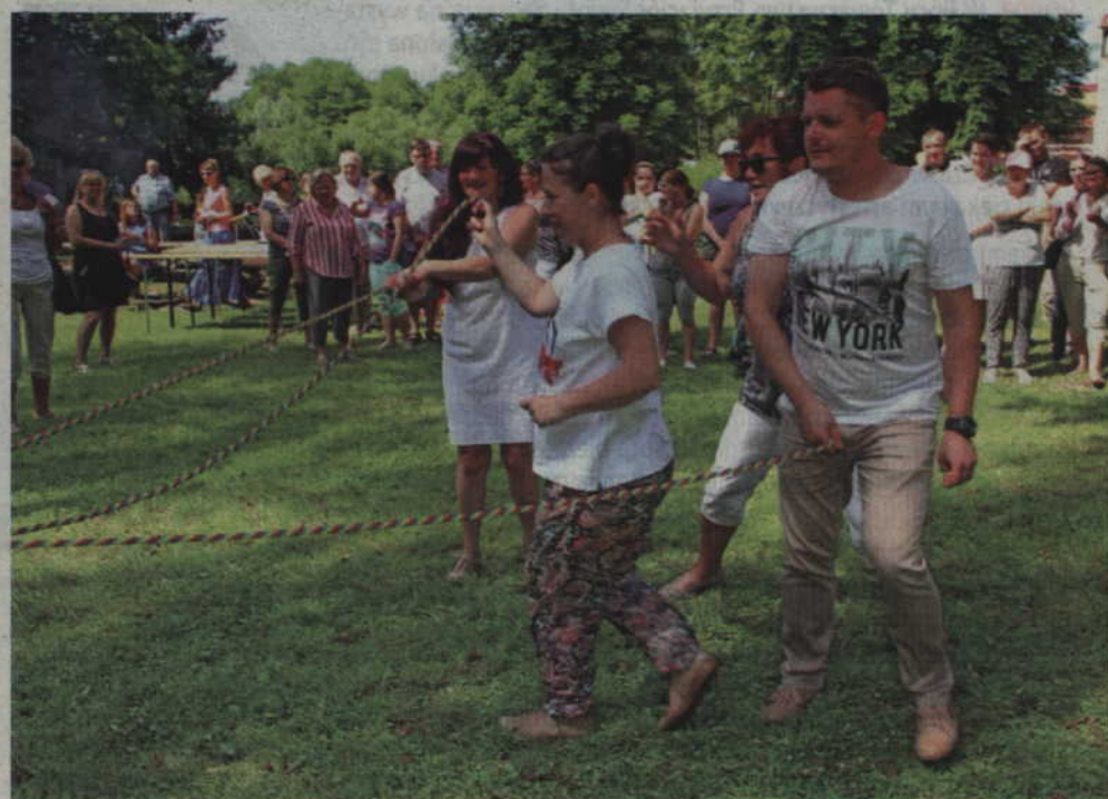
W poszczególnych zadaniach uczestniczyły osoby w różnym wieku.