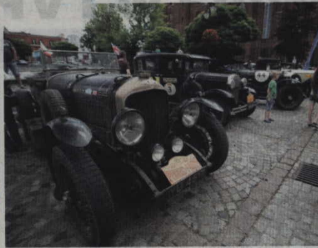
Stare auta podziwiać można było na Placu św. Jana Pawła II.