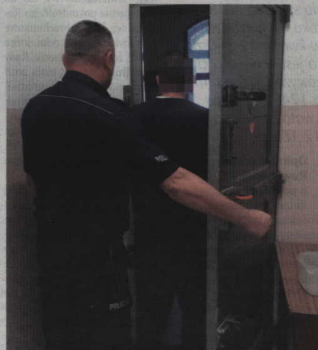
Poszukiwany 21-latek odpowie za posiadanie narkotyków.