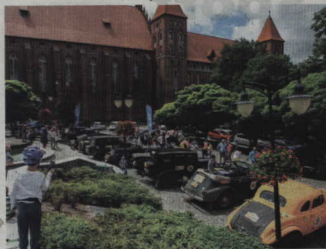
Do Kwidzyna przyjechało około stu samochodów uczestniczących w rajdzie Pekin-Paryż.

RAJDY SAMOCHODOWE. Krótki przystanek w Kwidzynie zrobili sobie uczestnicy tegorocznego rajdu Pekin – Paryż. Dzięki temu na Placu św. Jana Pawła II mogliśmy oglądać cuda motoryzacji, które dzielnie pokonują kolejne kilometry. Pojawiły się m.in. Holden, Austiny, Bristole, Bentleye, ale również łatwo rozpoznawalne Rolls Royce, Porsche, Mercedesy, Volvo, Chevrolety i jedną Ładę. Około stu aut po chwili przerwy ruszyło jednak w dalszą drogę, w kierunku Paryża.