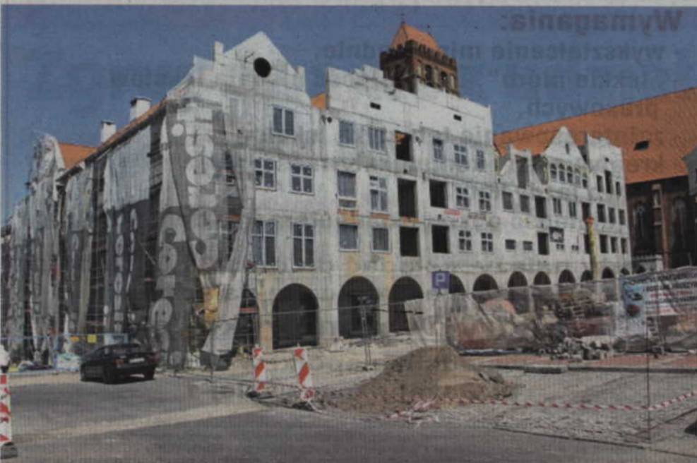
Nowa ulica pozwoli na dojazd do mieszkań oraz lokali użytkowych budowanych na terenie Starego Miasta.

NAWIERZCHNIA BĘDZIE NAWIĄZYWAĆ DO DAWNEJ ZABUDOWY