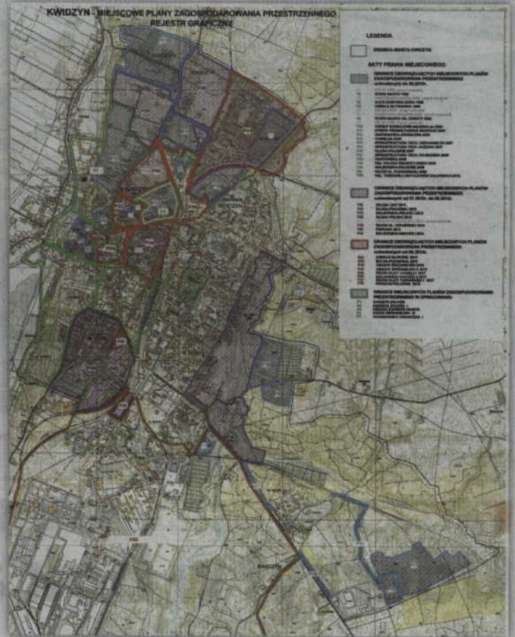
Tworzenie miejscowych planów zagospodarowania przestrzennego „Osiedla Piastowskiego” oraz „Kwidzyn - Wschód” obejma szerokie konsultacje społeczne.

- Mieszkańcy często wiedzieli, że trwa przygotowanie miejscowego planu, który obejmuje ich teren. Jednak nie zgłaszali wcześniej uwag. Robili to dopiero wówczas, gdy projekt planu był gotowy. Zdarzało się też, że ktoś planował jakieś przedsięwzięcie na określonym terenie i okazywało się, że jest ono niezgodne z planem. Dlatego próbujemy doprowadzić do konsultacji na wczesnym etapie jego tworzenia, aby uniknąć ta-