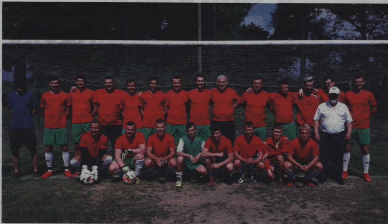
Dziesięć lat kibice i zawodnicy GKS Gardeja czekali na awans do A-klasy.

-Nasi kibice zaczęli jeździć z nami na mecze wyjazdowe! Gdziekolwiek graliśmy na wyjeździe, zawsze ktoś z Gardeji