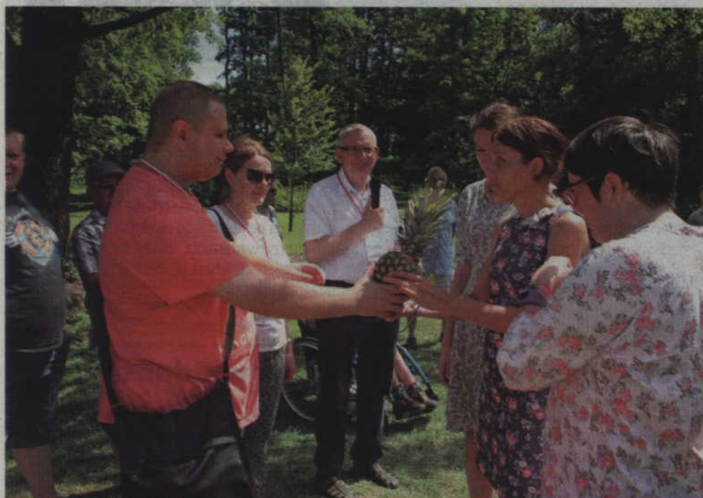
Zwycięzcy otrzymali główną nagrodę, którą był... ananas.