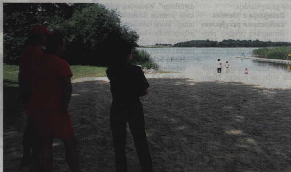
Kontrole kąpielisk, plaż oraz miejsc wypoczynku dzieci i młodzieży prowadzone przez funkcjonariuszy KPP Kwidzyn trwać będą przez całe wakacje.