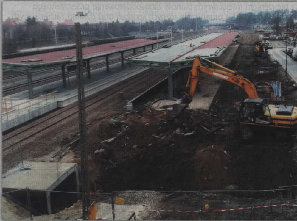
Wiosną tego roku pracownicy konsorcjum zeszli z placu budowy. Powodem przerwania prac były różnice co do wyceny dodatkowych prac, jakie musiały zostać wykonane podczas modernizacji linii nr 207.