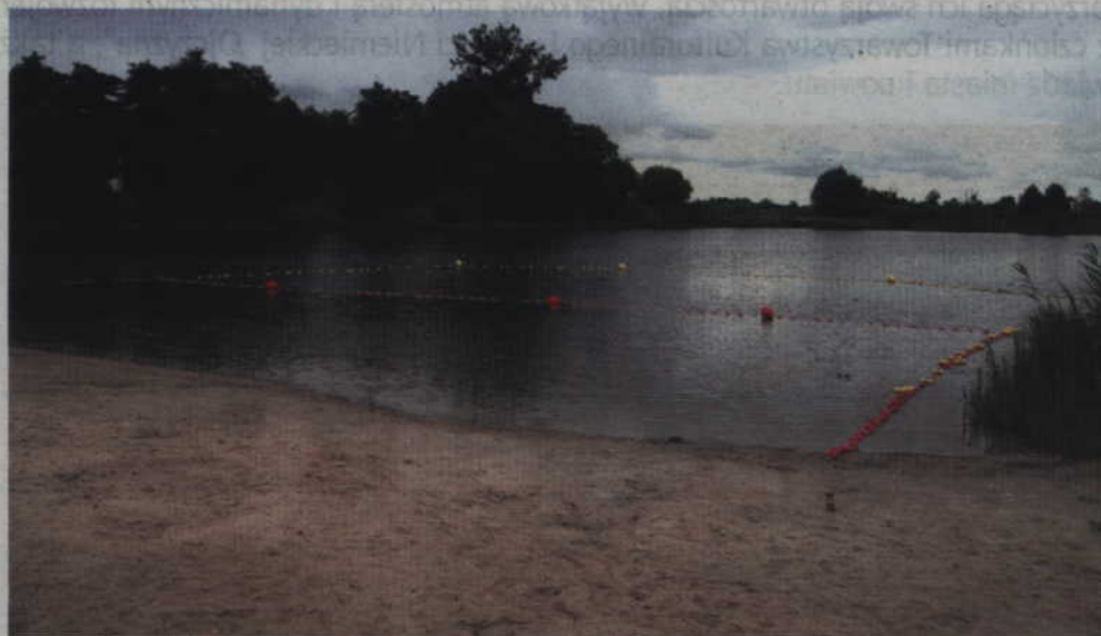
Jak afrykańskie upały się skończyły to plaża nad jeziorem w Gardei opustoszała.

Od ubiegłego roku zaczęły obowiązywać nowe przepisy związane z tworzeniem i prowadzeniem miejsc, w których można się bezpiecznie kąpać pod opieką ratowników. Takie miejsca tylko okresowo są wykorzystywane jako kąpieliska i pozwolenie na ich funkcjonowanie jest ważne zaledwie 30 dni. Chociaż minęły już afrykańskie upały, a ciepłe dni, jak zapowiadają synoptycy, niebawem powrócą, warto więc wybrać się nad jezioro ze strzeżonym kąpieliskiem. W tym roku miłośnicy wodnych kąpeli będą mieli do wyboru na terenie powiatu kwidzińskiego tylko dwa akweny, gdzie bezpieczeństwa