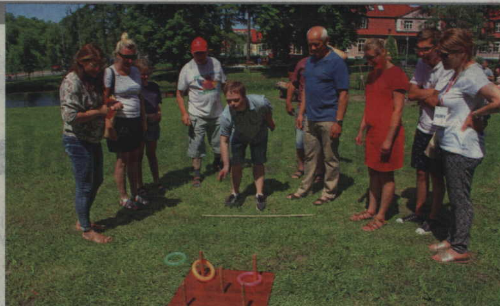
Zabawy sportowo-rekreacyjne odbywały się na terenie parku.

ca pracownię plastyczną. Zwycięzcy otrzymali główną nagrodę, którą był... ananas. Według organizatorów piknik to znakomita okazja do integracji osób związanych z warsztatem, a także okazja do podziękowania rodzicom, opiekunom i wolontariuszom za całoroczne wspieranie działań kwidzyńskiego WTZ. (n)