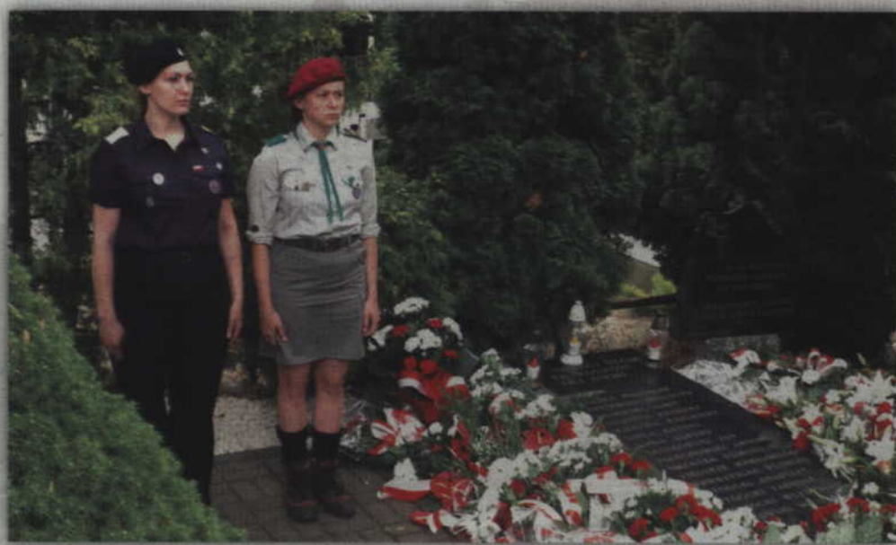
Na cmentarzu parafialnym w Janowie znajduje się płyta upamiętniająca patriotów z „Małej Polski”.

Naiwni mogli tylko wówczas sądzić, że Niemcy przejdą do plebiscytowego głosowania bez żadnych akcji. Nie pomogły jednak agitacje czy przybycie do Kwidzyna, Górek i Prabut Stefana Żeromskiego czy Jana Kasprowicza. To była tylko kropla w morzu potrzeb. Również wizyta arcybiskupa Achille Ratti'ego, pierwszego po odzyskaniu przez Polskę niepodległości nuncjusza apostolskiego, niewiele zmieniła. Papież Benedykt XV dodatko-