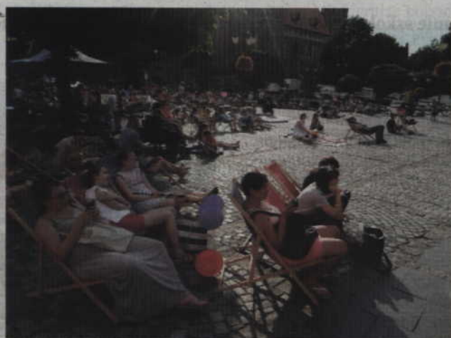
Seanse „Wakacyjnego kina na leżakach” odbywać się będą na placu Św. Jana Pawła II.