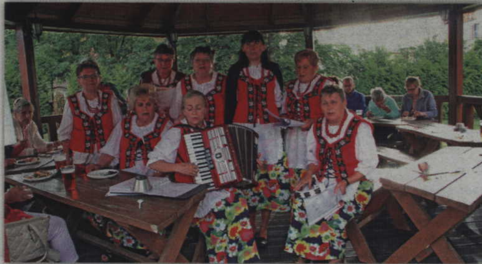
Spotkanie uświetnił koncert „Mikołajczanek”.

KWIDZYN. Przyjeżdżają co roku, aby odwiedzić Kwidzyn i powiat kwidzyński. Dla niektórych to sentymentalna podróż do rodzinnych miejsc, dla innych chęć odwiedzenia miasta, które jak twierdzą, przyciąga ich swoją otwartością, wyjątkową atmosferą i dynamicznym rozwojem. Co roku spotykają się z członkami Towarzystwa Kulturalnego Ludności Niemieckiej „Ojczyzna”, a także przedstawicielami władz miasta i powiatu.