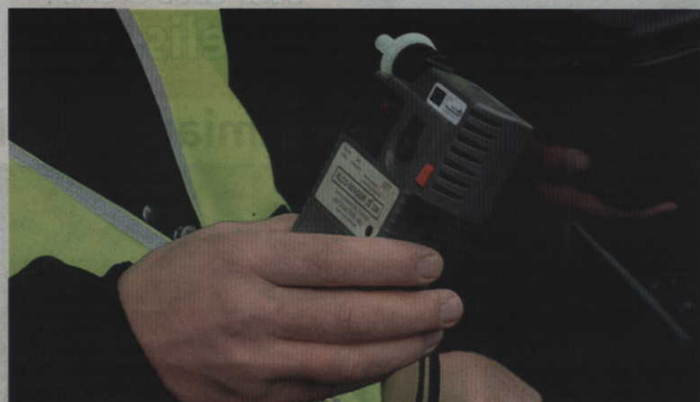
W trakcie kontroli okazało się, że kierujący motocyklem miał prawie 1,5 promila alkoholu w wydychanym powietrzu i nie posiada uprawnień do kierowania pojazdami mechanicznymi.

-Policjanci z włączonymi sygnałami dźwiękowymi i świetlnymi rozpoczęli pościg za motocyklistą. Kierujący nie reagował jednak na sygnały i ponownie nie zatrzymał się do kontroli. Na ul. Miłosnej patrol wyprzedził jednak motocyklistę i w bezpiecznej odległości zatrzymał się celem uniemożliwienia przejazdu. Kierujący motocyklem chcąc ominąć radiowóz, w trakcie hamowania uderzył w tył policyjnego pojazdu. W trakcie kontroli okazało się, że kierujący motocyklem miał prawie 1,5 promila alkoholu w wydychanym powietrzu i nie posiada uprawnień do kie-