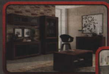
Szafy - komody