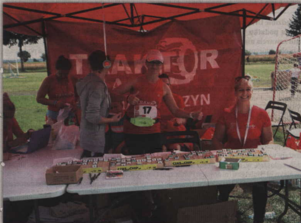
Traktor Team Gmina Kwidzyn od początku współorganizuje bieg plebiscytowy.