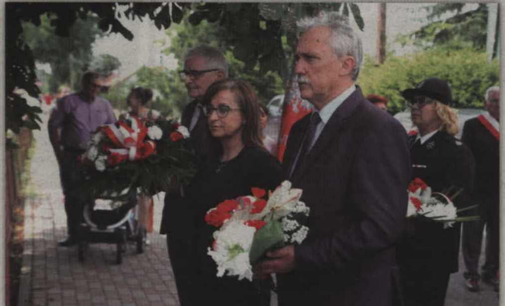
Senator Leszek Czarnobaj w towarzystwie prabuckich samorządowców oddał hołd pomordowanym mieszkańcom Janowa.

GMINA KWIDZYN. Uroczystą mszą świętą, odprawioną w kościele parafialnym pw. św. Jana Chrzciciela uczczono 99 rocznicę plebiscytu na Powiślu. Po mszy jej uczestnicy złożyli wiązanki kwiatów przy pomniku upamiętniającym mieszkańców Janowa, którzy zostali zamordowani przez Niemców w czasie II wojny światowej.