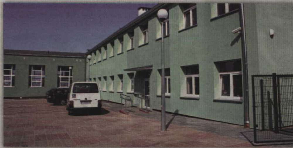
W miejsce likwidowanego Zespołu Szkół Specjalnych powstanie Szkoła Specjalna Przystosowująca do Pracy.

- Z dniem 31 sierpnia likwiduje się Zespół Szkół Specjalnych przy ulicy Ogrodowej. 1 września tworzy się nową jednostkę budżetową: Szkołę Specjalną Przystosowującą do Pracy. Likwidacja następuje z