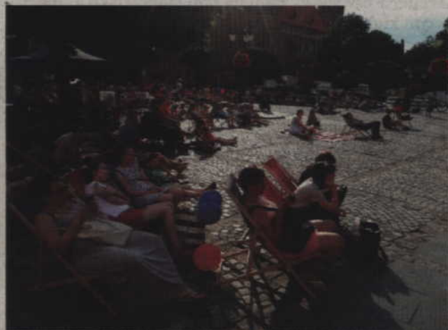
Seanse „Wakacyjnego kina na leżakach” odbywać się będą na placu Św. Jana Pawła II.