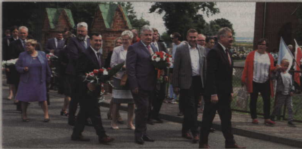
Na uroczystości upamiętniające plebiscyt w 1920 roku przyjechali też samorządowcy z terenu powiatu kwidzyńskiego.