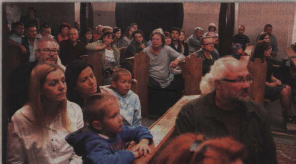
Zwiedzający podziwiali postępy prac przy renowacji rodowskiej świątyni.