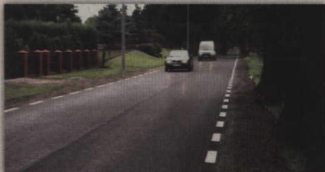
Na półtorakilometrowym odcinku drogi wojewódzkiej nr 522 pojawiła się nowa asfaltowa nakładka.

PRABUTY. Od lat prabucy samorządowcy próbują przekonać dyrekcję dróg wojewódzkich w Gdańsku, aby dokończyć remont drogi wojewódzkiej nr 522 na odcinku Prabuty – Pilichowo. Część drogi została już wyremontowana, ale do wykonania pozostał jeszcze 7-kilometrowy odcinek. Niedawno zmniejszył się on jednak o półtora kilometra po tym jak na przełomie czerwca i lipca, na odcinku od Prabut w kierunku Kołodziej, pojawiła się ekipa drogowców i położyła kilkucentymetrową asfaltową nakładkę.