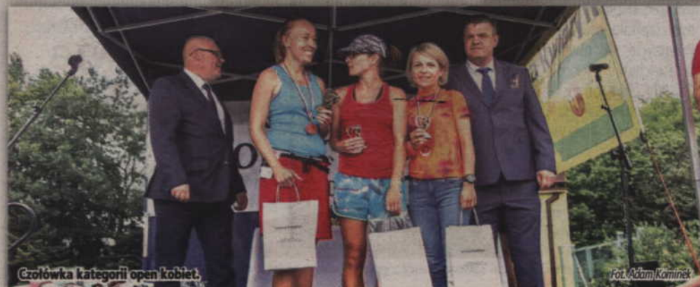
Czołówka kategorii open kobiet.