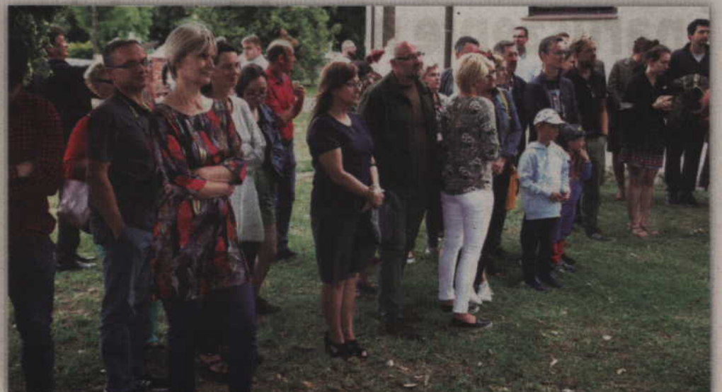
Uczestnicy podsumowania tegorocznego pleneru.