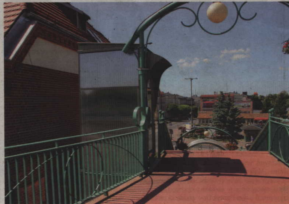
(jk) W najbliższym czasie powinien zostać rozwiązany problem wind przy kładce nad torami.

podczas ubiegłego lata. Wysokie temperatury, które coraz częściej przekraczają 30 stopni i utrzymują się przez wiele dni, także spowodowały wydłużenie kładki w sposób, który uniemożliwił korzystanie z windy.