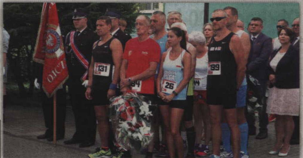
Sportowcy zanim wzięli udział w 3 Biegu Plebiscytowym najpierw uczcili pamięć mieszkańców Janowa, którzy stracili życie z rąk Niemców podczas II wojny światowej.