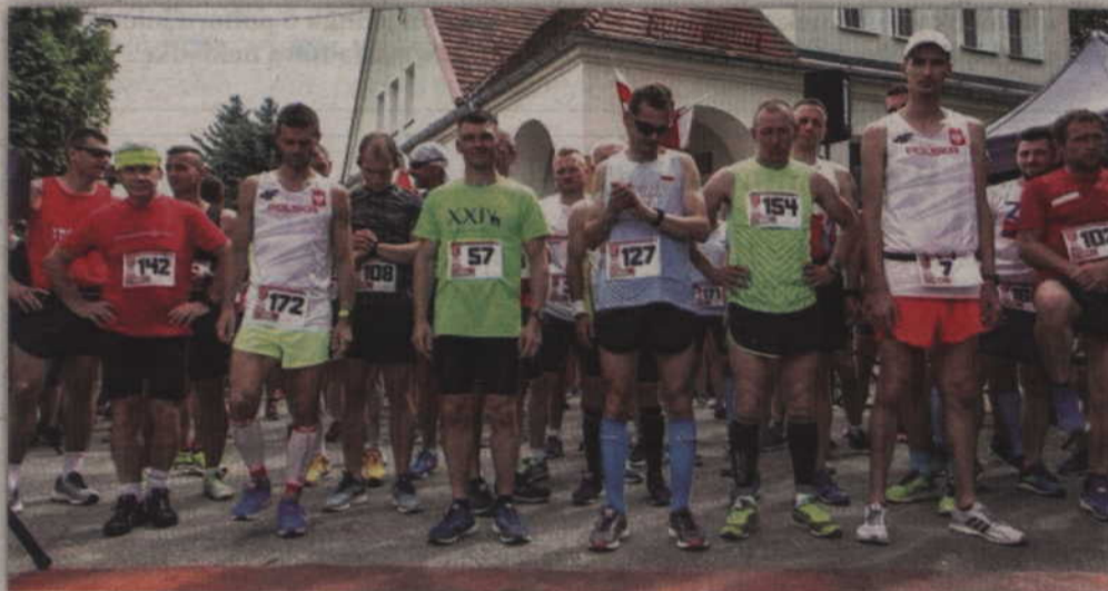
Na starcie trzeciego biegu stanęło 163 biegaczy.

Ważne wydarzenia historyczne związane z dziejami naszego państwa można obchodzić w najróżniejszy sposób. W gminie Kwidzyn, już po raz trzeci, rocznicę plebiscytu na Warmii, Mazurach i Powiślu uczczono w postaci biegu. Na starcie rywalizacji stanęło 163 kobiety i mężczyźni, a organizatorami biegu byli: Urząd Gminy Kwidzyn, Traktor Team Gmina