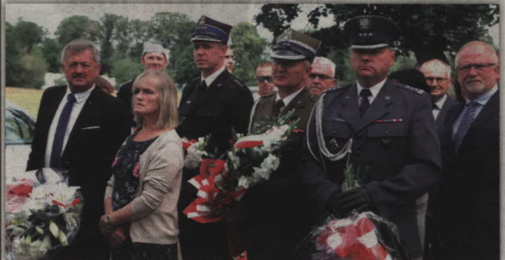
Na takiej uroczystości nie mogło zabraknąć przedstawicieli Wojska Polskiego, Policji i Staży Pożarnej.