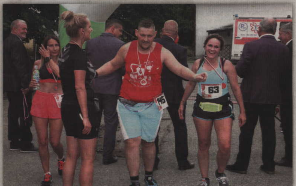
Chwila radości tuż po ukończeniu dystansu.