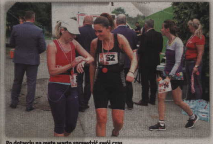
Po dotarciu na metę warto sprawdzić swój czas.