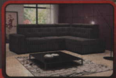
Meble tapicerowane na wymiar