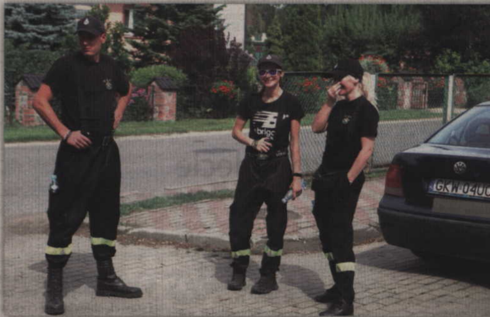
Na strażaków - ochotników zawsze można liczyć podczas dużych imprez sportowych.