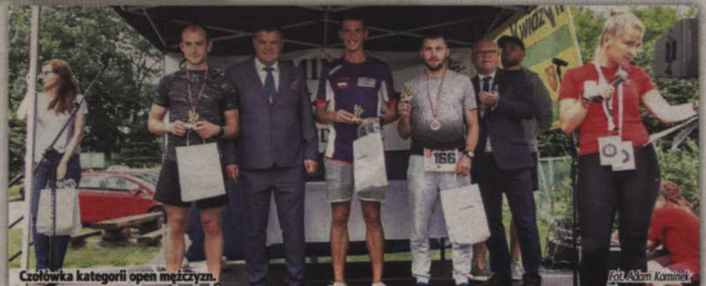
Czołówka kategorii open mężczyzn.