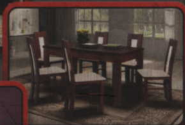
Stoły i krzesła