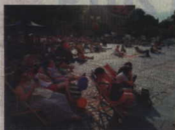
Seanse „Wakacyjnego kina na leżakach” odbywać się będą na placu Św. Jana Pawła II.