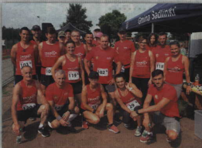
Sadliński bieg przełajowy na trwałe wpisał się w sportowy kalendarz imprez masowych w naszym powiecie.

Po raz czwarty po drogach gminy Sadlinki będą się ścigać miłośnicy biegania. Okazją do tego będzie otwarty bieg przełajowy, którego organizatorem jest sadliński urząd gminy. Tak jak w trzech pierwszych edycjach, w organizacji tej masowej imprezy sportowej będzie pomagać Traktor Team Gmina Kwidzyn. Biuro zawodów usytuowane na terenie szkolnego boiska będzie czynne w dniu zawodów, 17 sierpnia w godzinach 09.30-11.00. Trasa biegu wynosi 10 km (1 pętla) i prowadzi drogami leśnymi i asfaltowymi. Udział w biegu jest bezpłatny a limit uczestników w biegu głównym to 200 osób. W tym roku po raz drugi zostanie rozegrany marsz Nording Walking. Dla miłośników tej formy aktywnego spędzania