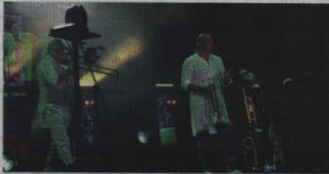
Golec uOrkiestra był gwiazdą w ubiegłym roku

W dniach 14-18 sierpnia Gniew stanie się stolicą muzyki gospel. Wszystko za sprawą kilkudniowego festiwalu, którego gwiazdami w tym roku będą Ania Dąbrowska oraz Anna Maria Jopek. Tegoroczne wydarzenie poświęcone jest pamięci Arethy Franklin, stąd też jednym z głównych punktów programu imprezy będzie koncert dedykowany tej amerykańskiej piosenkarce.