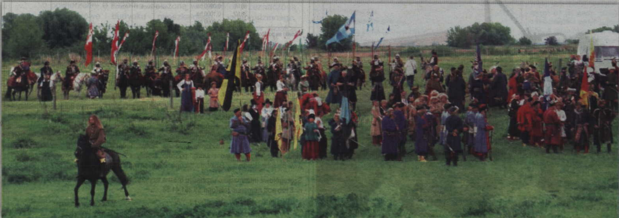
Huk armat i stukot kopyt niósł się daleko poza teren bitwy.