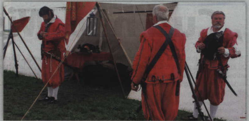
Żołnierze z wielu stron Europy i świata zjechali do Gniewu, by to właśnie tu pokazać swoje umiejętności fechtunku i zamiłowania do historii.