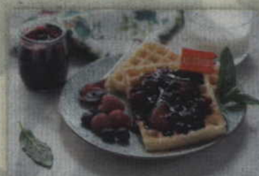
Nie ma to jak lato i gofry z taką frużeliną. Smak lata na wafelku.

Na początku zalewamy żelatynę 2 łyżkami wody i odstawiamy do napęcznienia. Następnie zabieramy się za owoce, mieszamy je cukrem w rondlu i stawiamy na średnim ogniu, podgrzewając do momentu, aż cukier się rozpuści. Dodajemy sok z cytryny i wodę wymieszaną z mąką ziemniaczaną. Całość energicznie i dokładnie mieszamy, zagotowujemy i zdejmujemy z palnika. Gotową, rozpuszczoną żelatynę dodajemy do gorących owoców i mieszamy, a następnie ponownie ustawiamy na małym ogniu i mieszamy, do momentu aż żelatyna całkowicie się rozpuści. Kiedy frużelina będzie miała już konsystencję żelu, nie pozostaje nam nic innego jak ją ostudzić i przelać do słoika. Po cierpliwym odczekaniu mikstura będzie gotowa do położenia jej na gofrach i delektowania się smakiem!