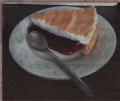
Śliwka z cytrynową nutą, na aromatycznym kruchym cieście. Lato to brzmi smacznie.

Zaczynamy od ciasta kruchego. Mąkę, sól, cukier puder, cukier waniliowy mieszamy i dodajemy do niego drobno pokrojone masło. Chwilę zagniatamy i dodajemy żółtka. Jeszcze chwilę wyrabiamy do uzyskania gładkiego ciasta. Gdyby się kleiło można lekko podsypać mąką. Następnie przekładamy do woreczka foliowego i chwilę chłodzimy w lodówce. Kiedy ciasto odpoczywa mamy czas na wydrylowanie śliwek zasypanie ich na chwilę cukrem ok. 2 łyżek. W garnku wysypujemy ok. 2 łyżek cukru karmelizując go, po czym szybko wrzucamy śliwki i gotujemy do konsystencji dżemu. Pod koniec gotowania dodajemy oba cukry i jeszcze chwilę trzymamy na palniku. Następnie ściągamy garnek i do gorącego, ale nie wrzącego dżemu dodajemy zawieszoną mąkę i wody, chwilę mieszamy i odstawiamy. Wyciągamy ciasto i w tortownicy na płasko z niskim brzegiem wylepiamy ciasto formę. Wstawiamy do piekarnika nagrzanego do 170 stopni C i pieczemy ok. 20/25 min do suchego patyczka i rumianego koloru. Ubijamy białka z cukrem do sztywności. Następnie przekładamy śliwki na upieczone ciasto i ubijamy bezę. Pieczemy kolejne ok. 20 min do zarumienienia się bezy. Odstawiamy ciasto do wystygnięcia. I gotowe. Smacznego.