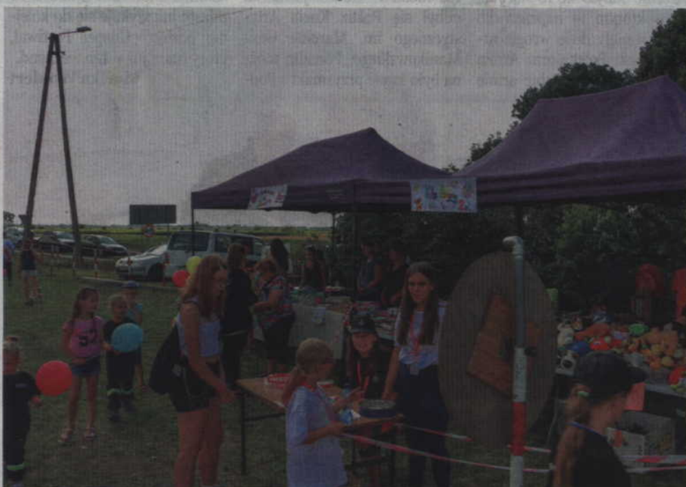
Dla dzieci przygotowano mnóstwo najróżniejszych atrakcji.