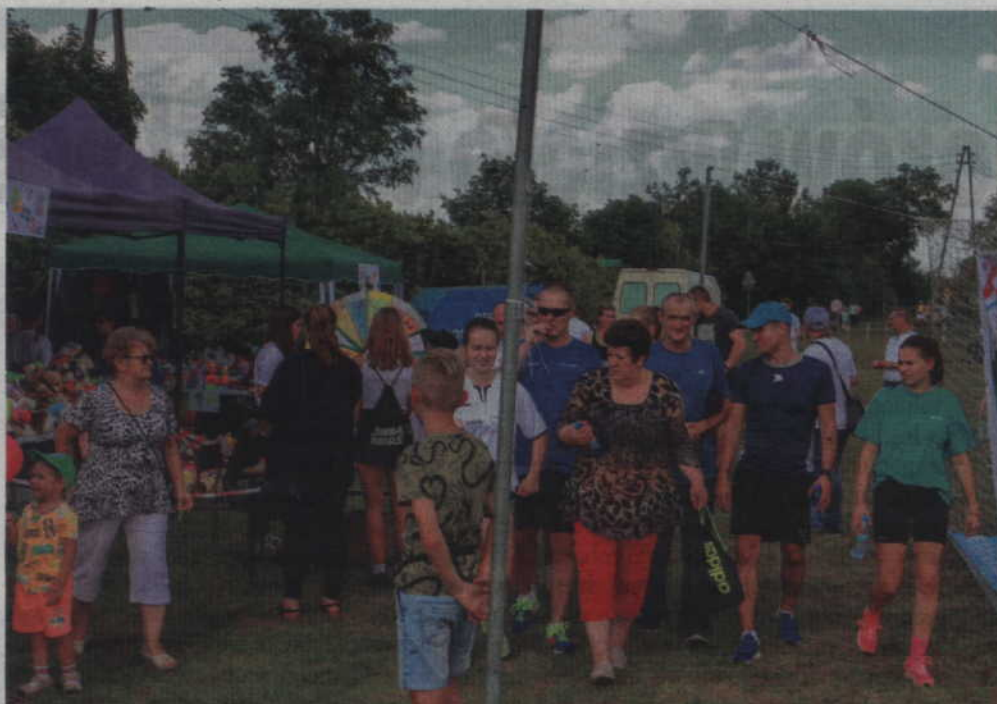
Na festynie były całe rodziny.