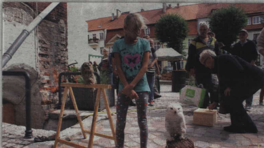
Kilka złotych na ochronę dzikich ptaków, aby zamian móc zrobić sobie zdjęcie z niezwykle rzadką sową śnieżną.

GNIEW. Po raz kolejny na nadwiślańskich łąkach w Gniewie odbyła się inscenizacja Bitwa pod Gniewem 1626. Jest ona zrealizowana w ramach odbywającego się wydarzenia Vivat Vasa. Równoległe na staromiejskim rynku odbywał się drugi Jarmark Rzemiosł, w tym pokaz Kucia Kowalstwa Artystycznego im. Marcina Gasa Manikowskiego.