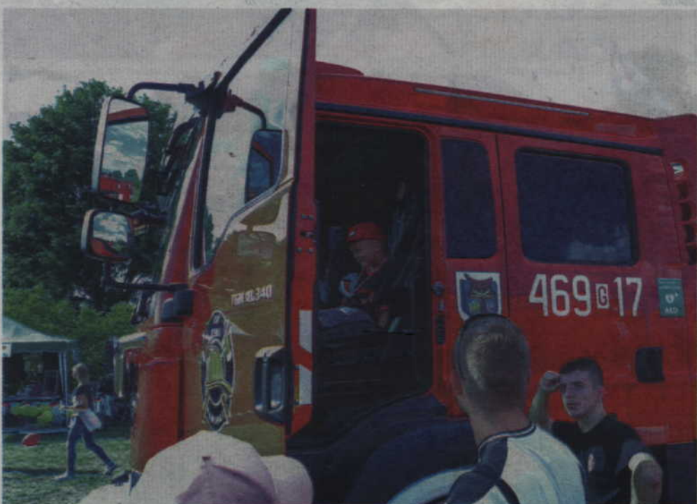
Jeśli festyn organizują strażacy to musi być również strażacki wóz bojowy.