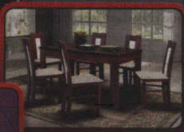
Stoły i krzesła