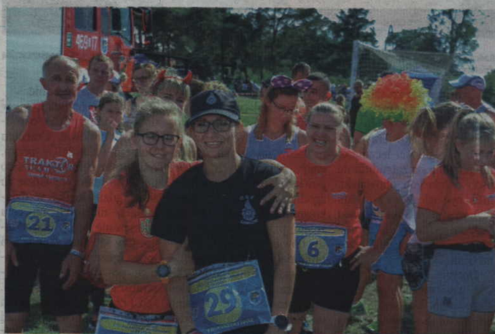
Uczestnicy biegu przełajowego wsparli akcję charytatywną.