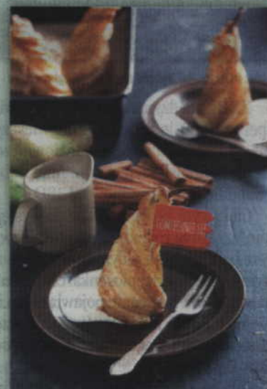
Polska gruszka otulona paskami z ciasta francuskiego.

Na początek mieszamy sok jabłkowy z wodą, sokiem z limonki i cytryny, słodzimy łyżką cukru i przelewamy do rondla. Następnie obieramy gruszki, odcinamy spód i ustawiamy pionowo w gotującym się syropie i zostawiamy na około 5-10 minut. W międzyczasie nagrzewamy piekarnik na 180 stopni (bez termoobrotu). Wyciągamy z lodówki opakowanie ciasta francuskiego, rozwijamy i wycinamy paski o grubości 1 cm. Wycięte paski smarujemy z jednej strony białkiem i panierujemy w cukrze cynamonowym wysypanym na deskę. Kiedy nasze gruszki już są ugotowane, również smarujemy je białkiem i owijamy paskami ciasta od dołu, do góry. Przekładamy gruszki do formy obłożonej pergaminem i pieczemy około 25 minut w nagrzanym piekarniku, do momentu, aż ciasto będzie rumiane. Kiedy już to zrobimy, możemy zabrać się za przygotowanie sosu. Zaczynamy od utarcia żółtek z cukrem na gładką masę. Następnie do garnka wlewamy mleko i śmietanę, dodajemy ziarenka z 1 laski wanilii i podgrzewamy na średnim ogniu, uważając, aby całość się nie zagotowała. Ciepły płyn wlewamy cienkim strumieniem do żółtek i całość ubijamy trzepaczką. Wymieszany krem ponownie przelewamy do garnka i na małym ogniu doprowadzamy sos do pożądanej konsystencji, pamiętając o ciągłym ubijaniu. Na koniec upieczone gruszki polewamy sosem i możemy w końcu w pełni delektować się smakiem gruszkowego deseru.