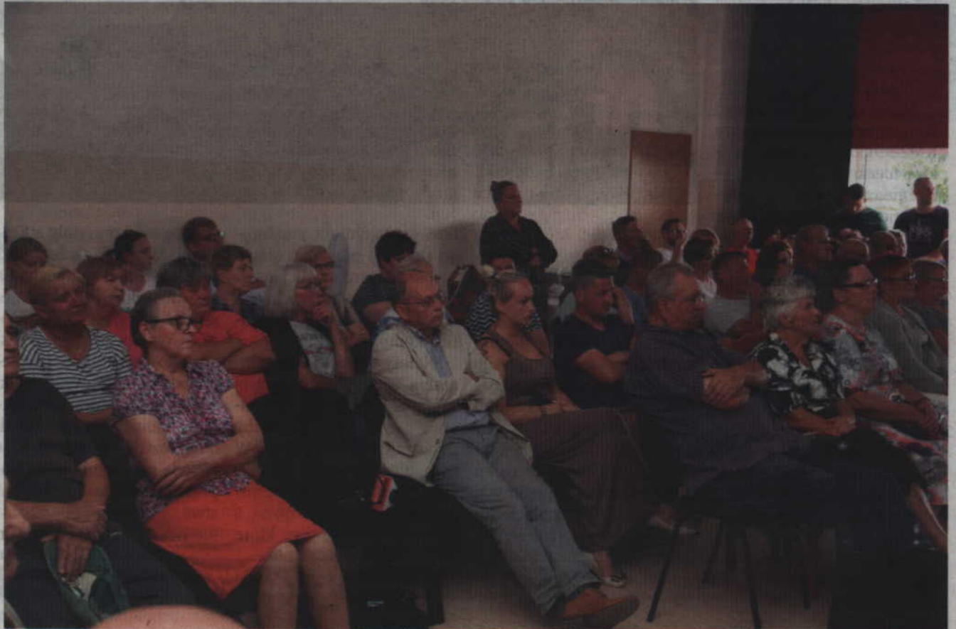
Debacie o sytuacji w służbie zdrowia przysłuchiwali się liczni mieszkańcy.