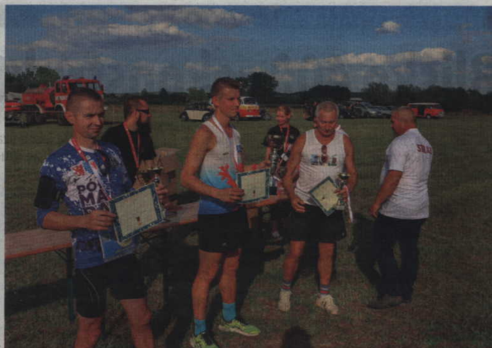
Zwycięzcy biegu przełajowego.