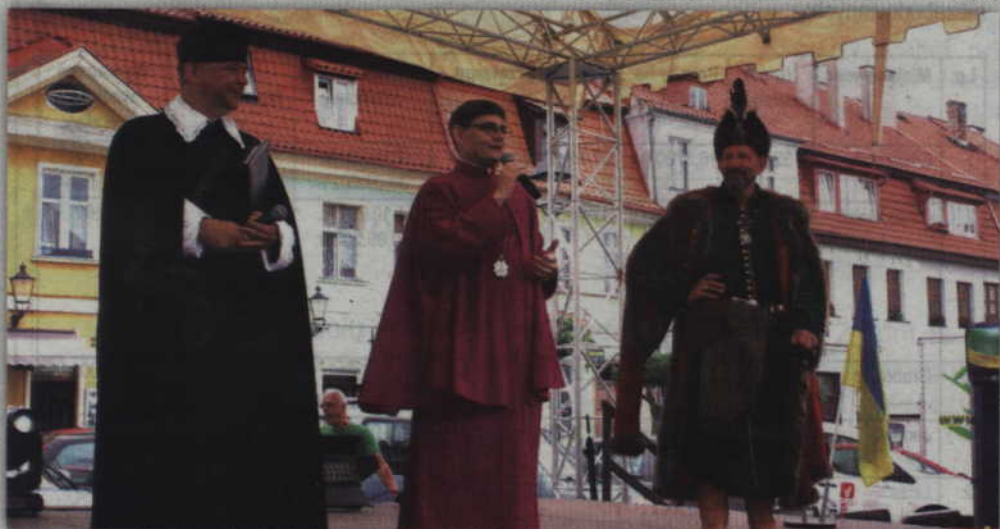
Zrewitalizowane Stare Miasto zachęca do odwiedzin gości, a tych gniewianie zawsze witają życzliwie.