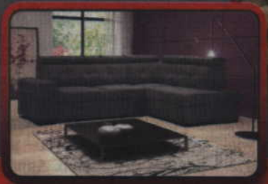
Meble tapicerowane na wymiar