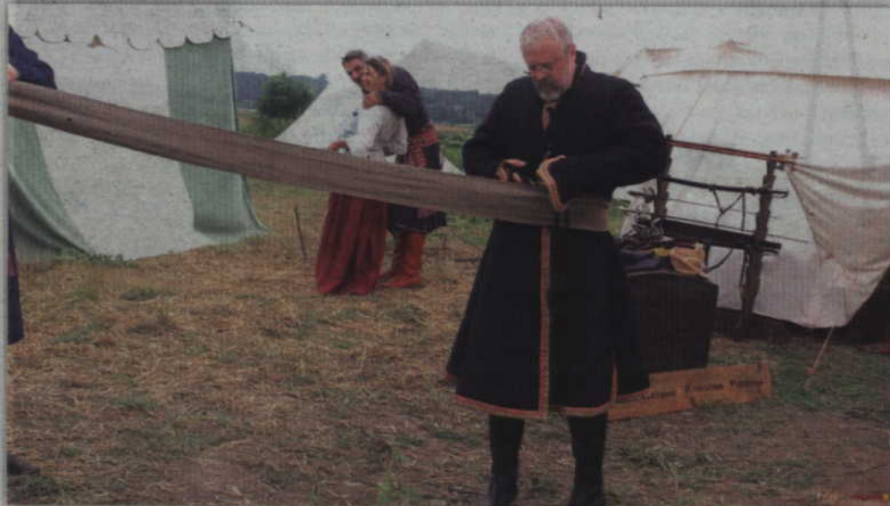
Nowoczesne pasy słuckie choć już nie tak długie jak dawniej, to przy ich zakładaniu nadal wymagają pomocy kolegów z obozu.