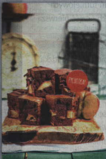
Salceson na słodko. Dlaczego by nie?

Dla miłośników jabłek mamy coś specjalnego. Niech nazwa Was nie myli. Salceson to nie tylko wyrób mięsny. Może to być idealny pomysł na deser – bezmięśny oczywiście. Jak przygotować czekoladowy salceson z jabłkami? To proste! Zaczynamy od nagrzania piekarnika do 180 stopni (bez termoobrotu). Następnie wykładamy blachę papierem do pieczenia. Wszystkie składniki dokładnie mieszamy, z wyjątkiem jabłek. Gotowe i wymieszane ciasto przekładamy na formę i dodajemy pokrojone kawałki jabłek. Ciasto pieczemy około 40 minut i gotowe! Smacznego!