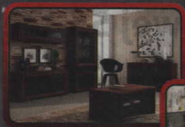
Szafy - komody