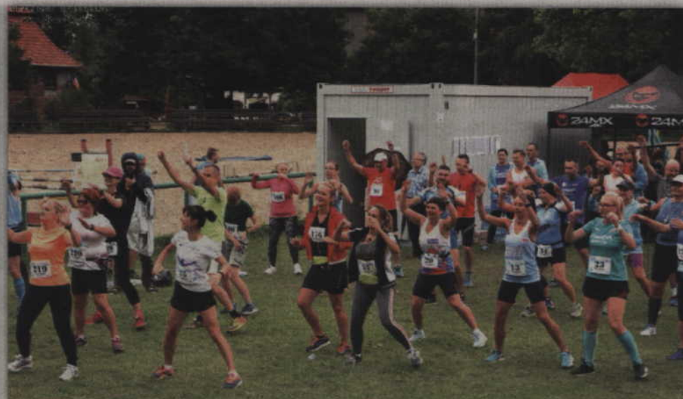
Wspólna rozgrzewka przed biegiem to nie tylko obowiązek ale fajna zabawa.