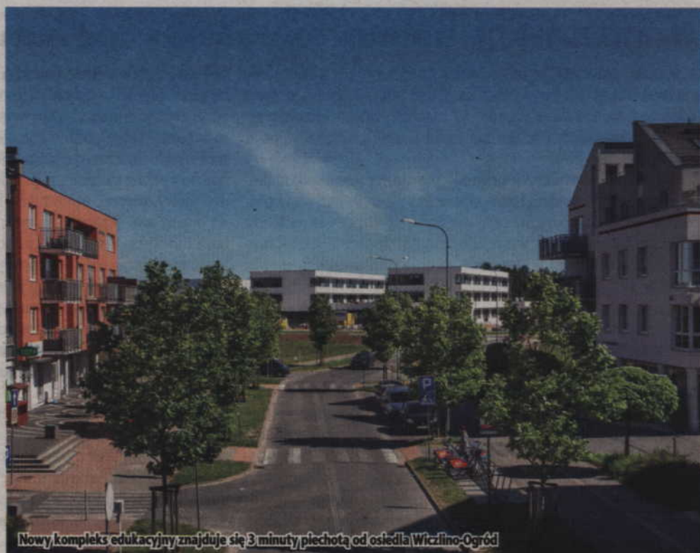
Nowy kompleks edukacyjny znajduje się 3 minuty piechotą od osiedla Wiczlino-Ogród

Grupa Inwestycyjna Hossa S.A. od 30 lat z sukcesem realizuje projekty deweloperskie w Trójmieście. Buduje kompleksowo nowoczesne osiedla wraz z całą infrastrukturą, pamiętając o zasadach zrównoważonego rozwoju dzielnic i potrzebach społecznych mieszkańców. Projektuje i realizuje nowoczesne, funkcjonalne obiekty biurowe, usługowe i centra handlowe.