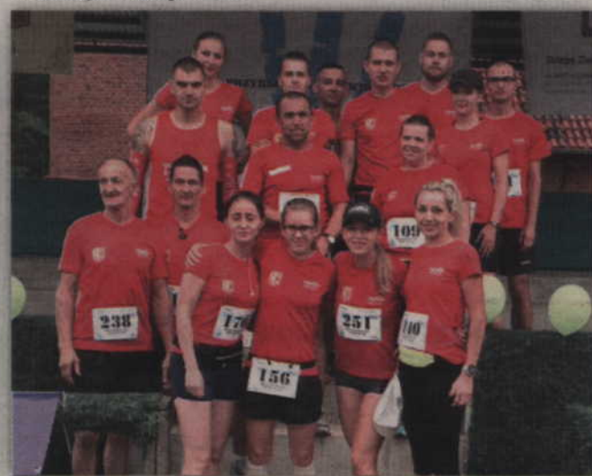
Traktor Team Gmina Kwidzyn licznie zameldowali się na kwidzyńskiej pionie.