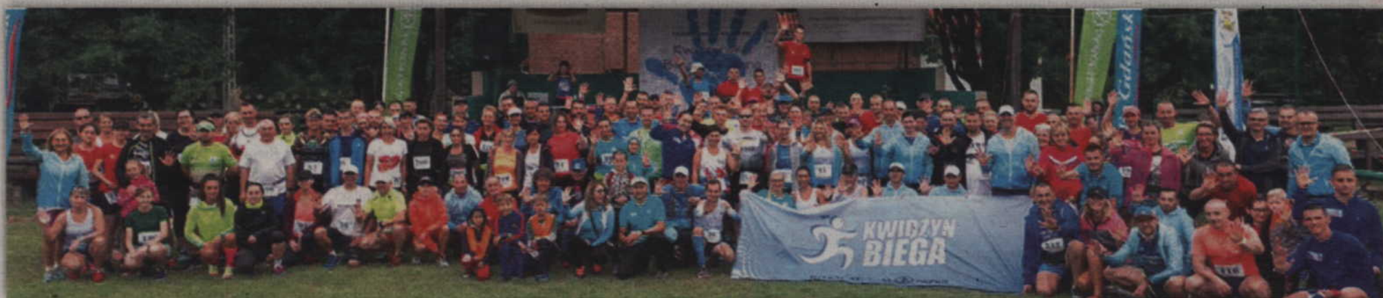
Wspólne zdjęcie biegaczy to fajna pamiątka.