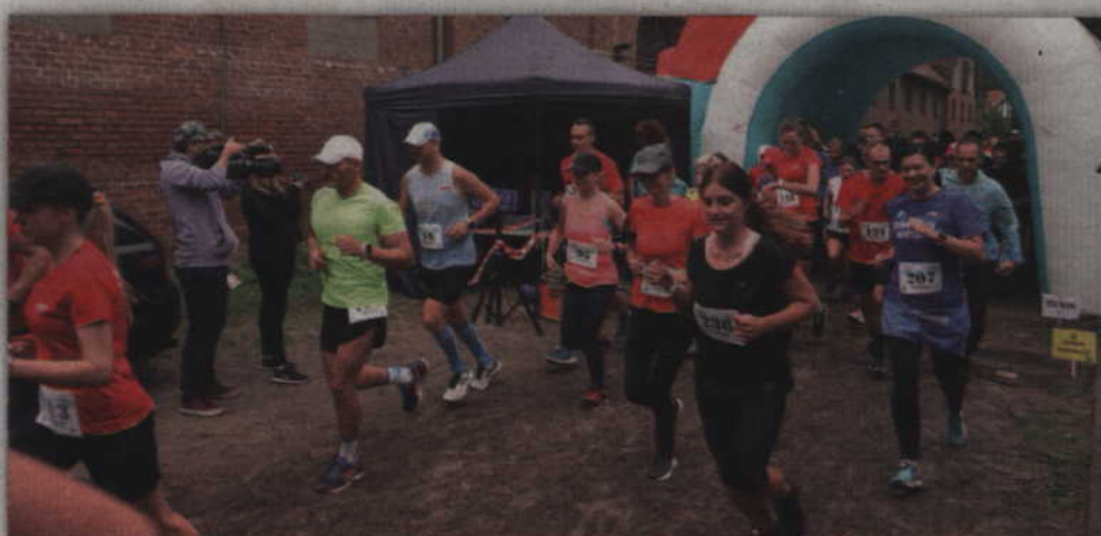
Na linii startu stało 233 biegaczy i biegaczek.