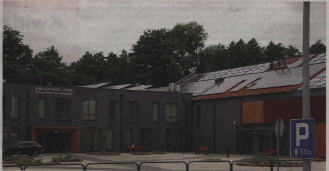
Nadzwyczajne Zgromadzenie Wspólników Kwidzyńskiego Parku Przemysłowo-Technologicznego w Górkach zdecyduje o dalszych kierunkach rozwoju spółki.

ta” S.A. w Białych Błotach (woj. Kujawsko-pomorskie). Inwestycja zakończyła się 30 kwietnia 2015 roku. Budowa infrastruktury Kwidzyńskiego Parku Przemysłowo-Technologicznego z Centrum Energii Odnawialnej uzyskała dofinansowanie ze środków unijnych, w ramach Regionalnego Programu Operacyjnego dla województwa pomorskiego. Wszystkie obiekty, które powstały na terenie parku zostały zrealizowane w standardzie „inteligentnych budynków”. Kompleks składa się z kilku części, w tym nowoczesnego centrum konferencyjno-szkoleniowego, służącego między innymi do prezentacji osiągnięć technologicznych lub naukowych przez firmy, które prowadzą lub będą prowadziły działalność. W ramach parku działa Centrum Energii Odnawialnej, które wspiera rozwój energetyki odna-