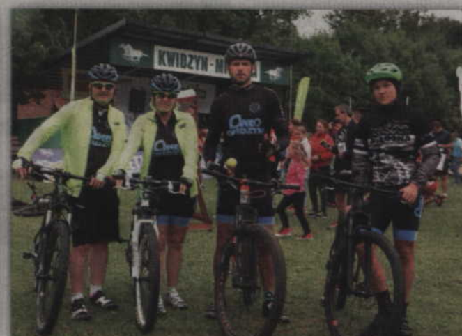
Na rowerzystów z Cyklo Kwidzyn zawsze można liczyć przy organizacji biegowych zawodów.