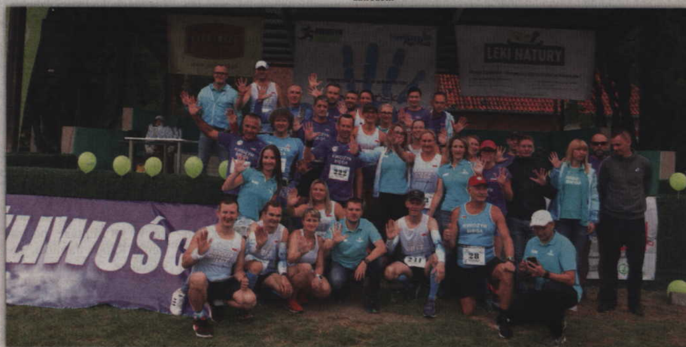
Kwidzyn Biega - organizatorzy biegu.