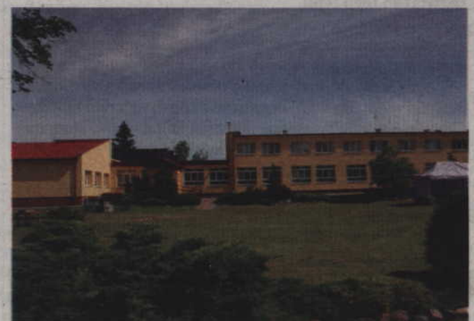
Wymieniony zostanie piec w budynku Specjalnego Ośrodka Szkolno-Wychowawczego w Barcicach, w gminie Ryjewo

mocy. Piec na ścinki nie miał takiej możliwości. W wymianie pieca widzimy więc także możliwość oszczędności związanej z kosztami ogrzewania budynku ośrodka. Poza tym moc pieca na ścinki nie była dostosowana do budynków. Nie chodzi o kubaturę, ale ich ocieplenie. Piec został zainstalowany przed dociepleniem budynku. Obecnie zapotrzebowanie na energię cieplną