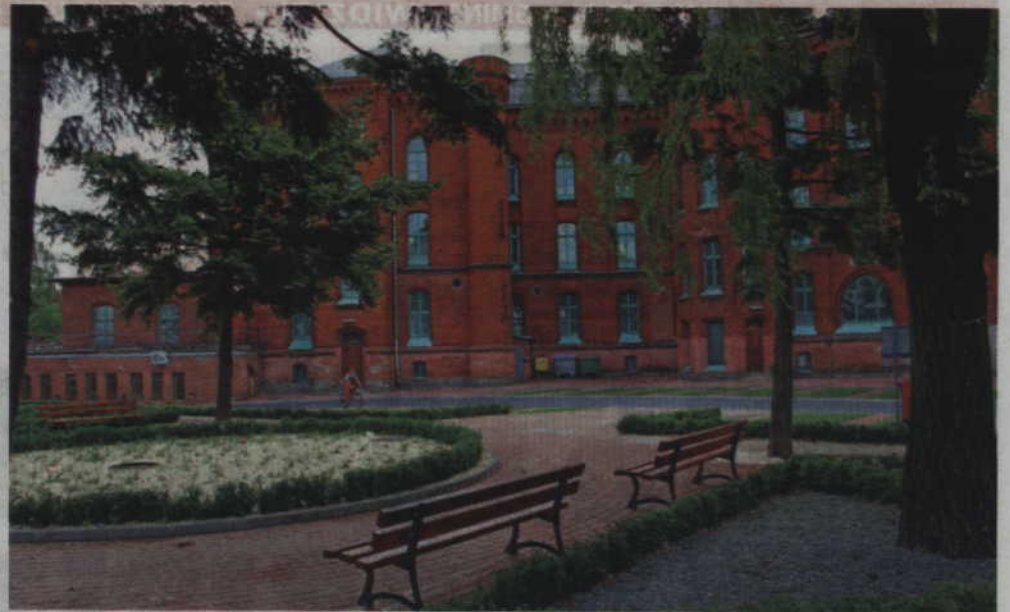
Powiatowy Nadzór Budowlany przeprowadził się do pomieszczeń w pokoszarowym budynku przy ul. Grudziądzkiej 30.

Koszt remontu pomieszczeń na potrzeby Powiatowego Inspektoratu Nadzoru Budowlanego to ponad 100 tys. zł. Mimo że nadzór budowlany będzie mieścił się na najwyższej kondygnacji gmachu przy ul. Grudziądzkiej, z dostępem do biur nie będzie problemu, gdyż w budynku znajduje się winda