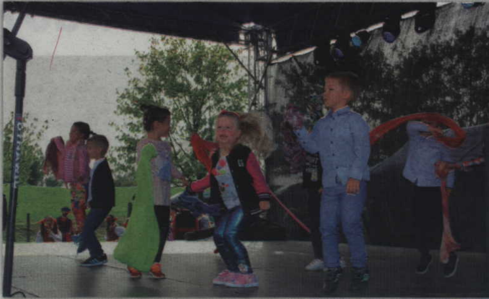
Na scenie nie mogło zabraknąć utalentowanych, najmłodszych mieszkańców gminy Kwidzyn.