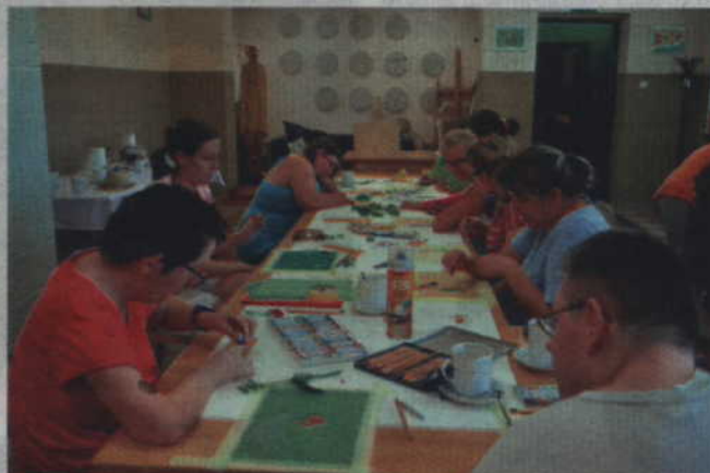
Pracownię „Podgórze” w Podzamczu odwiedzili także uczestnicy kwidzyńskiego Warsztatu Terapii Zajęciowej z siedzibą w Górkach (gmina Kwidzyn).