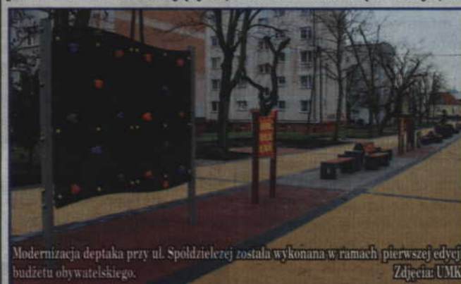
Modernizacja deptaka przy ul. Spółdzielczej została wykonana w ramach pierwszej edycji budżetu obywatelskiego.

wartych uwagi. Teraz komisja dokonuje weryfikacji formalno-prawnej. Niektóre wymagają poprawki. Projekt nie może być realizowany przez wnioskodawcę, a takie wnioski się pojawiły i wymagają poprawienia - mówi Andrzej Krzysztofiak, burmistrz Kwidzyna.