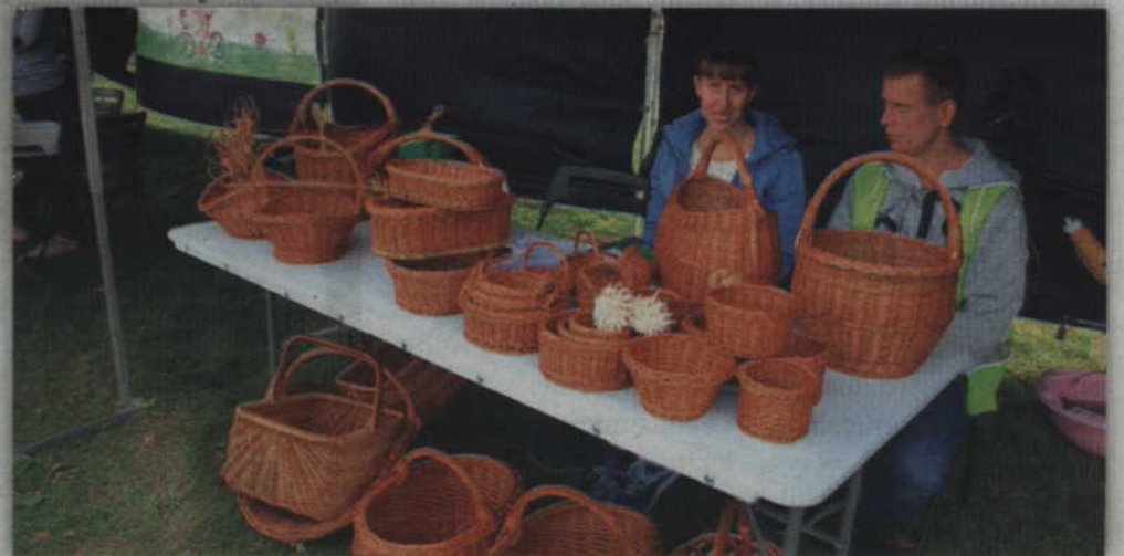
Pracownia wikliniarska kwidzyńskiego Warsztatu Terapii Zajęciowej.