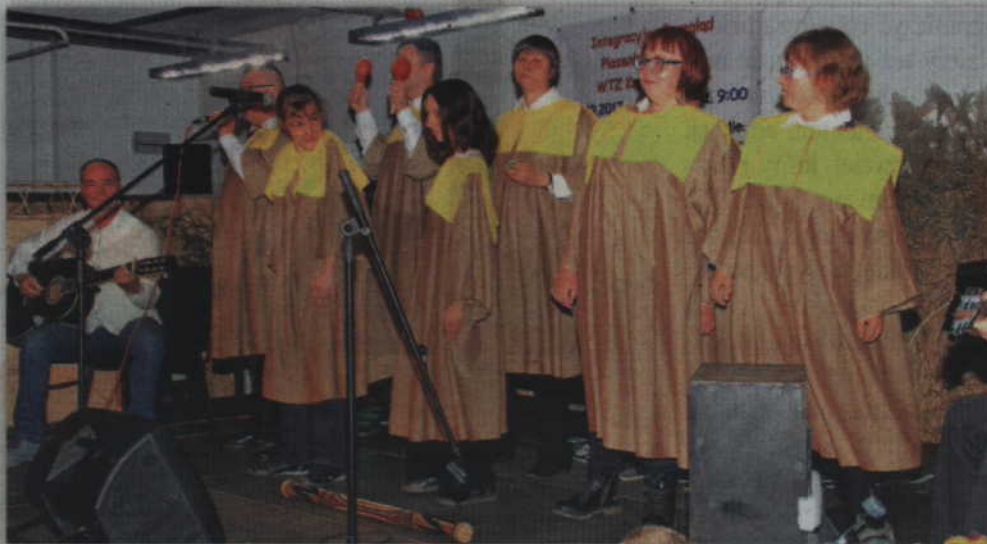
Już w najbliższy piątek (20 września) o godz. 10.00 w Kwidzińskim Parku Przemysłowo-Technologicznym odbędzie się Integracyjny Przegląd Piosenki Religijnej.

- Nasz projekt uzyskał dofinansowanie ze środków Starostwa Powiatowego w Kwidzynie, w ramach wspierania działań w zakresie integracji oraz szeroko rozumianej rehabilitacji zmierzającej do ograniczenia skutków niepełnosprawności. To kolejny rok, w którym możemy liczyć na wsparcie samorządu powiatu. Wspierają nas także zarząd Kwidzińskiego Parku Przemysłowo-Technologicznego, który po raz kolejny udostępnił nam pomieszczenia do organizacji naszej imprezy oraz Gminny Ośrodek Kultury, który udostępnia scenę i zadba o