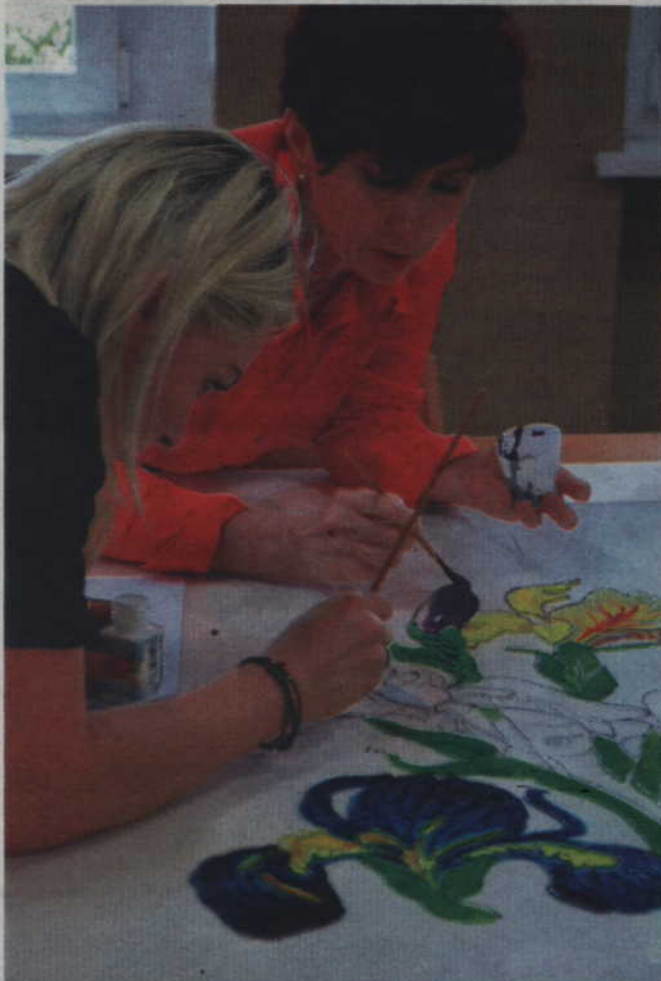
Warsztaty dla dzieci i młodzieży ze szkół podstawowych oraz dla dorosłych mieszkańców gminy inspirowane twórczością Stanisława Wyspiańskiego