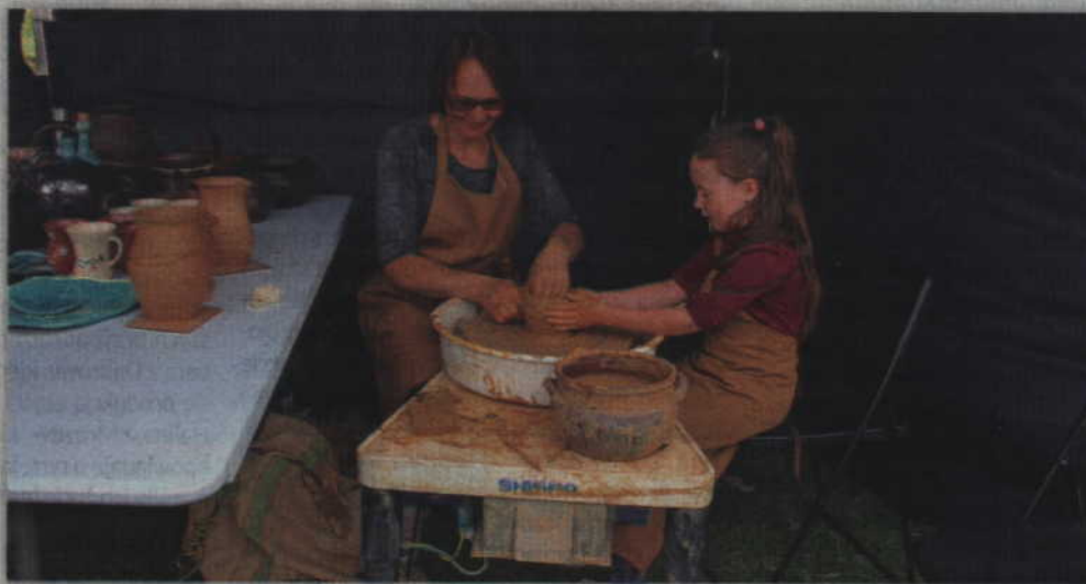
Można było spróbować swoich sił w tzw. ginących zawodach takich jak chociażby garncarstwo.