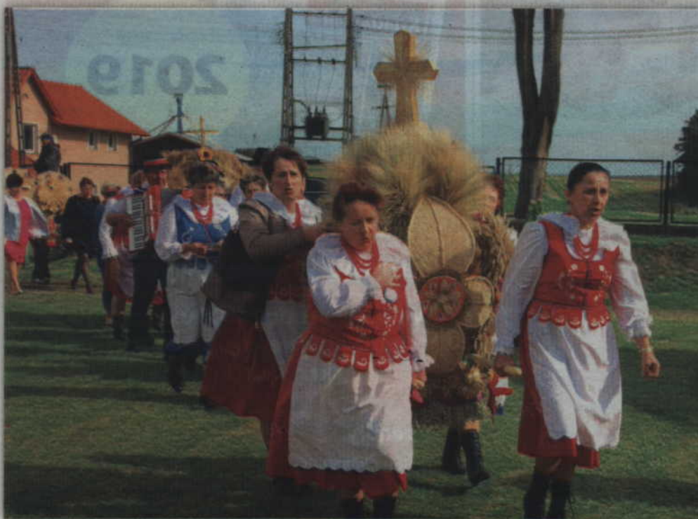
Panie z Ludowego Zespołu Śpiewaczego Wesoła Gromadka z Tychnowy niosą zwyciężki wieńiec.