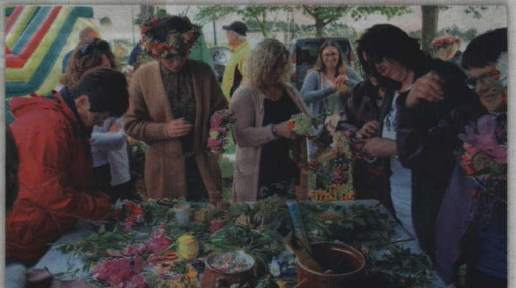
Florystyczne warsztaty, czyli kreatywne Tychnowy