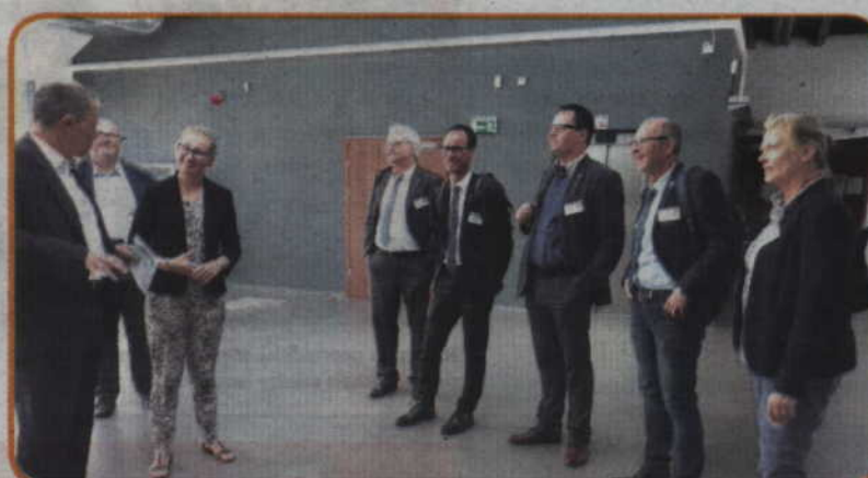
Zwiedzanie Kwidzyńskiego Parku Przemysłowo - Technologicznego w Górkach