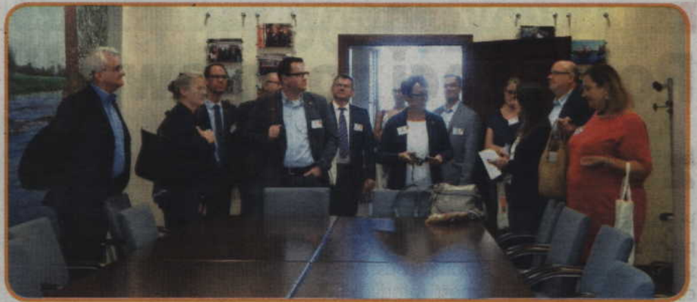
Wizyta w sali partnerstwa Powiatu Kwidzyńskiego i Powiatu Osterholz