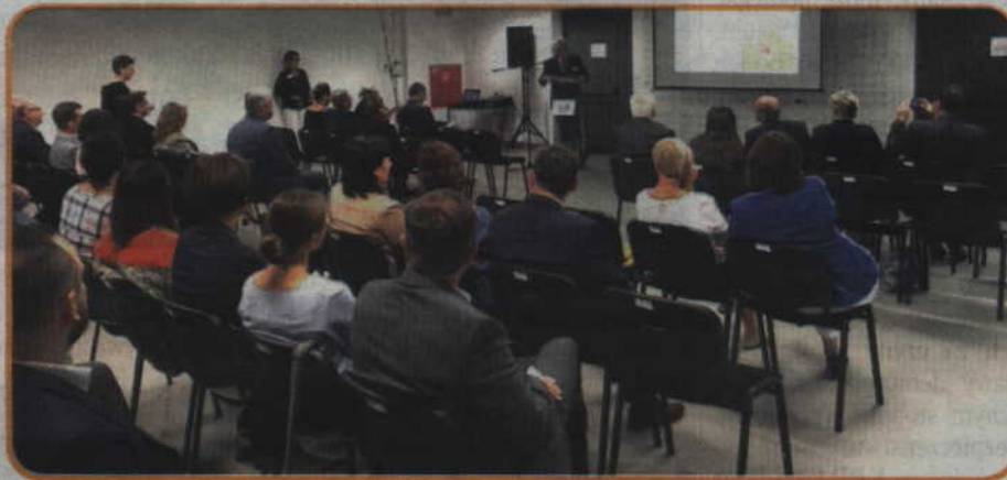
Konferencja pn. „Zarządzanie ochroną środowiska na poziomie powiatów w Niemczech”