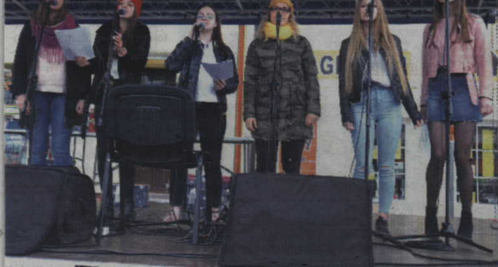
Biegi miały charakter pikniku. Na zdjęciu grupa wokalna działająca w PCKiS.