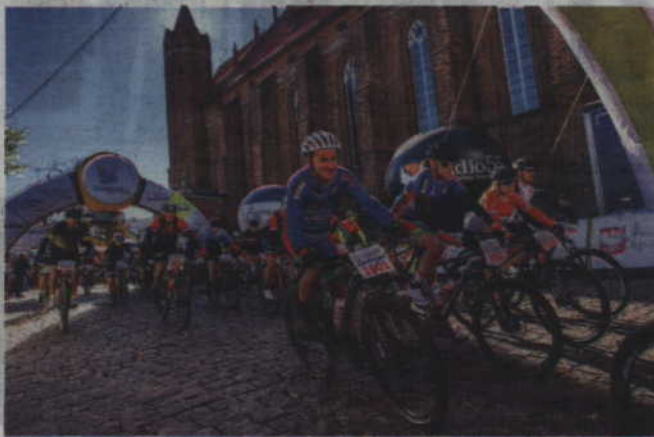
Uczestnicy będą mogli wybrać jeden z trzech dystansów: Mini (42km), Medio (65 km) i Grand Fondo (88 km).