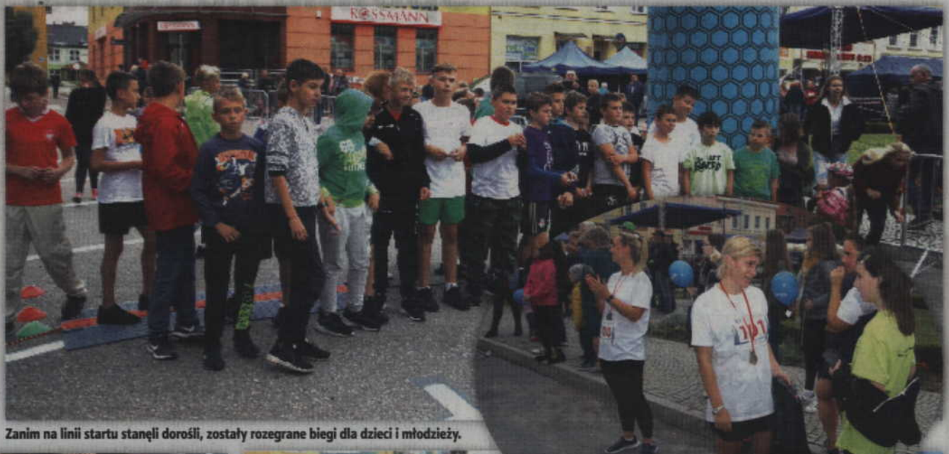
Zanim na linii startu stanęli dorośli, zostały rozegrane biegi dla dzieci i młodzieży.