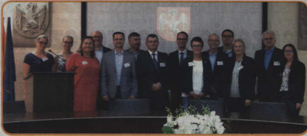
Spotkanie robocze w Starostwie Powiatowym w Kwidzynie