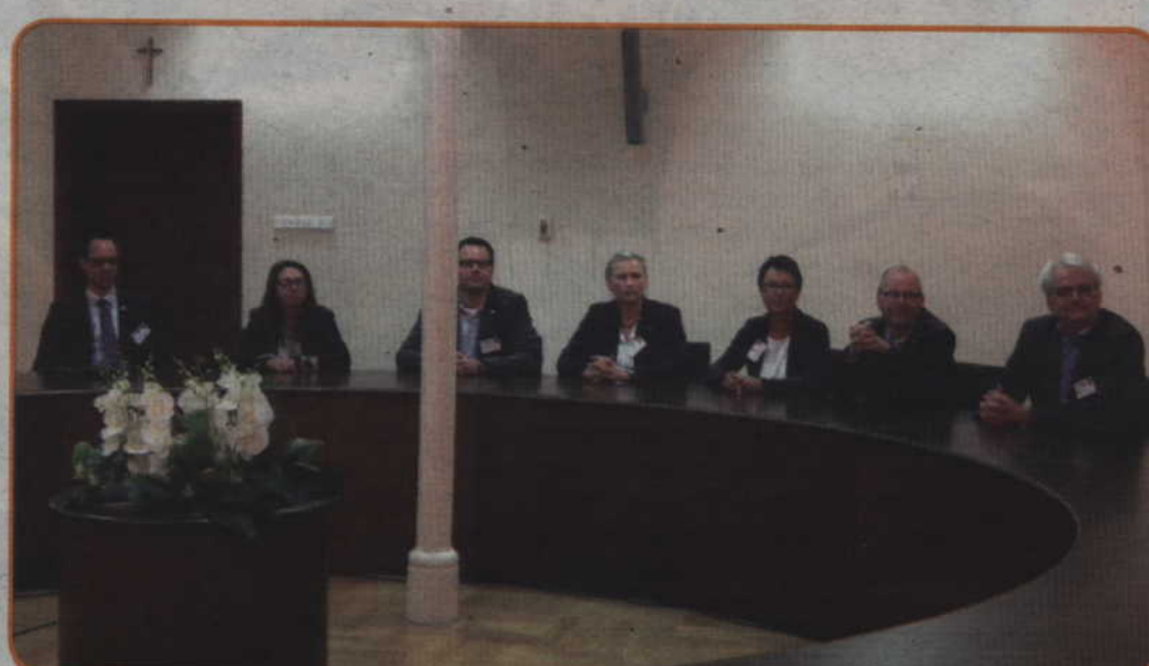
Spotkanie robocze w Starostwie Powiatowym w Kwidzynie