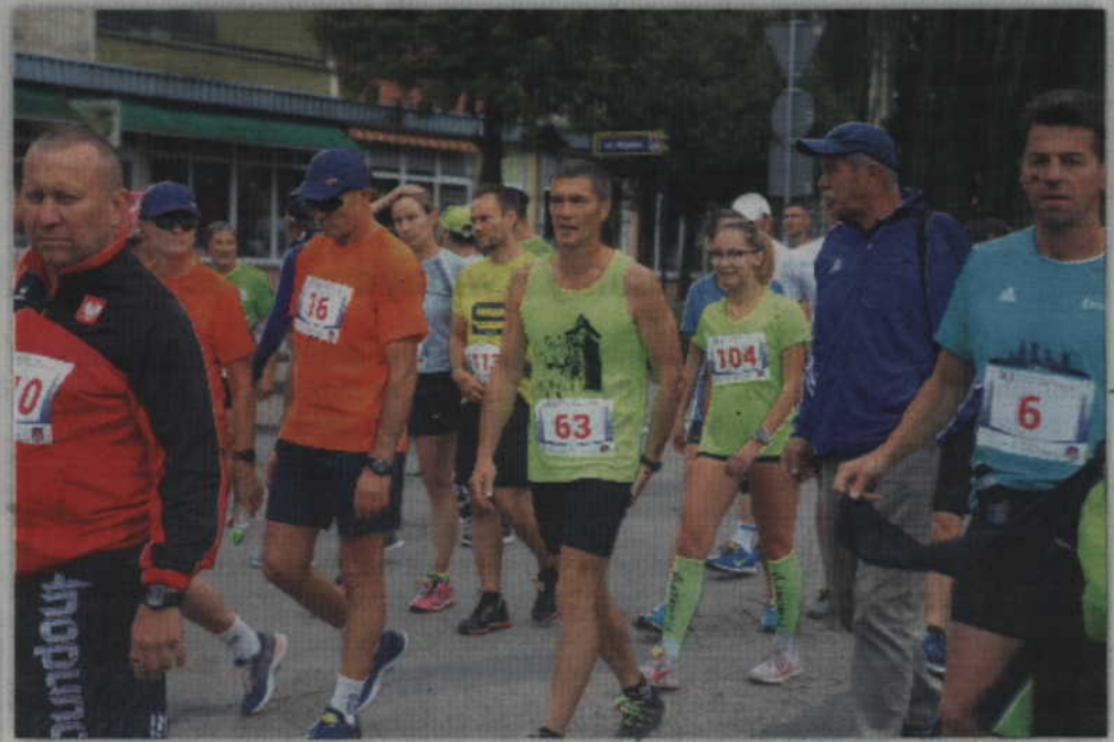
Do startu pozostało kilkadziesiąt sekund.