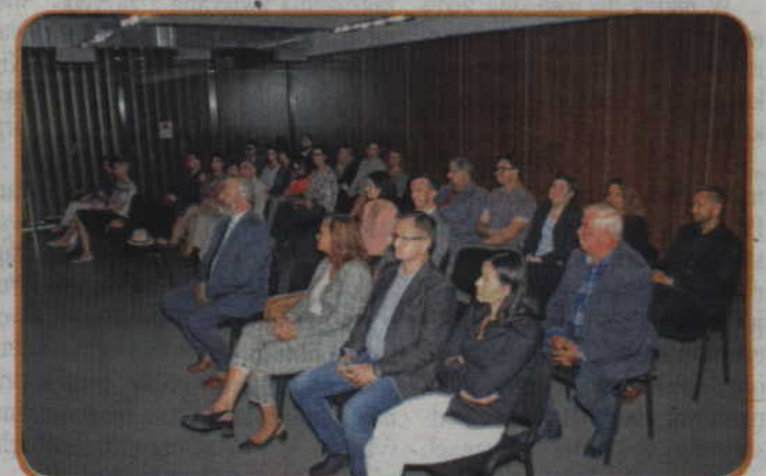
Konferencja pn. „Zarządzanie ochroną środowiska na poziomie powiatów w Niemczech”