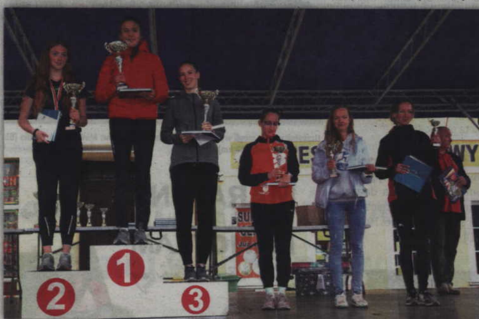
Zwycięzynie w kategorii open kobiet, tegoroczne triumfatorki XI Liwa Cup.