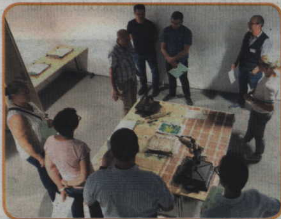
Warsztaty papieru czerpanego w Stowarzyszeniu Eko - Inicjatywa