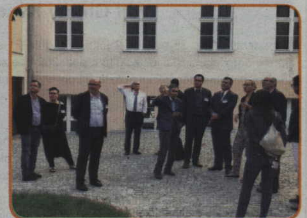
Prezentacja inwestycji Zespołu Szkół nr 2 w Kwidzynie