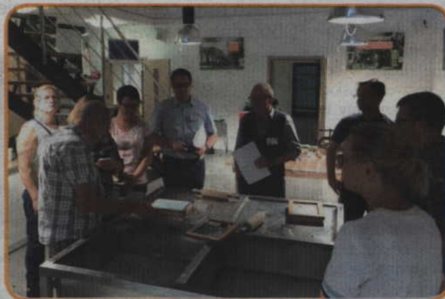
Warsztaty papieru czerpanego w Stowarzyszeniu Eko - Inicjatywa