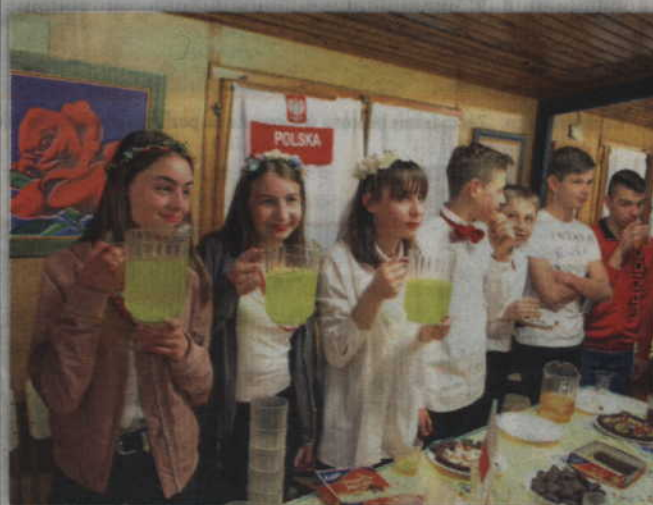
W ramach poprzedniej edycji programu młodzież z Kwidzyńskich Szkół Społecznych wyjechała między innymi do Hiszpanii.

Projekt będzie realizowany do sierpnia 2021 roku. (jk)