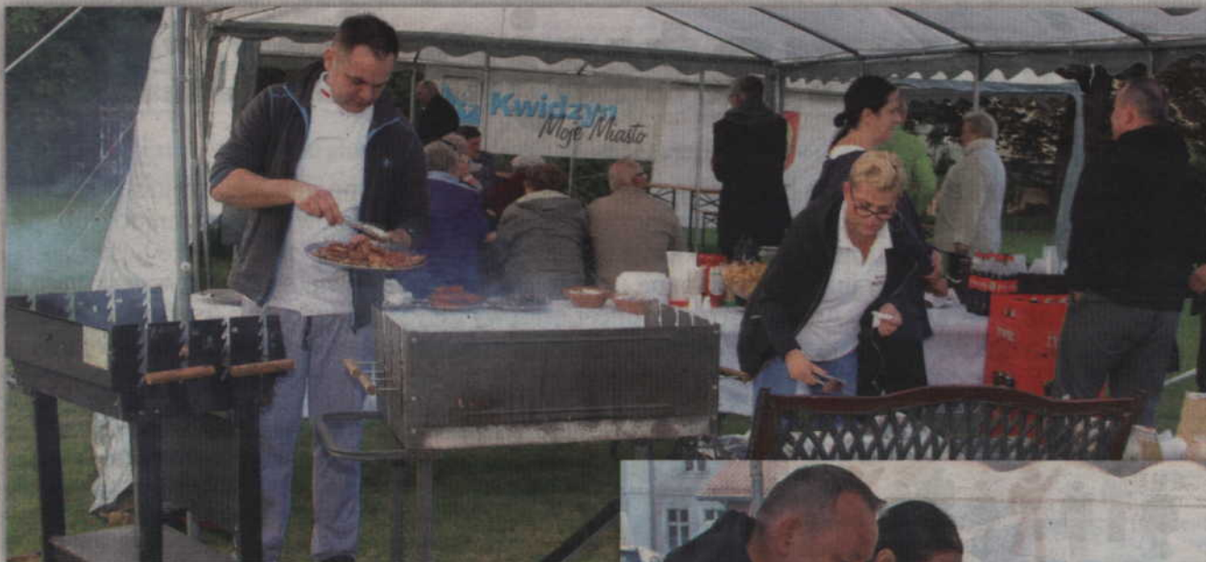
Wszyscy goście mogli bawić się nie tylko podczas konkursów, ale także przy muzyce.