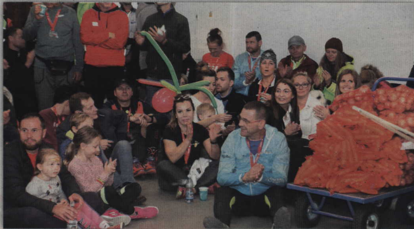
W tym roku wręczenie podsumowanie biegu odbyło się w sali konferencyjnej kwidzińskiego parku.