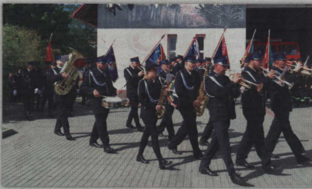
Taką rocznicę warto uczcić.

- Zawsze bałem się, że kiedy rozpoczniemy wielki spektakl przyjdzie taki moment, kiedy zawyje syrena i opuścicie mnie. Raz przeżyłem drenie serca, kiedy jeden z druhow przyszedł do mnie i powiedział: panie kasztelanie, wybac, ale służba ważniejsza. Pamiętam, że w ostatnim odruchu jeszcze jego przemysłowości i mądrości zostawił mi gaśnicę. Kiedy wasz wóz strażacki ruszył zostałem z tą gaśnicą myśląc o tym, żeby-