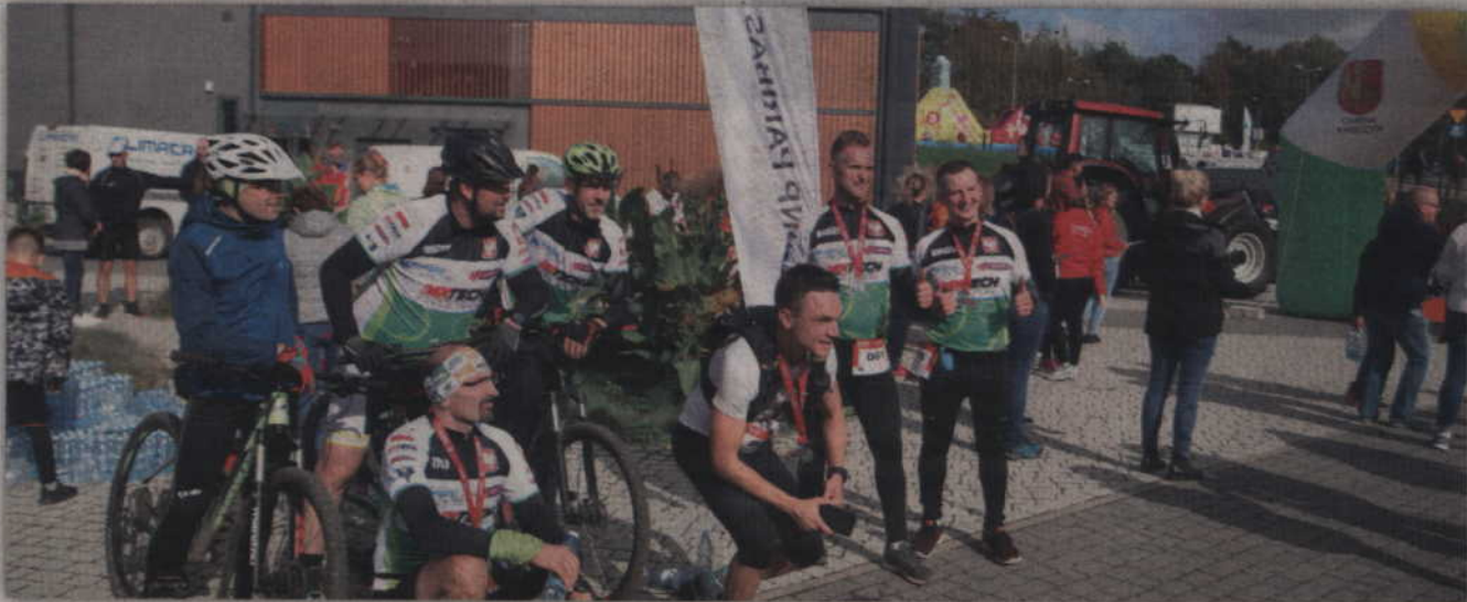
Na kwidzyńskich rowerzystów podczas biegowych imprez zawsze można liczyć.