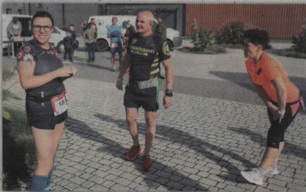
Jeszcze tylko kilka rozciągnięć mięśni nóg i można rozpocząć bieg.