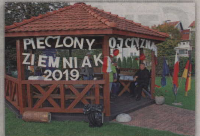
Nie mogło zabraknąć poczęstunki dla wszystkich gości.