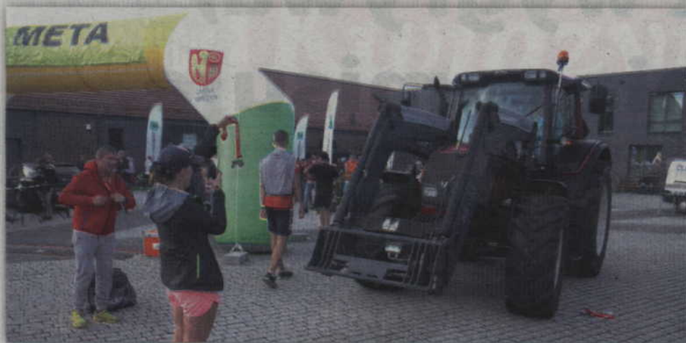
Pamiątkowe zdjęcie z prawdziwym traktorem w tle.