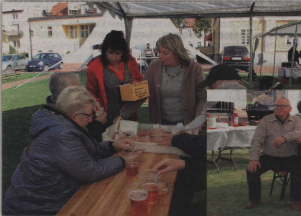
Członkowie i sympatycy Towarzystwa Kulturalnego Ludności Niemieckiej „Ojczyzna” spotkali się podczas „Święta Pieczonego Ziemniaka” w Kwidzynie.

Święto Pieczonego Ziemniaka organizujemy już od wielu lat. Zapraszamy nie tylko członków i sympatyków towarzystwa, ale także naszych przyjaciół, którzy wspierają nas przez cały rok. Cieszę się, że co roku w imprezie bierze udział tak wielu gości. W tym roku przyjechali także przedstawiciele mniejszości z Grudziądza, Gdańska oraz ze Sztumu. Jak zawsze przygotowaliśmy różnego rodzaju konkursy, w których oczywiście główną rolę odgrywał ziemniak. Był także konkurs dla samorządowców, którzy musieli wykazać się