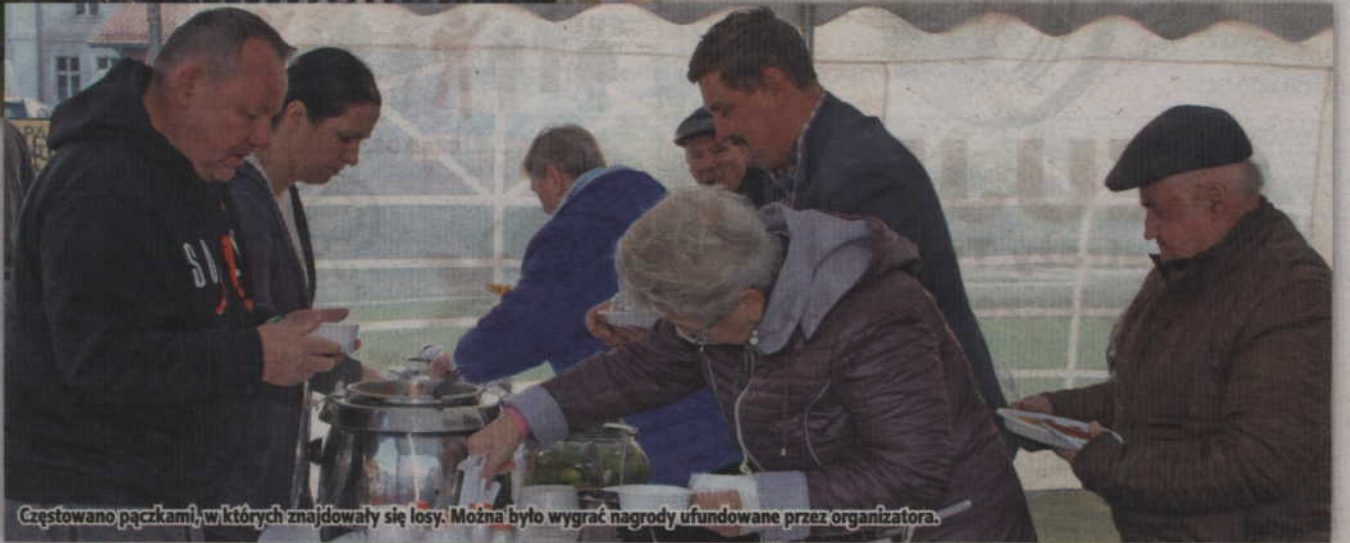
Częstowano pączkami, w których znajdowały się losy. Można było wygrać nagrody ufundowane przez organizatora.