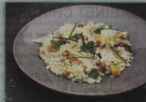
Kasza pęczak była niegdyś bardziej popularna i częściej gościła na naszych stołach. Obecnie powoli wraca do łask, a potraw i możliwości związanych z jej wykorzystaniem jest mnóstwo.

Prezentacja: kaszę wykładamy na gorący, najlepiej głęboki talerz i posypujemy szczypiorkiem.