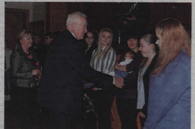
Najlepszym absolwentom i uczniom szkół średnich w najbliższy piątek zostaną wręczone Stypendia Starosty Kwidzińskiego.

- Kryteria, które decydują o przyznaniu stypendium są trudne do spełnienia, ale mimo tego liczba stypendystów wcale się nie zmniejsza. Nawet kiedyś zaostrzyliśmy kryteria. Obawialiśmy się wtedy, że trudno będzie je spełnić. Okazuje się jednak, że młodzież i tak je spełniała. Mamy coraz lepiej wykształconą młodzież. Wynika to także z wysokiego poziomu kształcenia w naszych szkołach o czym świadczą bardzo dobre wyniki osiągane co roku przez nasze placówki - podkreśla Jerzy Godzik.