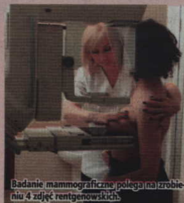
Badanie mammograficzne polega na zrobieniu 4 zdjęć rentgenowskich.

Jeśli w piersi nie ma podejrzanych zmian - wynik jest krótką informacją o braku takich zmian i zaproszeniem na następne badania mammograficzne za 2 lata lub za 12 miesięcy. Jeśli badanie budzi wątpliwości lekarzy - wynik jest informacją o konieczności dalszej diagnostyki, zawiera opis zmiany wraz ze skierowaniem na badania uzupełniające i listę ośrodków, w których można je wykonać.