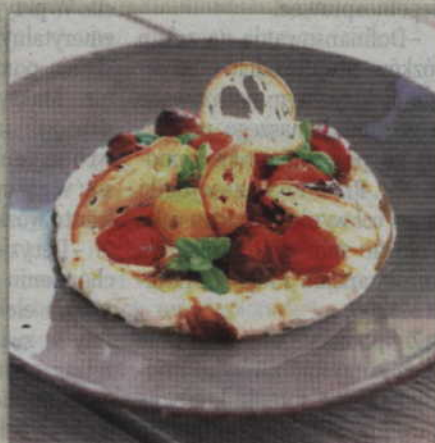
Jogurt grecki jest gęsty i mniej kwaśny to ciekawa alternatywa dla osób nie lubiących smaku tradycyjnego jogurtu.

600 g pomidorków koktajlowych, 1 szt. papryki pepperoni 5 ząbki czosnku, 1 łyżeczka kminu rzymskiego, 1 łyżeczka cukru brązowego, 6 gałązek świeżego tymianku, 6 gałązek oregano, 10 szt. liści bazylii, olej rzepakowy, 600 g jogurtu gęstego typu greckiego, 2 pęczki natki pietruszki, 1 łyżeczka papryki wędzonej, Sól,