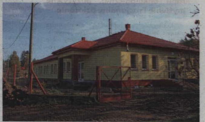
Stan budowy Centrum Integracji i Rehabilitacji Osób Niepełnosprawnych wraz z Warsztatem Terapii Zajęciowej z końca października bieżącego roku.

Dotacja celowa samorządu powiatu na budowę centrum to ponad 850 tys. zł. W budżecie powiatu na 2019 roku zaplanowana była kwota 713 tys. zł. Aby umożliwić rozpoczęcie inwestycji kwota pomocy dla gminy Ryjewo została zwiększona o ponad 145 tys. zł. Centrum Integracji i Rehabilitacji Osób Niepełnosprawnych wraz z Warsztatem Terapii Za-