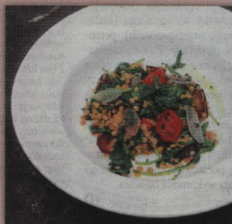
Czerwona soczewica nie tylko dobrze wygląda, ale i smakuje. Jest idealna do sałatek, farszy i zup.

Chwilę przed końcem gotowania dodaj szpinak i wymieszaj. Szpinak niemal od razu straci na objętości. Zdejmij patelnię z ognia.