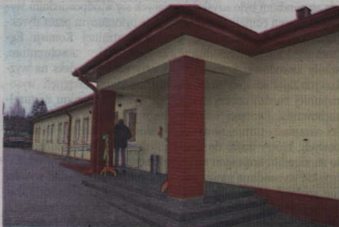
Budynek powstał dzięki dotacji Państwowego Funduszu Rehabilitacji Osób Niepełnosprawnych w wysokości 690 tys. zł i starostwa powiatowego w wysokości 859 tys. zł, a także udziale gminy Ryjewo.