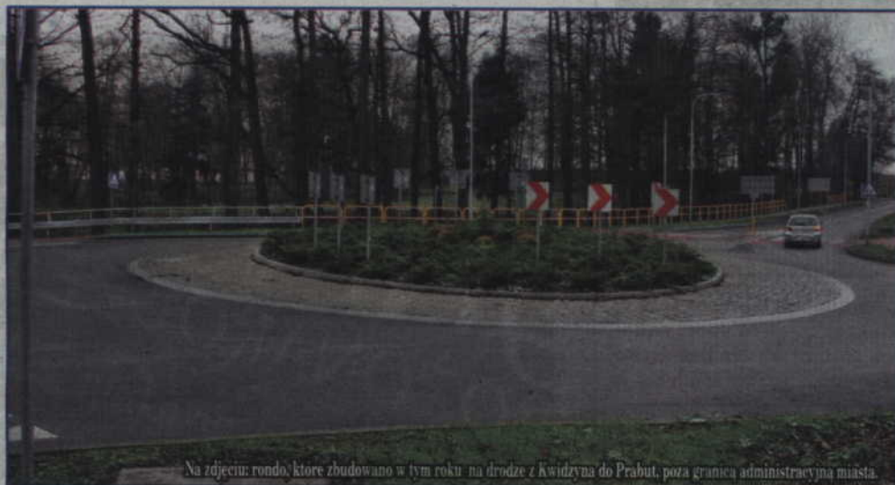
Na zdjęciu: rondo, które zbudowano w tym roku na drodze z Kwidzyna do Prabut, poza granicą administracyjną miasta.

- Planowano przebudowę skrzyżowania w taki