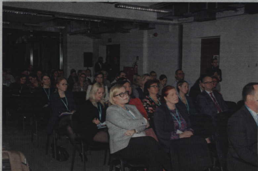
„Edukacja i biznes – kluczowe partnerstwo” - pod takim hasłem w Kwidzyńskim Parku Przemysłowo-Technologicznym w Górkach, w gminie Kwidzyn, odbyła konferencja z udziałem przedsiębiorców, dyrektorów szkół i przedstawicieli samorządów.