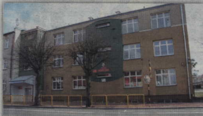
W siedzibie Powiatowego Centrum Pomocy Rodzinie przy ul. Hallera 5 w Kwidzynie powstanie winda, która umożliwi osobom niepełnosprawnym dotarcie na wyższe kondygnacje.

POWIAT. W siedzibie Powiatowego Centrum Pomocy Rodzinie przy ul. Hallera 5 w Kwidzynie powstanie winda, która umożliwi osobom niepełnosprawnym dotarcie na wyższe kondygnacje. Inwestycja w ramach której dostosowane dla osób niepełnosprawnych zostaną także pomieszczenia sanitarne ma zostać zrealizowana w tym roku.