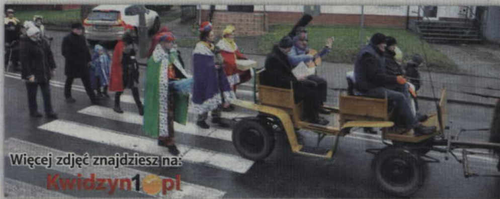
Więcej zdjęć znajdziesz na: Kwidzyn1.pl