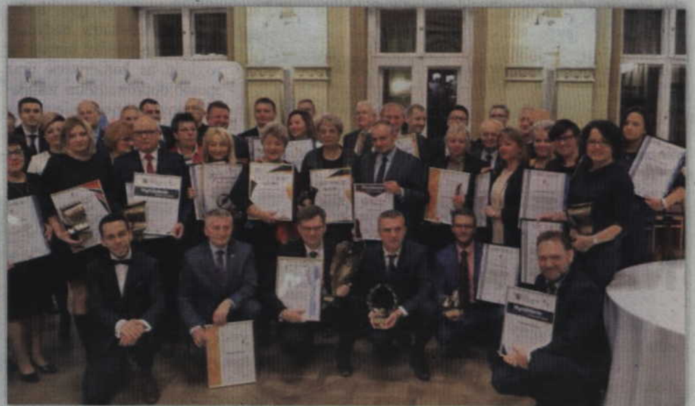
Już po raz szósty powiat kwidzyński uzyskał tytuł Samorządowego Lidera Edukacji za szczególne osiągnięcia w dziedzinie rozwoju edukacji i systemu oświaty, a także podnoszenie jakości działań samorządów w sferze lokalnej polityki edukacyjnej.

Według organizatorów konkursu przyznanie certyfikatu