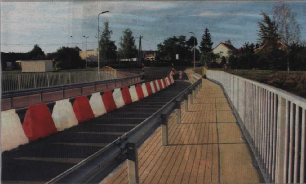
Rozpoczną się odbiory techniczne nowego umocnienia skarpy oraz wykonania odwodnienia wiaduktu na ulicy Owczej.