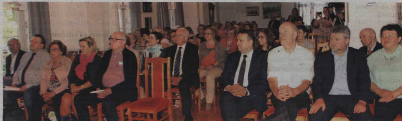
Samorząd powiatu współpracuje w zakresie pomocy osobom starszym z Powiatową Radą Seniorów oraz samorządem partnerskiego powiatu Osterholz w Niemczech. W maju ubiegłego roku podczas międzynarodowej konferencji omawiano między innymi rozwiązania dotyczące opieki nad seniorami stosowane w Niemczech.