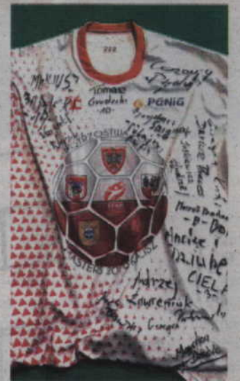
z podpisanymi zawodników MMTS Kwidzyn. opr. IL

Aukcja trwa nadal na stronie internetowej aukcji na Allegro - na stronie WOŚP Kwidzyn. Można jeszcze wylicytować m.in.: koszulkę Mistrzów Polski Masters Kwidzyn z autografami i koszulkę