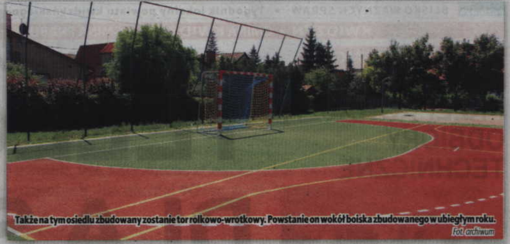
Także na tym osiedlu zbudowany zostanie tor rolkowo-wrotkowy. Powstanie on wokół boiska zbudowanego w ubiegłym roku.