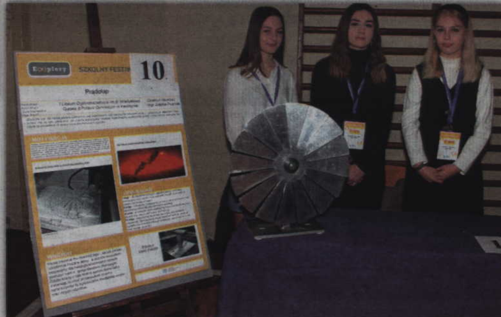
Festiwal został zorganizowany we współpracy z Fundacją Zaawansowanych Technologii w Warszawie. Na zdjęciu: wszyscy uczestnicy festiwalu.

KWIDZYN. Ponad trzydziestu uczniów ze szkół powiatu kwidzińskiego zaprezentowało swoje projekty podczas Szkolnego Festiwalu Nauki E(x)plory. Impreza odbyła się w I Liceum Ogólnokształcącym w Kwidzynie. Festiwal został zorganizowany we współpracy z Fundacją Zaawansowanych Technologii w Warszawie. Jego celem jest umożliwienie szkolnym pasjonatom nauki rozwijanie swoich zainteresowań, konfrontacja pomysłów z przedstawicielami świata nauki oraz zdobycie doświadczenia w prezentowaniu autorskich projektów naukowo-badawczych.