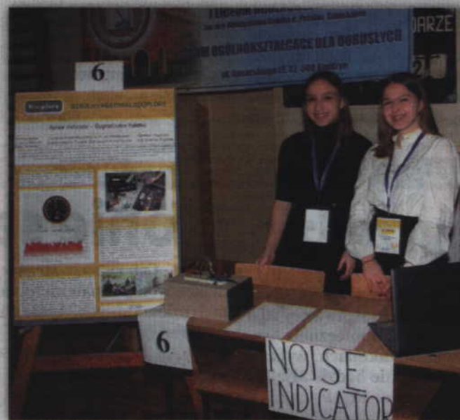
W festiwalu wzięło udział 36 uczniów, którzy zaprezentowali 16 projektów naukowych.