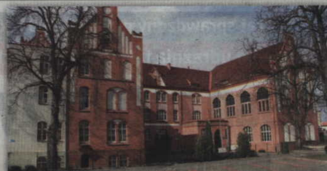
Oddział przedszkolny przy Szkole Podstawowej nr 5 przy ul. Hallera to zupełnie nowa propozycja samorządu miasta na nowy rok szkolny.

lista kandydatów zakwalifikowanych i lista kandydatów, którzy nie zostaną zakwalifikowani. Zakładamy jednak, że tych niezakwalifikowanych po prostu nie będzie ponieważ otwierając cztery nowe oddziały w naszym systemie przedszkolnym jesteśmy w stanie zaspokoić potrzeby wszystkich