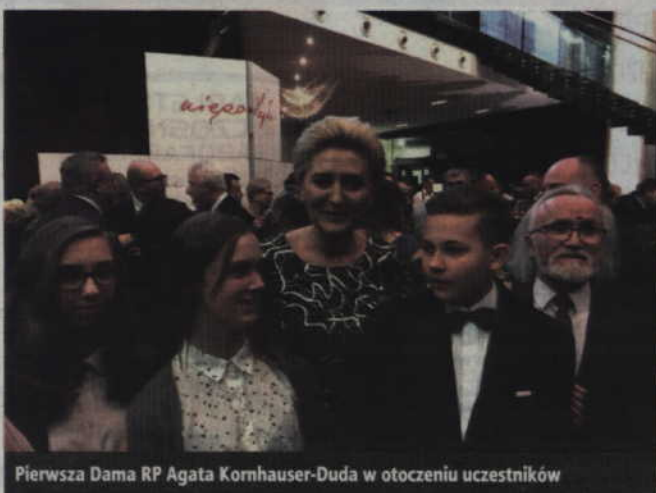
Pierwsza Dama RP Agata Kornhauser-Duda w otoczeniu uczestników

(info: Prezydent.pl , foto: Jakub Szymczuk/KPRP , portalpomorza.pl )