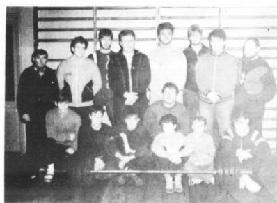
Drużyna LKS Nadwiślanin walcząca o wejście do II ligi.

Sklep zaprasza od 10.00 - 18.00 oraz we wszystkie soboty od 10.00 - 16.00