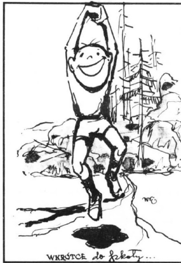
WKRÓTCZE do fakty...