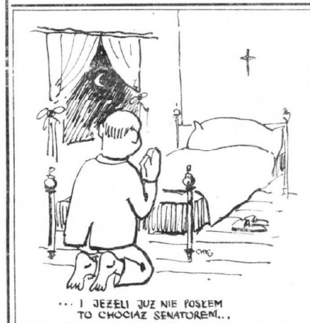
... I JEŻELI JUŻ NIE POSEGM TO CHOCIAZ SENATOREM...

W słonecznych promieniach mieszczą się promienie ciepłe, świetne i pozafioletowe. Opaleniznę zawiązcujemy nadfioletowym, natomiast podczerwone, które wywołują działanie ciepłe, mogą być przyczyną udaru ciepłego.