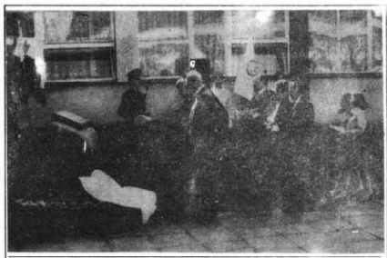
Moment złożenia kwiatów pod tablicą "Jędrusów"