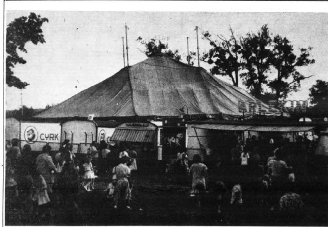
Cyrk "Arlekin" w Kwidzynie