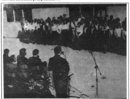
Inauguracja roku szkolnego w II LO w Kwidzynie