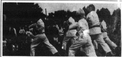
KARATECY Z RUMII