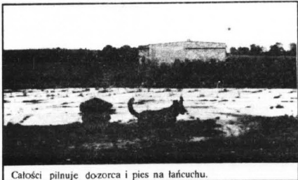
Całości pilnuje dozorca i pies na łańcuchu.