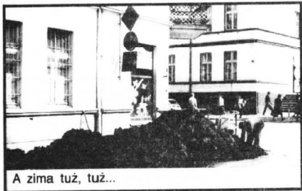
A zima tuż, tuż...

- koks hutniczy drobny - 1170 tys zł/tona - węgiew koksowniczy kostka I - 750 tys/tona - węgiew koksowniczy orzech II - 600 tys zł/tona - węgiew koksowniczy orzech I - 710 tys zł/tona Sprzedawcy oferują również transport. Opał składowany jest na płytach betonowych, dlatego praktycznie pozbawiony jest dodatkowych zanieczyszczeń. Ważne! Ceny wyjściowe w kopalni wznoszą się co miesiąc o 10%. Dane z dnia 17 października. R.S.