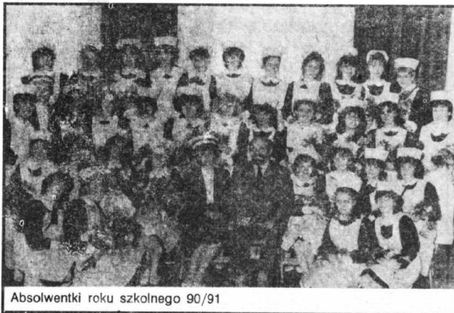
Absolwentki roku szkolnego 90/91

Trochę statystyki. W okresie od września 1976r. do września 1991r. do Liceum Medycznego w Kwidzynie zostało przyjętych 888 uczniów. Obecnie w szkole naukę kontynuuje 227 uczniów od klas pierwszych do piątej. Liceum ukończyło 460 absolwentek, w tym egzamin dojrzałości złożyło 284, świadectwo ukończenia otrzymało 176 absolwentek, 121 uczennic opuściło naszą szkołę z różnych powodów. Większość absolwentek znalazła zatrudnienie w Kwidzynie w placówkach zamkniętej i otwartej służby zdrowia, pomocy doraźnej oraz w sanatoriach w Prabutach. Kilka absolwentek kontynuuje naukę na studiach wyższych na różnych wydziałach np. matematyki, ochronie środowiska. Kilkanaście wyjechało z Polski. Obecnie 26 absolwentek zarejestrowanych jest jako bezrobotne. 14 z nich pobiera zasiłek z Rejonowego Biura Pracy.