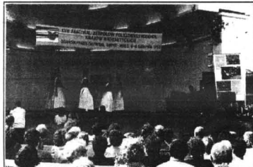
Stopień zawodowstwa niektórych zespołów wprost zadziwiał.

grupa starsza (mniej więcej w wieku od 14 do 20 lat), w drugim, gdzie wolego miejsca było jeszcze mniej - młodsza, w której trafiły się i siedmiolatk. Z powodów czysto technicznych dołączyłam do starszej grupy. Podróż okazała się nieco zbyt długotrwała i męcząca (czego w późniejszym czasie dane nam było jeszcze wielokrotnie doś-