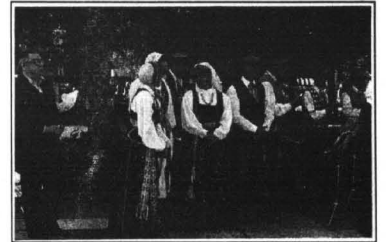
Barwnym strojem można się było przypatrywać bez końca.