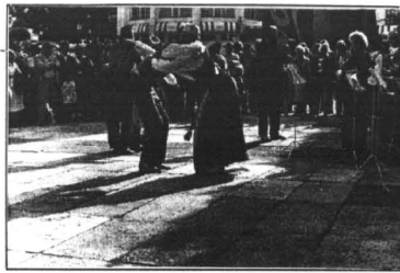
W Sopocie brakowało miejsca przed Muszlą koncertową. Tymu zadowolili się przedstawieniem "na chodniku".

Poza częścią oficjalną, tą rozgrywaną na scenie, istniała oczywiście i ta druga strona medalu... O uciążliwym i problemowym poruszaniu się po Trójmieście i jego okolicach już pisałam. Wspomnieć należy również o kilkakrotnym zmienianiu kostiumów w błyskawicznym tempie, w łańcuchach, w parkach, w autobusach). Bardzo miłym momentem, który zwróciła uwagę wśród młodszej grupy wywołał wiele emocji, było spotkanie "Powiśla" z sopockim Batmanem. Dziwny wehikuł bohatera filmów i komiksów, jak i on sam, do tego stopnia zainteresował dzieci, że nieruszający występ w Sopockiej Muszli Kon-