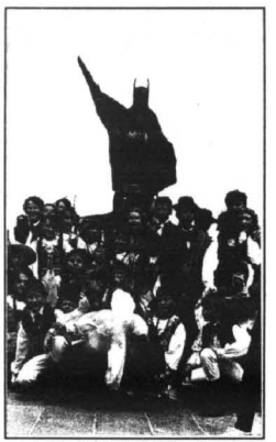
"Batman" i "Powiśle" - tuż przed występem na sopockim molo.

Tegoroczny festiwal zakończył się rozdaniem dyplomów wszystkim uczestniczącym w nim zespołom - nie było podziału na miejsce i punkty. Wiele serdecznej, przyjaznej miłe wrażenie zarówno wśród publiczności jak i występujących. Dla nas największym wyróżnieniem były słowa wspaniale prowadzącego konferansjerkę Kaszuba: "Mamy kolejne, młode pokolenie - wspaniałą młodzież, która gwarantuje przyszłość naszemu festiwalowi".