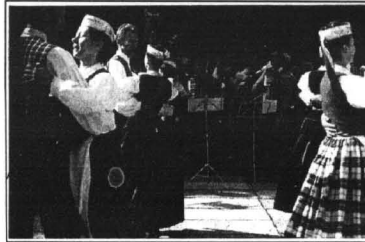
Zespół z Litwy spotkał się z bardzo życzliwymi reakcjami publiczności.

barkach ciężła nie tylko odpowiedzialność za podopiecznych, ale też wiele innych obowiązków. Już w pierwszy dzień festiwalu (6 sierpnia), zaledwie kilka godzin po przyjeździe (dokładniej zaś o 18.00), "Powiśle" stawiło się musiało w Leśniczówce Borodziej, gdzie organizatorzy utworzyli spotkanie plenerowe wszystkich uczestników. W ma-