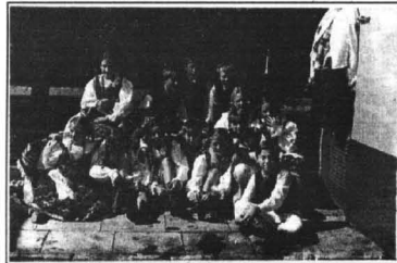
Część młodszej grupy "Powiśla" - już w kostiumach, w które przebrano się w autokarach.