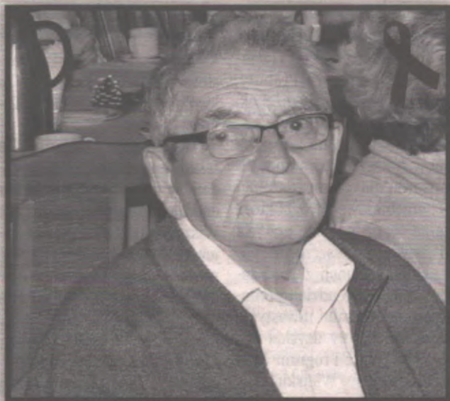
23 grudnia 2020 roku, w wieku 81 lat zmarł Jan Łomnicki.