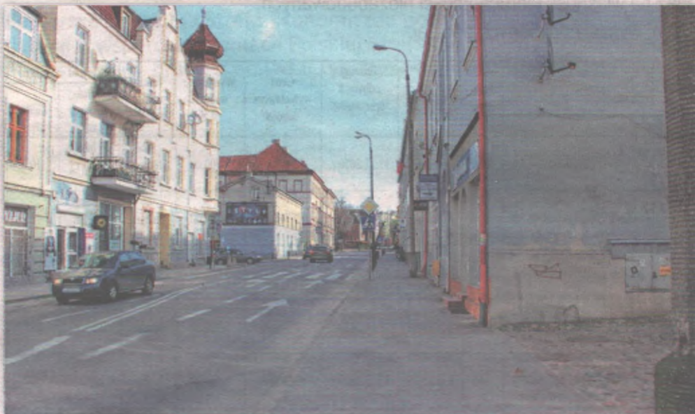
Samorząd Kwidzyna złożył wnioski o dofinansowanie trzech projektów w ramach Rządowego Funduszu Inwestycji Lokalnych. Jeden z nich dotyczy przebudowy ulicy Braterstwa Narodów.