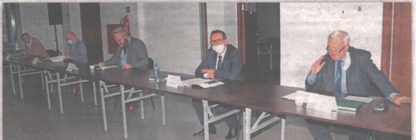
Wybór nastąpił podczas inauguracyjnego posiedzenia, które odbyło się w siedzibie Kwidzyńskiego parku Przemysłowo-Technologicznego w Górkach (gmina Kwidzyn).