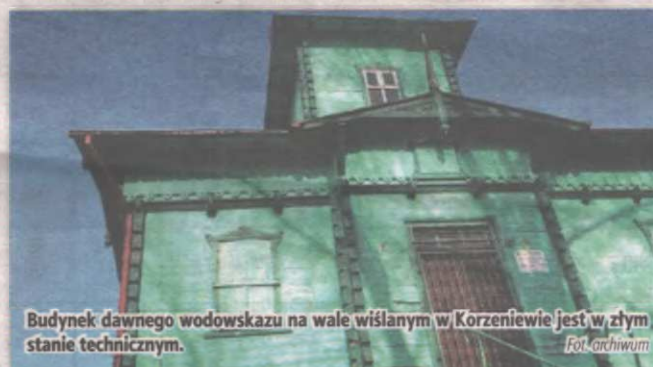
Budynek dawnego wodowskazu na wale wiślanym w Korzeniewie jest w złym stanie technicznym.

no okrągłą tarczę ze wskazówką pokazującą załogom holowników i barek płynących Wisłą aktualny stan wody. Wodowskaz ten przestał być używany w latach międzywojennych XX wieku. Obecnie budynek byłego wodowskazu służy mieszkańcom Korzeniewa