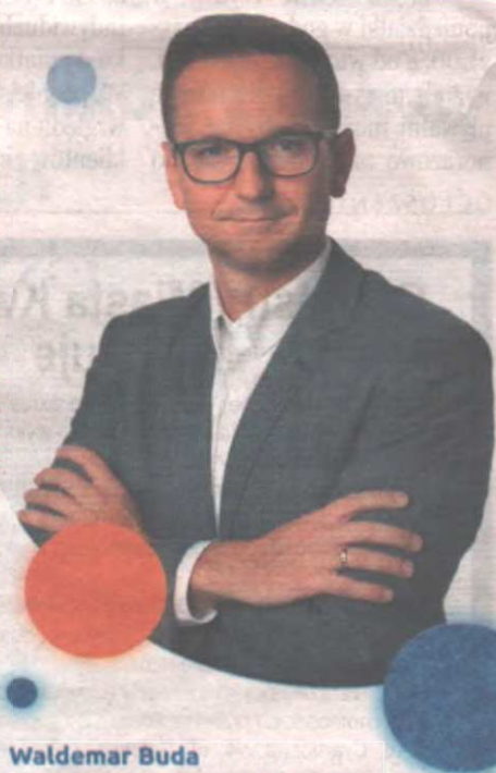
Waldemar Buda pełnomocnik rządu ds. PPP, sekretarz stanu w Ministerstwie Funduszy i Polityki Regionalnej