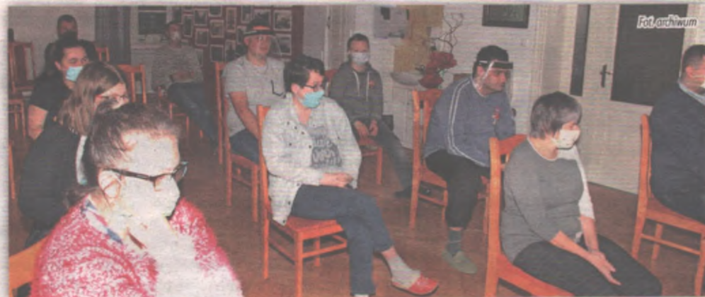
Państwowy Fundusz Rehabilitacji Osób Niepełnosprawnych podzielił już pieniądze na rehabilitację społeczną i zawodową. Nie wiadomo jaka będzie sytuacja związana z pandemią w tym roku i czy osoby niepełnosprawne będą mogły w pełni skorzystać z różnych form rehabilitacji w powiecie kwidzyńskim, w tym na rehabilitację prowadzoną w warsztatach terapii zajęciowej.